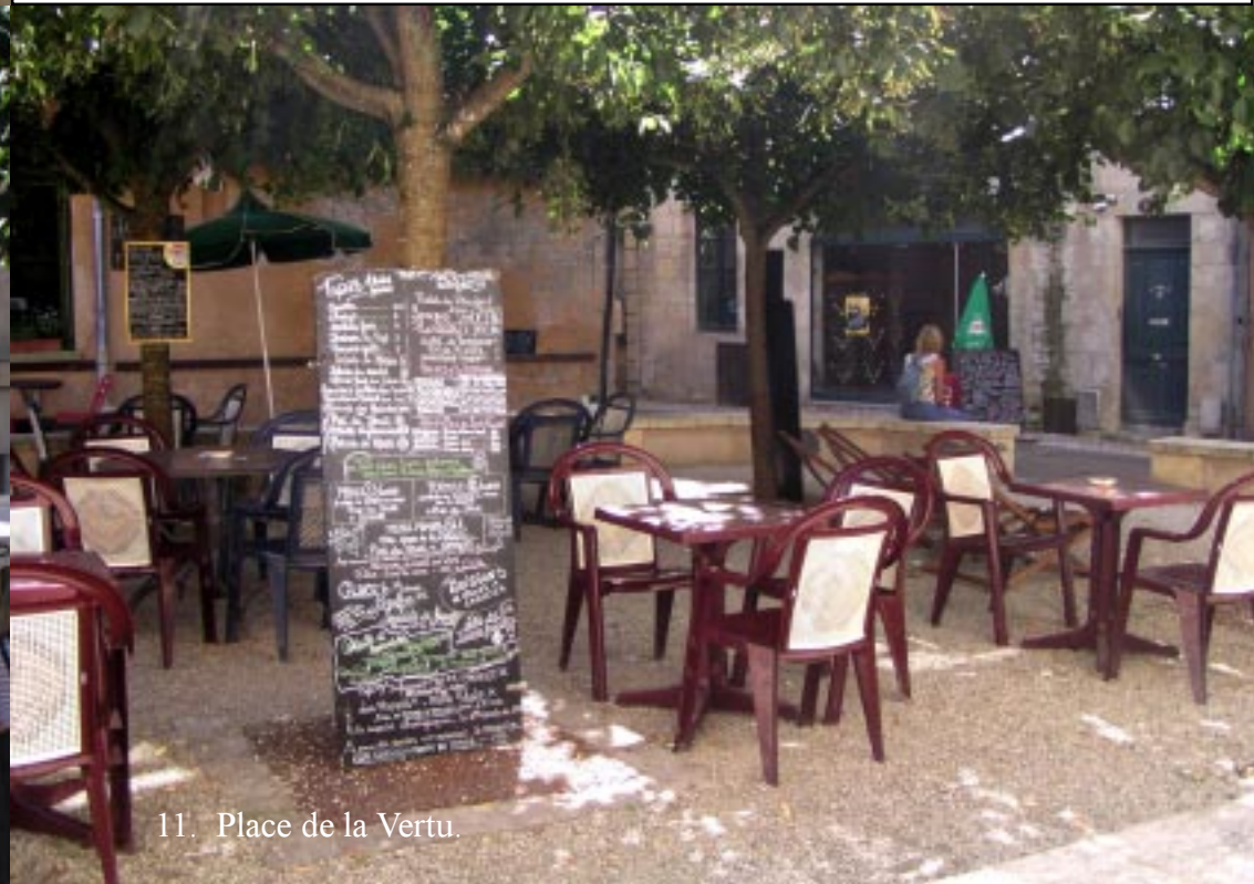
11. Place de la Vertu.