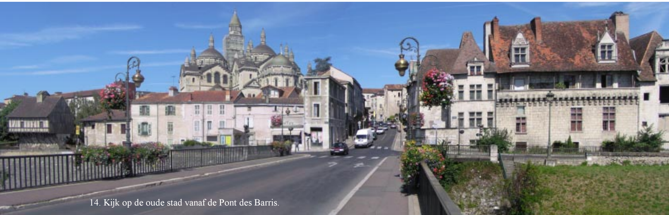
14. Kijk op de oude stad vanaf de Pont des Barris.