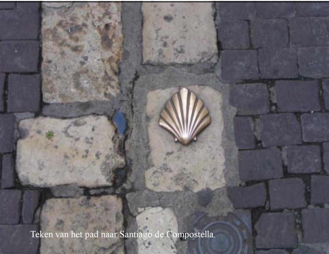
Teken van het pad naar Santiago de Compostella.

Klik hier om naar het verslag terug te gaan.