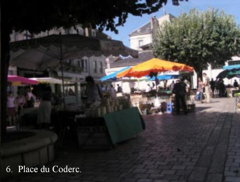
6. Place du Coderc.