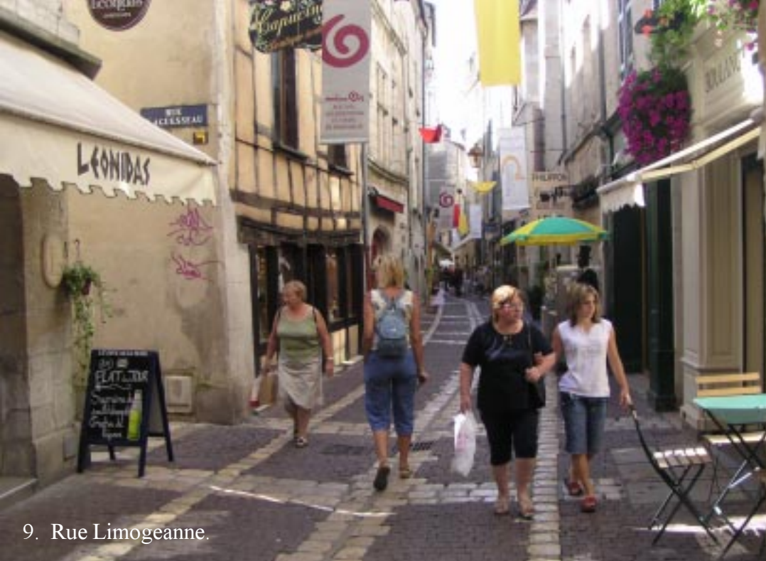
9. Rue Limogeanne.

Via een smalle doorgang over Place St. Silain naar Place St. Louis. Steeds zien we zeer idyllische plekjes.