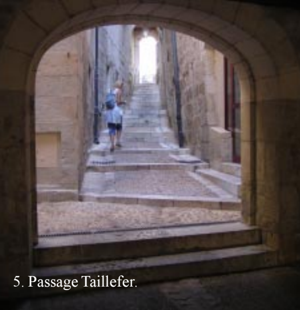
5. Passage Taillefer.