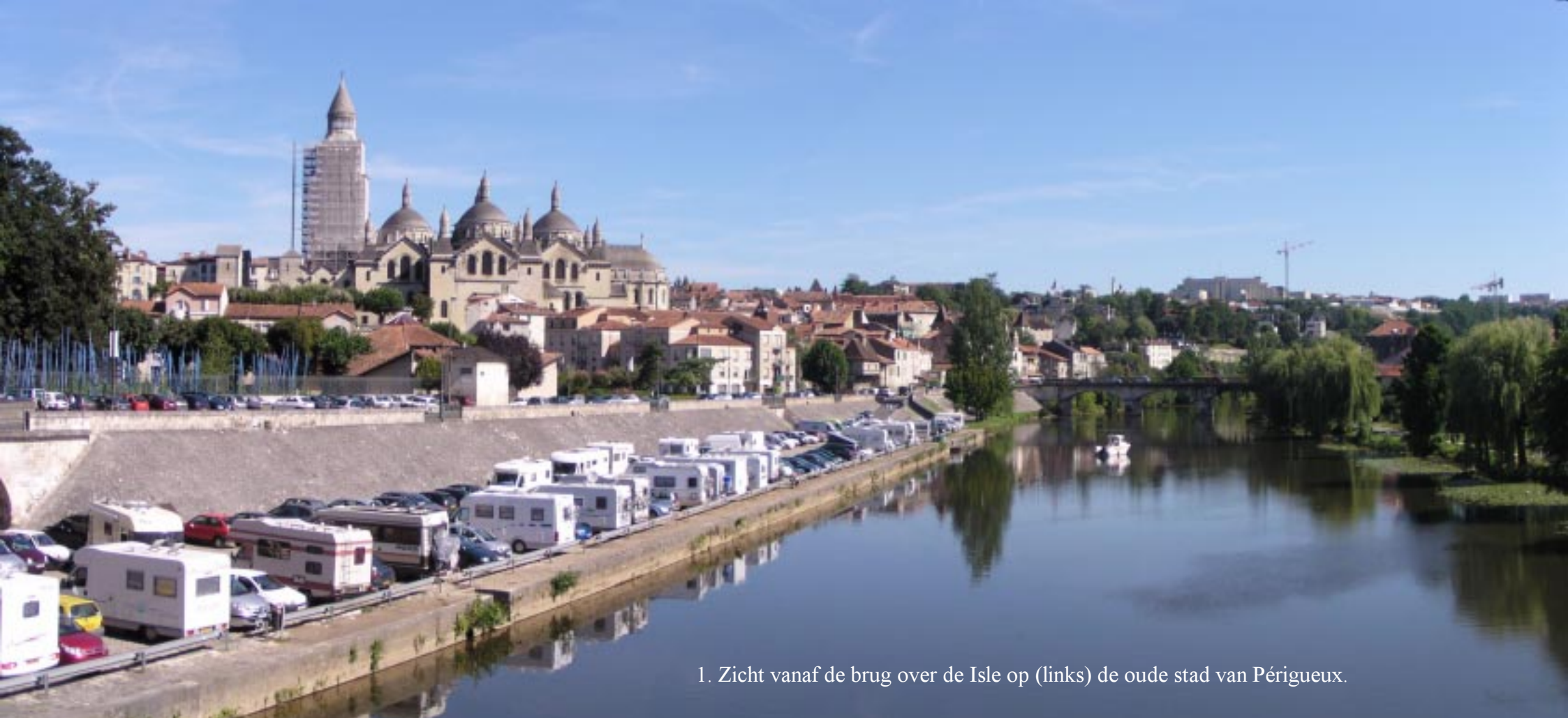
1. Zicht vanaf de brug over de Isle op (links) de oude stad van Périgueux.