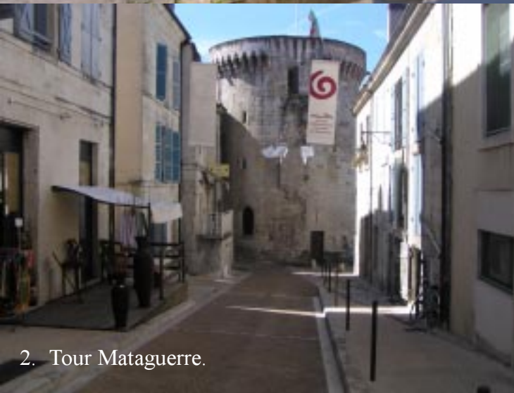
2. Tour Mataguerre.

De wandeling door Périgueux starten we dus vanaf de camperplaats onder aan de Isle, duiken onder een tunnel door en lopen dan eerst de brug op voor een panoramafoto van het centrum.