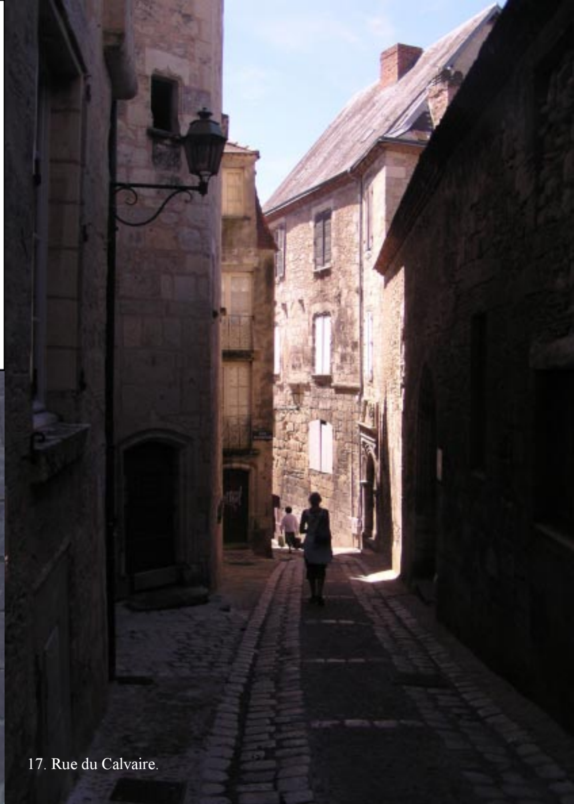
17. Rue du Calvaire.