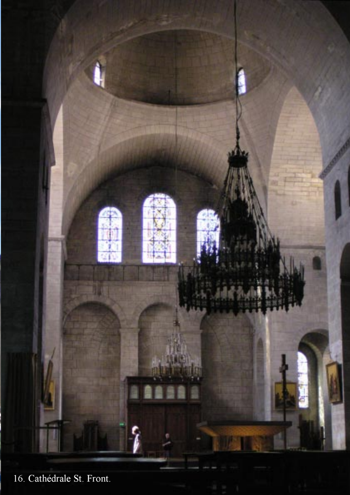
16. Cathédrale St. Front.