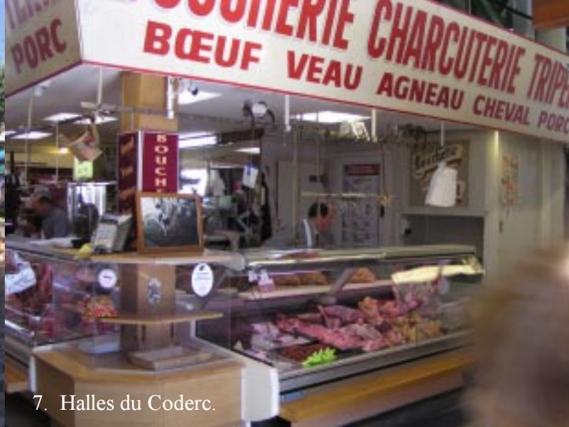
7. Halles du Coderc.