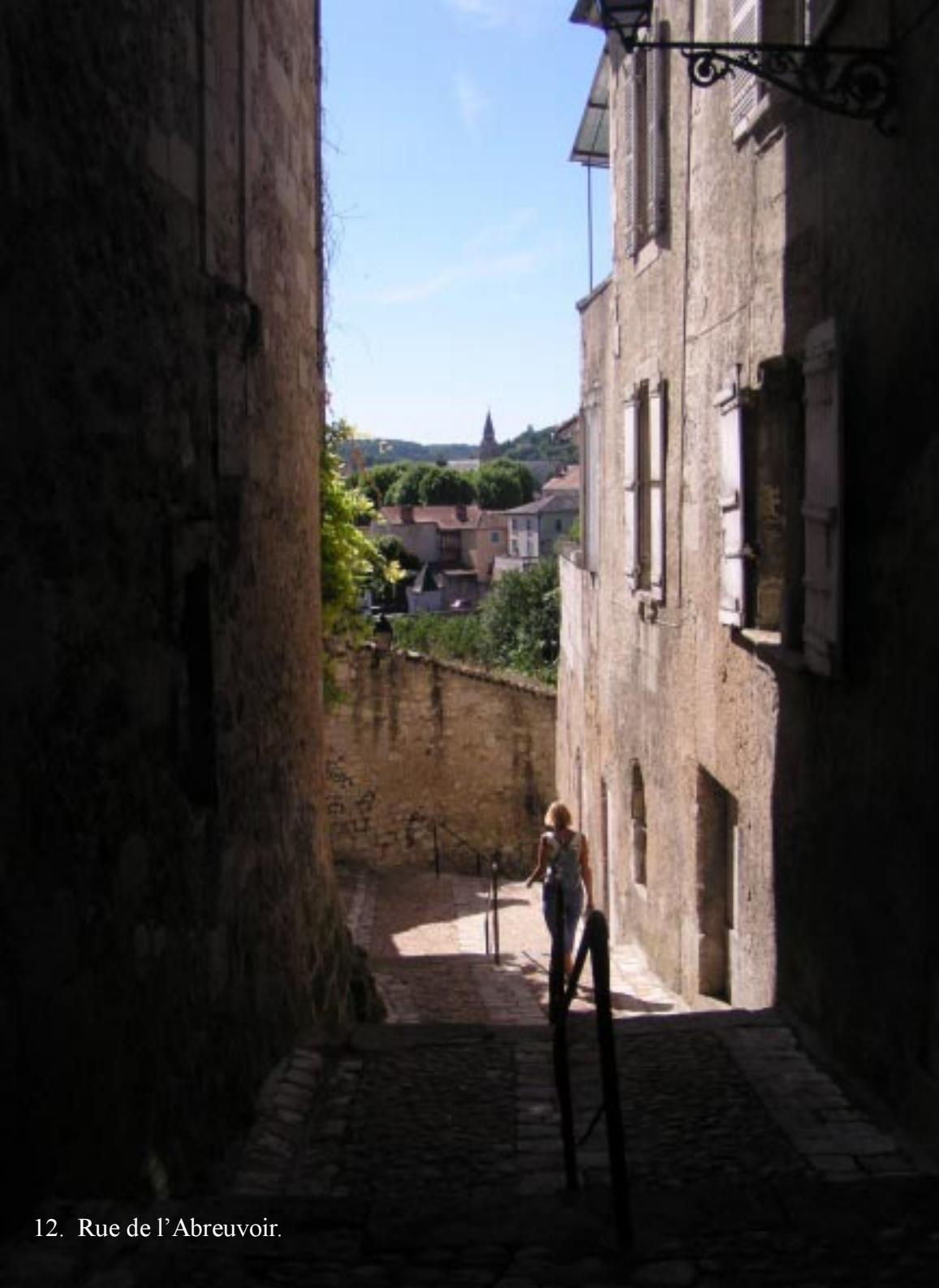
12. Rue de l'Abreuvoir.