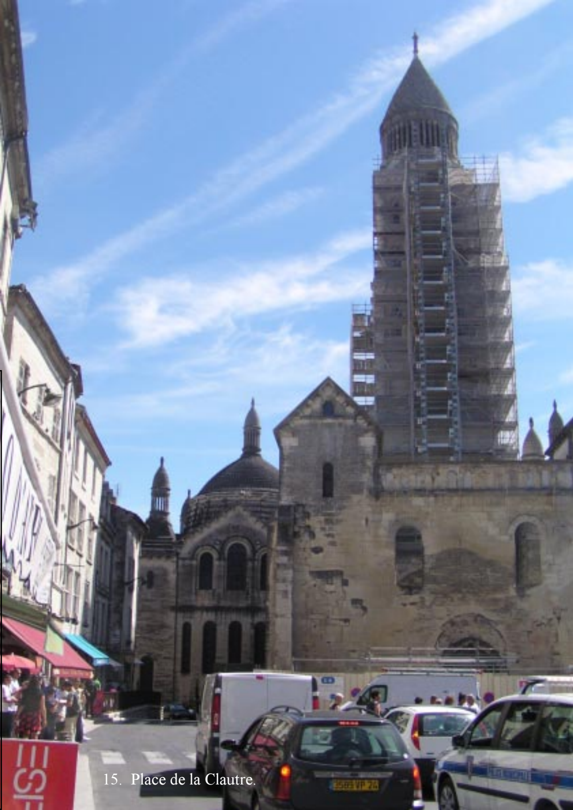
15. Place de la Clautre.