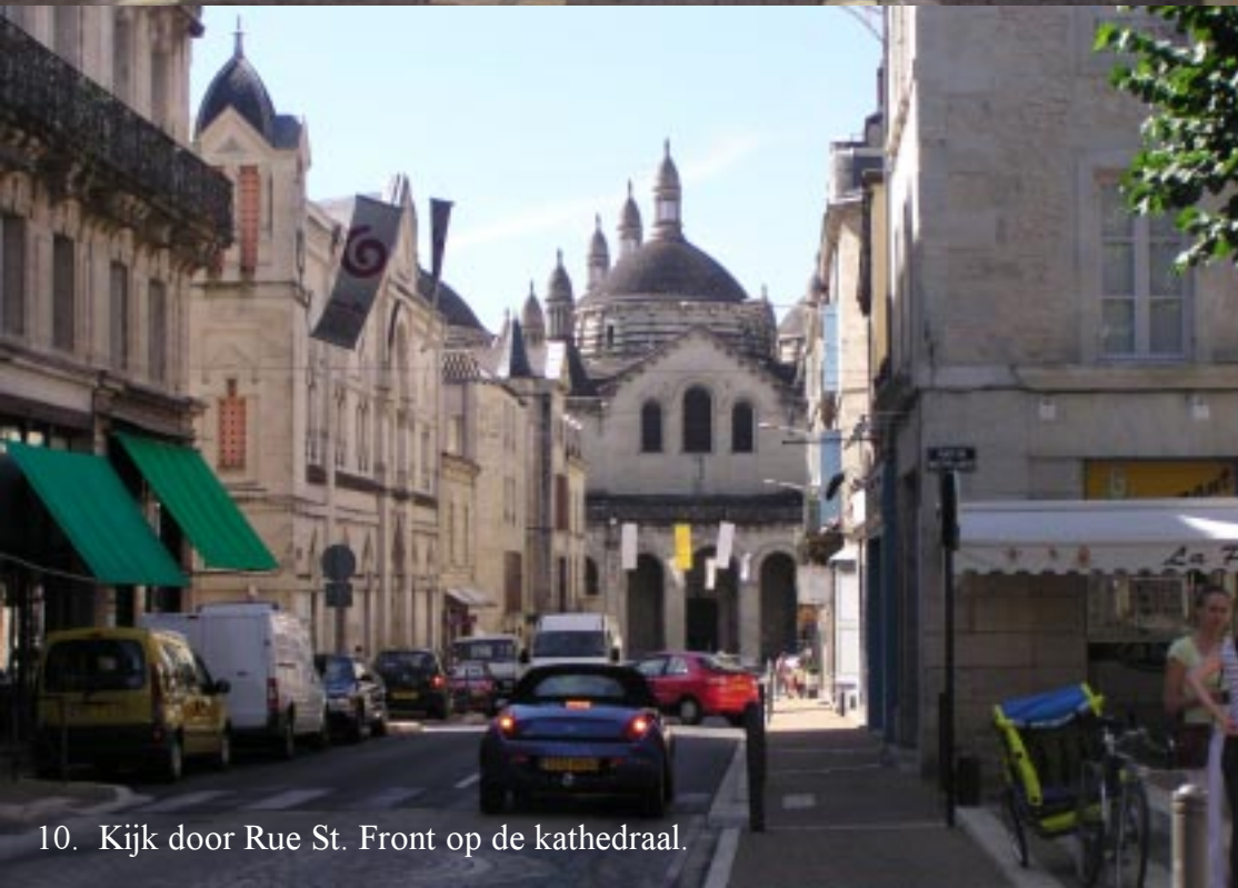
10. Kijk door Rue St. Front op de kathedraal.

Place de la Vertu heeft mooie lommerrijke terrasjes. Dan gaat het omlaag door enkele smalle stegen en trappentraatjes.