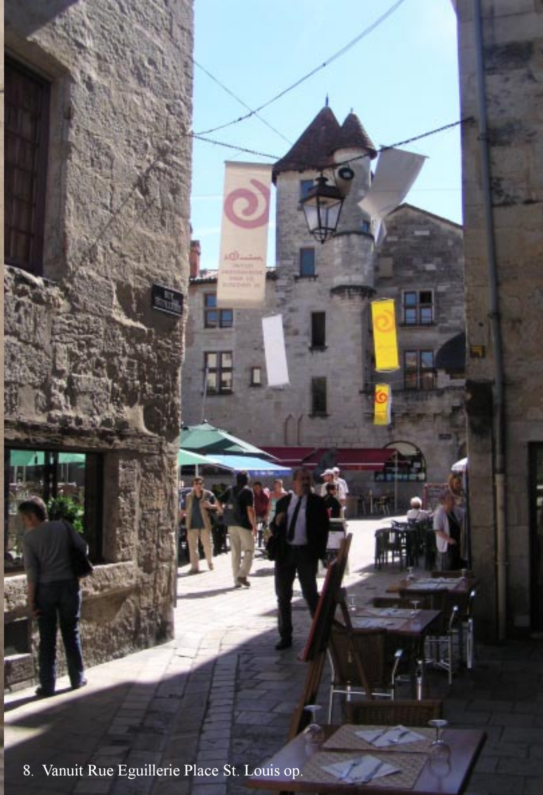
8. Vanuit Rue Eguillerie Place St. Louis op.