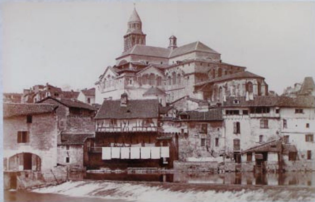
View of Saint-Front from the Fontaine de la Vierge (Bourges) before the development of the Pont des Barris

Omlaag lopen gedurende langere tijd betekent naar de Isle lopen. We lopen even de Pont des Barris op om via een restant van de oude vestingsmuur naar de kathedraal te gaan.