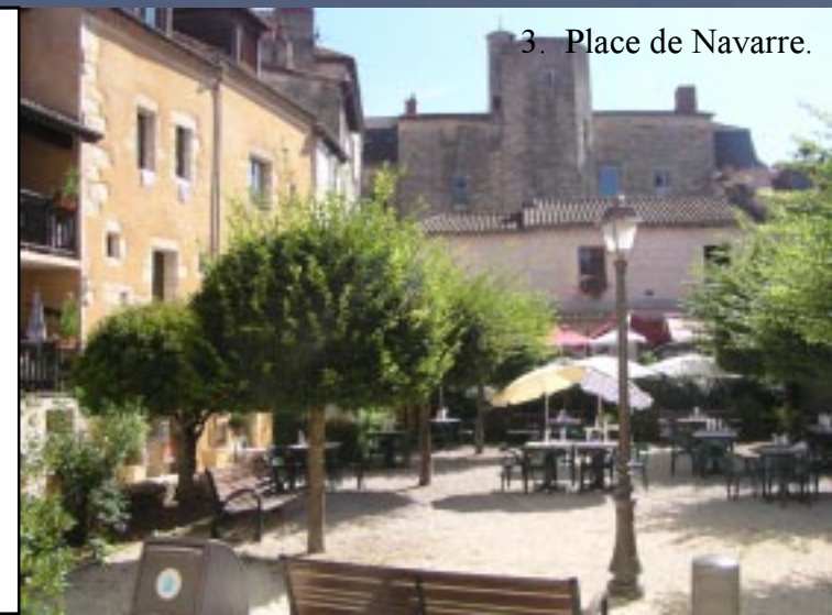
3. Place de Navarre.

Direct gaat het rechtsaf naar Place de Navarre, een intiem pleintje met terrasjes, die nu nog onbemand zijn.