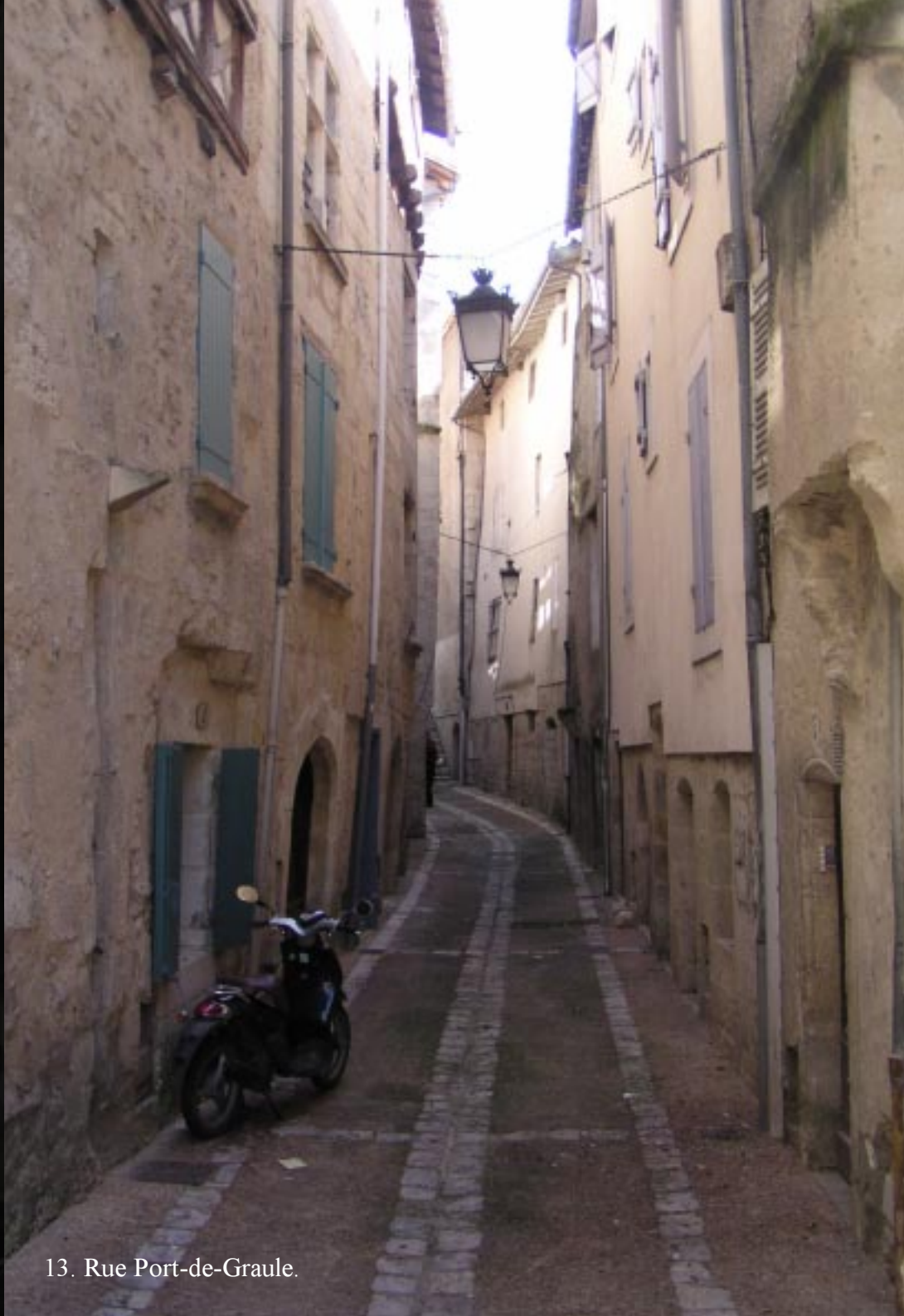
13. Rue Port-de-Graule.