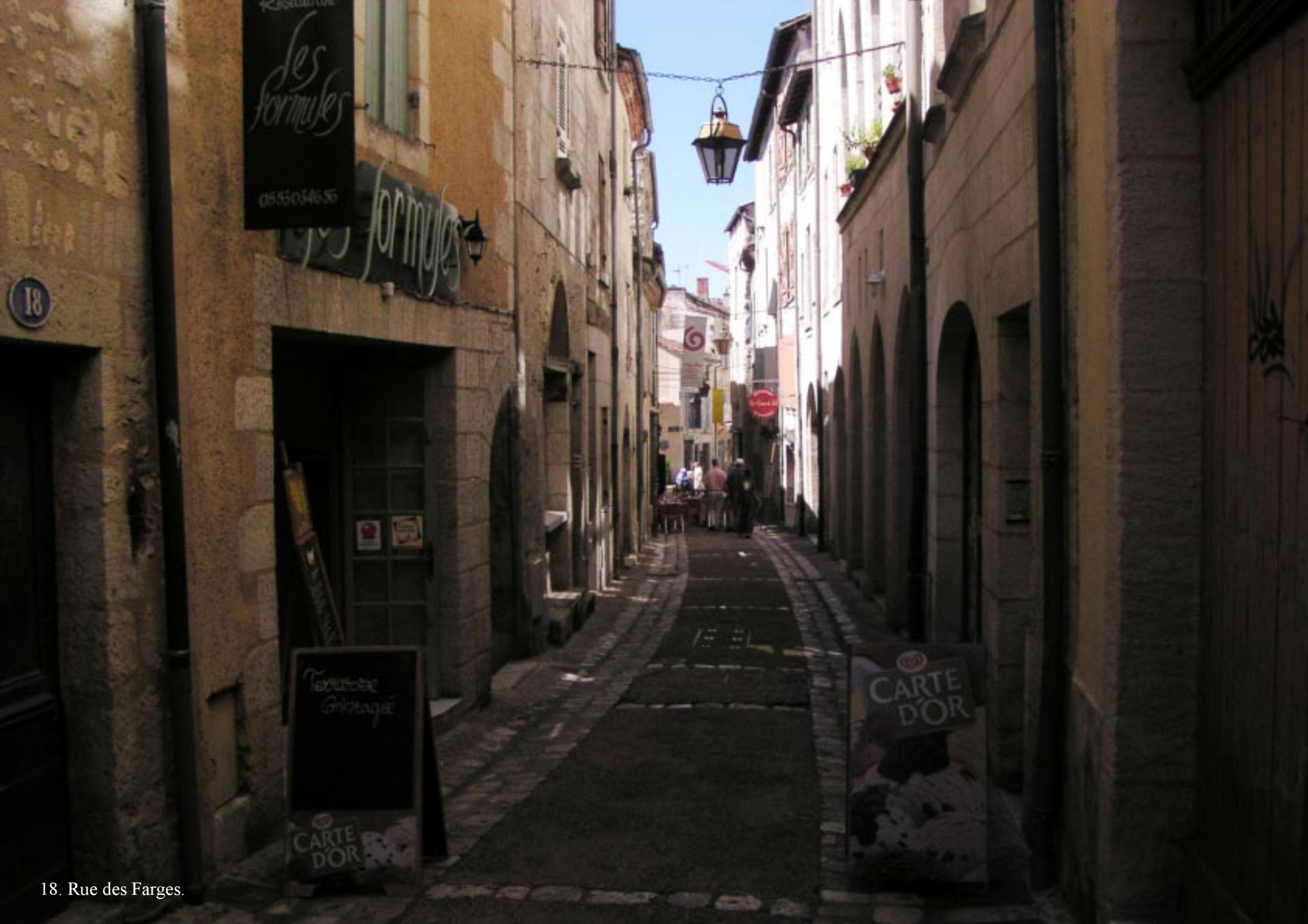
18. Rue des Farges.