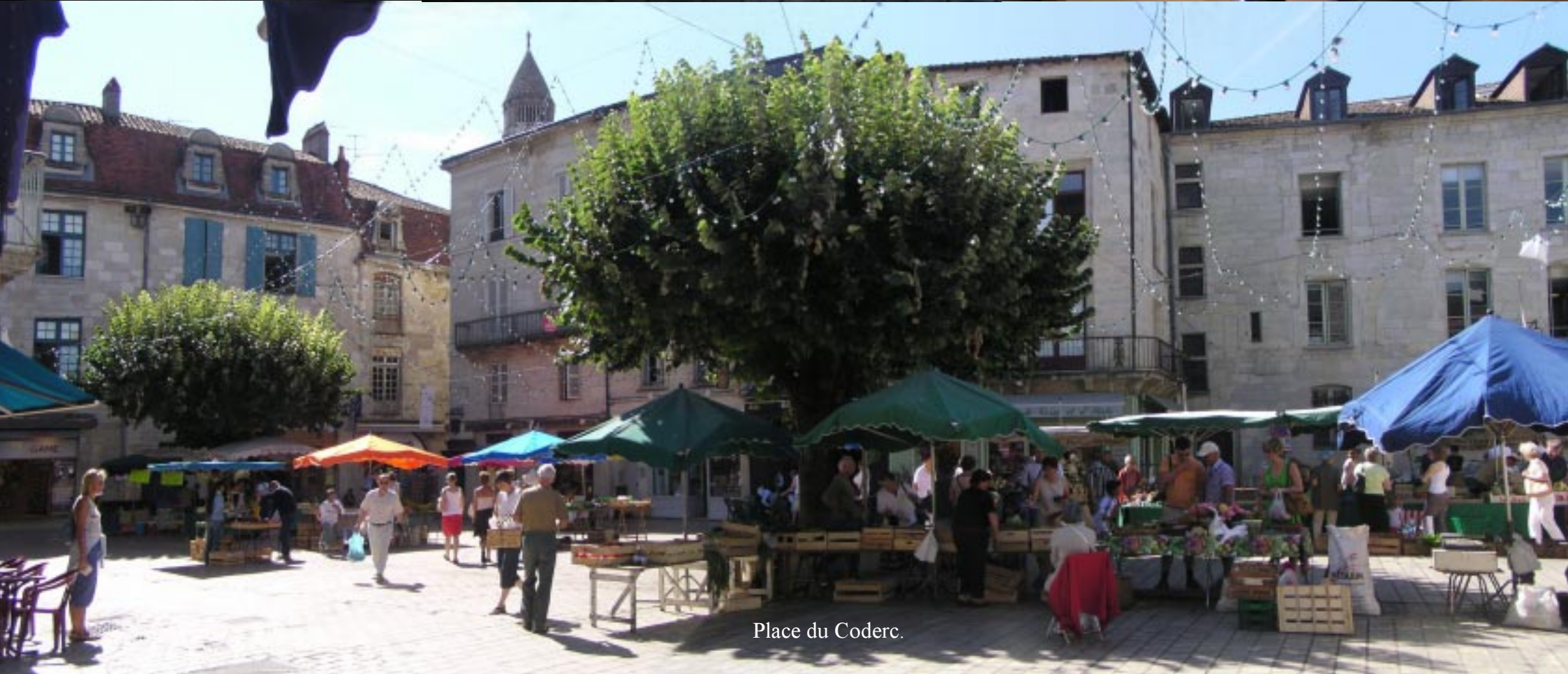
Place du Coderc.