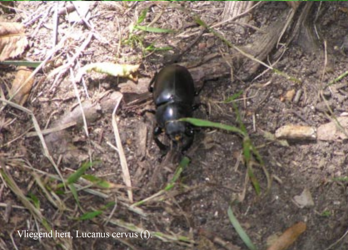
Vliegend hert, Lucanus cervus (f).