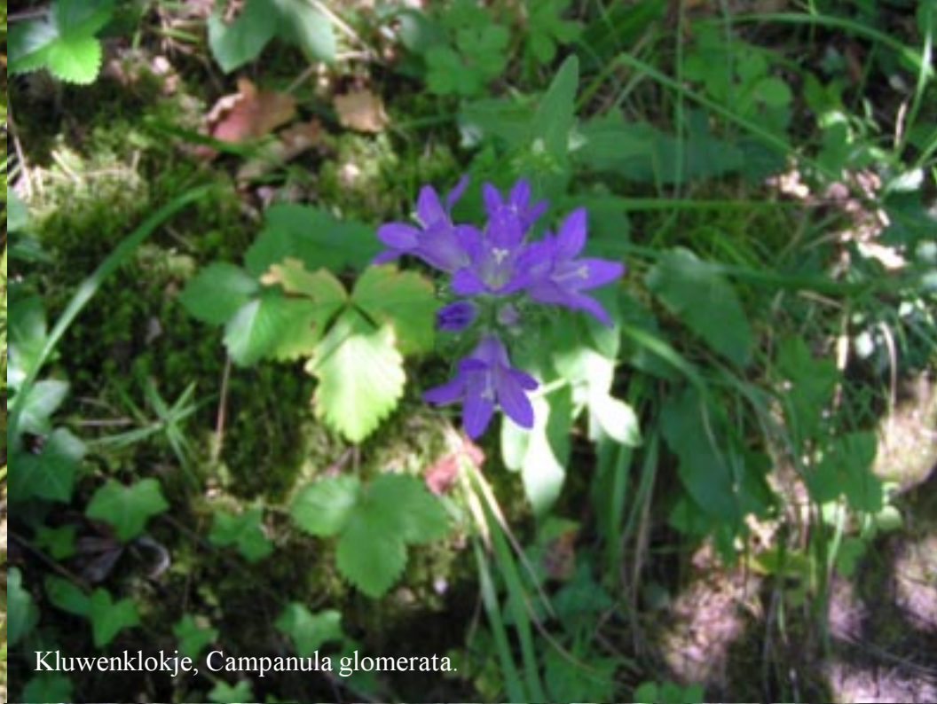
Kluwenklokje, Campanula glomerata .