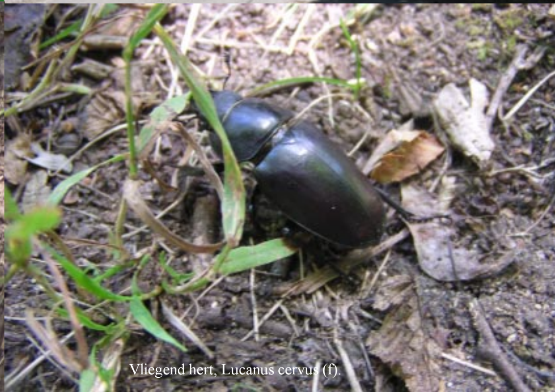
Vliegend hert, Lucanus cervus (f).