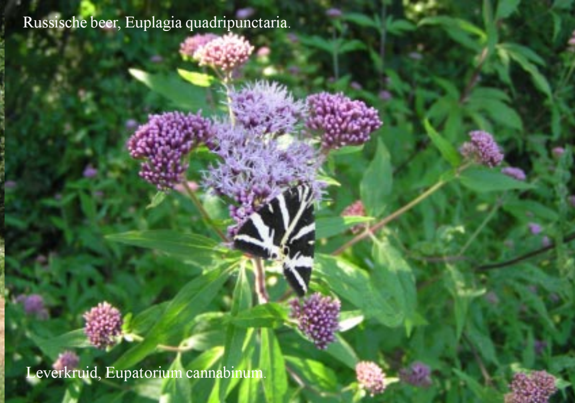
Russische beer, Euplagia quadripunctaria .