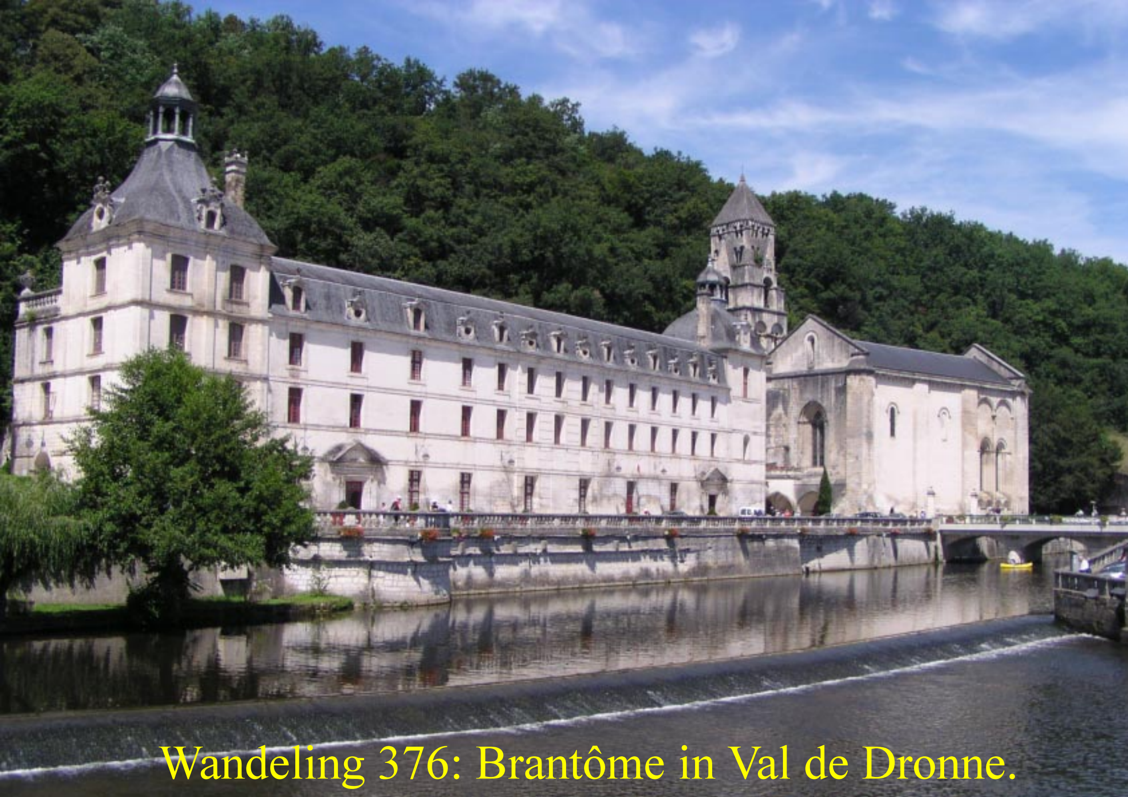
Wandeling 376: Brantôme in Val de Dronne.