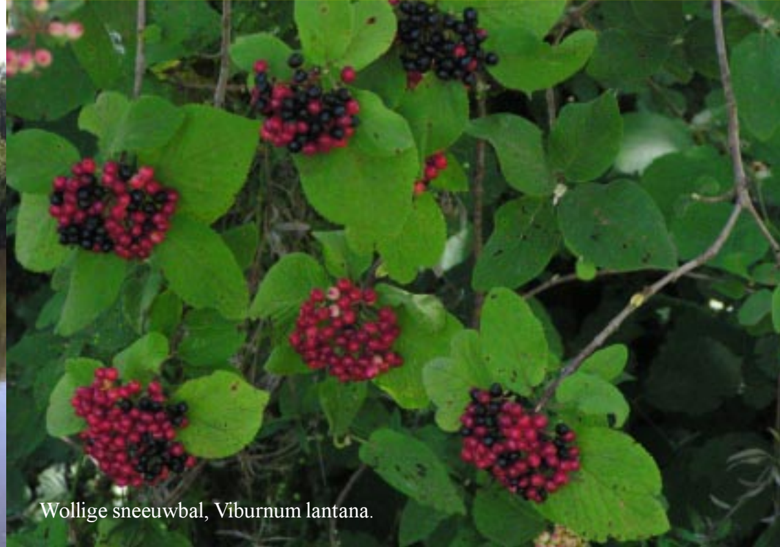
Wollige sneeuwbal, Viburnum lantana .