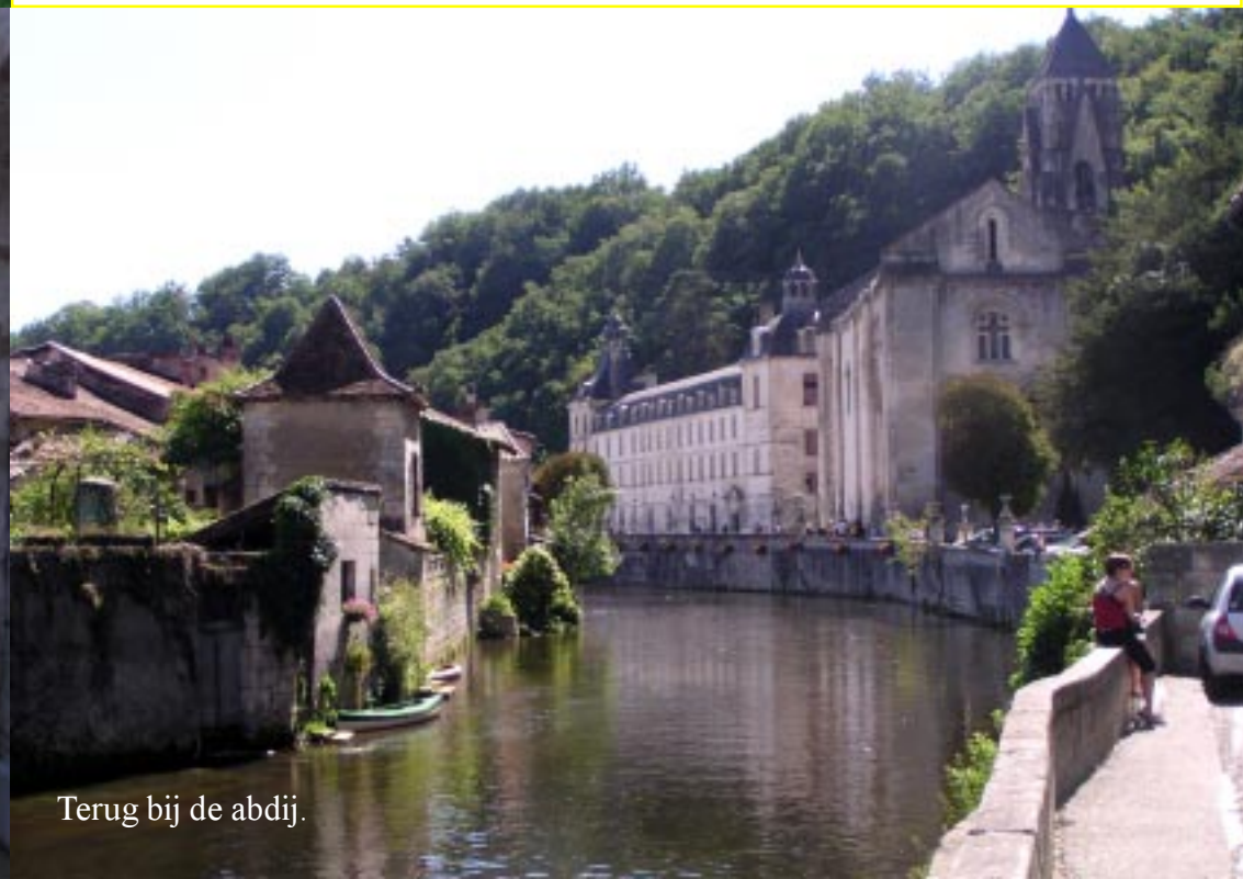
Terug bij de abdy.