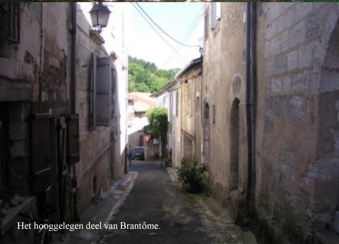
Het hooggelegen deel van Brantôme.

Om 16.30 lopen we de eerste steeg van Hoog-Brantôme in. Het gaat nu steil over een casseienweg het dal in. We komen aan de andere kant van de abdijs rivier uit. Huizen aan de overkant van het water hebben aan de achterdeur dikwijls een bootje of kano liggen. Mooi is zo iets.