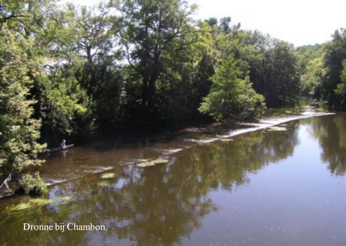
Dronne bij Chambon.

We zien drie langharige ezels in de wei. Een mijmerende jongeman in het gras en een beervlinder op de laatste 2 km naar Brantôme terug.