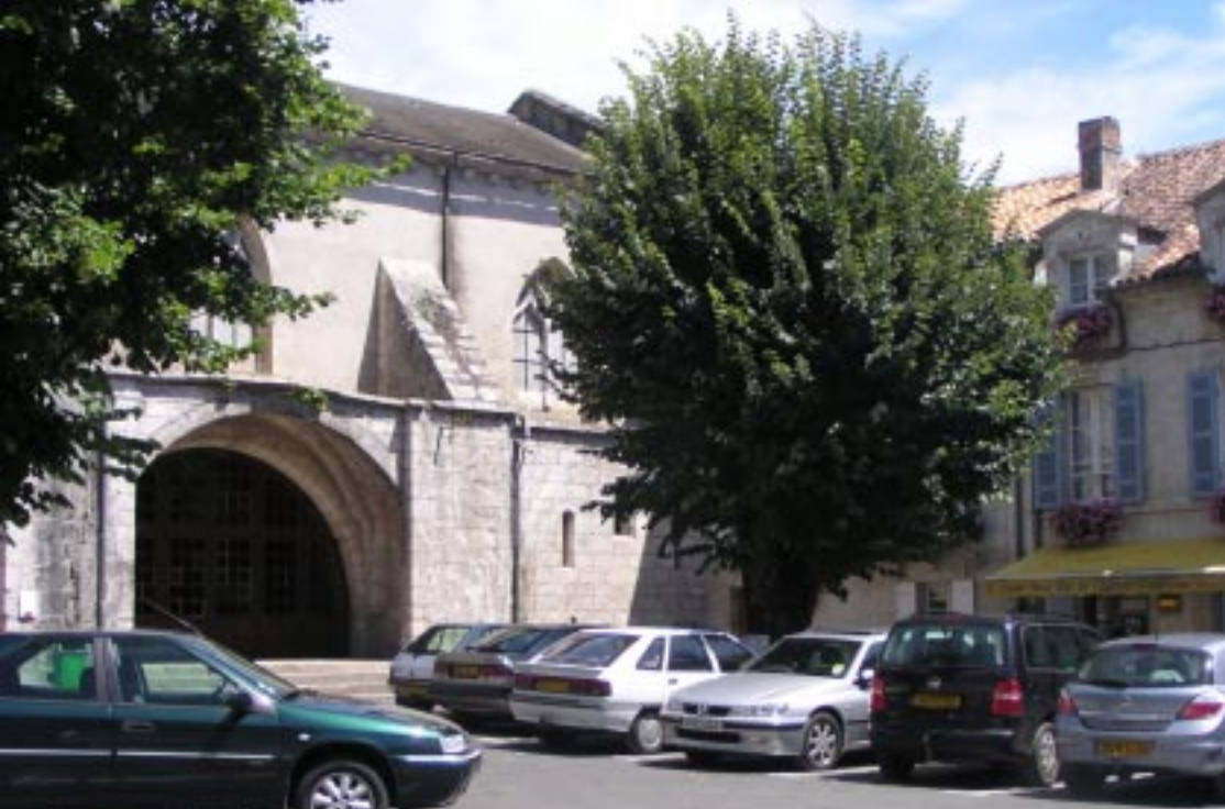
Kerk tegenover de abdij aan de andere kant van de Dronne.

Apart is de stuw, waar ze overheen moeten. Wanneer ze niet genoeg vaart hebben, lukt dat niet zomaar. Ze blijven dan midscheeps op de richel hangen. Wiebelen en het gewicht naar voren verplaatsen helpt.