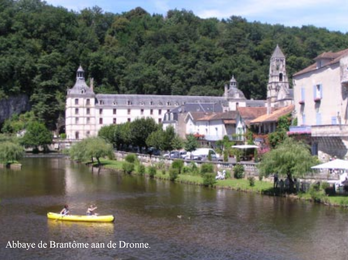
Abbaye de Brantôme aan de Dronne.

Tegen twee uur hebben we Zippy op een weggetje naast een volle parkeerplaats gezet en lopen naar de abdij. Een enorm gebouw met enkele bruggen over de Dronne, trekken veel aandacht. De rivier is vergeven van de kanoërs.