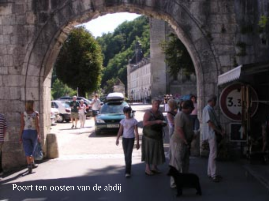
Poort ten oosten van de abdij.

Via een poort komen we weer op reeds bekend terrein. We zoeken tevergeefs een terras dat nog open is, dus halen we Zippy bij de Post op en rijden om vijf uur door.