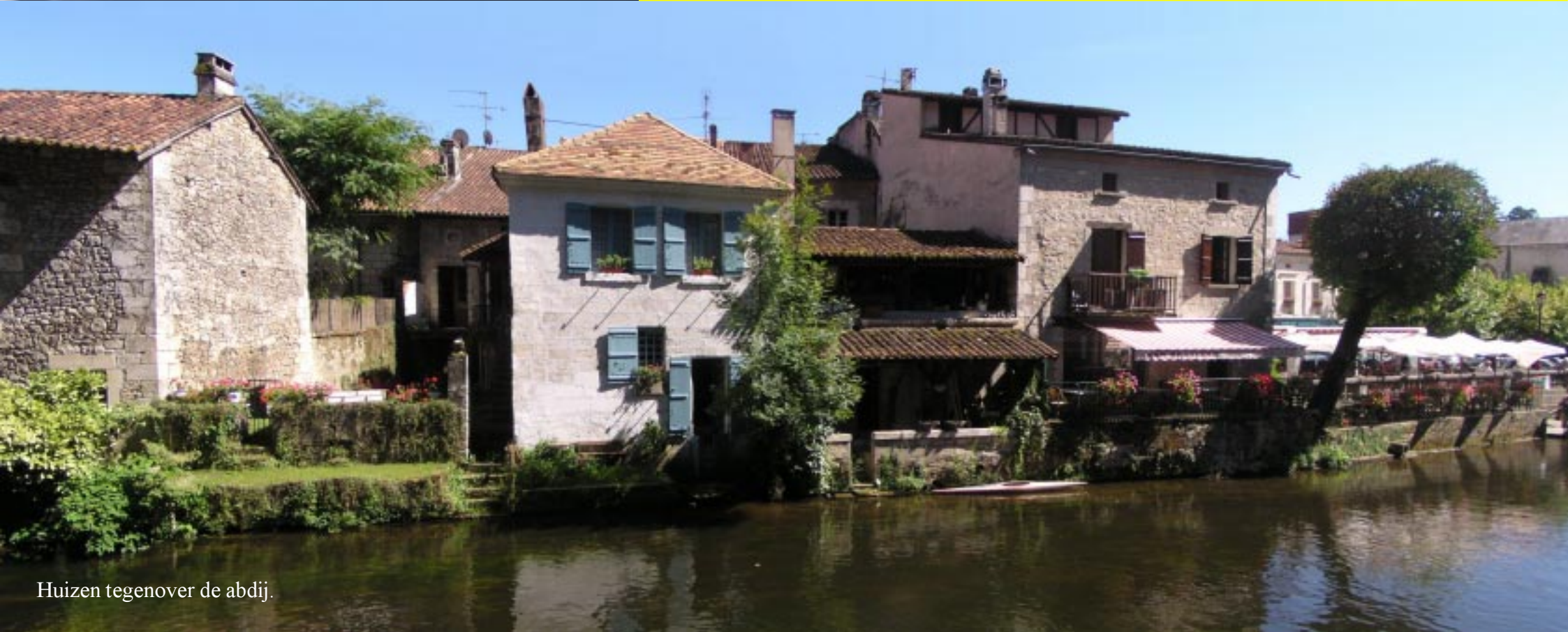
Huizen tegenover de abdij.

Klik hier om naar het verslag terug te gaan.