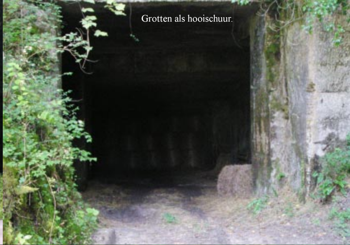
Grotten als hooisluur.