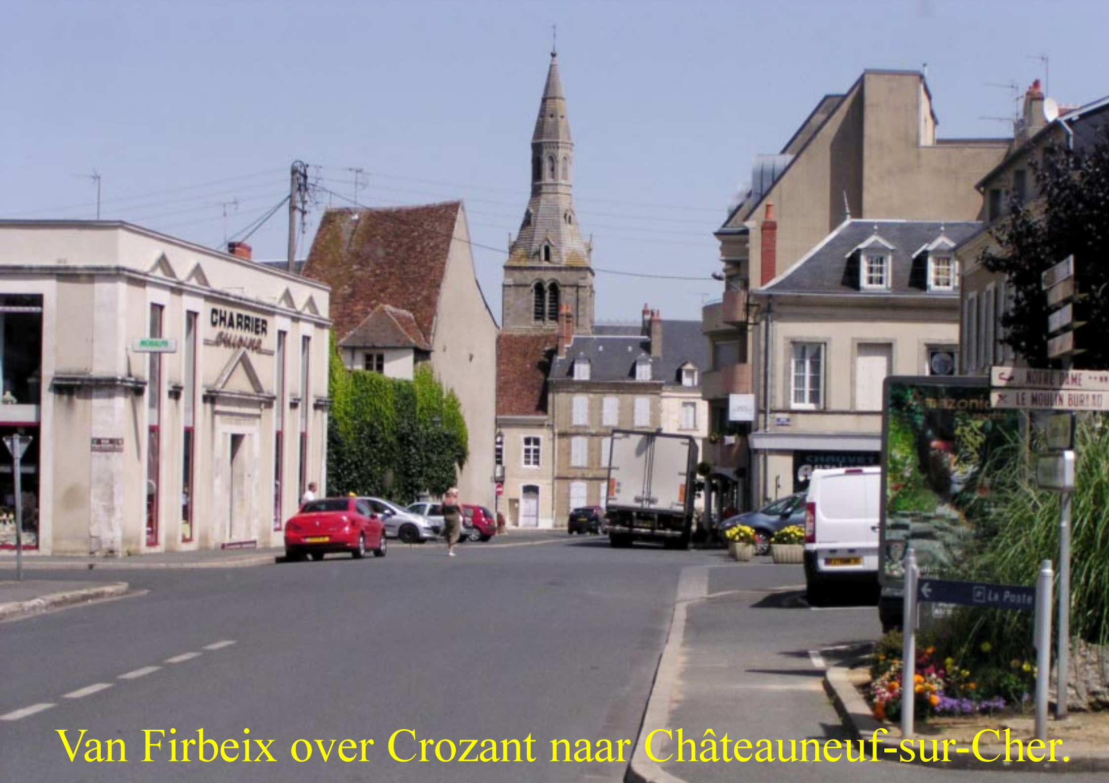
Van Firbeix over Crozant naar Châteauneuf-sur-Cher.