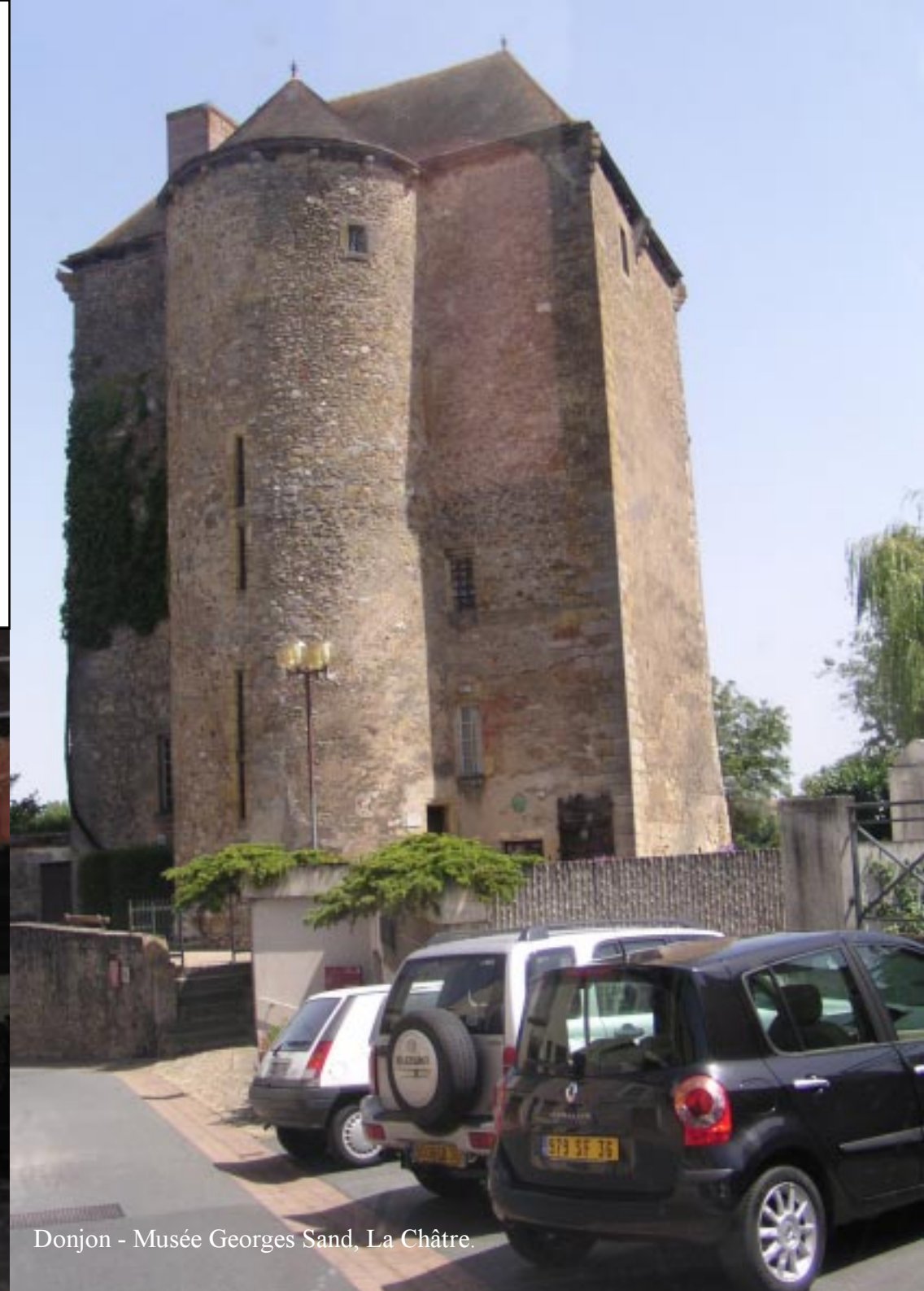
Donjon - Musée Georges Sand, La Châtre.