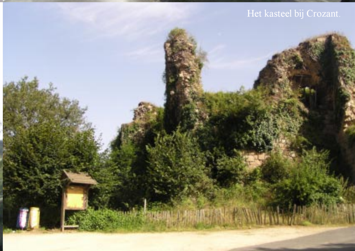
Het kasteel bij Crozant.