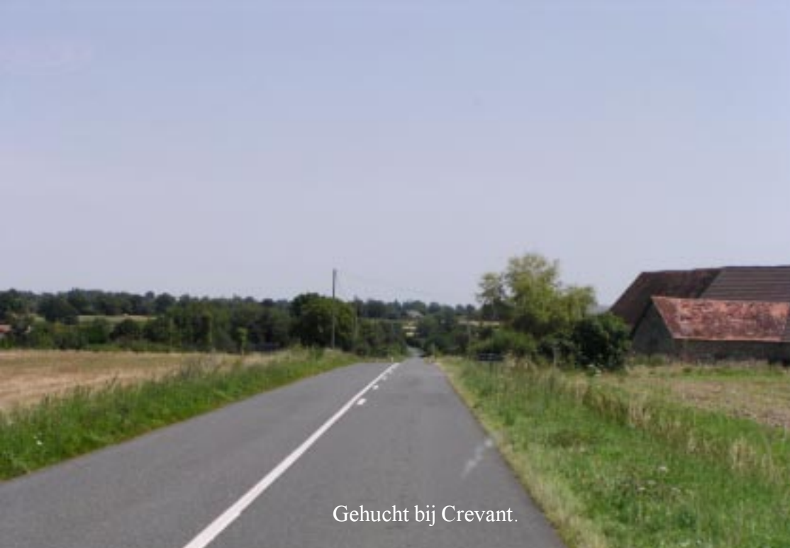
Gehucht bij Crevant.