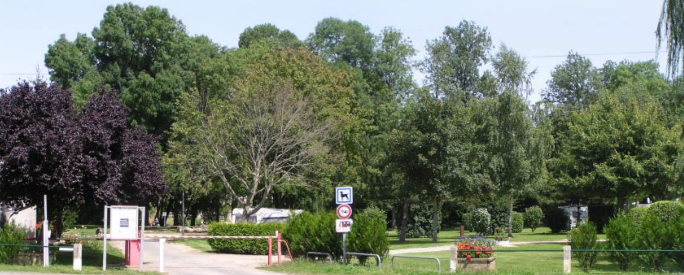
Camping Municipal, Châteauneuf-sur-Cher.