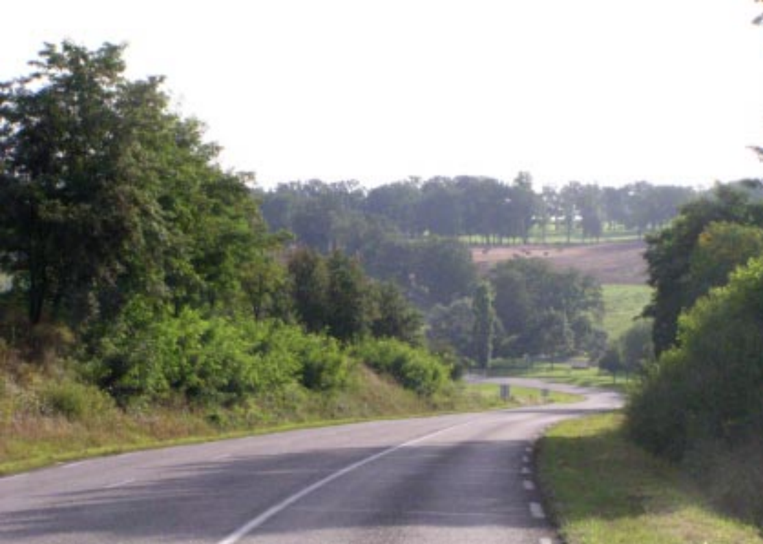
Vervolgens over kleine weggetjes met nauwelijks bewoning. Foto bij Crezeunet. Eerst golvende wegen dan weidse diepe dalen. Foto's o.a. brug in Aix-e-s-Vienne.