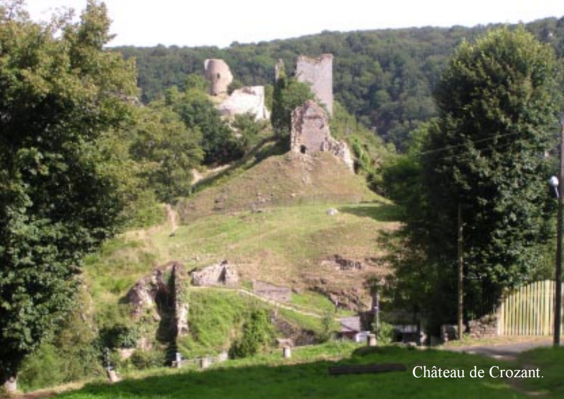
Château de Crozant.

In Crozant zoeken we even parkeerruimte en vinden die bij de campingpoort. We stonden daarvoor al bij de kasteelruïne. Nu lopen we links van de kerk omhoog en vinden inderdaad een trap tegenover de hoofdingang. Daar begint dan het pad naar de Sedelle (wandeling 288 van de 500).