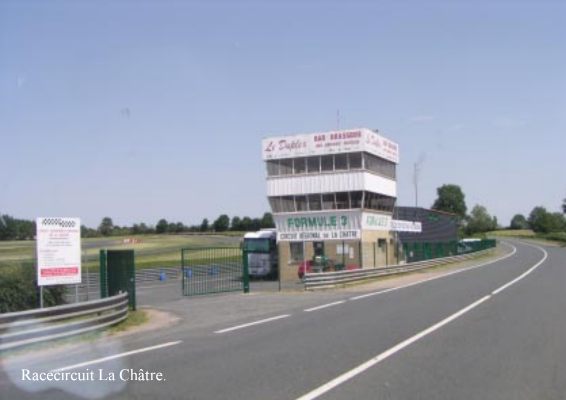
Racecircuit La Châtre.