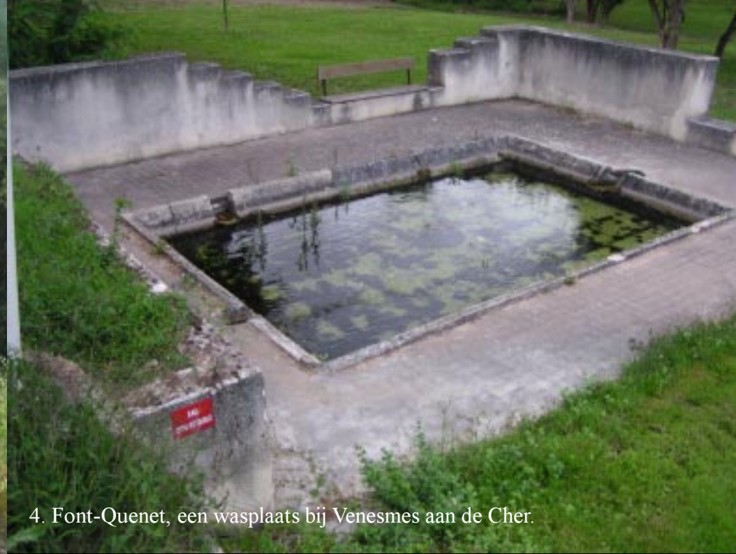
4. Font-Quenet, een wasplaats bij Venesmes aan de Cher.

Eerlijk gezegd ziet de zaak er niet uit, maar iets anders is er niet. Tineke twijfelt, ik niet. Doen.