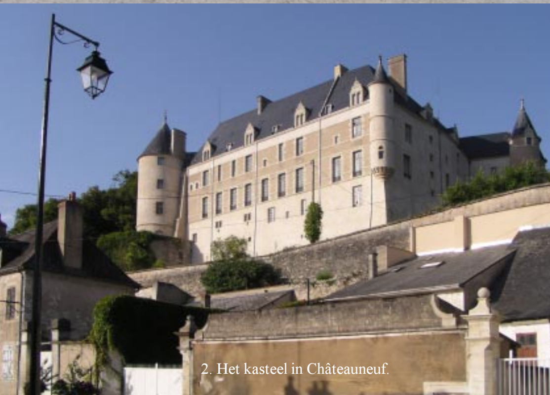
2. Het kasteel in Châteauneuf.