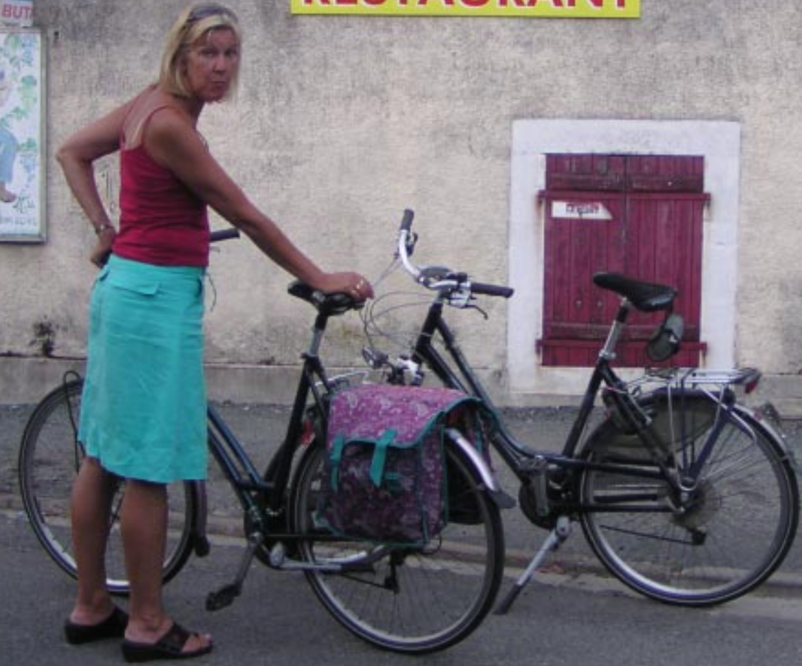
5. Het restaurant in Venemes.