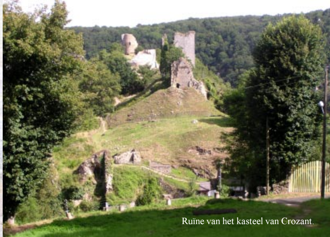
Ruïne van het kasteel van Crozant.