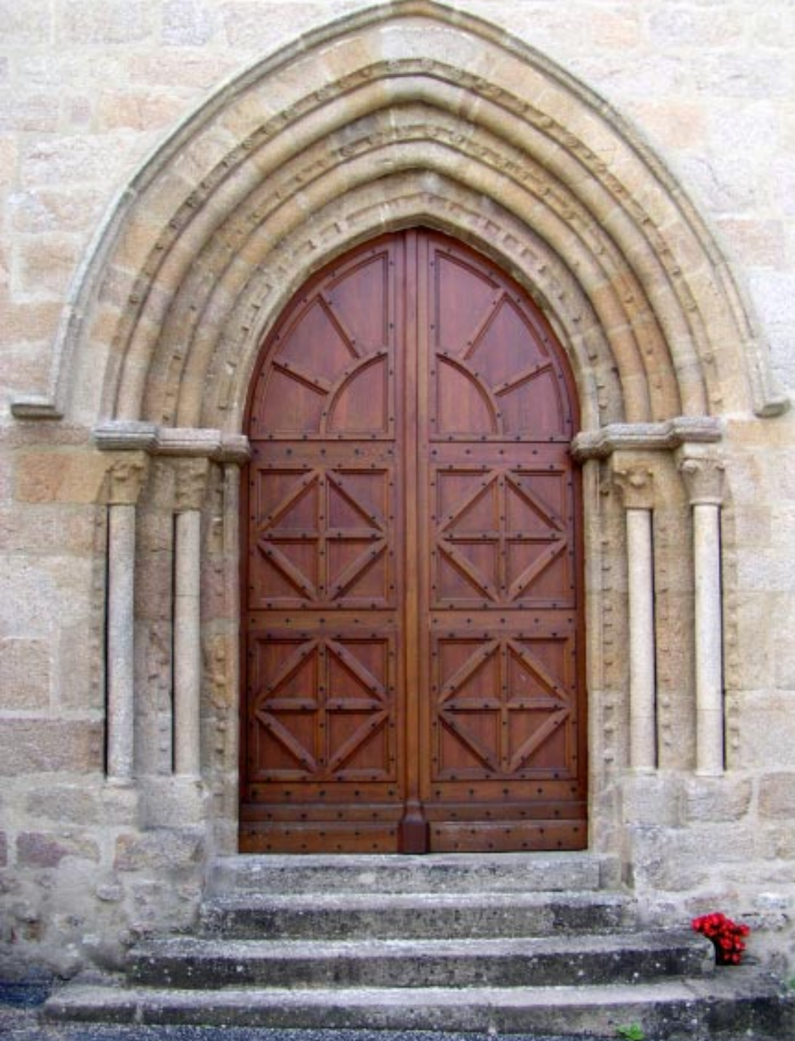
2. Eglise de Crozant.