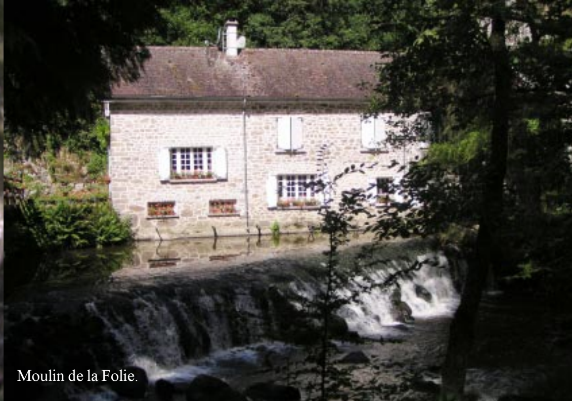
Moulin de la Folie.