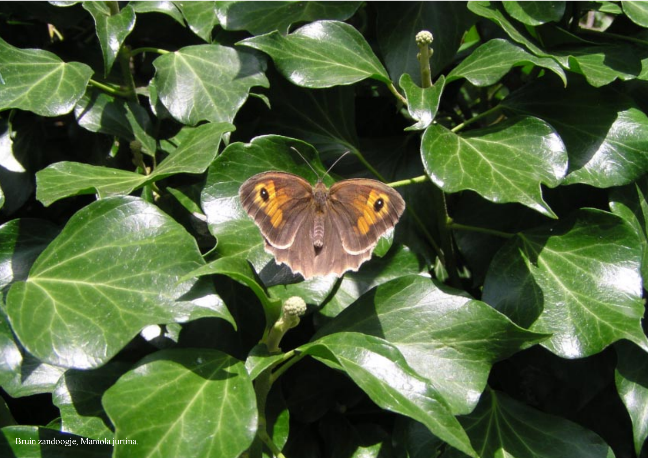
Bruin zandoogje, Maniola jurtina .