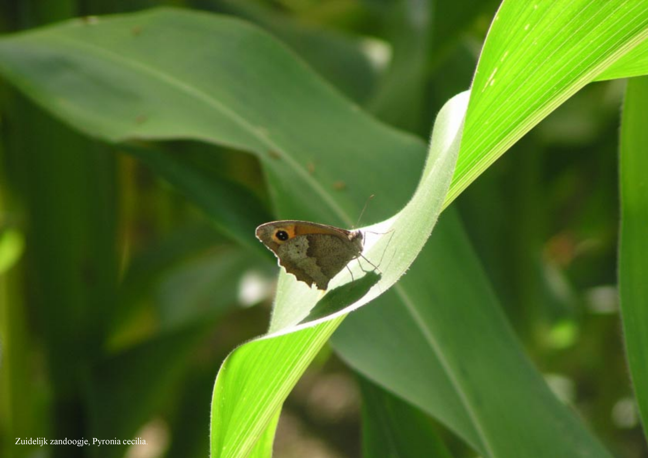
Zuidelijk zandoogje, Pyronia cecilia .