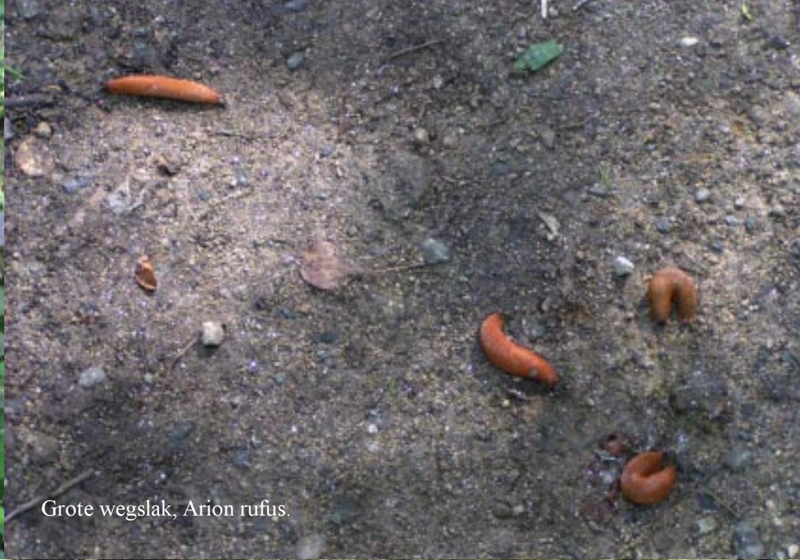
Grote weglak, Arion rufus .