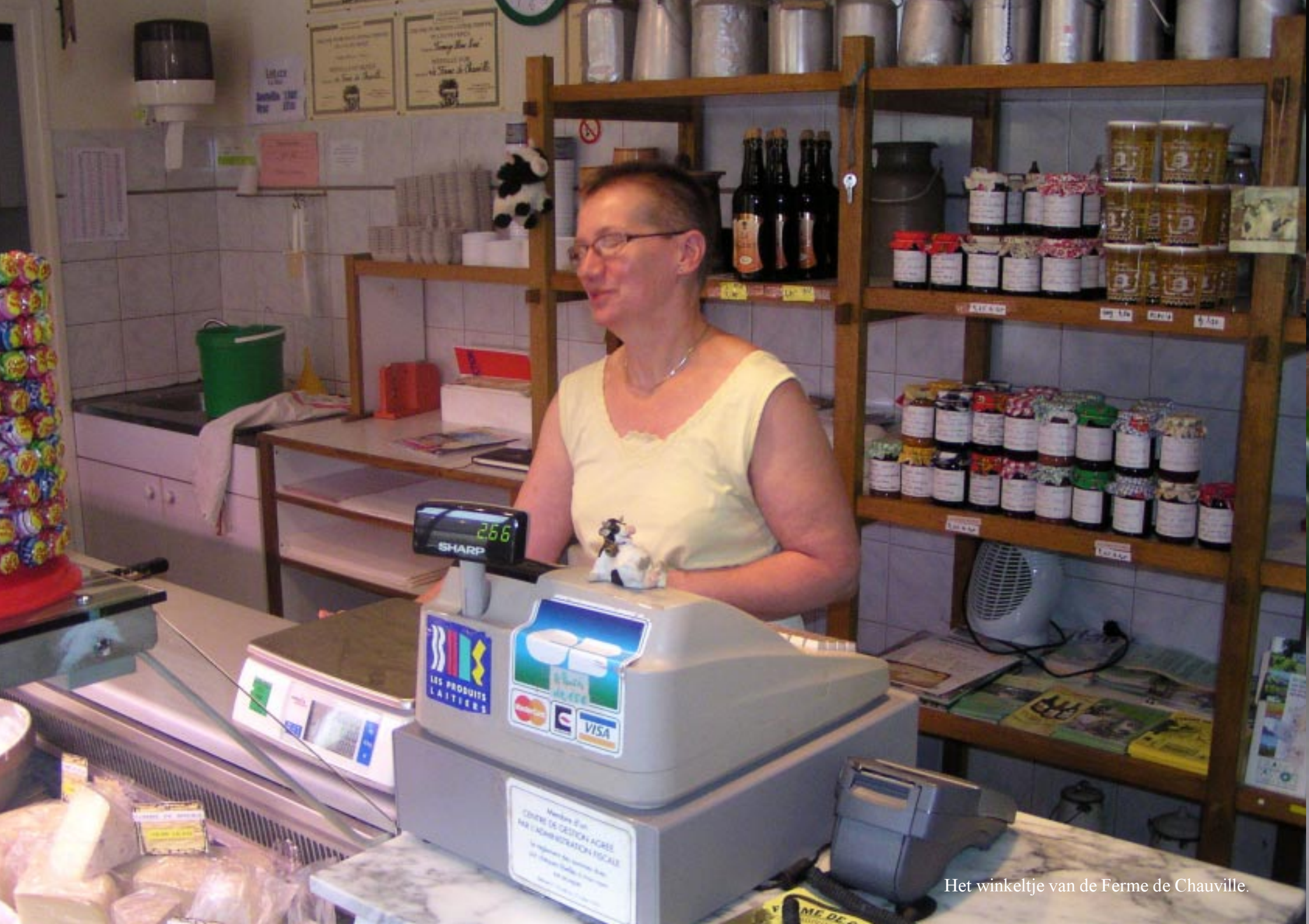
Het winkeltje van de Ferme de Chauville.