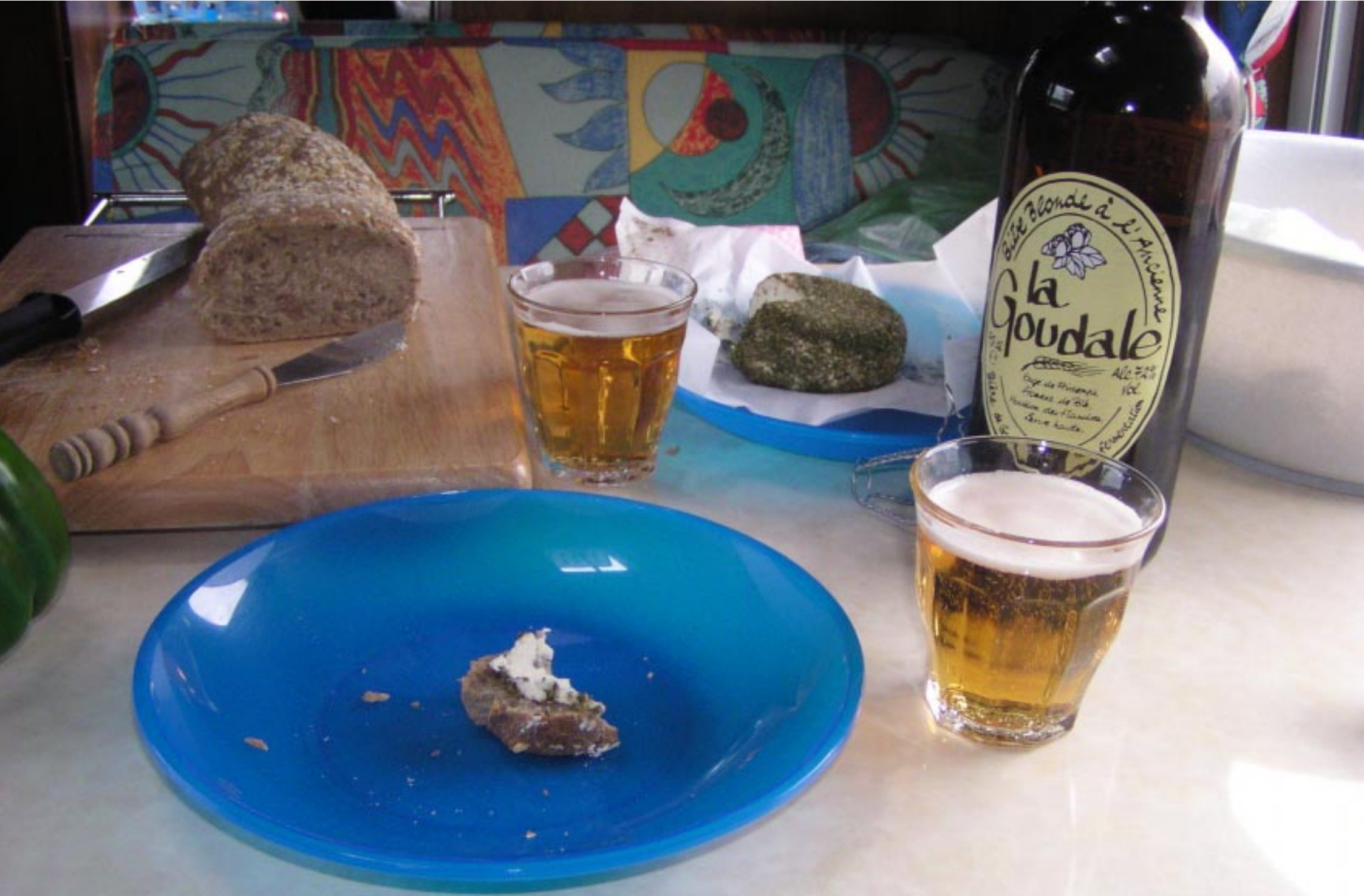
Naast de fles bier het kaasje van de Ferme de Chauville.