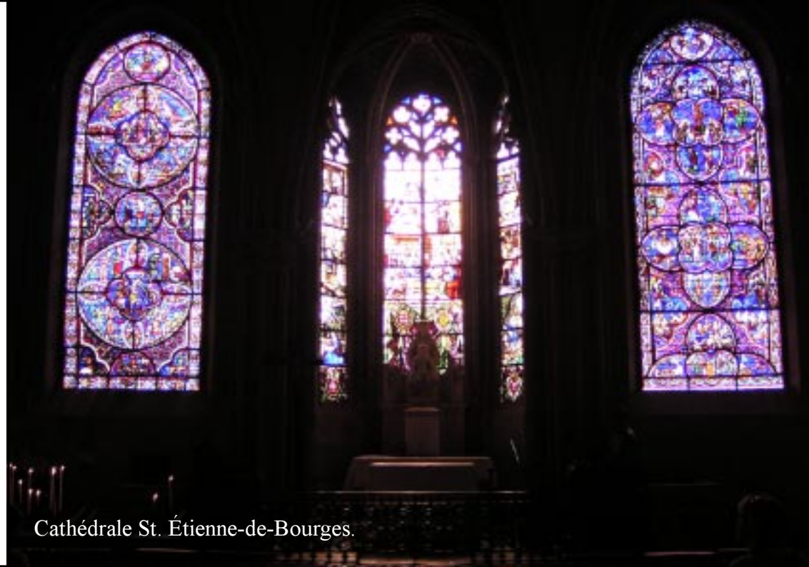
Cathédrale St. Étienne-de-Bourges.

We rijden via la Chapelle-d'Angillon via D926 naar Vailly-s-Saudre. Weer een bos in. (Eerder veel appelboomgaarden). 13.00. In Pierrefitte-eS-Bois foto van typische kerk uit deze streek.13.30.