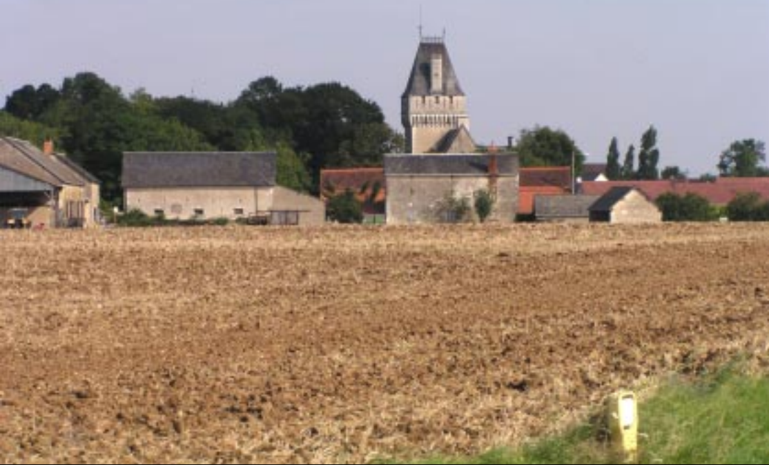
Kasteeltje van Trouy.