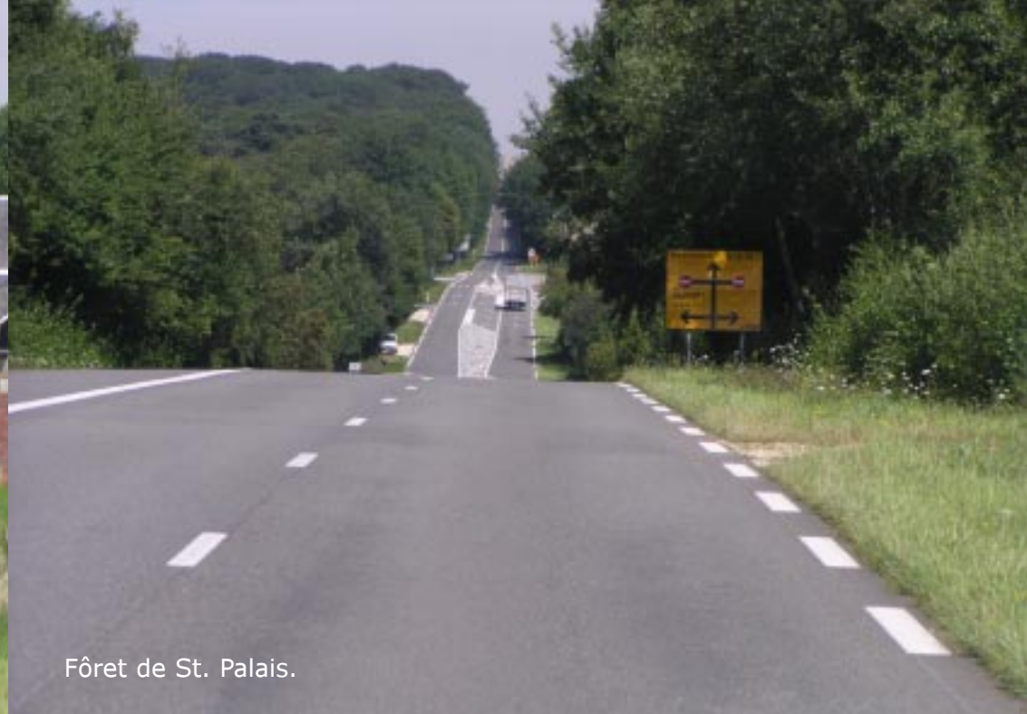
Fôret de St. Palais.