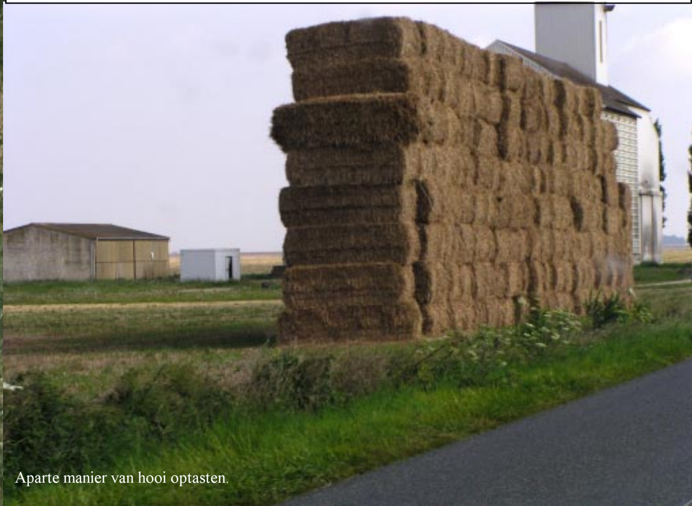
Aparte manier van hooi optasten.

Donderdag 2-8-2007. Chateaufeuf-s-Cher - Bourges - Chatillon-s-Loire - Nonville. Om 9.45 rijden we Chateaufeuf weer uit. Eerst naar Bourges. Deze weg is een voortzetting van de laatste van gisteren: grote vlakten stro en zonnebloemen.