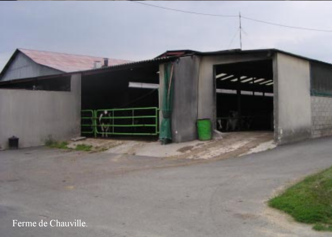
Ferme de Chauville.

Over Bouchereau en Nanteau gaat het door Nonville naar de D403. Net na de brug over de Lunain links een weggetje in. (Een bord met koopwaar van de Ferme de Chauville, wijst voor degene die de France Passion gids heeft gelezen de weg.) We vragen het toch nog eens. "Het is bij een boerderij met koeien en een winkeltje.", krijgen we als antwoord van twee wandelende dames.