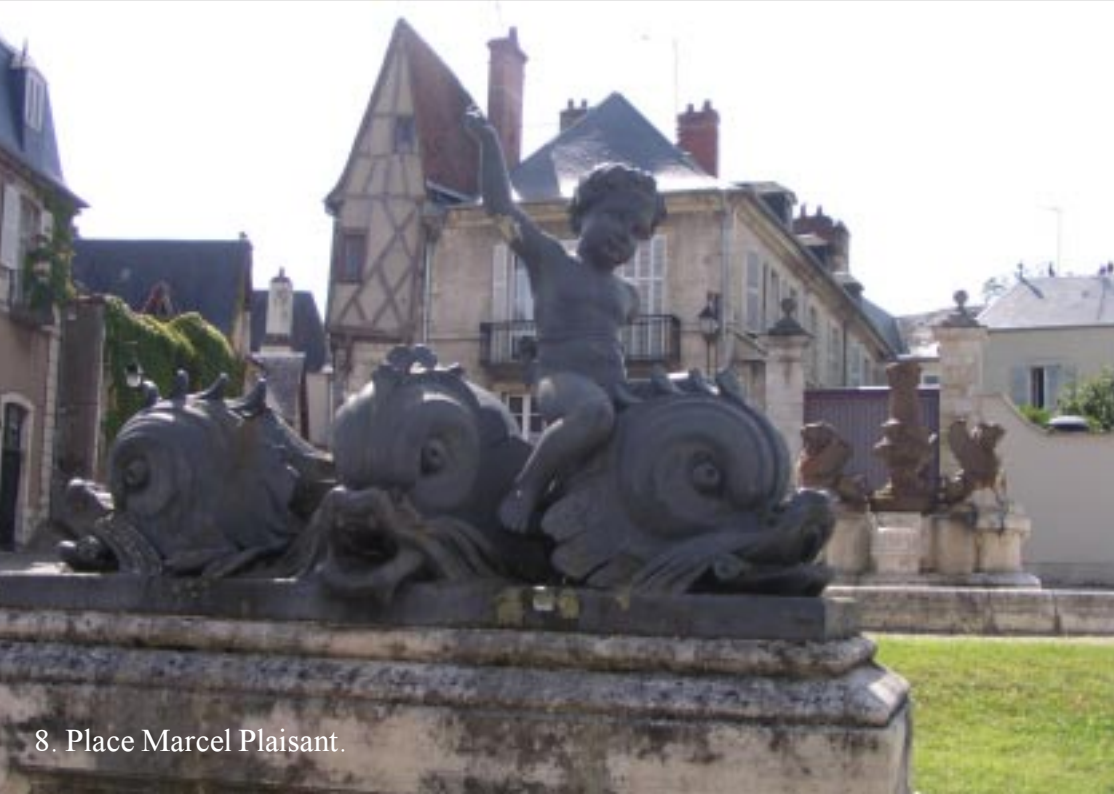
8. Place Marcel Plaisant.