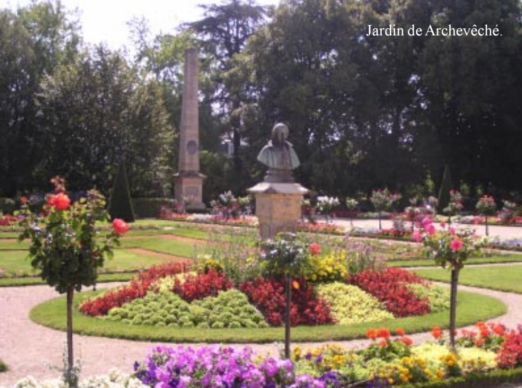
Jardin de Archevêché.