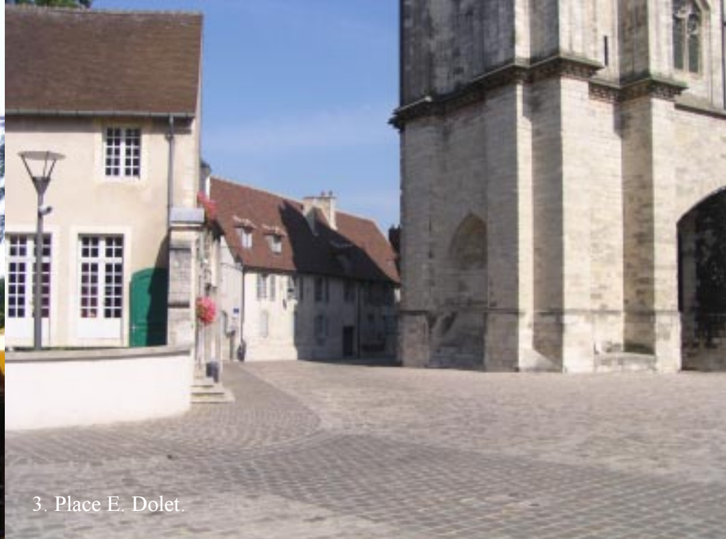
3. Place E. Dolet.