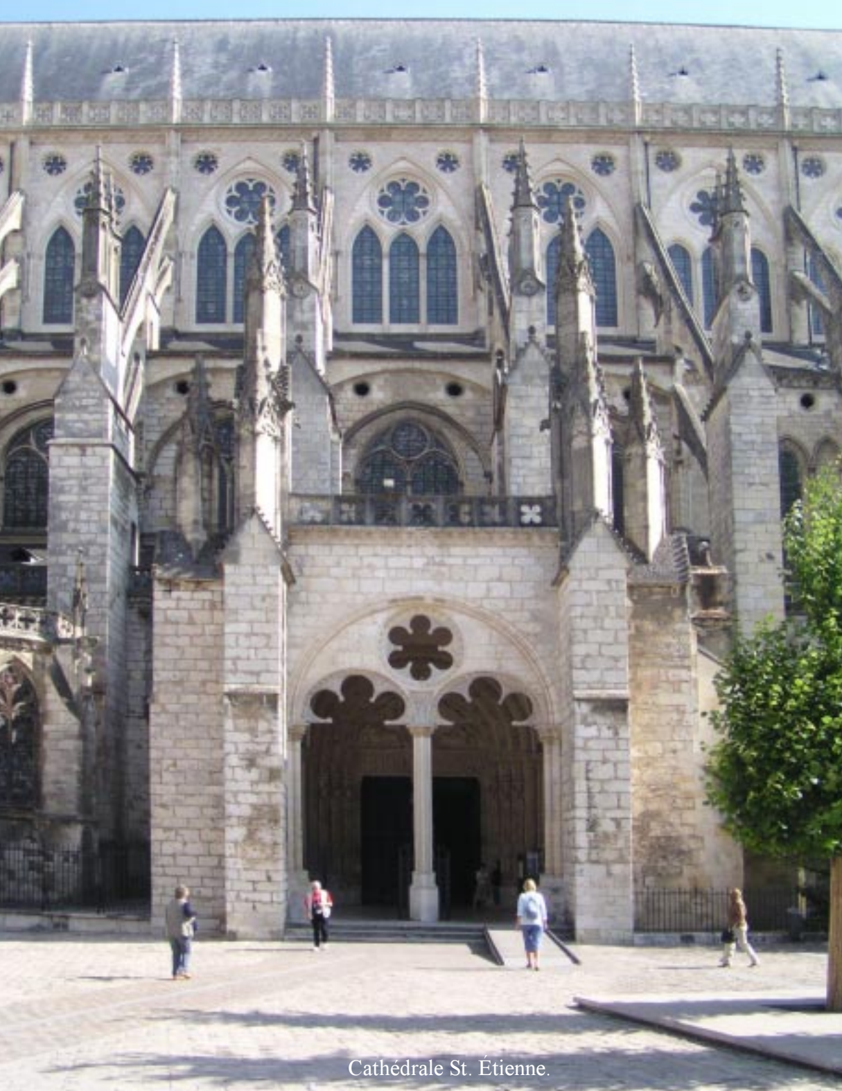
Cathédrale St. Étienne.