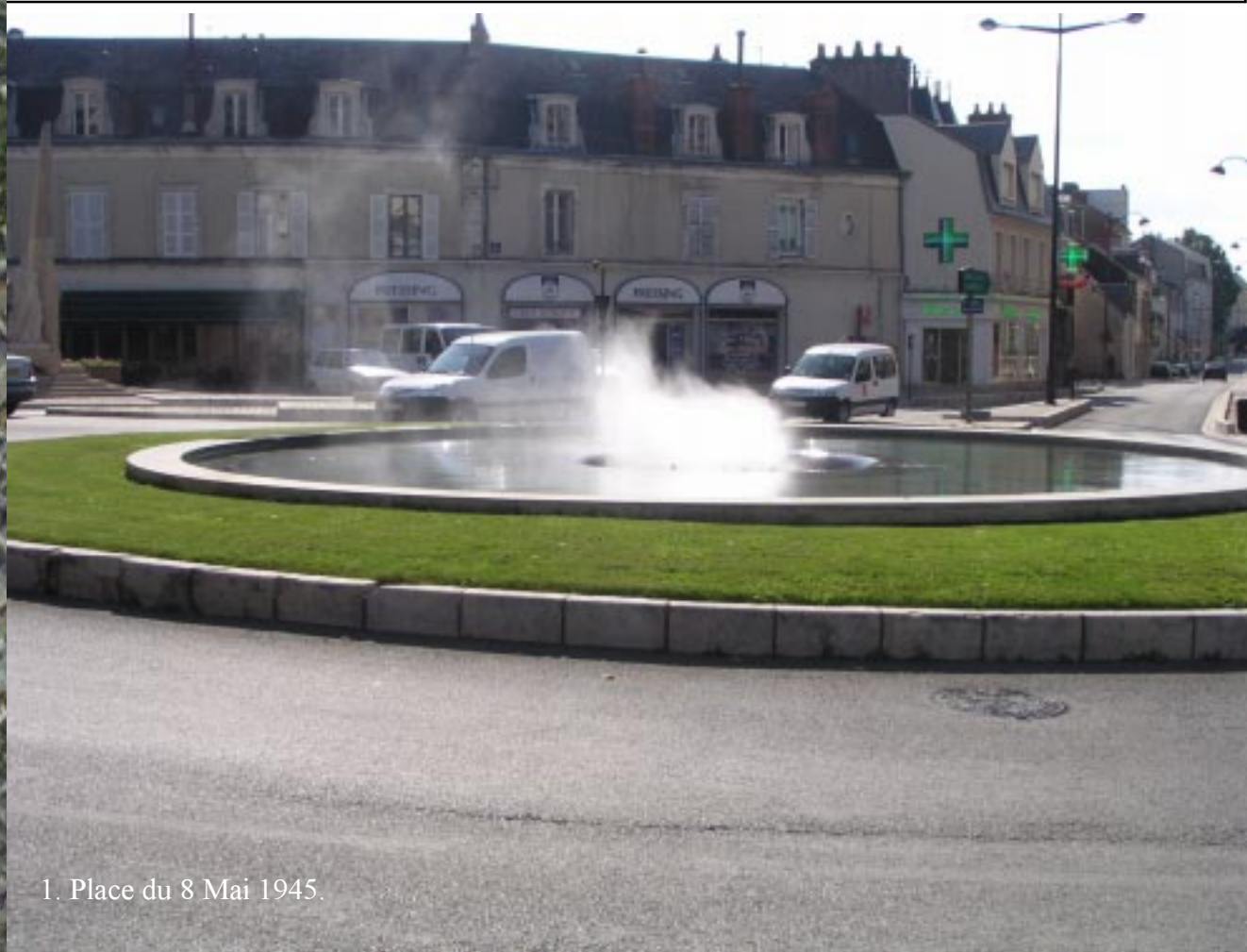
1. Place du 8 Mai 1945.

We zoeken in Bourges de camperplaats die in het centrum moet liggen. We komen echter terecht op een parkeerplaats aan de Rue de Séraucourt. Iemand moppert, wanneer we weglopen, een beetje op ons, omdat we niet op de camperplaats gingen staan die we niet vonden? Maar hier mag het ook en dat is voor ons even genoeg. We halen een folder bij het VVV en beginnen de wandeling bij de kathedraal. Een zeer hoog gebouw.