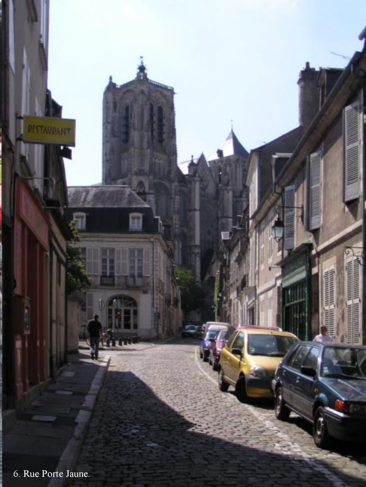
6. Rue Porte Jaune.