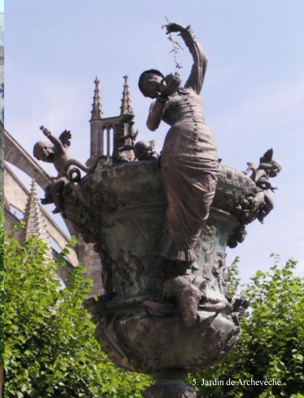
5. Jardin de Archevêché.

Buiten kijken we nog even rond in de uitbundig bloeiende Jardin de Archevêché. Dan gaat het voor de kerk langs de Rue Porte Jaune in.