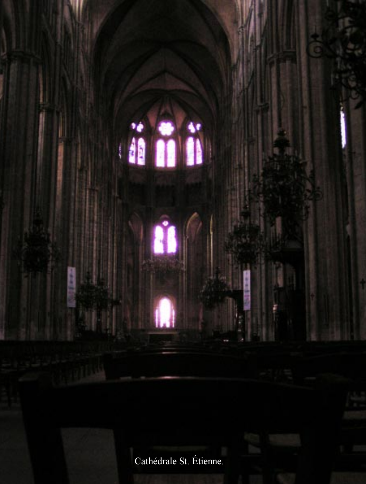
Cathédrale St. Étienne.