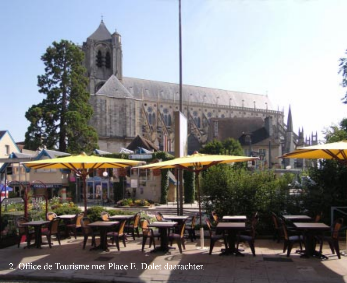
2. Office de Tourisme met Place E. Dolet daarachter.