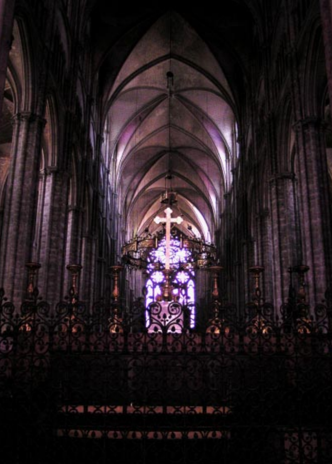
Blik vanaf achter het koor naar achter in de kerk.