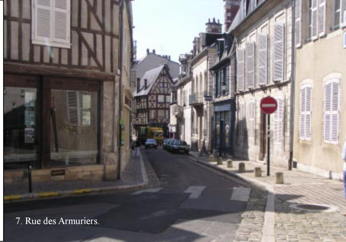
7. Rue des Armuriers.

Klik hier om terug te gaan naar het verslag.