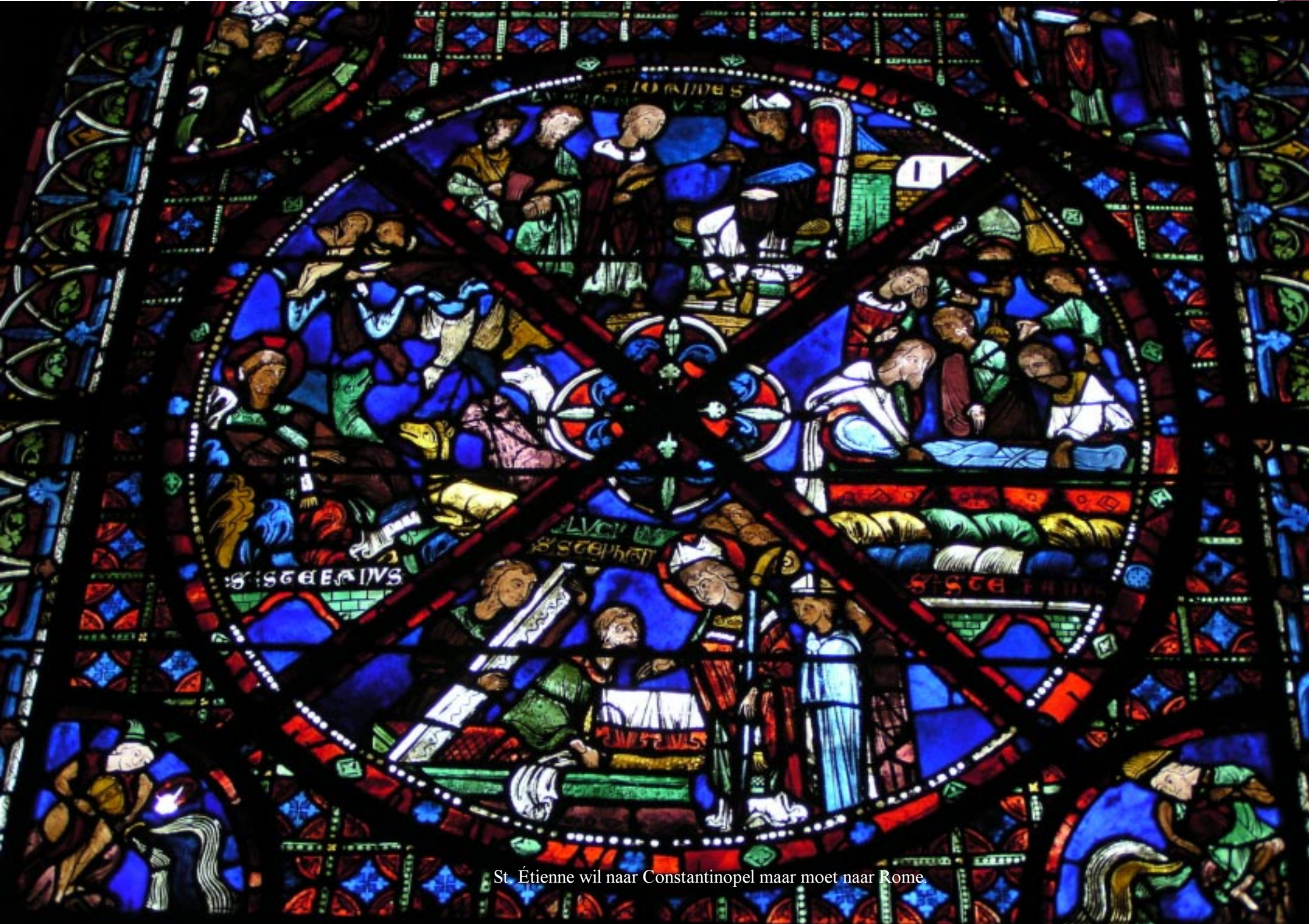
St. Étienne wil naar Constantinopel maar moet naar Rome