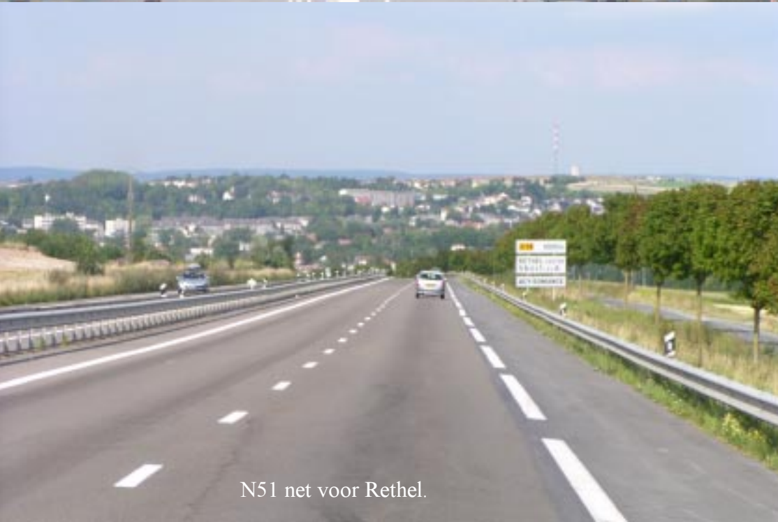
N51 net voor Rethel.

De N51 brengt ons rap tot bij Rethel, maar dan rekenen we te veel op het vernuft van de MIO. Via steeds smallere wegen gaat het over Sery (17.20), Wasigny, la Neuville-les-Wasigny (foto van typische kerk van deze streek) naar Lalobbe. We zitten echt in de Ardennen met steile korte hellingen, veel bos en prachtige plekjes.