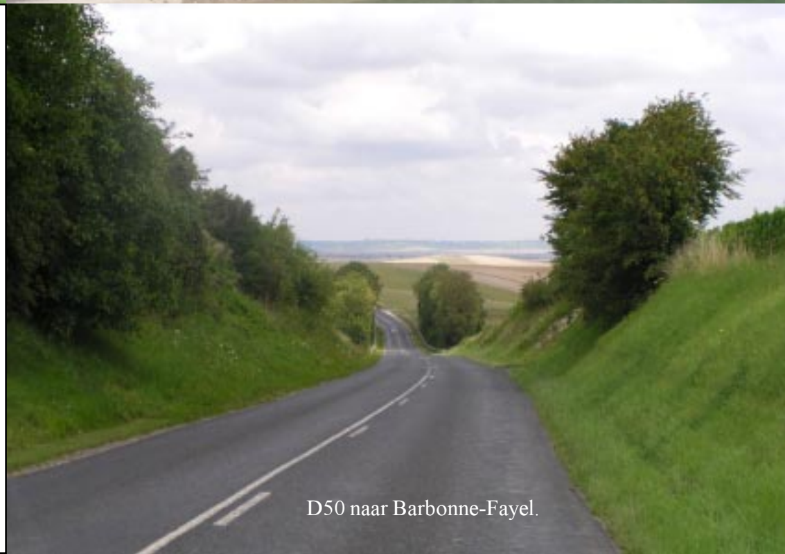
D50 naar Barbonne-Fayel.

Klik op de foto rechts boven voor het verslag van deze wandeling 138.