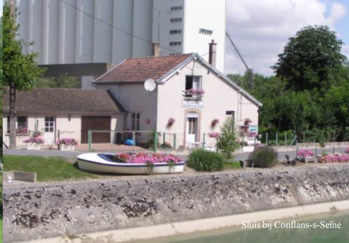
Sluis bij Conflans-s-Seine.

Dan draaien we links af en rijden naar Marcilly-s-Seine voor een wandeling langs de rivier. (Van ca. 11 – 12.55.)