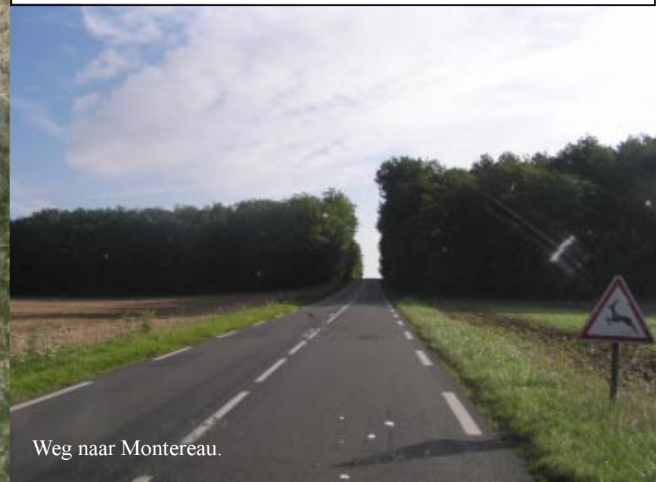
Weg naar Montereau.

We komen noordwaarts opnieuw langs uitgestrekte akkers.