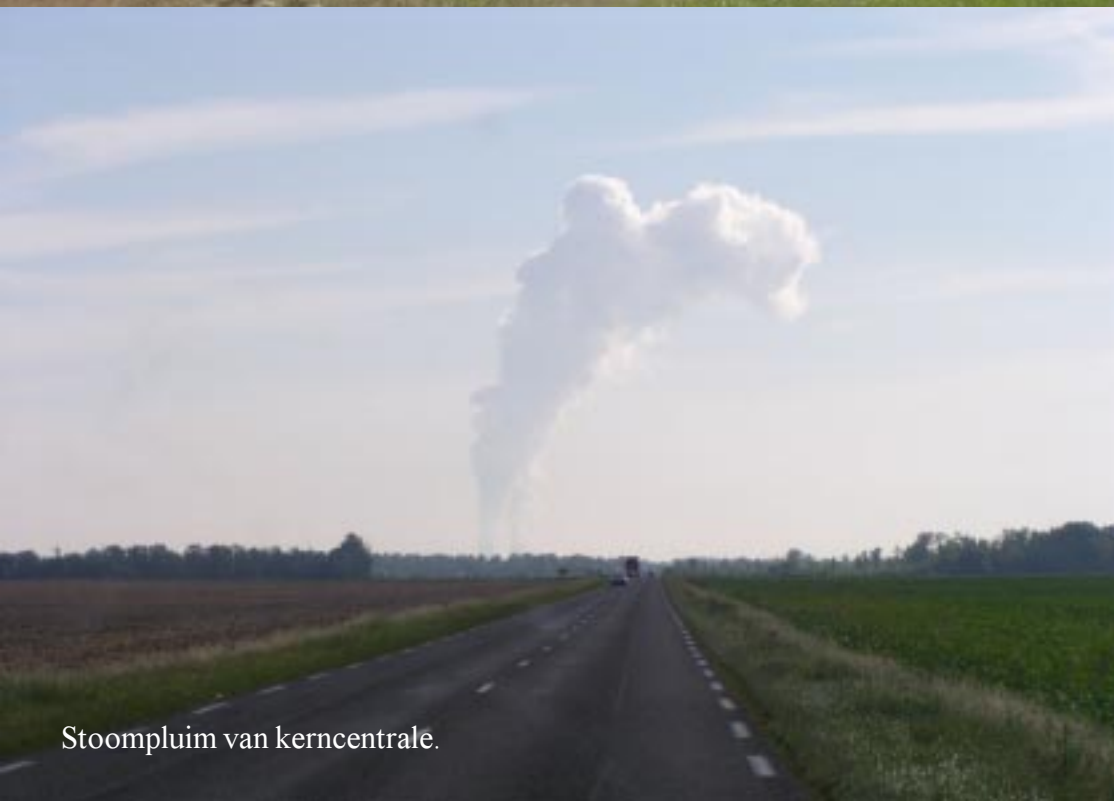
Stoompluim van kerncentrale.

De skyline van Montean levert nog een aardig plaatje op. Dan draaien we oostwärts de vlakte bij o.a. Bazoche-les-Bray op. In de verte wordt een enorme stoomwolk steeds duidelijker. Die komen uit twee enorme schoorstenen van de kerncentrale boven Nogent-s-Seine.