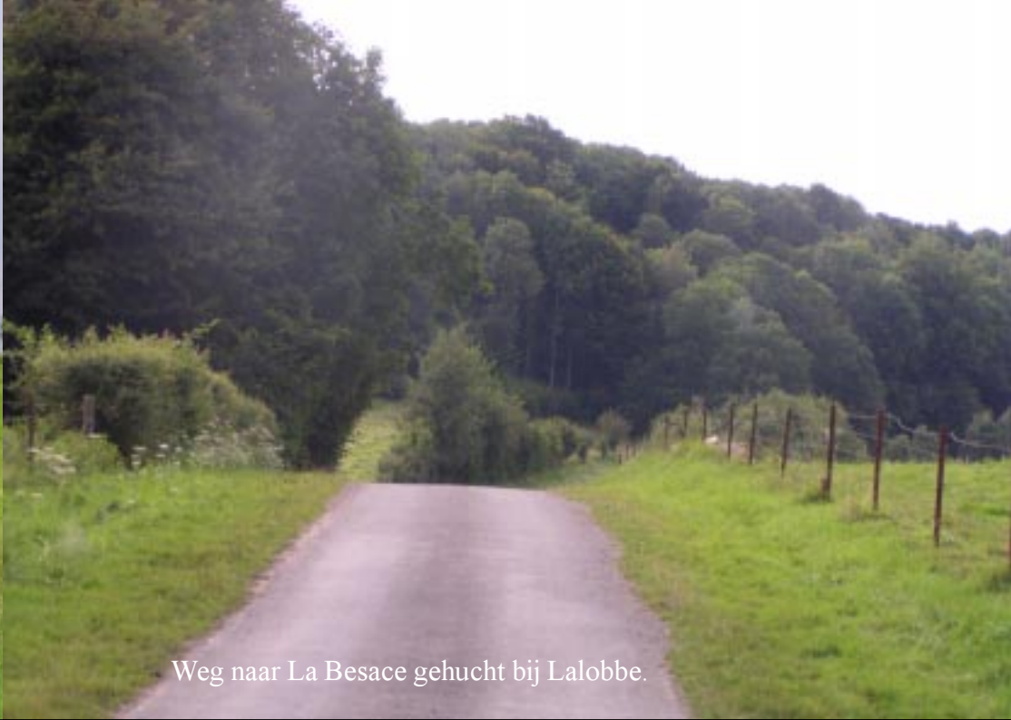
Weg naar La Besace gehucht bij Lalobbe.