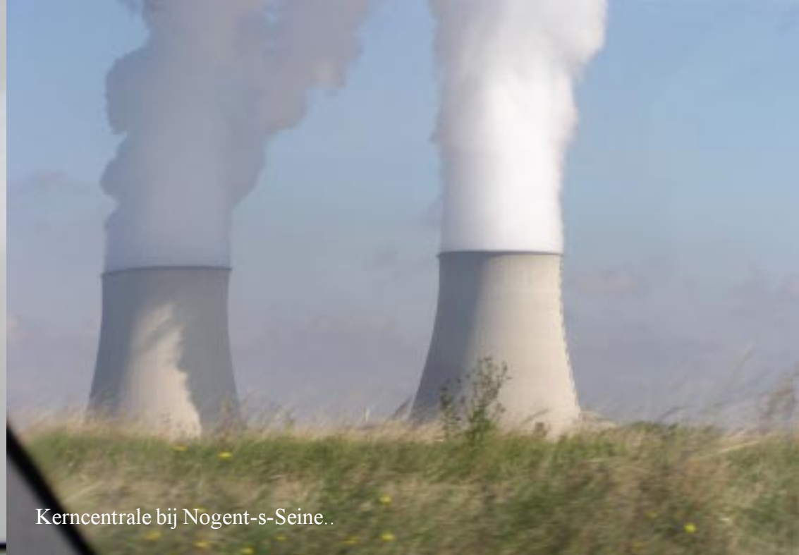
Kerncentrale bij Nogent-s-Seine..