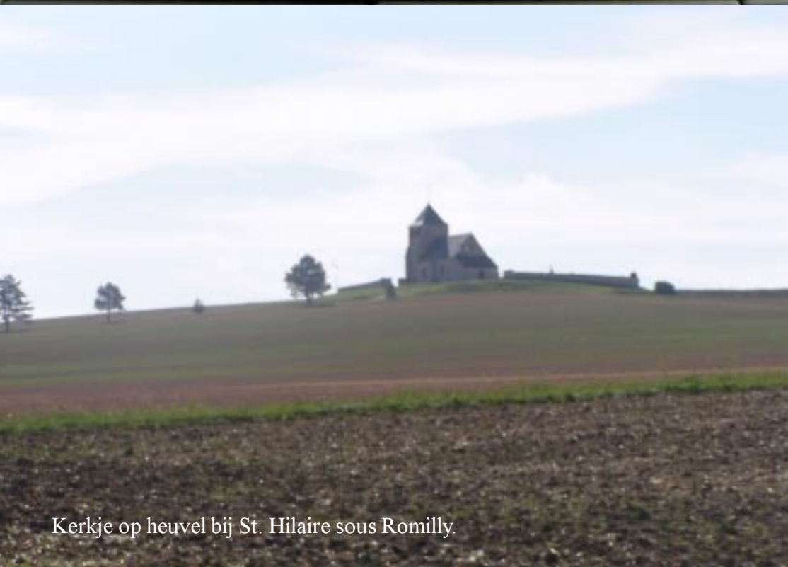
Kerkje op heuvel bij St. Hilaire sous Romilly.