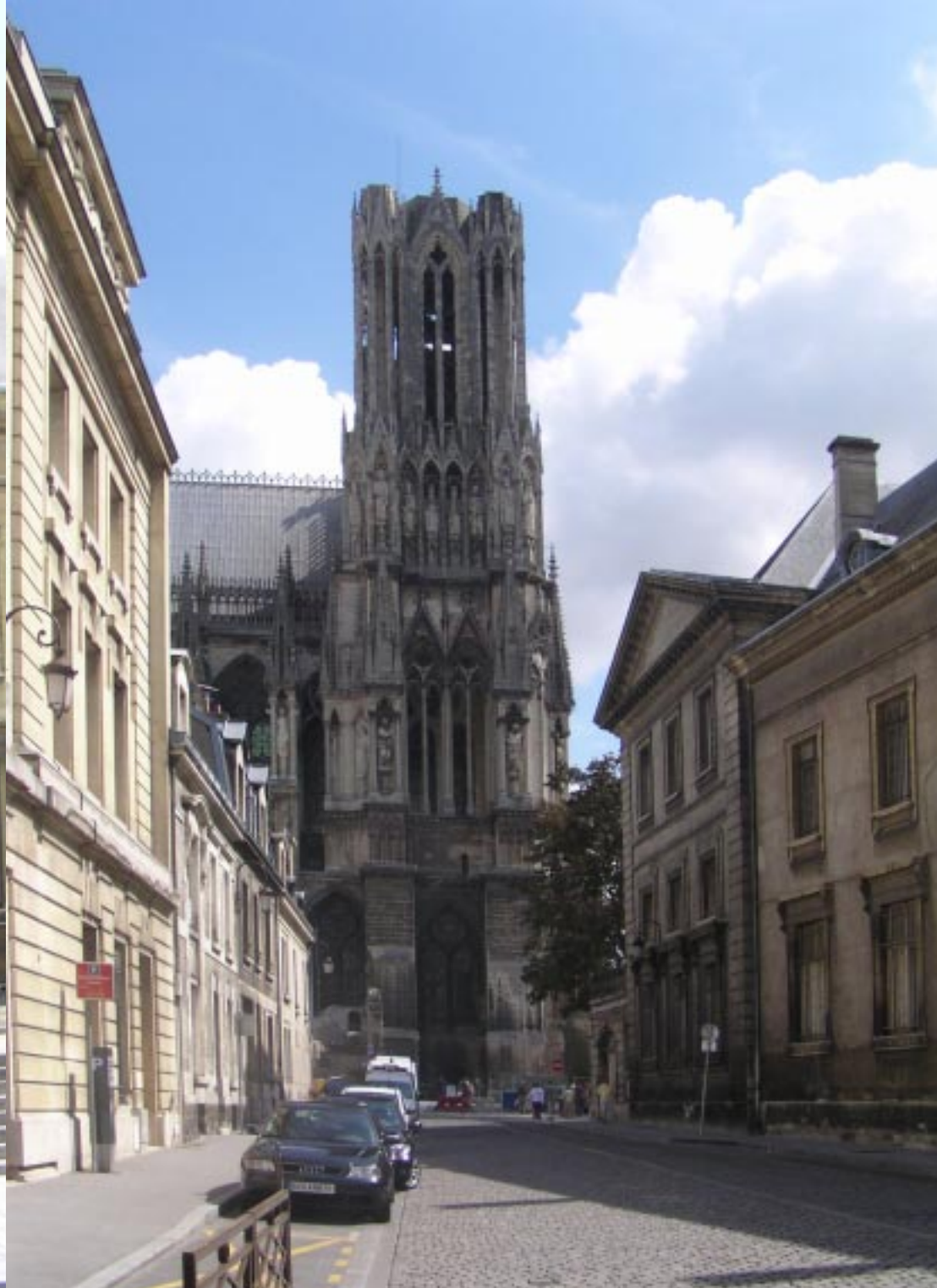
4. Rue du Trésor.