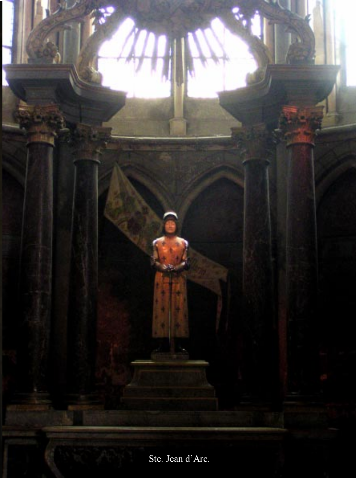
Ste. Jean d'Arc.

Opmerkelijke andere dingen vind ik de vele enorme luchters in het middenschip, opnieuw een heel aardig uurwerk (dat om 16 uur voor onze neuzen het speeltje in gang zet) en een beeld van Ste. Jean d'Arc, dat in een prachtig licht staat.