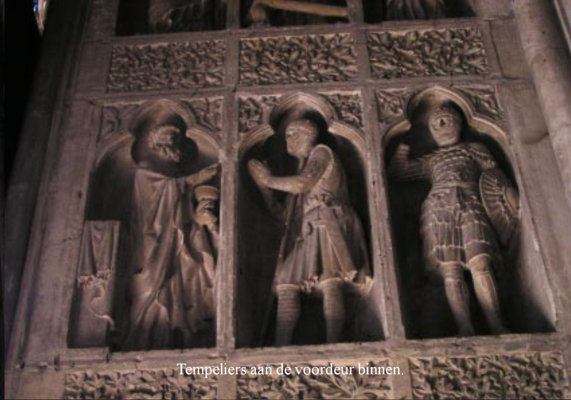
Tempeliers aan de voordeur binnen.