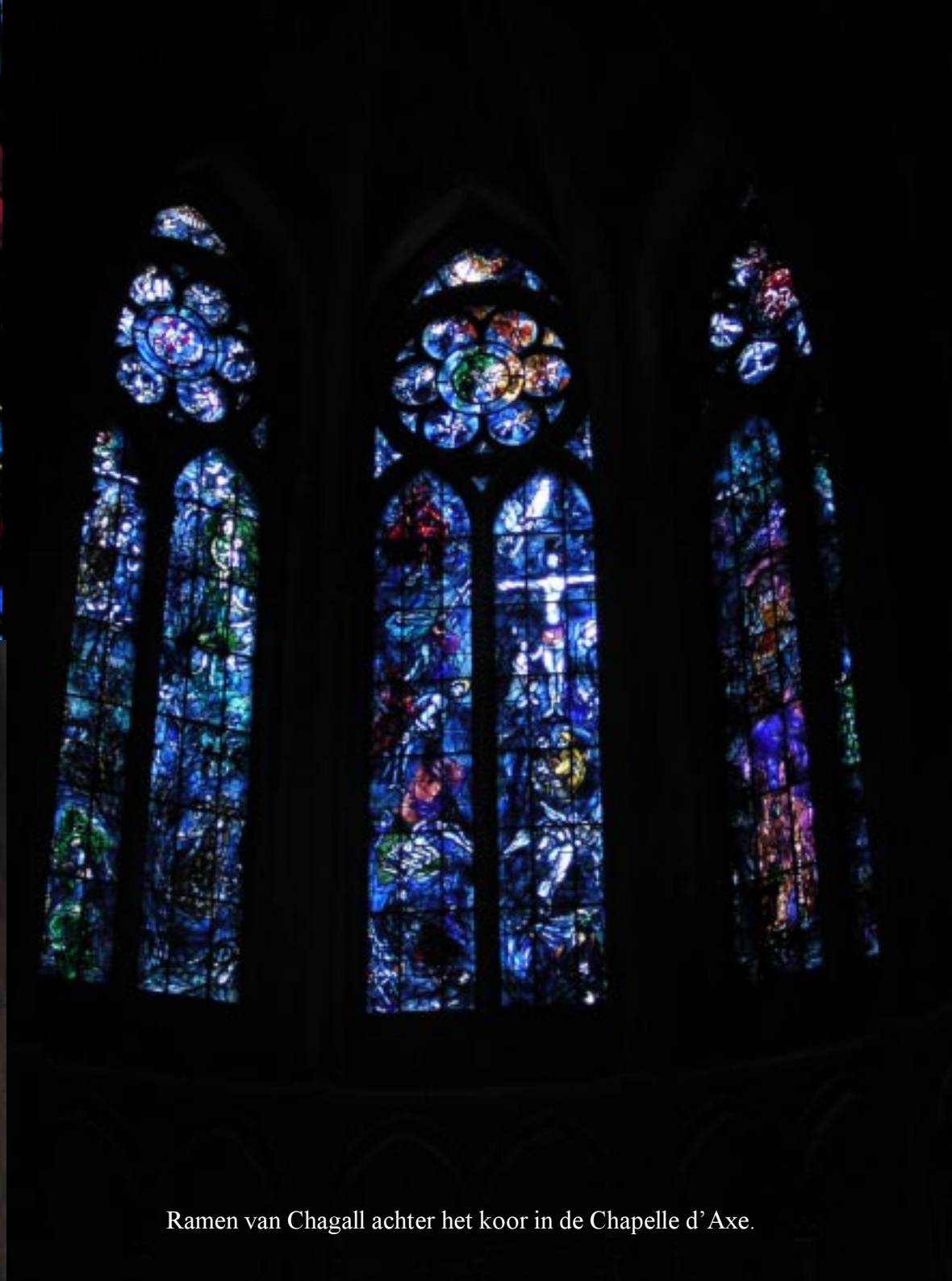
Ramen van Chagall achter het koor in de Chapelle d'Axe.