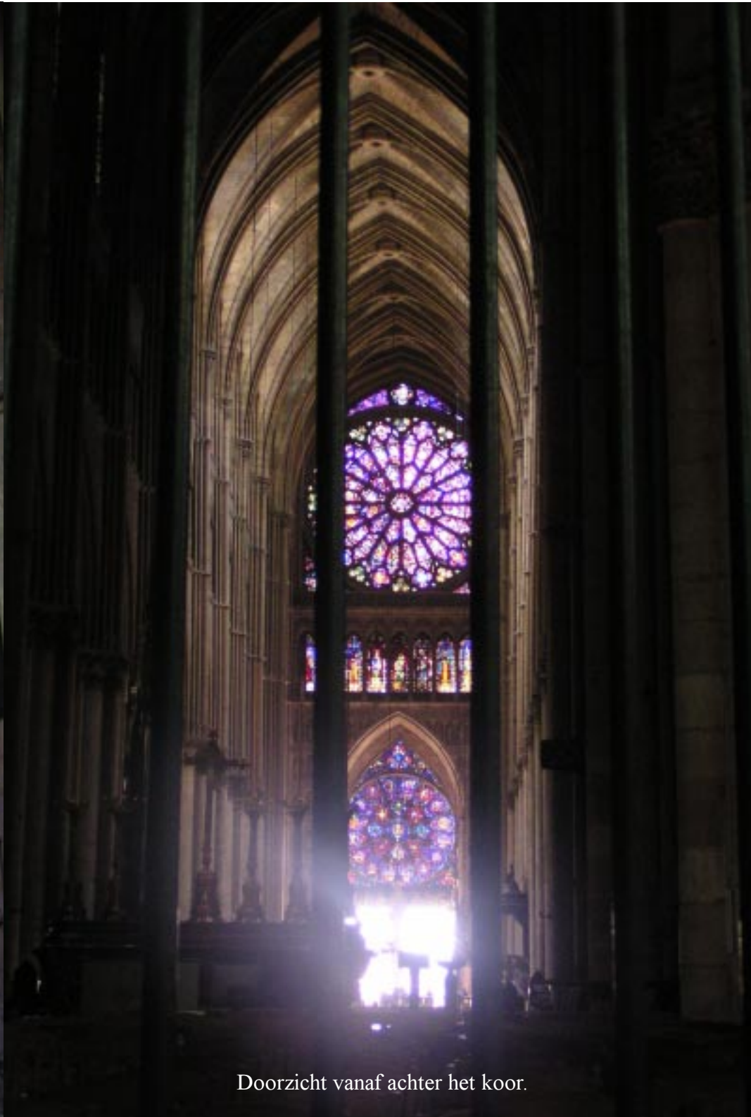
Doorzicht vanaf achter het koor.