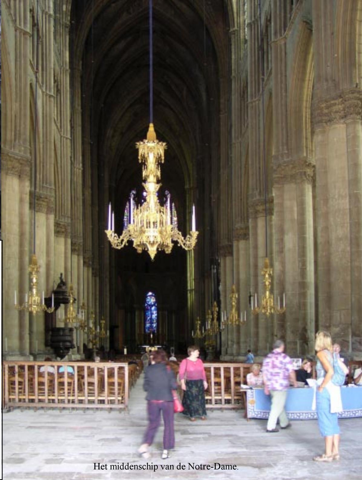
Het middenschip van de Notre-Dame.

Binnen maakt uiteraard de zeer hoge ruimte indruk. Opmerkelijk is dat het voorportaal qua beelden voortgezet wordt aan de binnenkant. De hele achterwand is er vol mee. Verder zijn ook hier nog aardig wat vroeg middeleeuwse gebrandschilderde ramen, zoals we eerder in Bourges zagen. Ook hier zeggen plaatjes meer dan een verhaal.