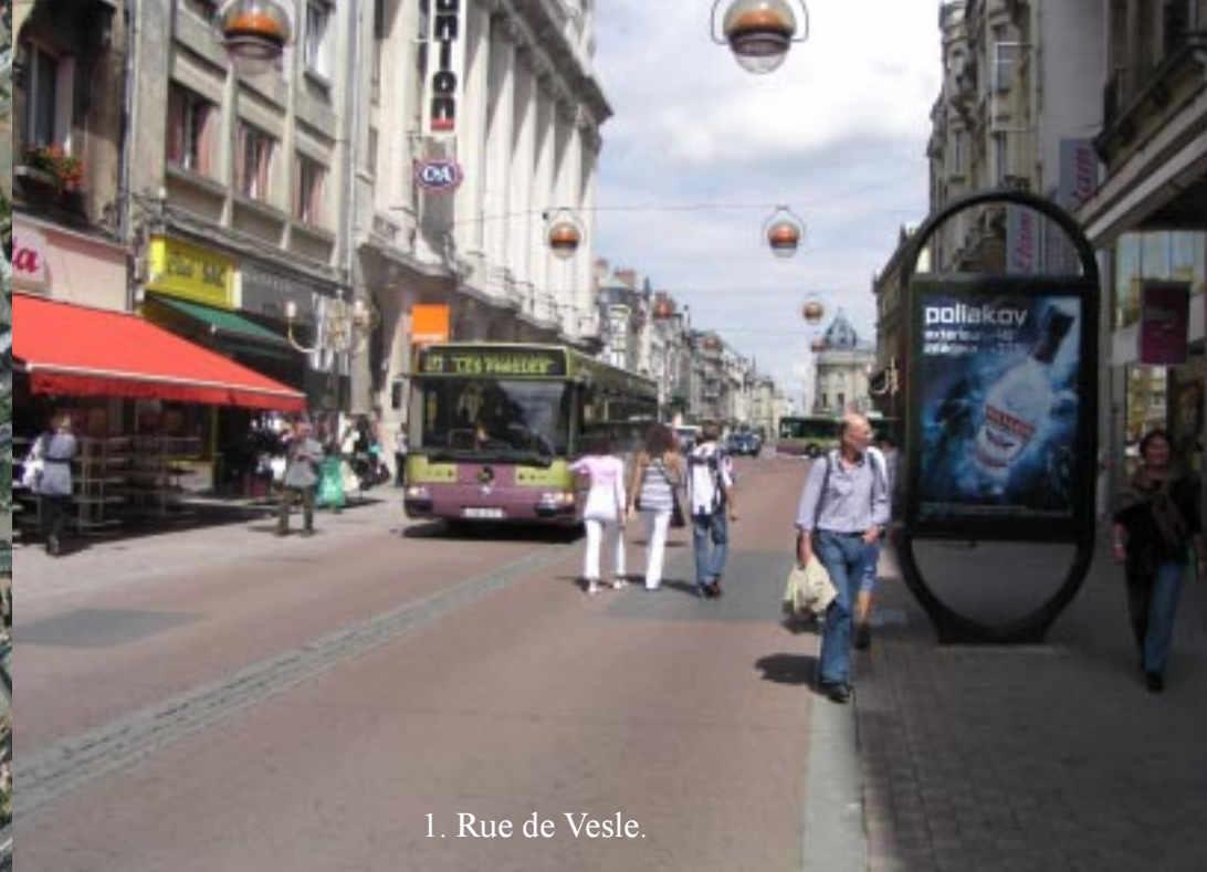
1. Rue de Vesle.

De camperplaats verlaten we via een parkje en komen op de Rue du C. el Fabien. We steken de bruggen van Vesle en het Canal de l'Aisne à la Marne over en lopen in rechte lijn door de winkelstraat Rue de Vesle tot een zone voor voetgangers en bellende stapvoets rijdende bussen.