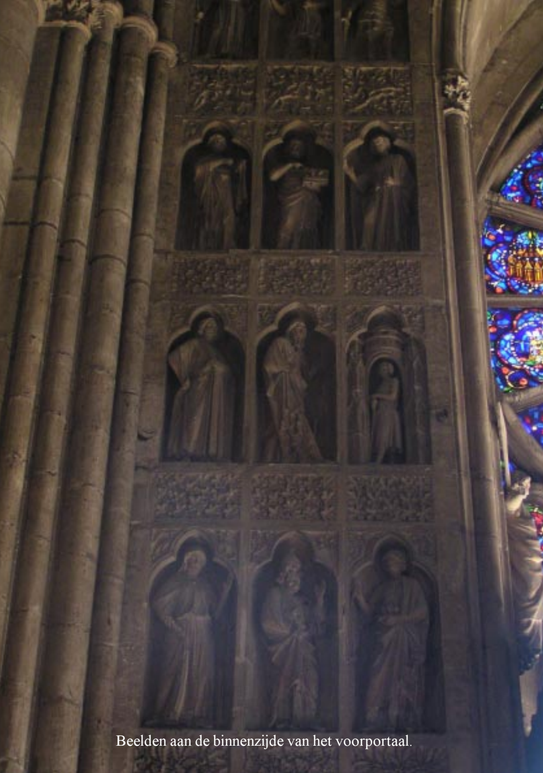
Beelden aan de binnenzijde van het voorportaal.