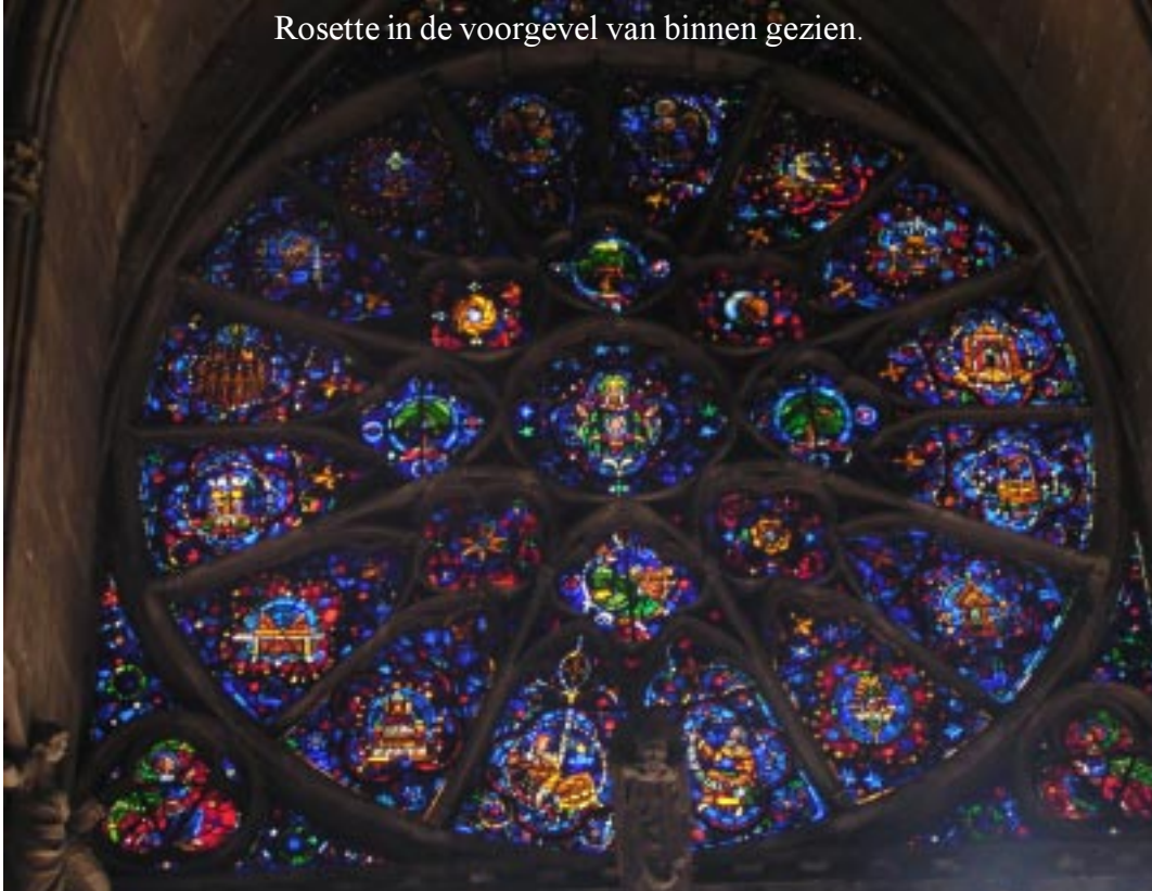
Rosette in de voorgevel van binnen gezien.