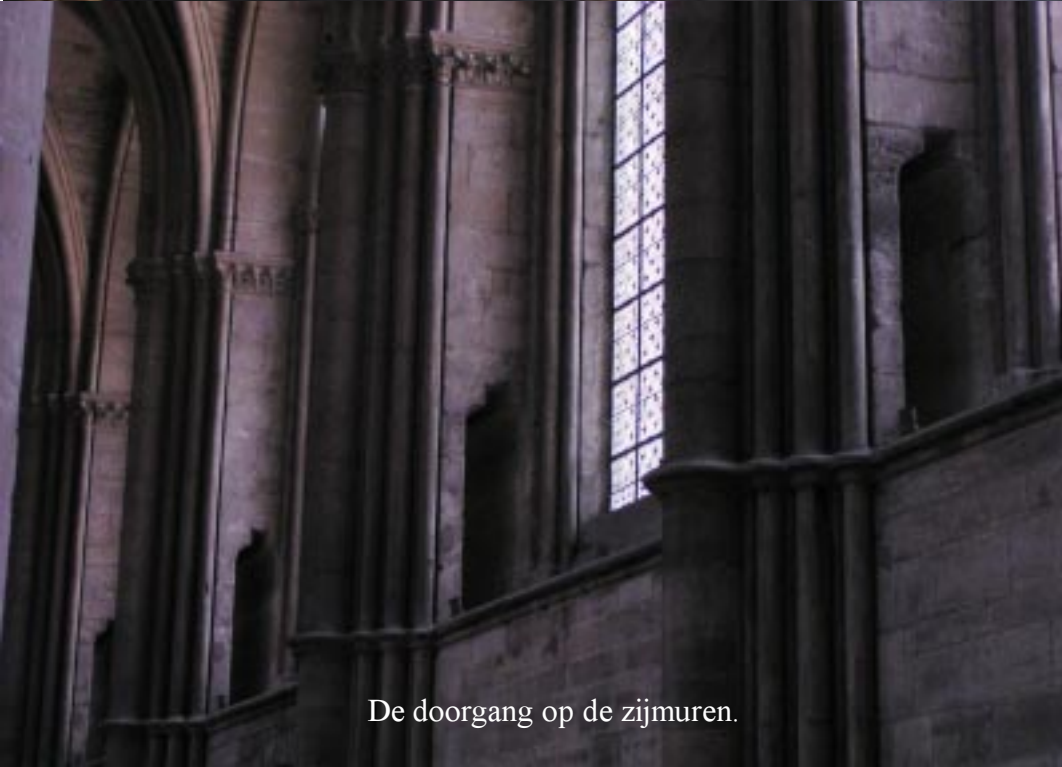
De doorgang op de zijmuren.