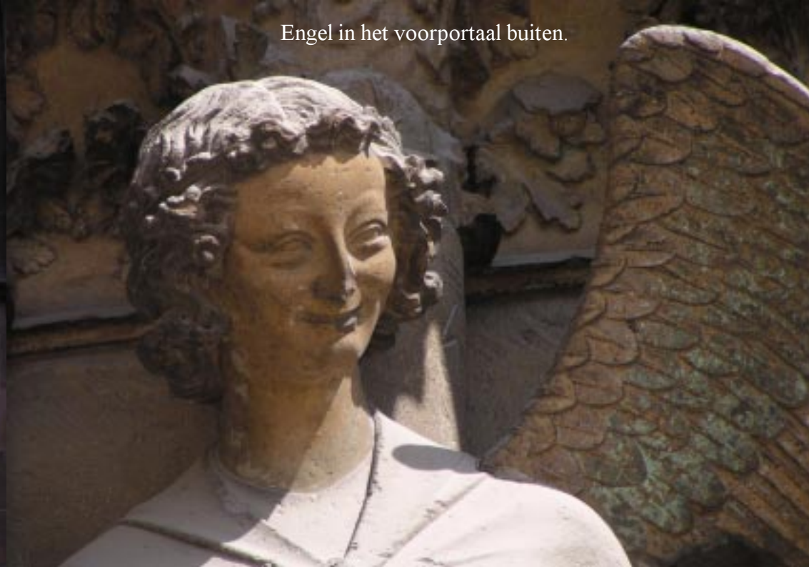
Engel in het voorportaal buiten.