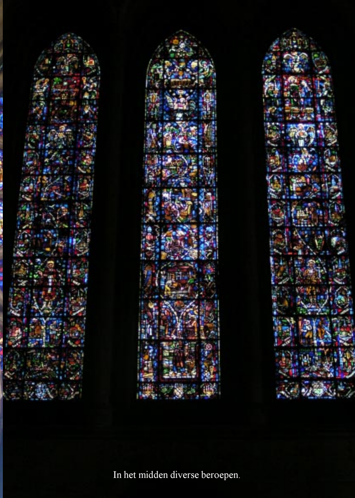
In het midden diverse beroepen.