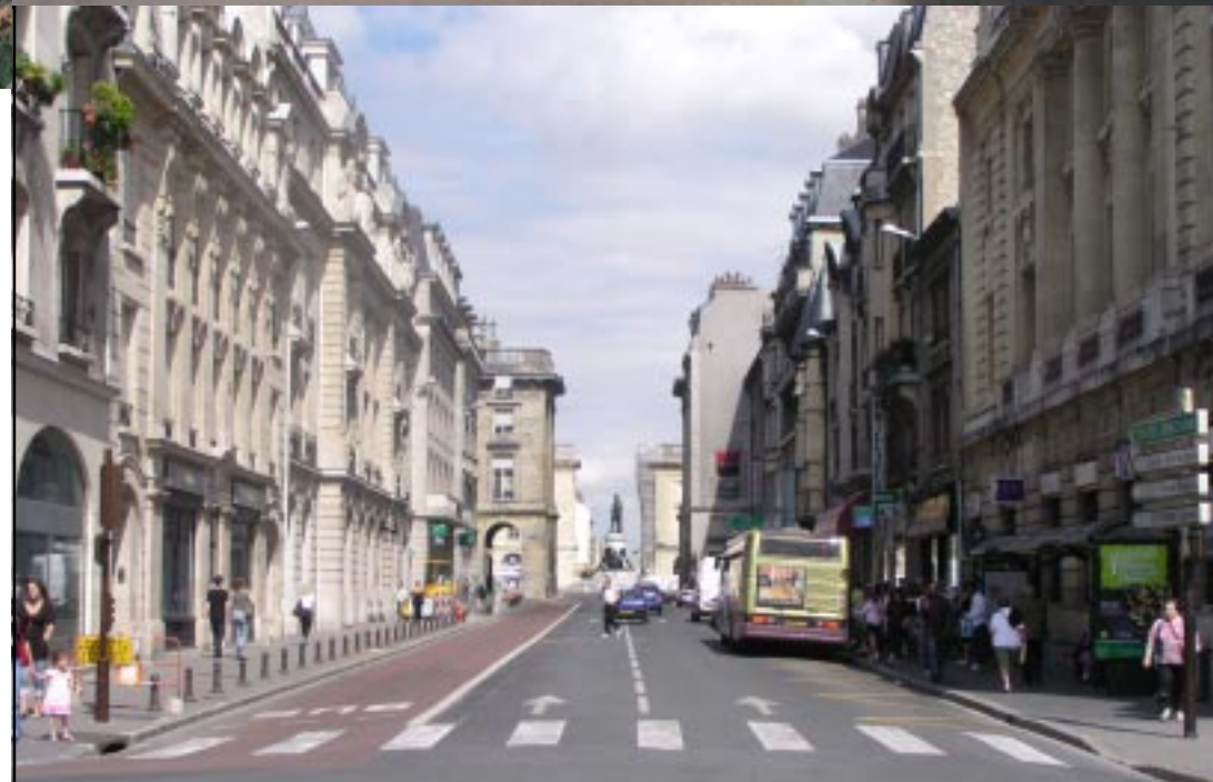
2. Verderop Louis XV op zijn Place Royale.

Reims is een grote stad en dat levert na een maand platteland een soort culture-shock op. Al dat volk in vreemde kostuums dat telefoon staat te spelen, de zwervers, de hangjeugd. Rechts zien we een aardig gebouw: Het Palais de Justice. Vooruit in de verte het Place Royale met ogenschijnlijk een groot standbeeld (Louis XV) midden op de weg.