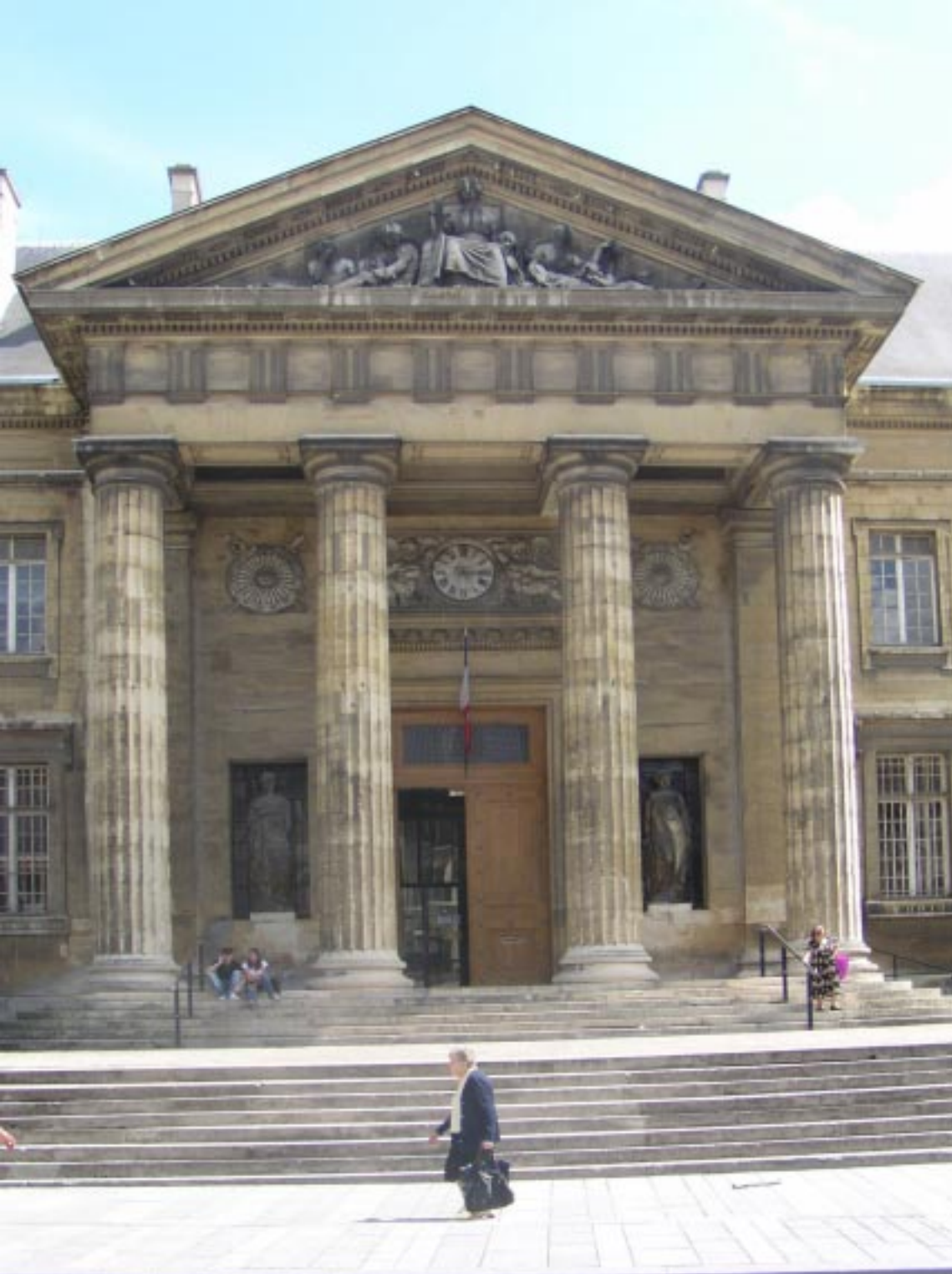
3. Palais de Justice.