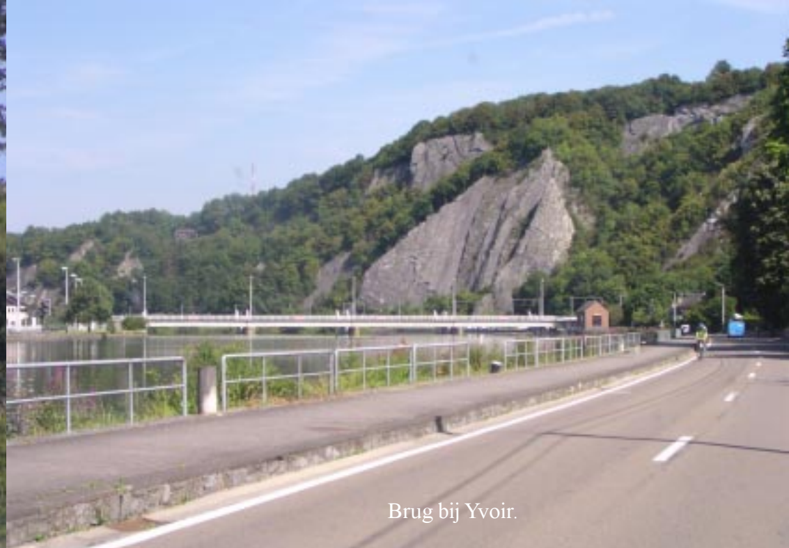
Brug bij Yvoir.