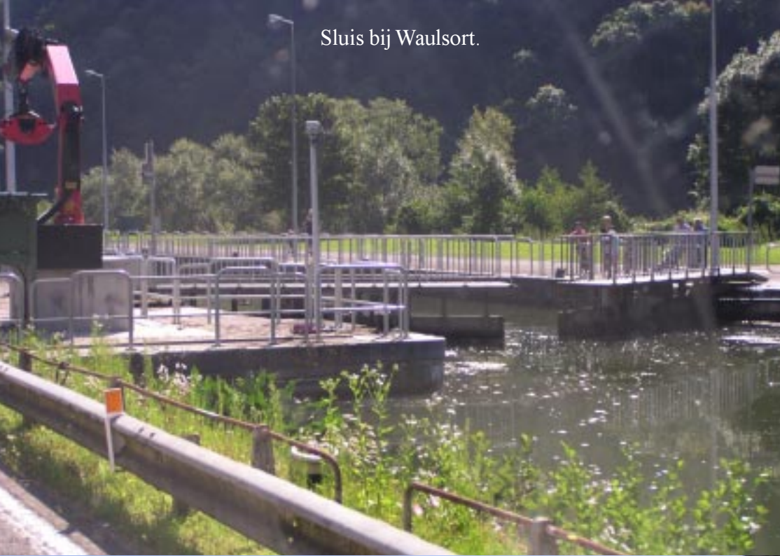
Sluis bij Waulsort.