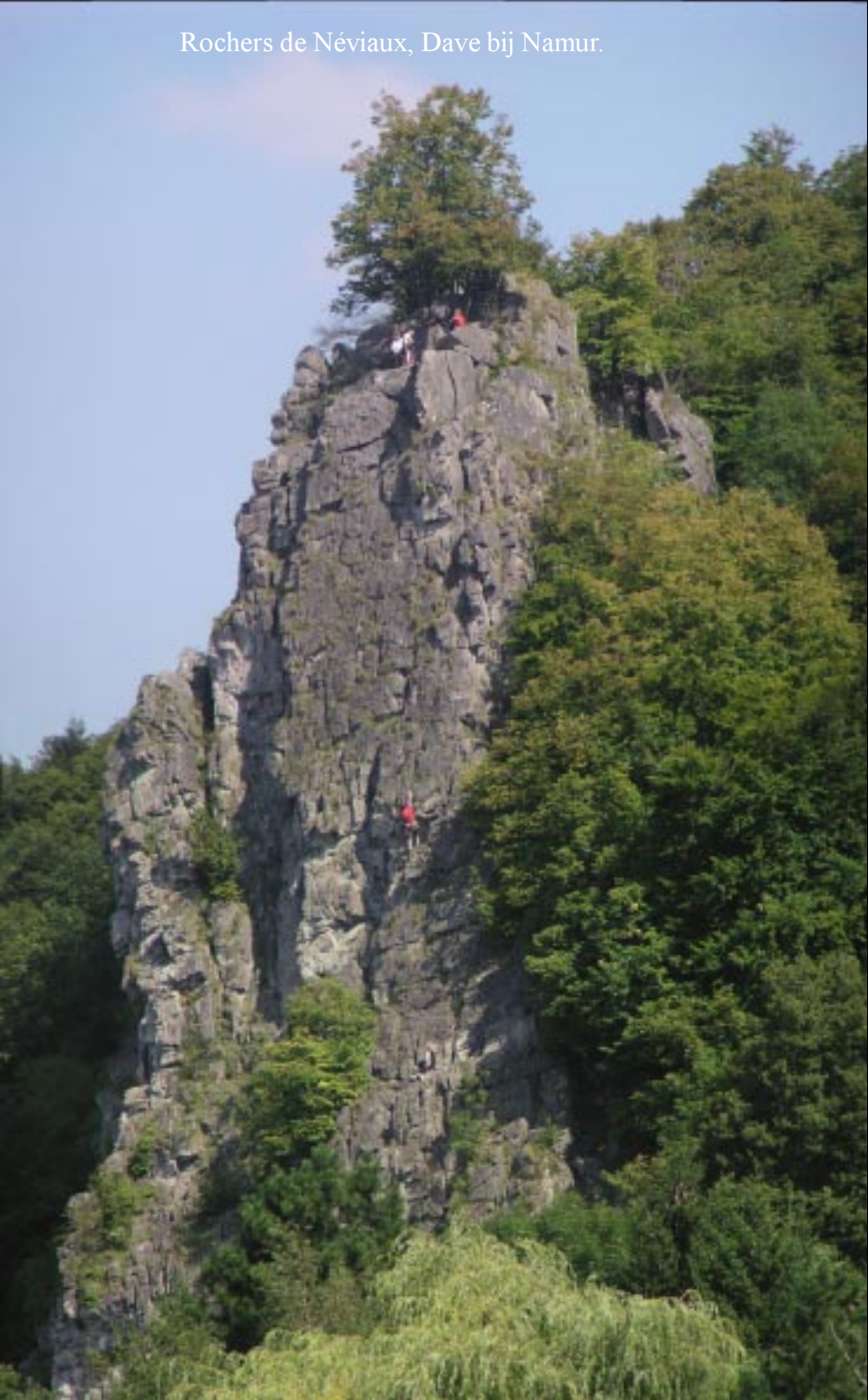
Rochers de Néviaux, Dave bij Namur.