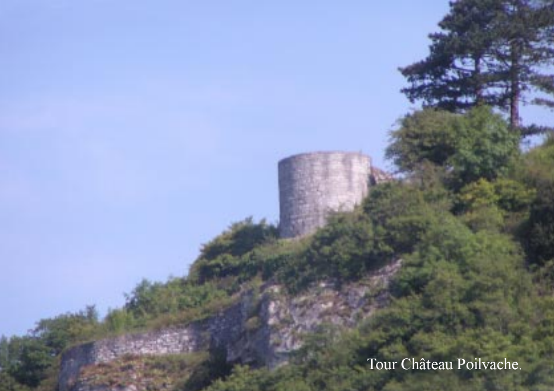
Tour Château Poilvache.