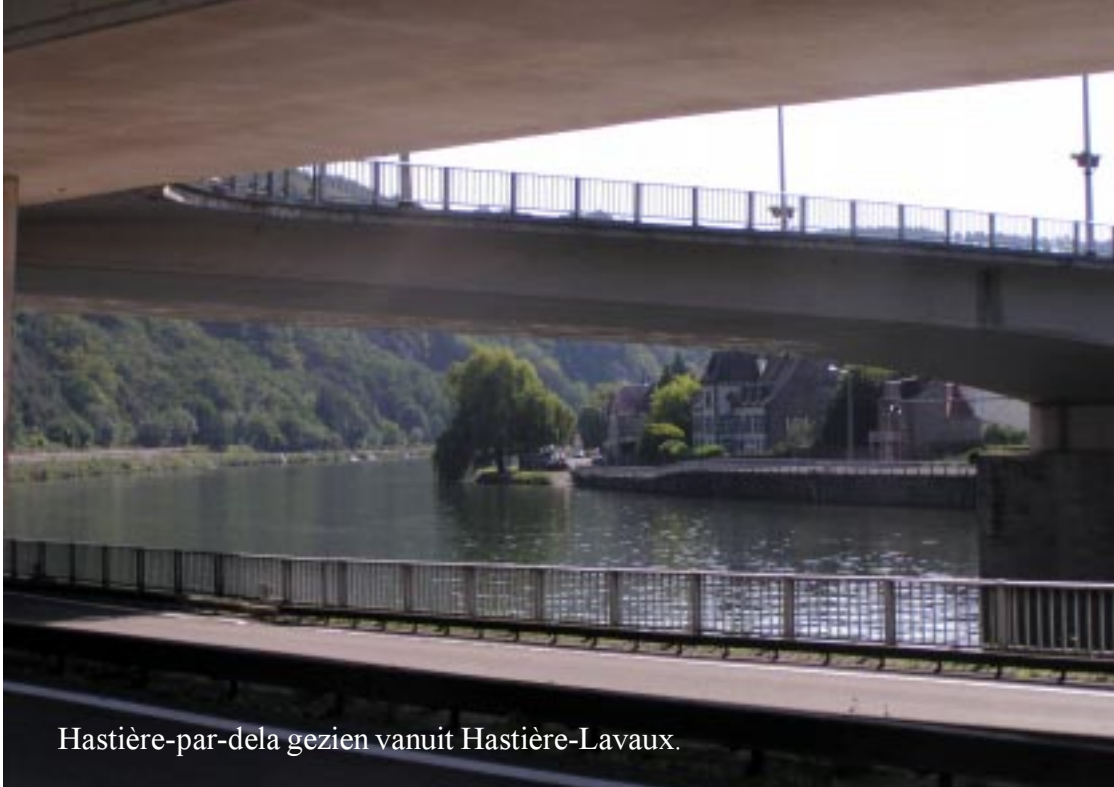
Hastière-par-dela gezien vanuit Hastière-Lavaux.