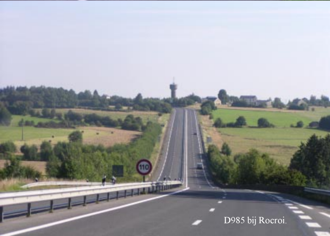
D985 bij Rocroi.

De D985 naar Rocroi gaat door schitterende bossen. Dit wordt niet vooroo niets de Franse Ardennen genoemd.