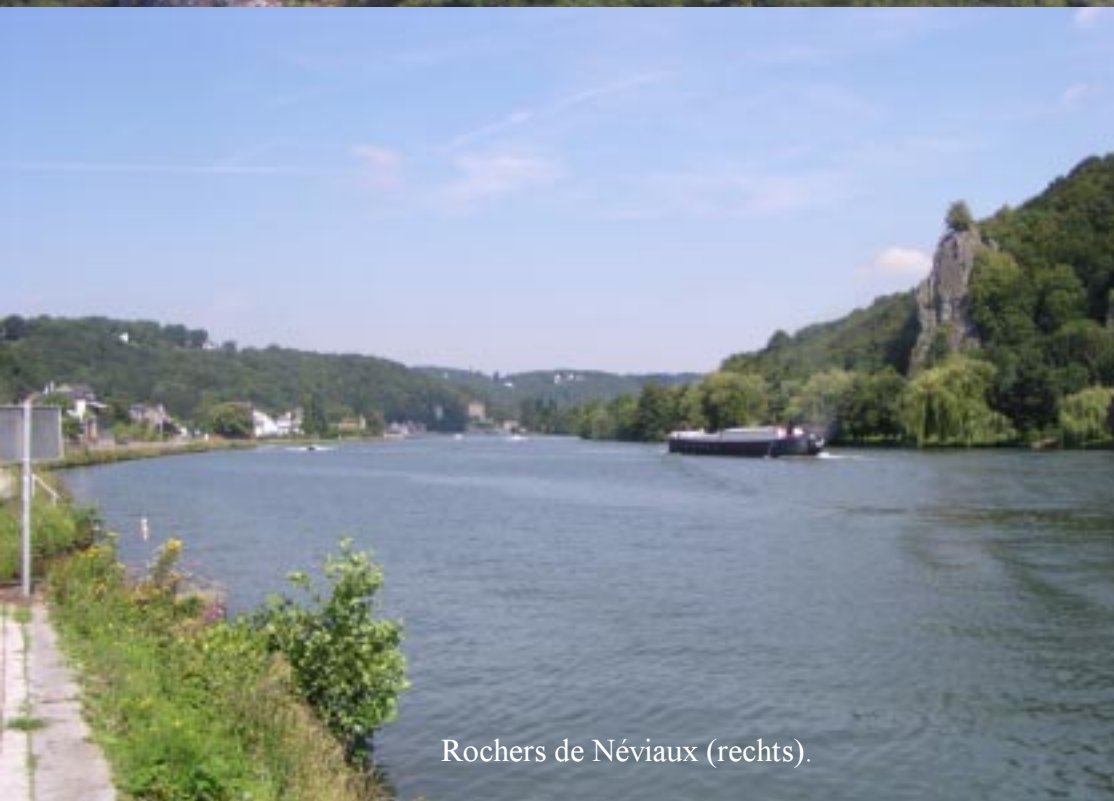
Rochers de Néviaux (rechts).