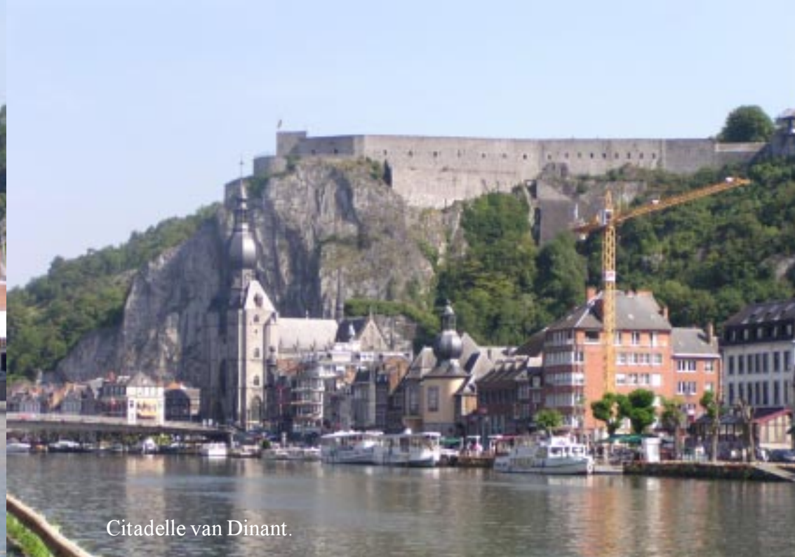
Citadelle van Dinant.