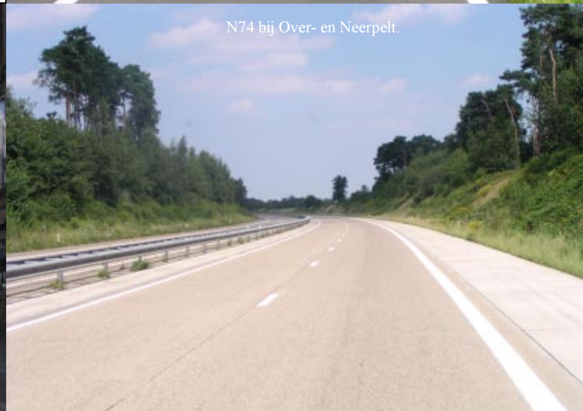
N74 bij Over- en Neerpelt.