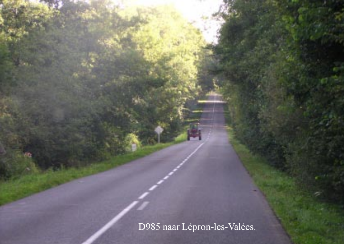
D985 naar Lépron-les-Valées.