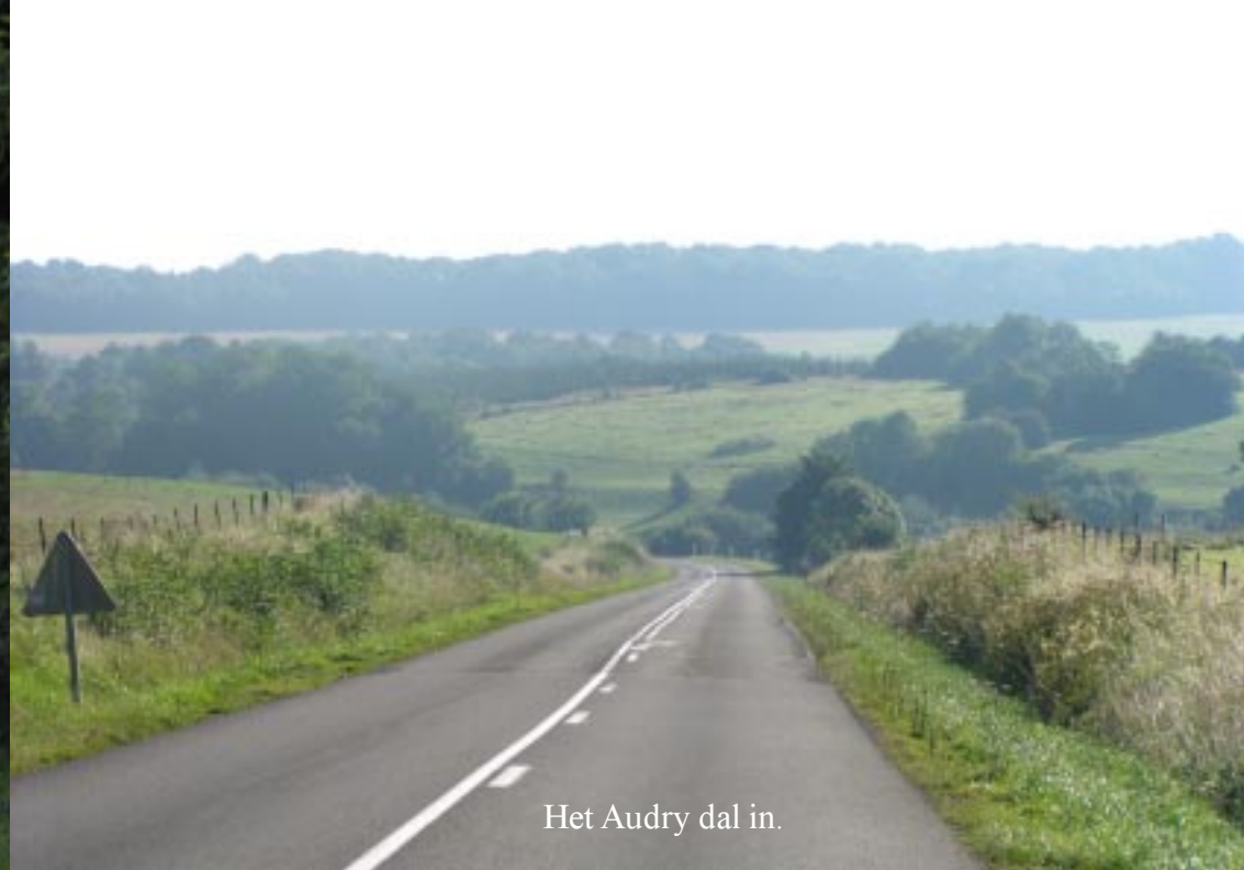
Het Audry dal in.