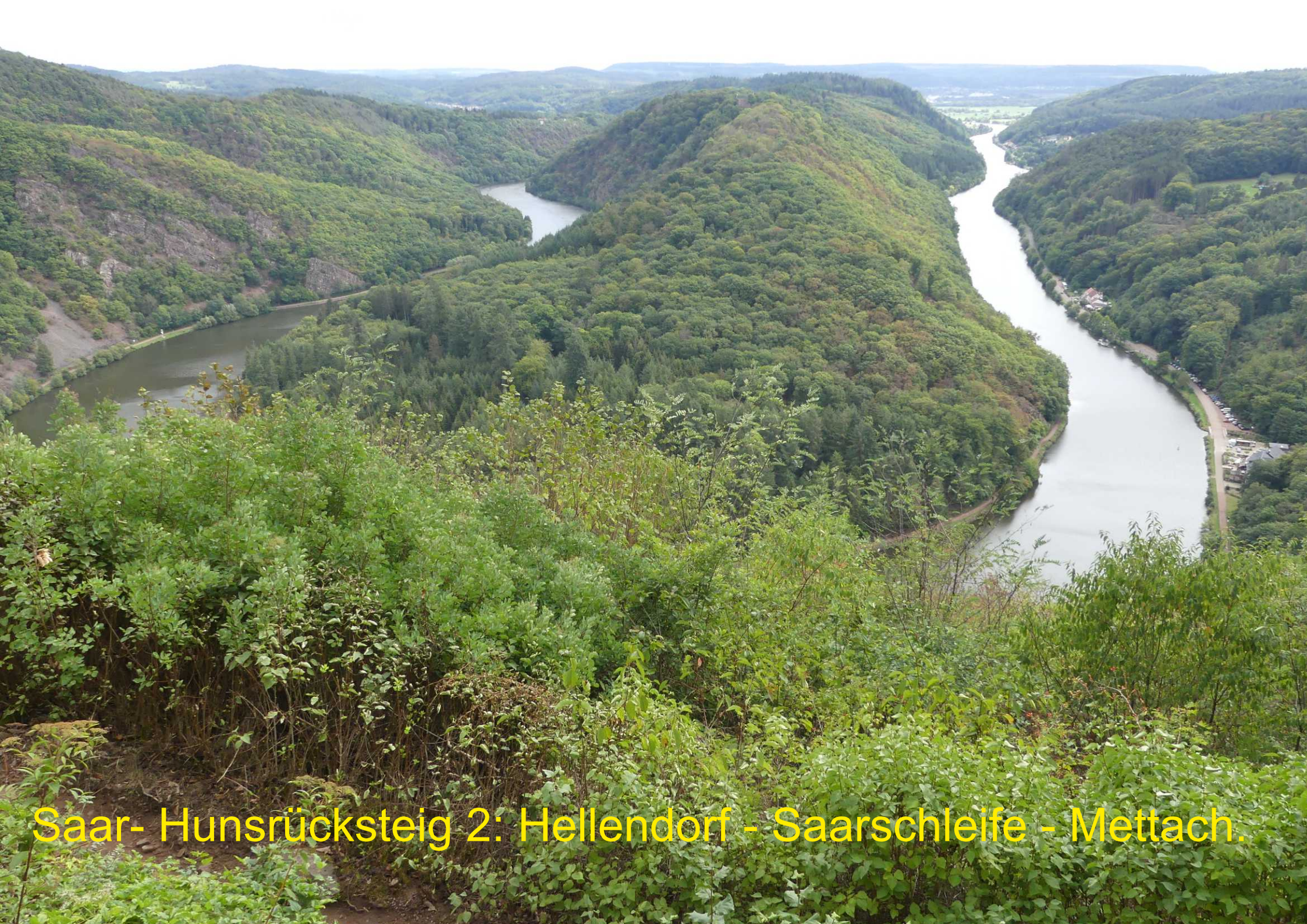
Saar- Hunsrücksteig 2: Hellendorf - Saarschleife - Mettach.