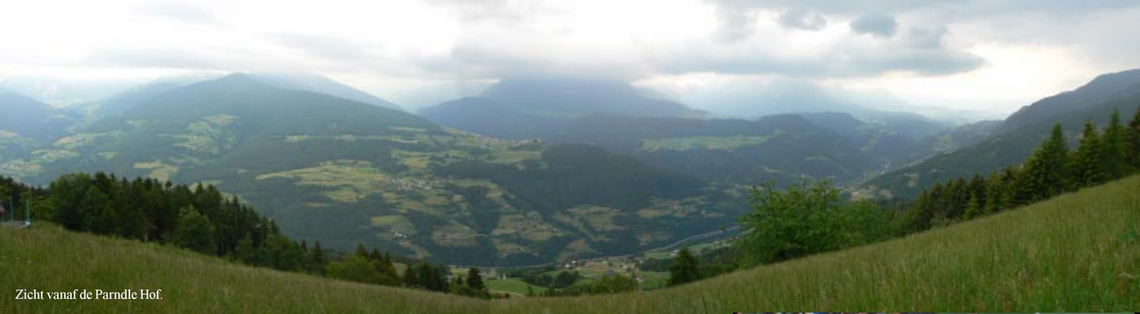
Zicht vanaf de Parndle Hof.

Nauwelijks staan we of het begint te regenen. We hebben een enorm aantal tv-zenders op de pc: 59! Buiten de Italiaanse, ook Oostenrijkse en een Beierse! Op de ORF kunnen we dan om 18.00 zien hoe Nederland zijn 1e wedstrijd in het EK met 0-1 van Denemarken verliest. Ondanks vele kansen geen goals gemaakt. Om 20.45 kijken we dan ook maar Duitsland-Portugal (1-0). Buiten is het droog geworden en zien we in de verte nog enkele hoge toppen enigszins tevoorschijn komen.