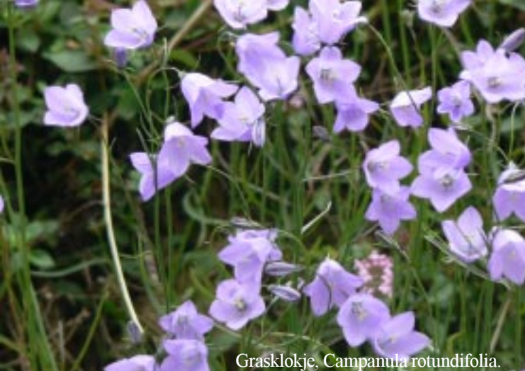
Grasklokje, Campanula rotundifolia .

Om 10.40 bereiken we de andere (onbemande) kassa. Via wandeling 25 over "almen" naar Pardaun en Stange en terug naar ons ZippII.