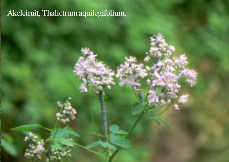
Akeleiruit, Thalictrum aquilegifolium .