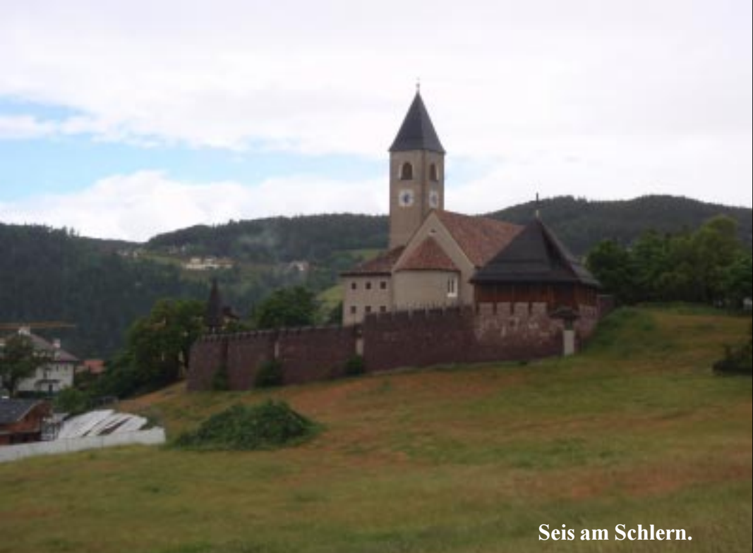
Seis am Schlern.

Helaas is alles nog tot half drie à drie uur dicht. We zien een aparte Heilig Herzkirche en vele pensions. Maar ook de Santer Spitze, een grillig spitse bergtop, die steil boven het dorp uittorent. 14.00 terug voor de lunch.