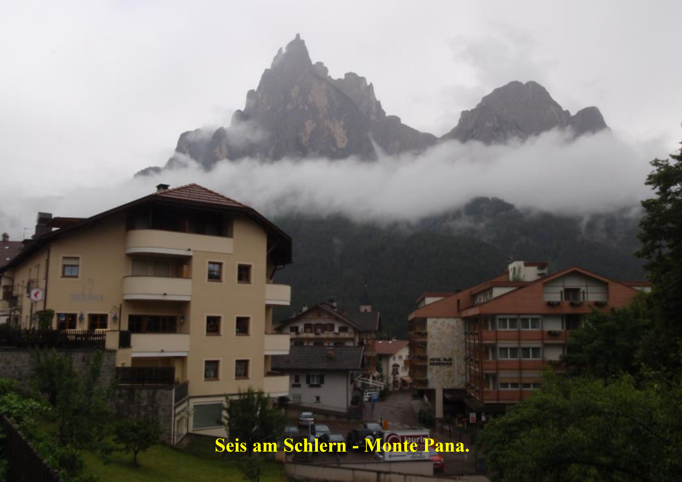
Seis am Schlern - Monte Pana.