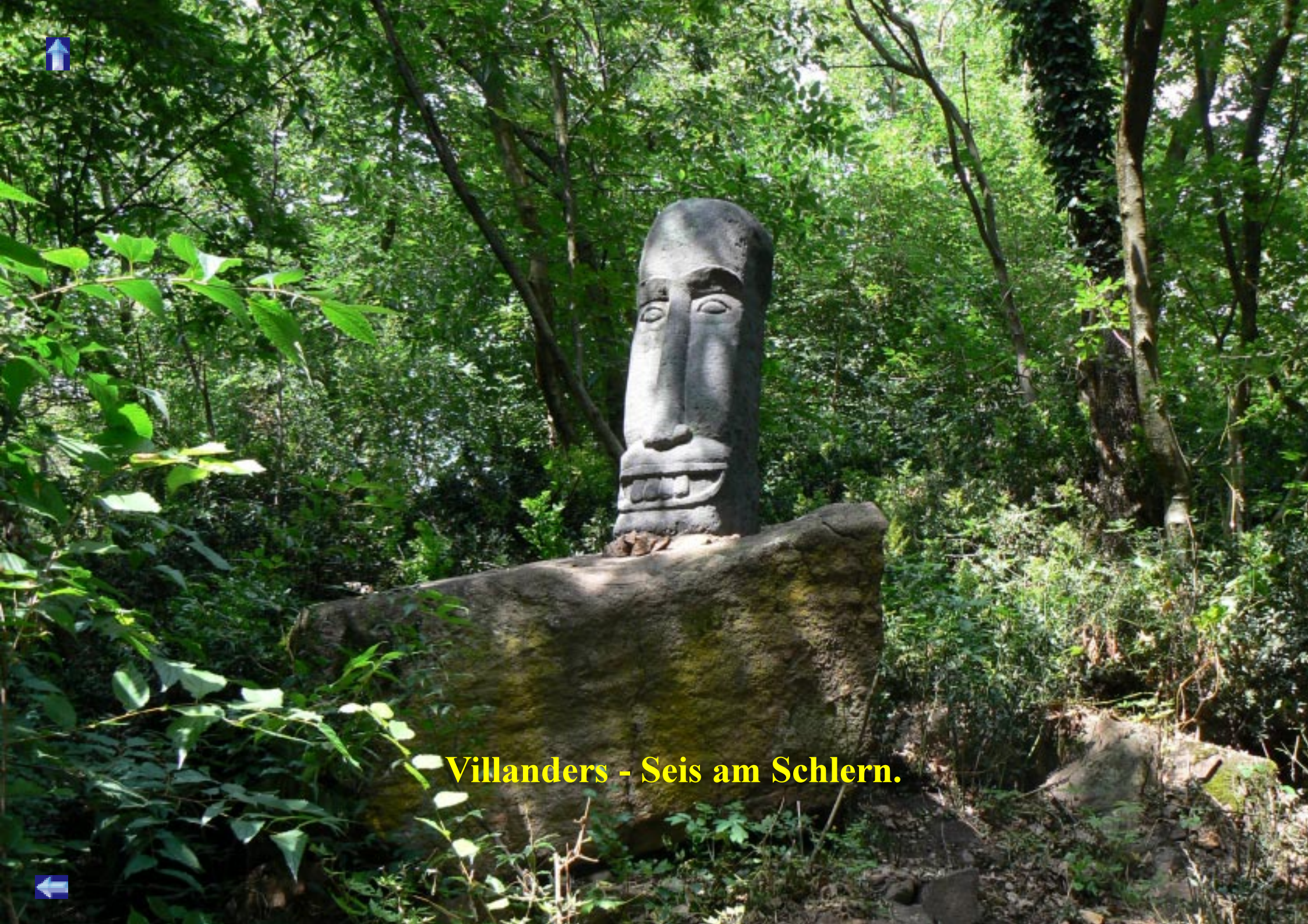
Villanders - Seis am Schlern.