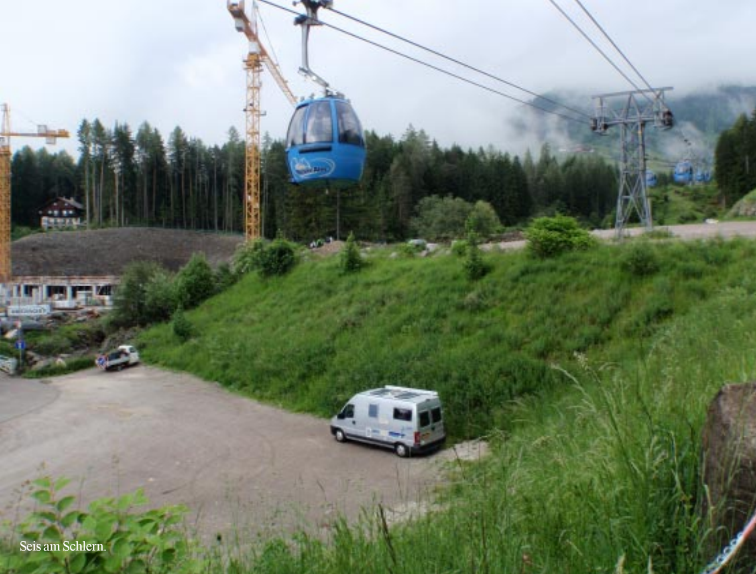
Seis am Schlern.