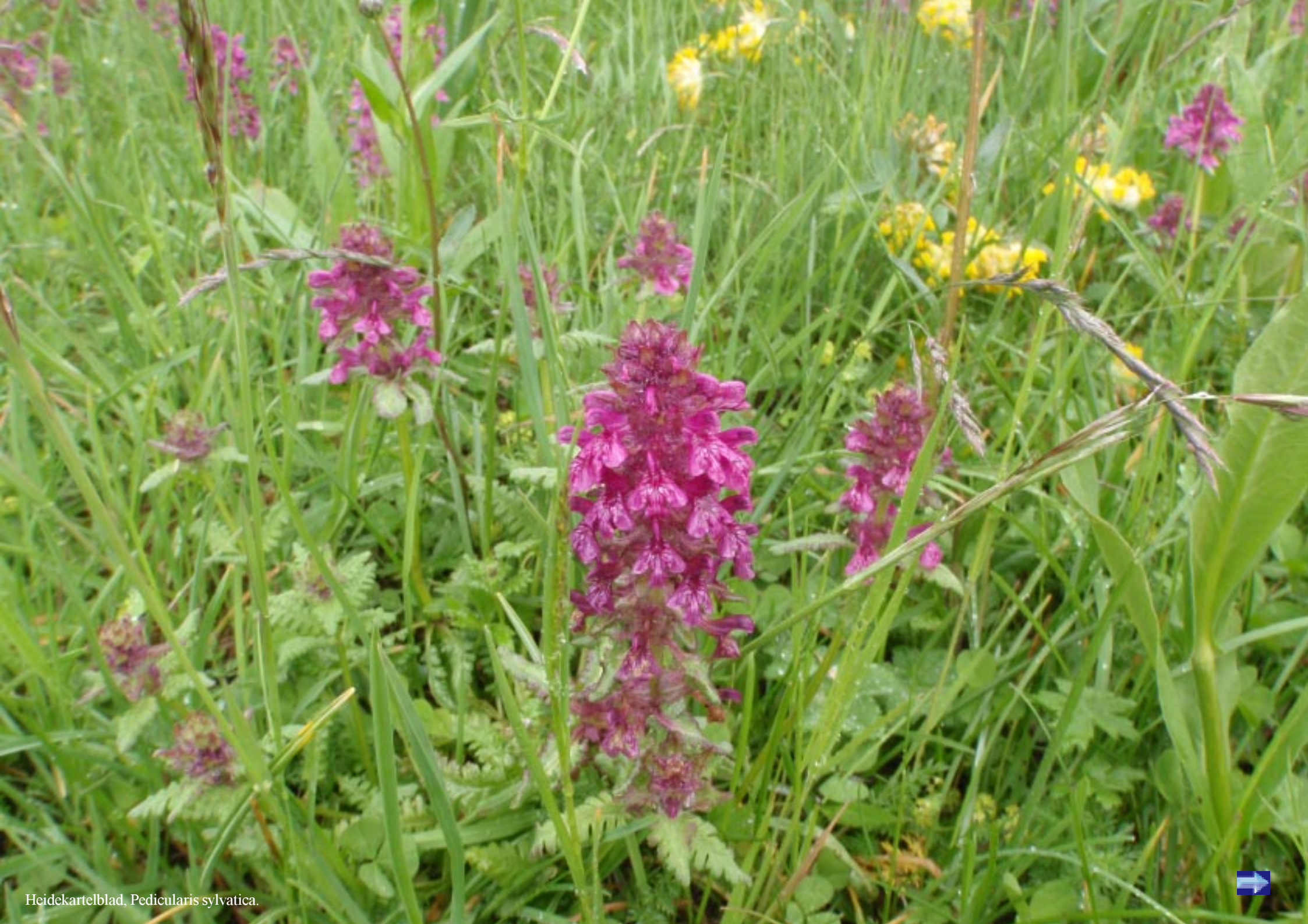
Heidekartelblad, Pedicularis sylvatica .