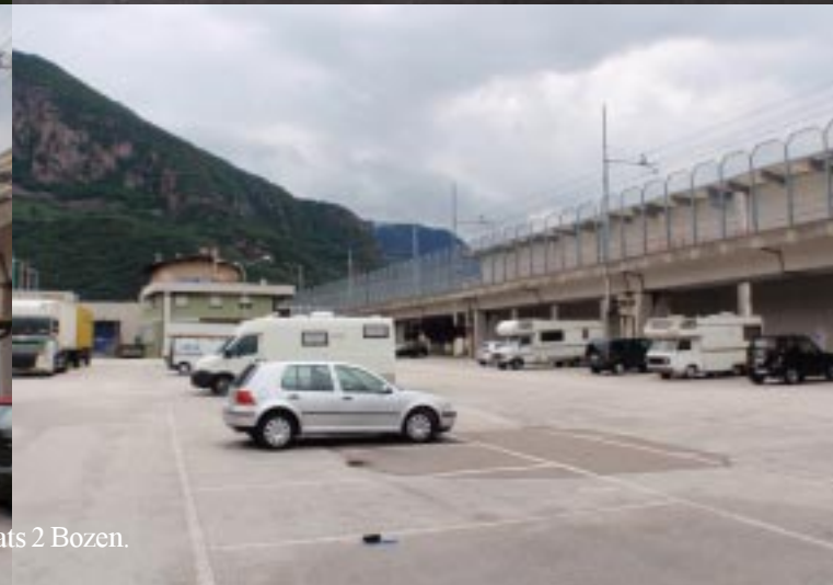
Camperplaats 2 Bozen.