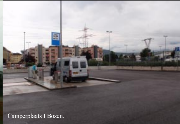
Camperplaats 1 Bozen.