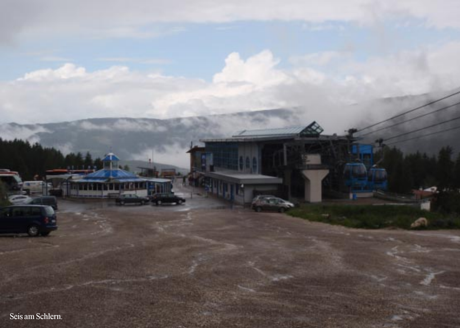
Seis am Schlern.