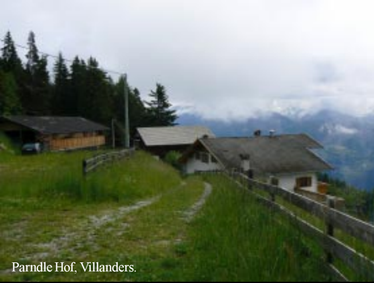
Parndle Hof, Villanders.