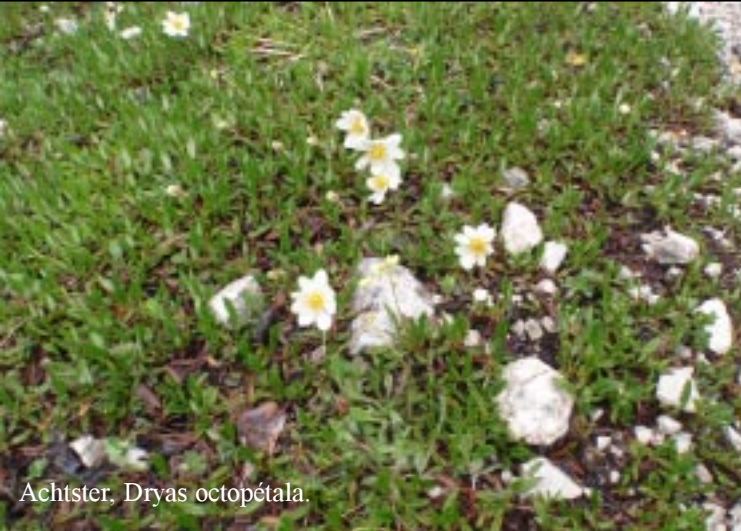
Achtster, Dryas octopétala .