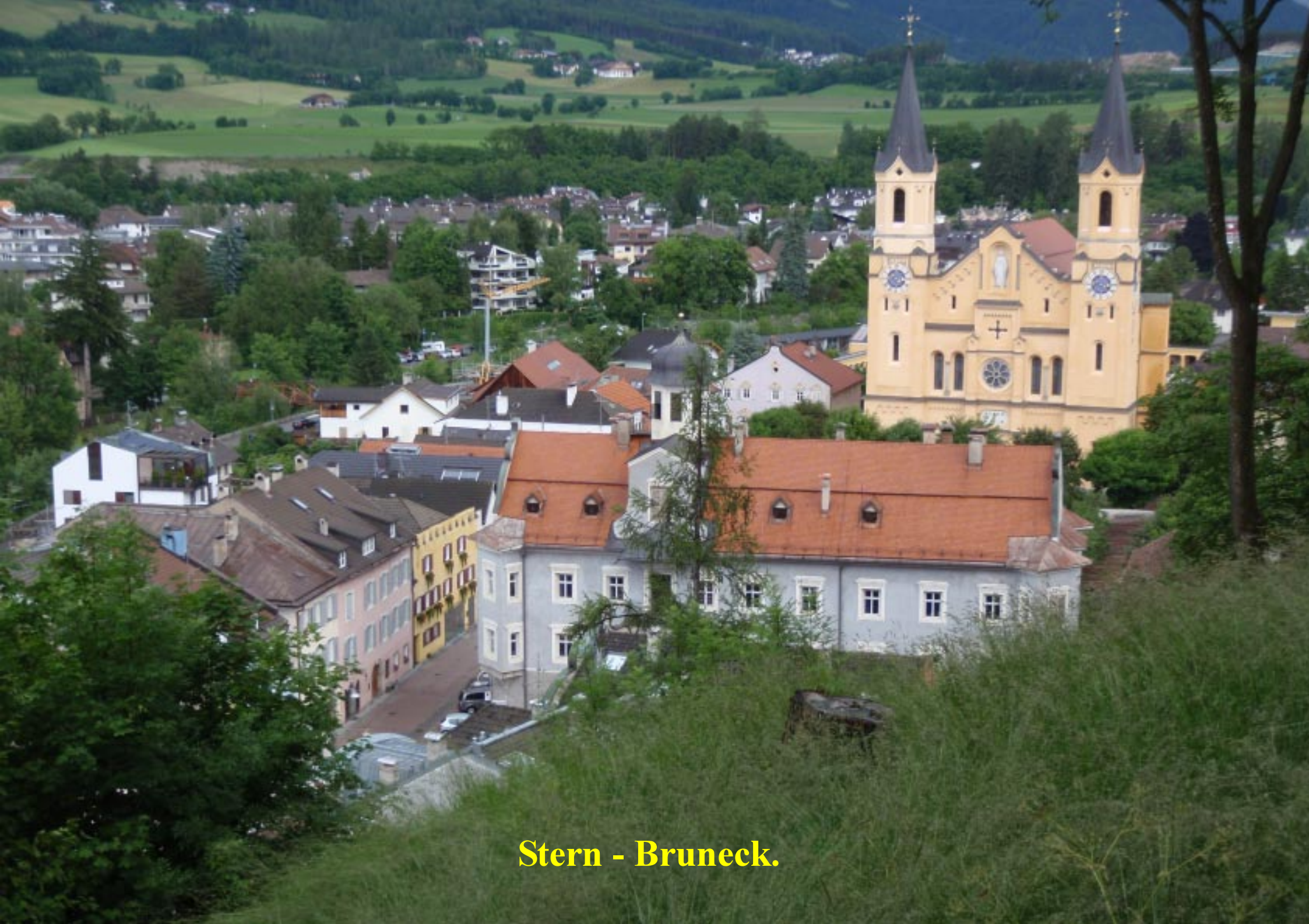
Stern - Bruneck.