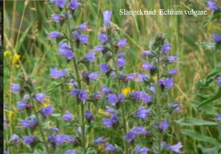
Slangekruid, Echium vulgare.