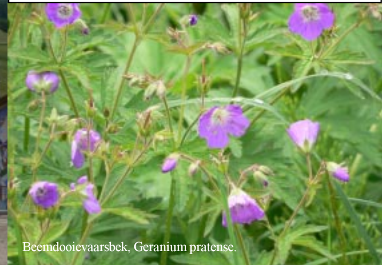
Beemdooievaarsbek, Geranium pratense .