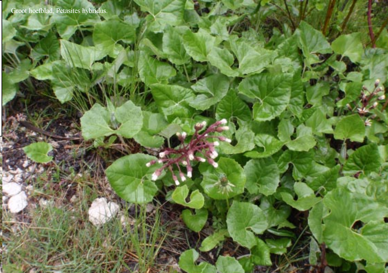
Groot hoefblad, Petasites hybridus .

Wij gaan weer bergop naar (11.30) Kreuzboden (Plan de Gralba), dat een echt wintersportdorp is met o.a. de skilift Piz Sella. De parking-annex camperplaats wordt nu voor een deel in beslag genomen door rioolpijpen of waterleidingspijpen. Naast de parking ligt nog sneeuw! We zitten dan ook al weer op 1793 m. 11.55 door naar een cache aan de SS244 en bij een hoge smalle waterval. Rechts ligt een rij hoge kale toppen gedeeltelijk in de wolken gepakt.