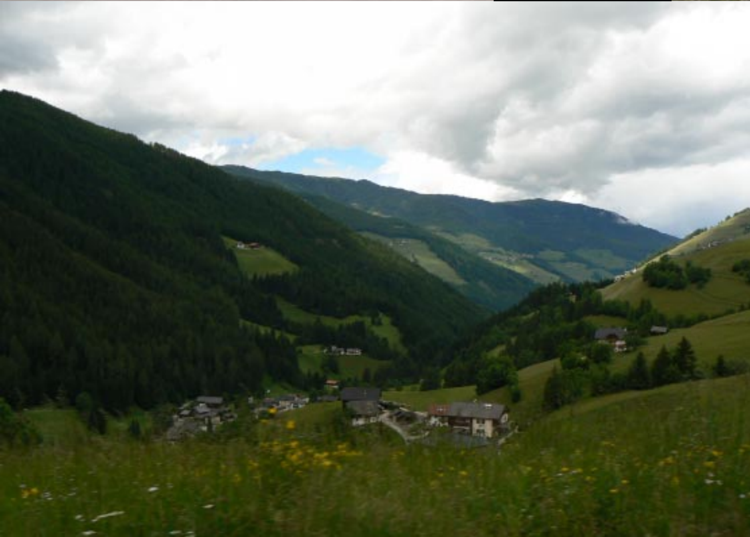
St. Vigil in Enneberg.