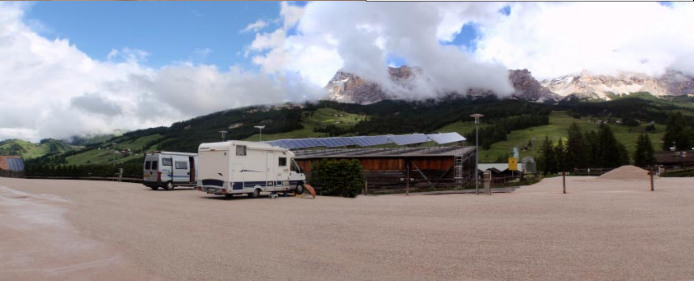
Camperplaats Odlina, Stern.