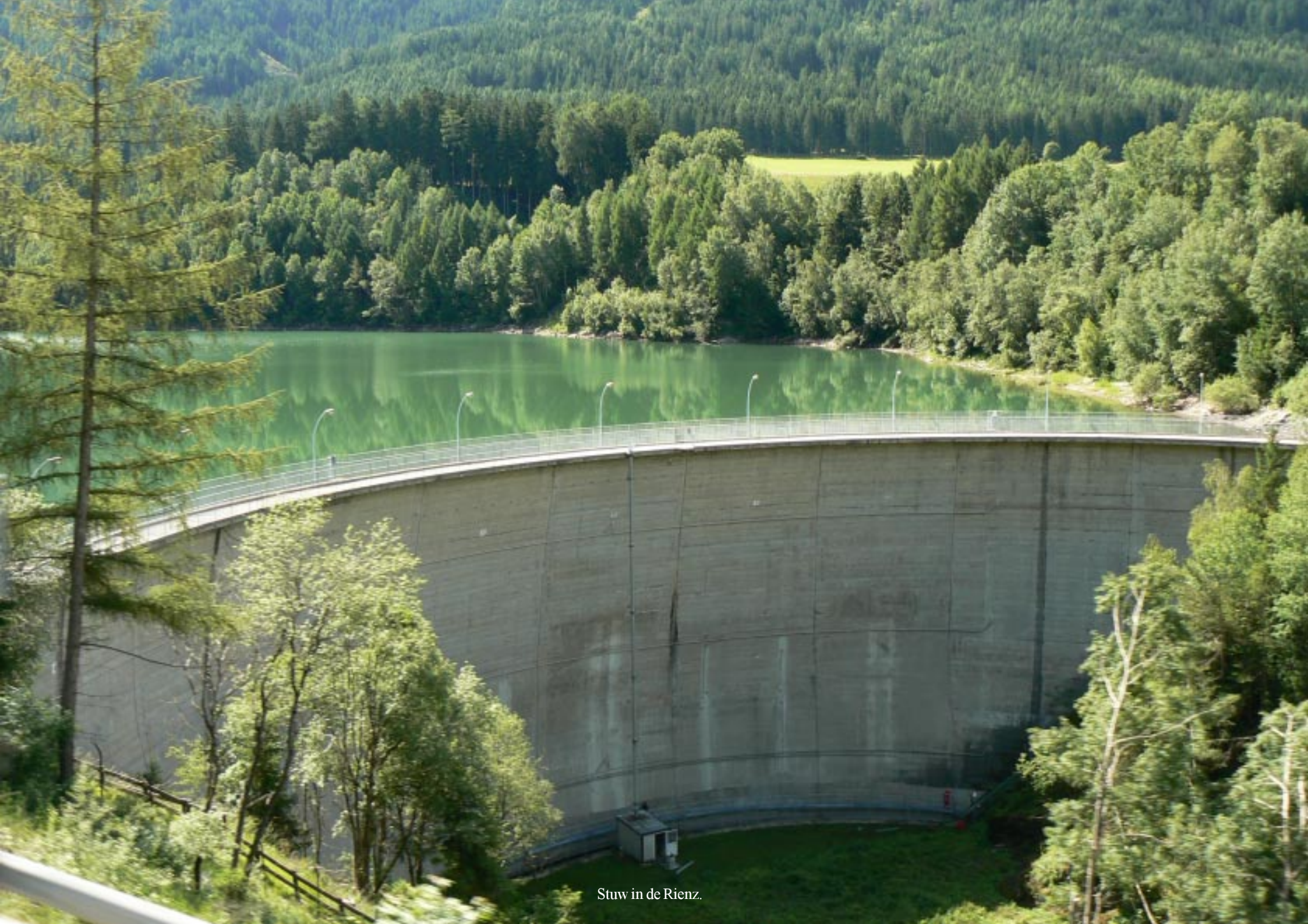
Stuw in de Rienz.