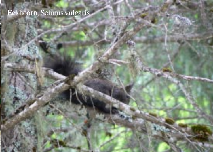
Eekhoorn, Sciurus vulgaris