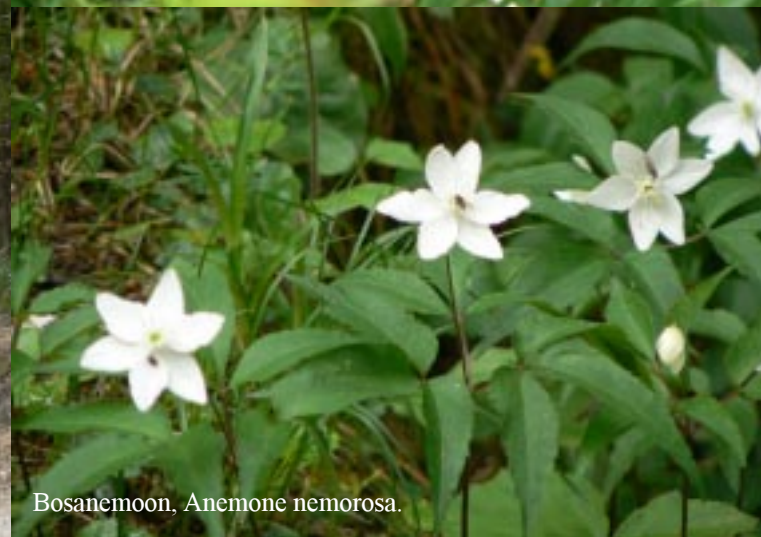
Bosanemoon, Anemone nemorosa .