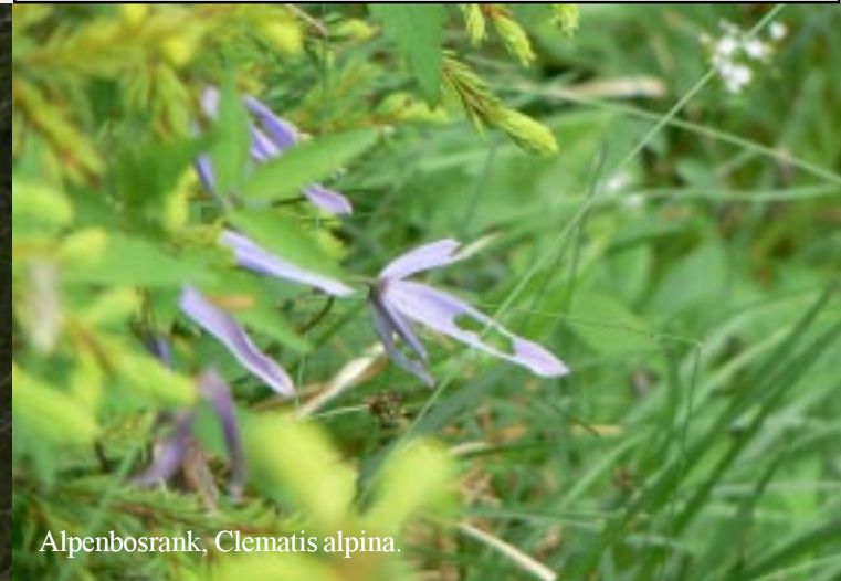
Alpenbosrank, Clematis alpina .