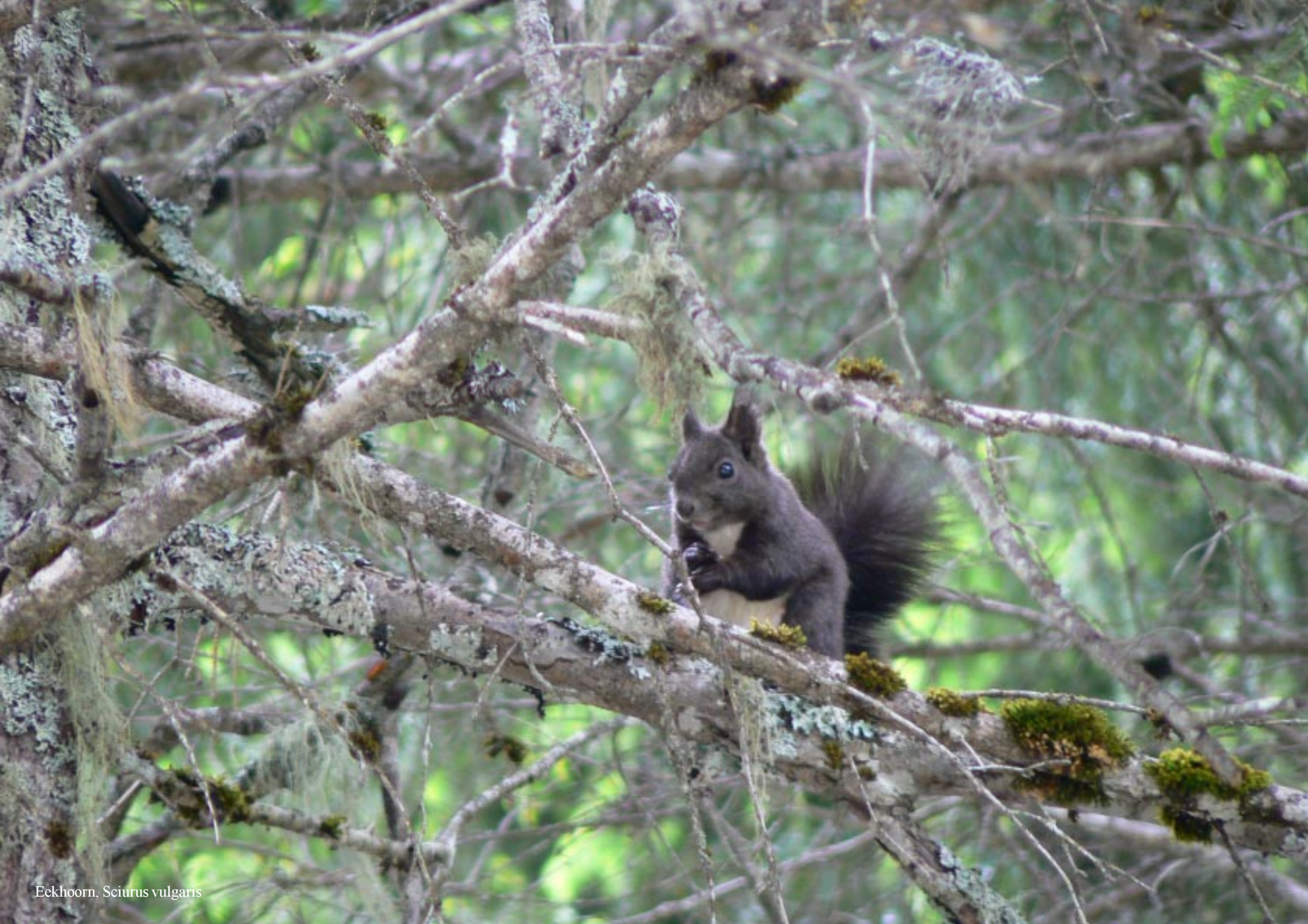
Eekhoorn, Sciurus vulgaris