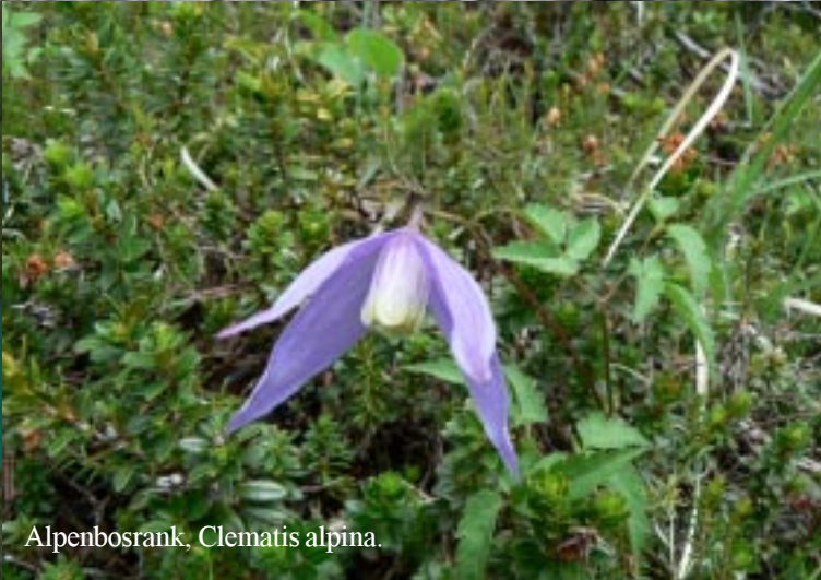
Alpenbosrank, Clematis alpina .