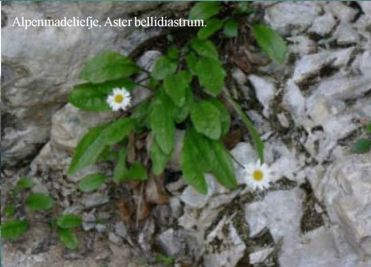
Alpenmadeliefje, Aster bellidiastrum .