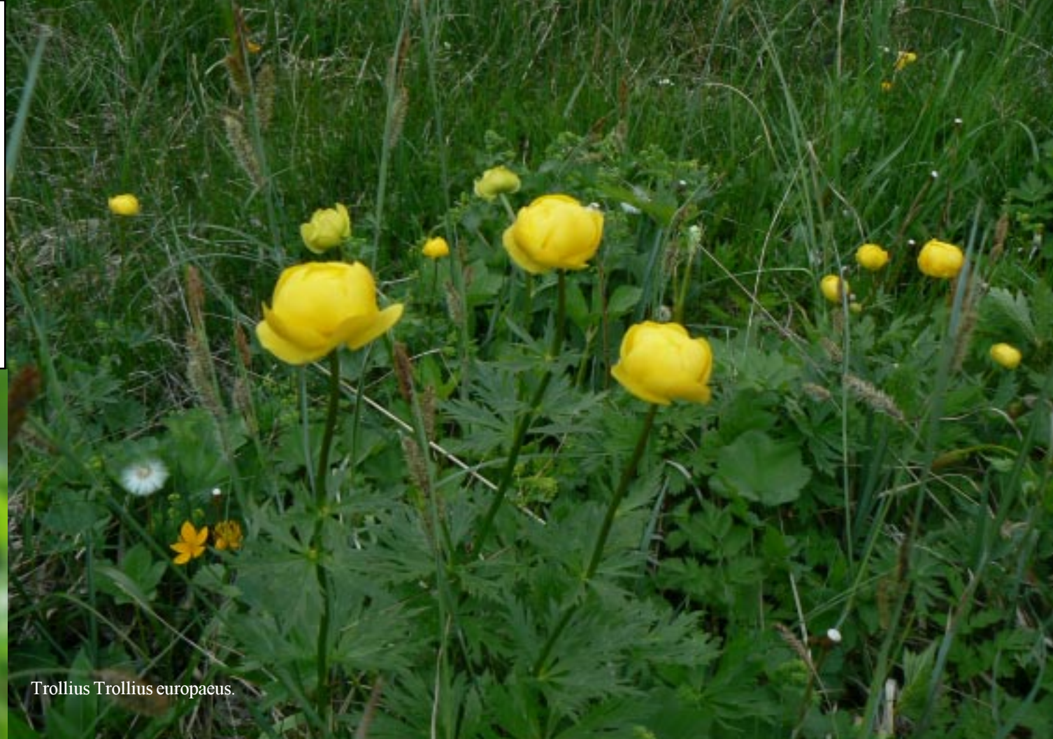
Trollius Trollius europaeus.