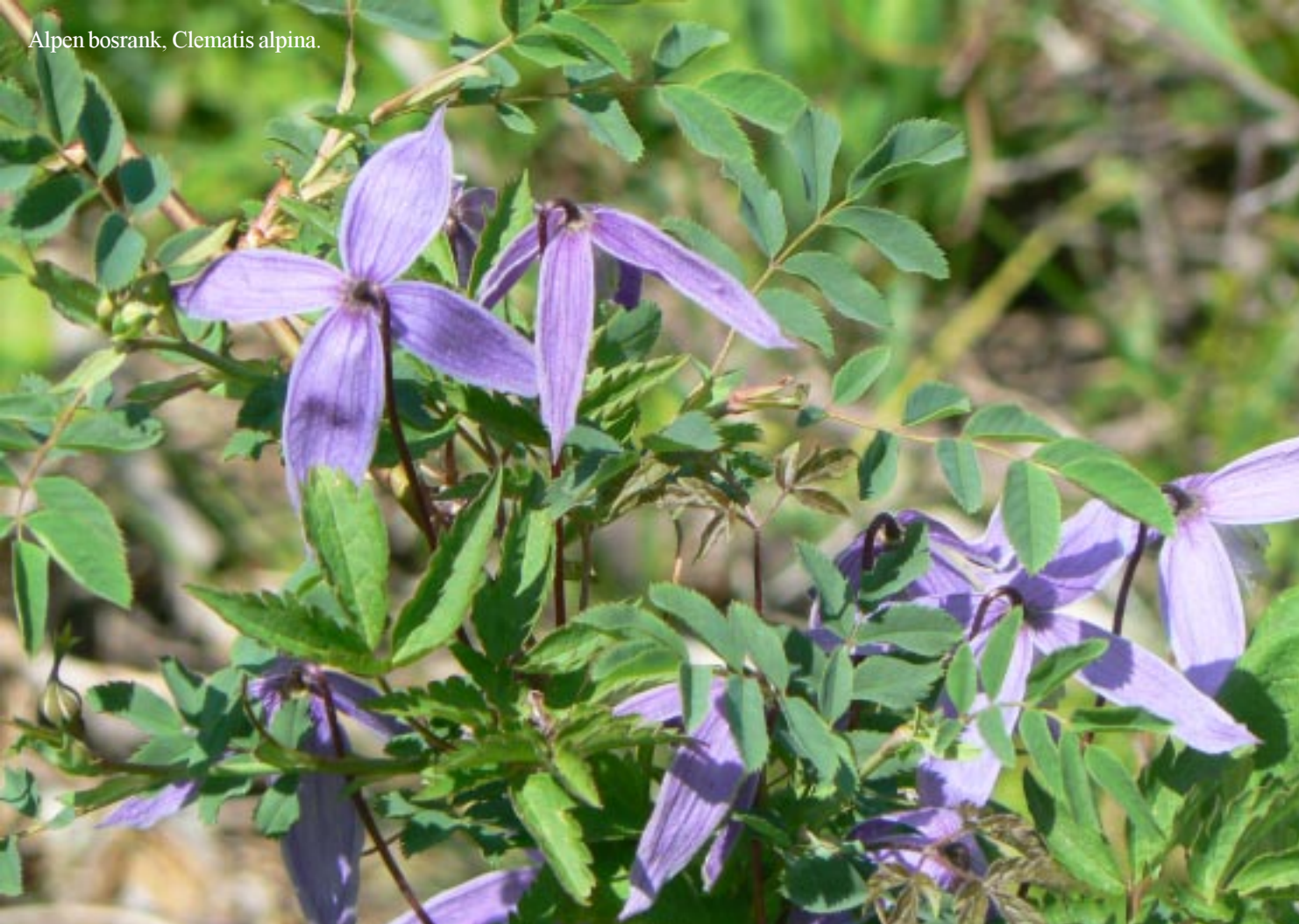
Alpen bosrank, Clematis alpina.

We staan opnieuw op een schitterende plek met puik zicht op de hoge en grillige toppen om onours heen. Helaas houdt dat ook weer in dat er DVB-t bereik is, vanavond opnieuw geen voetbal.