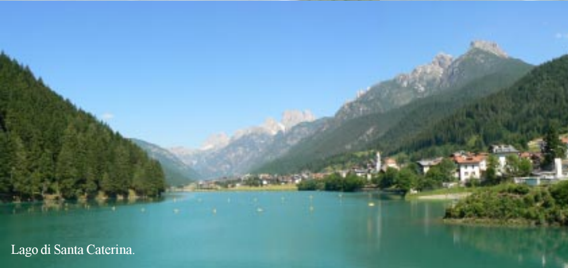
Lago di Santa Caterina.