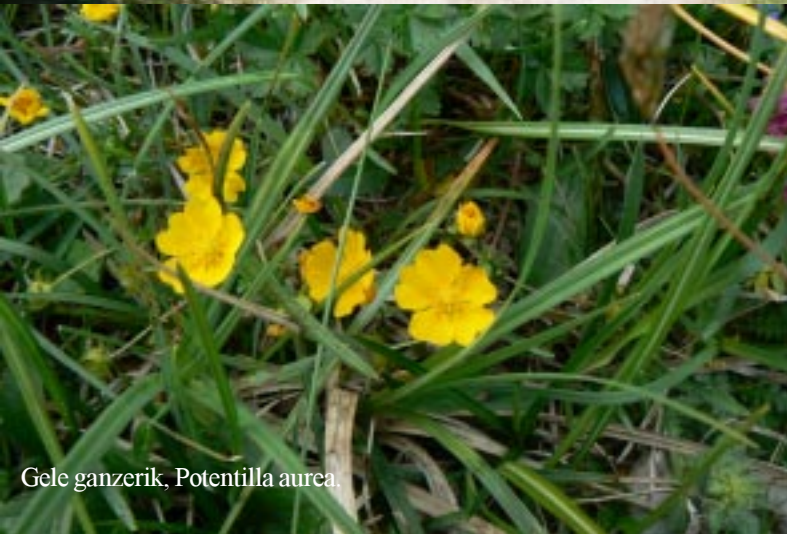
Gele ganzerik, Potentilla aurea .