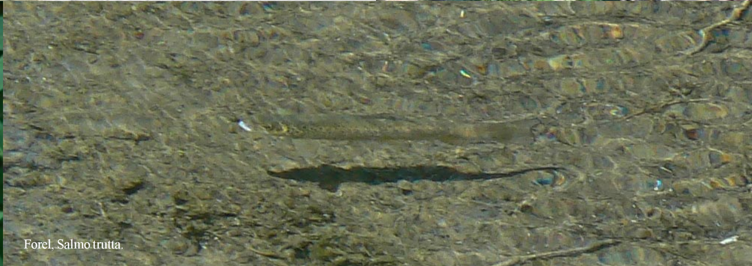
Forel, Salmo trutta.