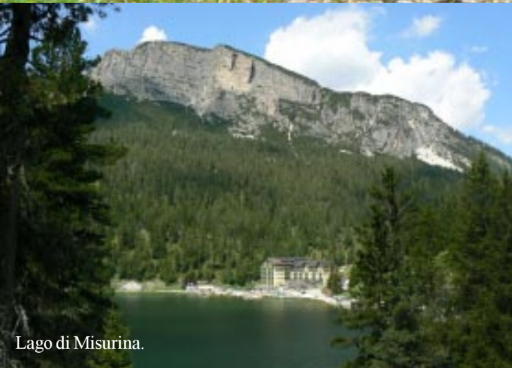
Lago di Misurina.