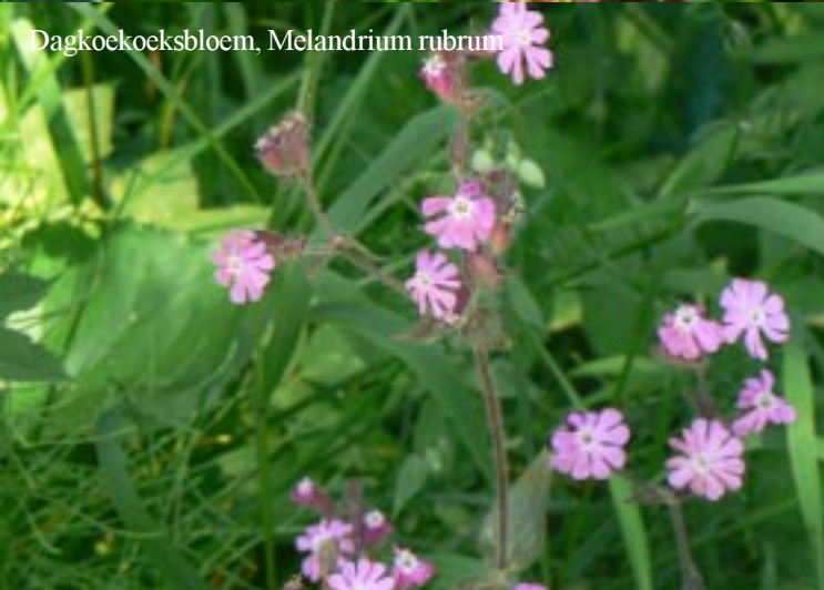
Dagkoekoeksbloem, Melandrium rubrum