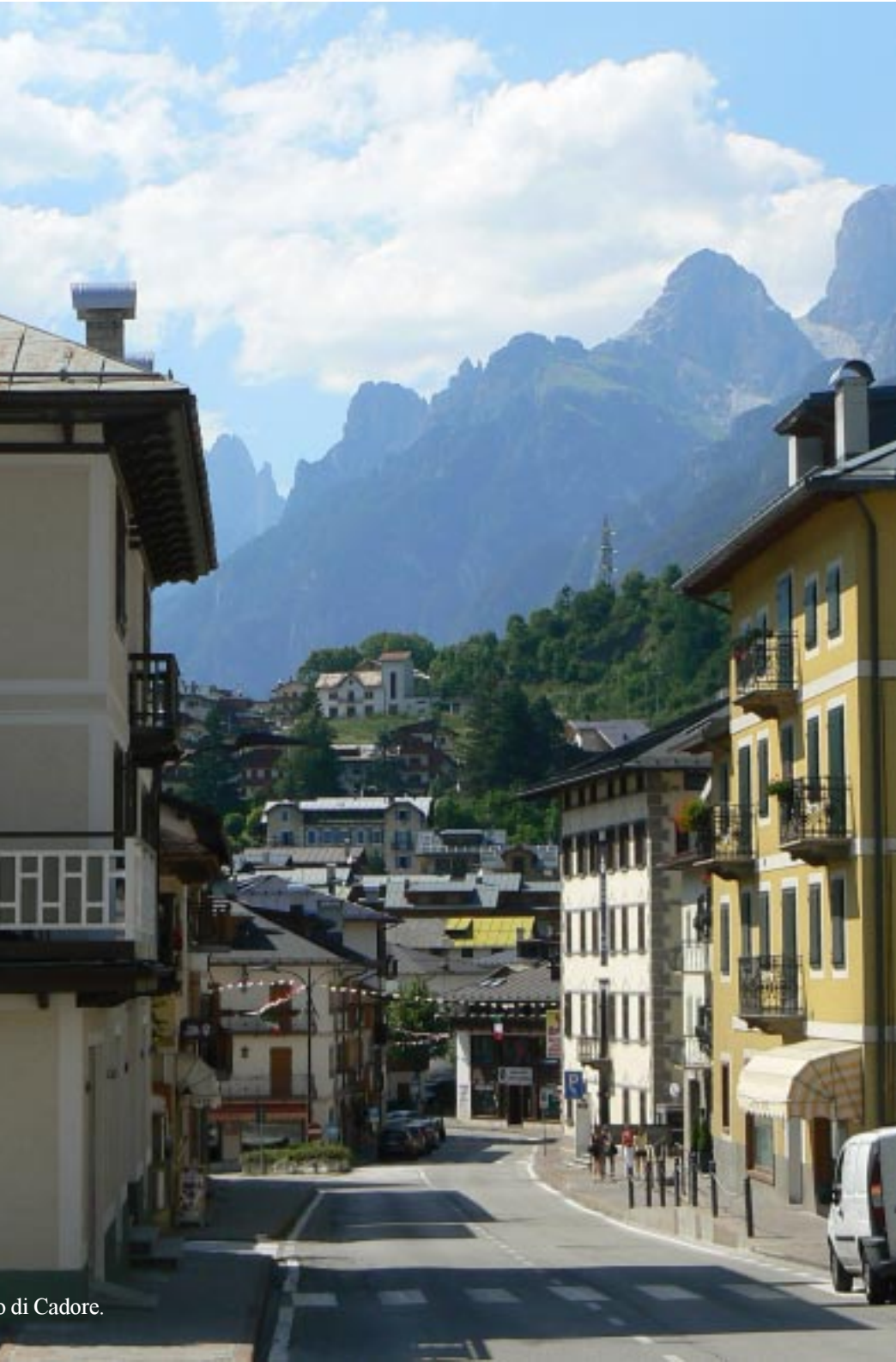
o di Cadore.