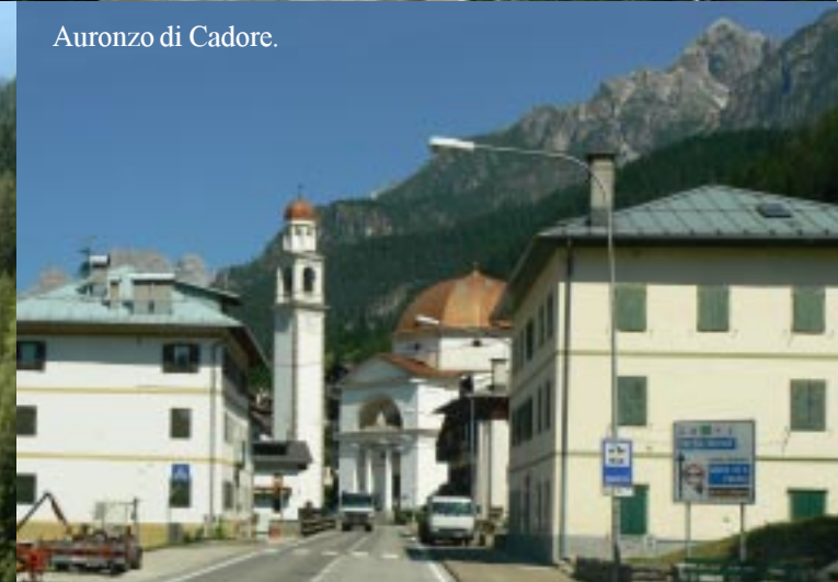
Auronzo di Cadore.