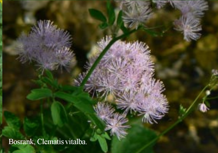
Bosrank, Clematis vitalba.