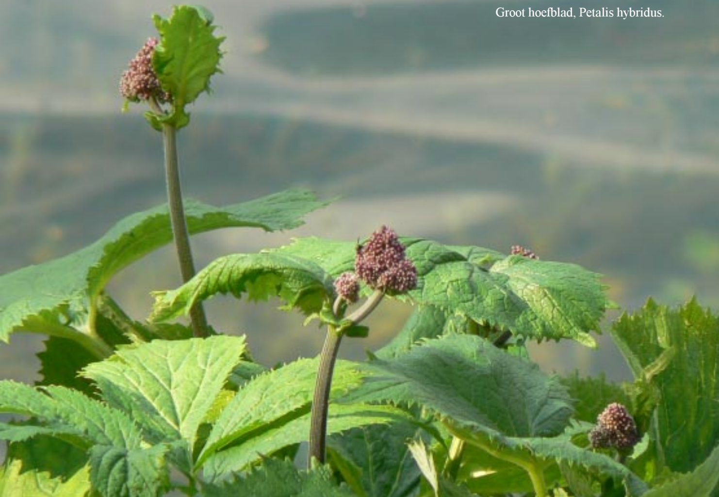
Groot hoefblad, Petalis hybridus .

Om 18.00 zijn we dan weer terug bij de camper. 's Avonds proberen we weer de wedstrijden op de radio te volgen. (Zweden - Frankrijk en Engeland - Oekraïne.) Zweden wint met 2-0! En Engeland met 1-0, zij moeten straks tegen Italië en de Fransen tegen Spanje.