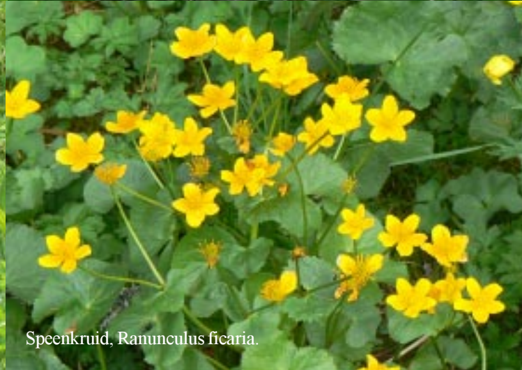
Speenkruid, Ranunculus ficaria.