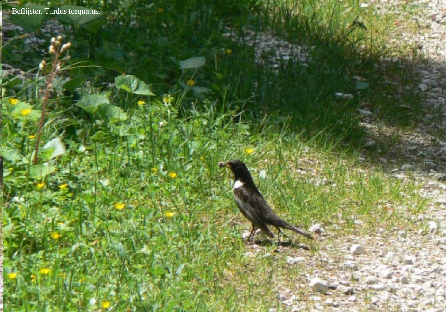
Beflijster, Turdus torquatus .