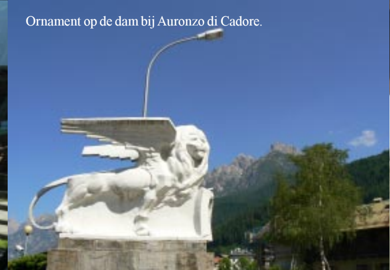
Ornament op de dam bij Auronzo di Cadore.