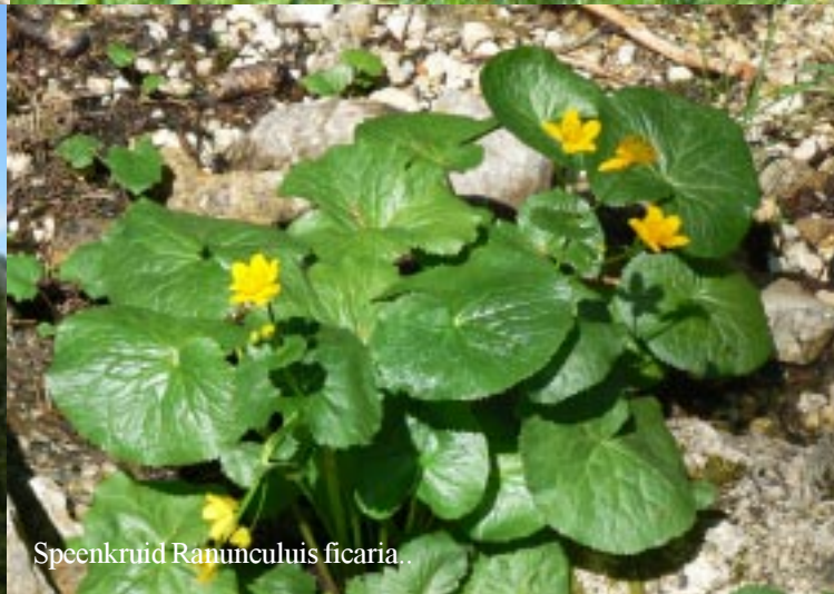
Speenkruid Ranunculus ficaria .