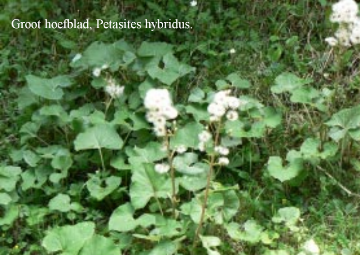
Groot hoefblad, Petasites hybridus .