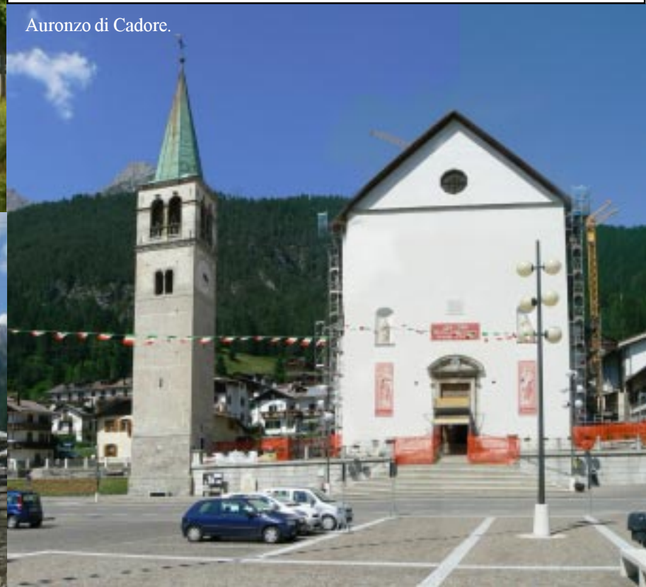
Auronzio di Cadore.