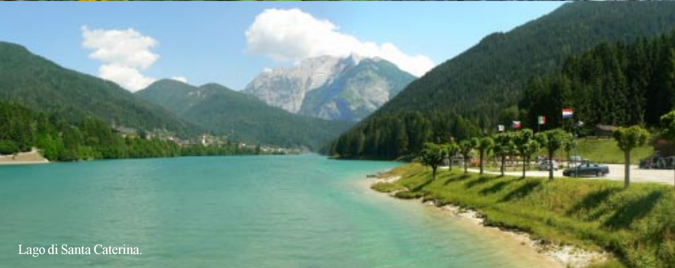
Lago di Santa Caterina.

Daar zijn diverse mensen aan het pootje baden. Als ik een landschapsfoto maak, kwekken enkele meiden: "papparazzi!" 15.10. We rusten daar even uit en lopen dan de helling naar het dorp op. Om half vier doen we enkele boodschappen bij de SPAR daar om dan langs de weg terug naar Taiarezze te gaan.