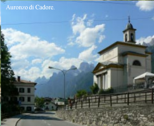
Auronzio di Cadore.