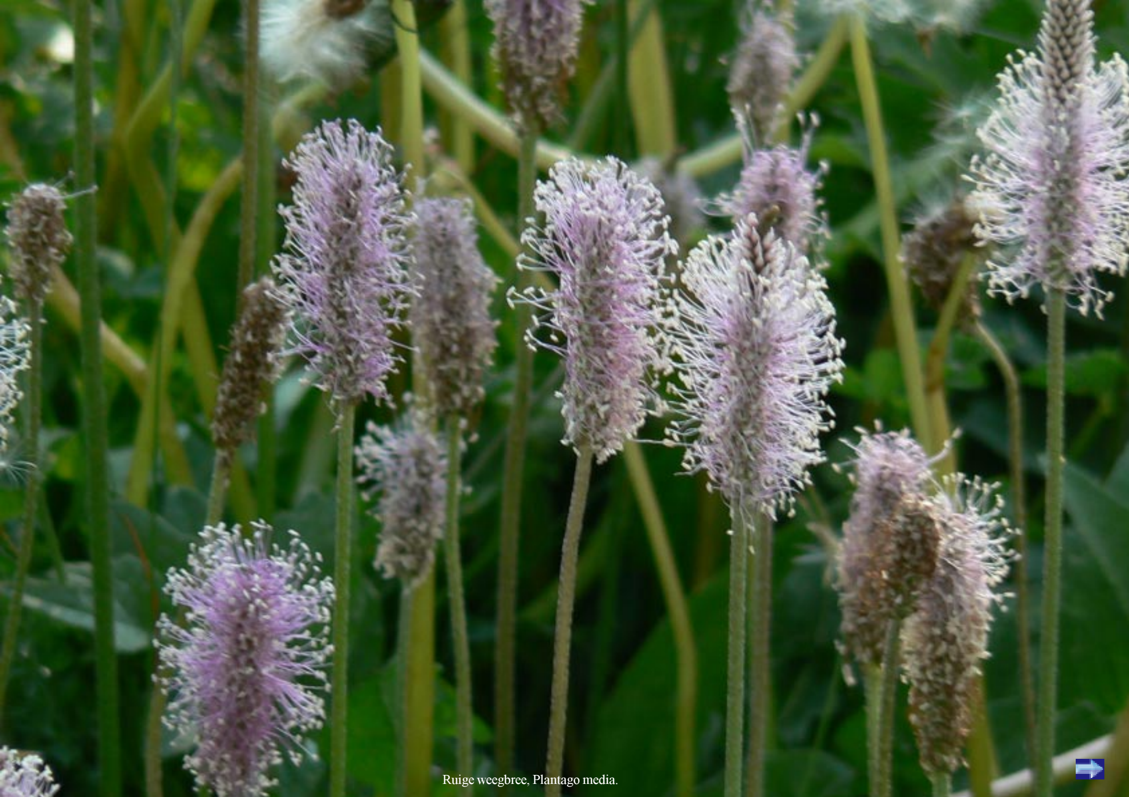
Ruijge weegbree, Plantago media .