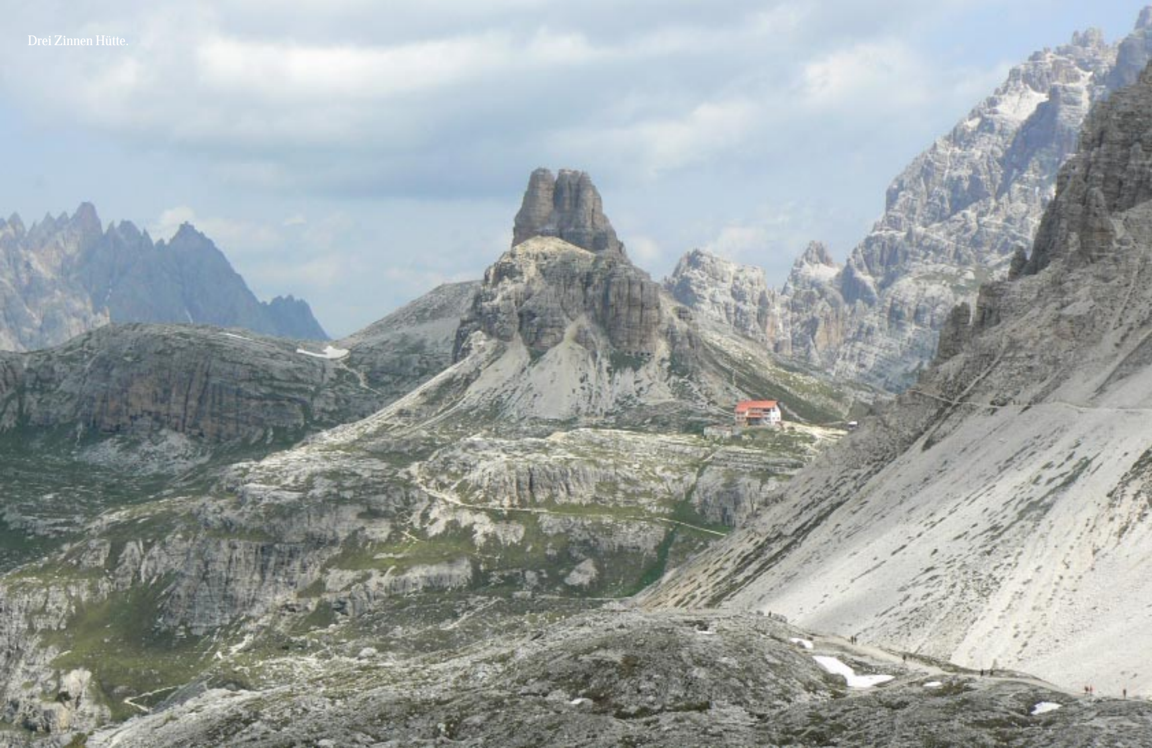
Drei Zinnen Hütte.