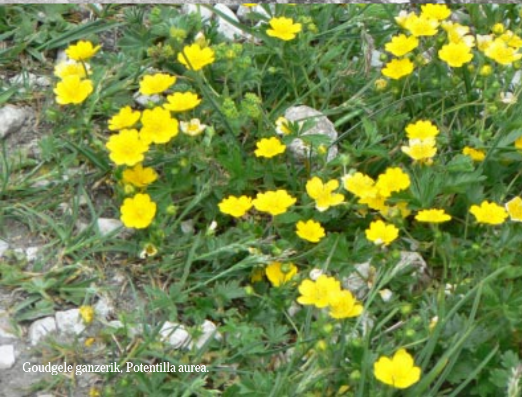
Goudgele ganzerik, Potentilla aurea .