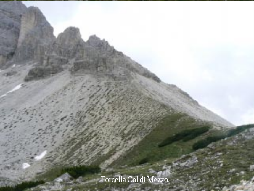
Forcella Col di Mezzo.

Het volgende mijkpunt is opnieuw een kam, die we om 13.35 bereiken. Opnieuw gaat het rap omlaag en weer omhoog nu naar de Forcella Col di Mezzo. Rechts is een enorme wand en een steil dalende ravijn. Na de kam is er weer zicht op Misurina en het meer. We lopen over een smal pad langs steile puinhellingen op ruwweg gelijke hoogte terug naar de bushalte (14.05). Een goed half uur later kunnen we dan met de bus weer naar Misurina terug. Net op tijd er vallen enkele regendruppels. 's Middags betreft het compleet en vallen er enkele onweersbuien. Gelukkig trekt het tegen de avond weer open.