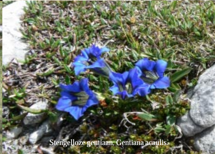
Stengelloze gentiaan, Gentiana acaulis .