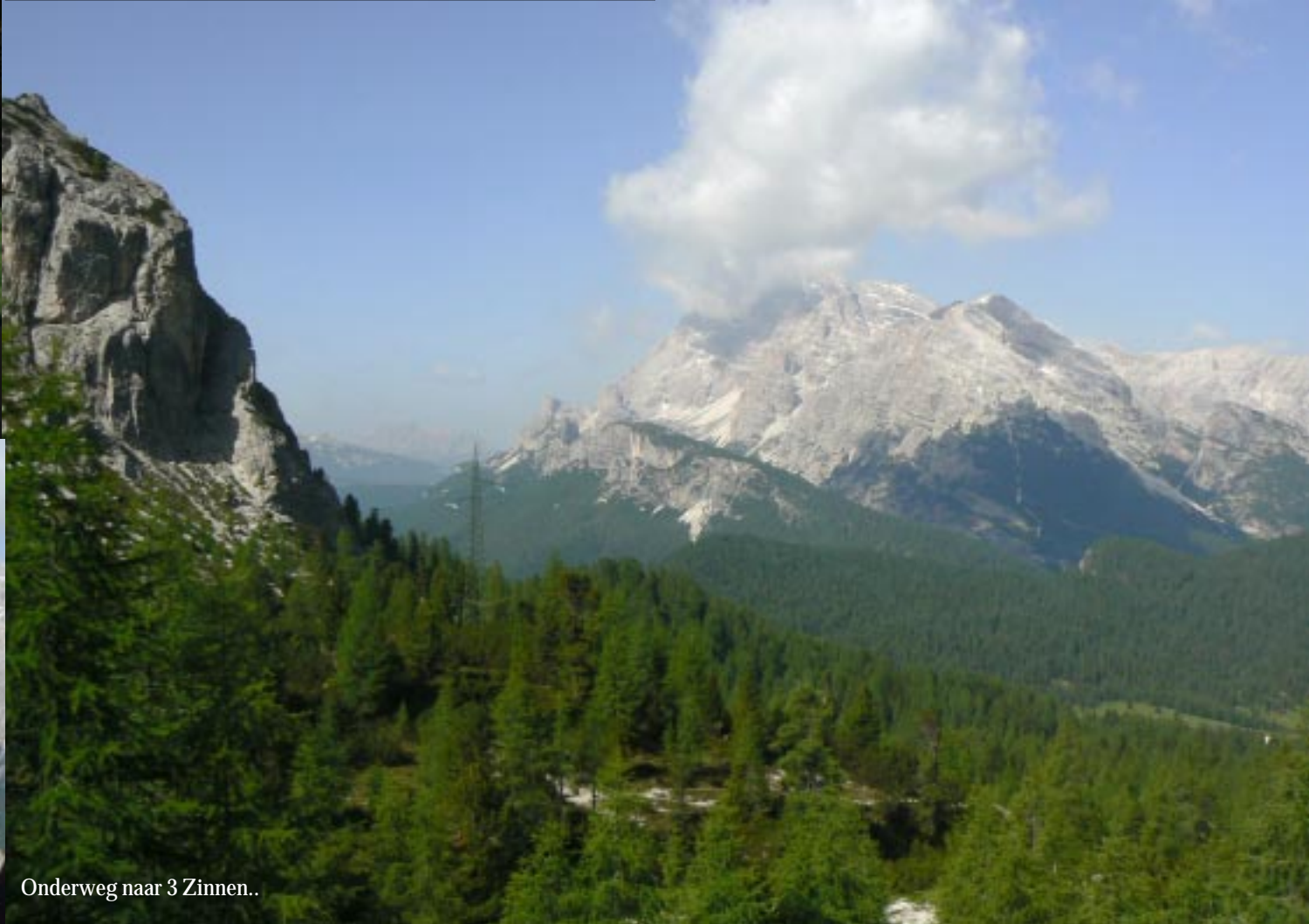
Onderweg naar 3 Zinnen..