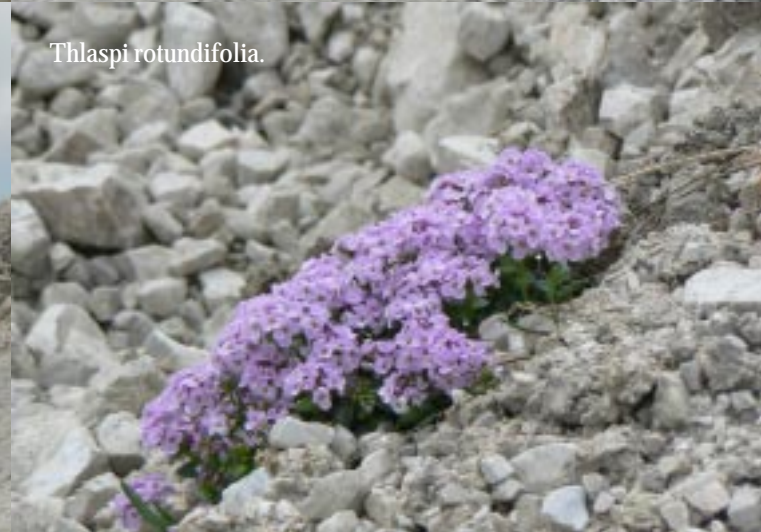
Thlaspi rotundifolia .