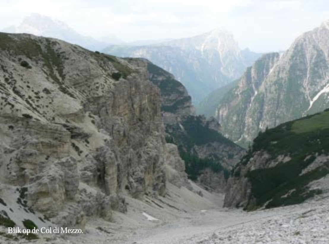
Blik op de Col di Mezzo.