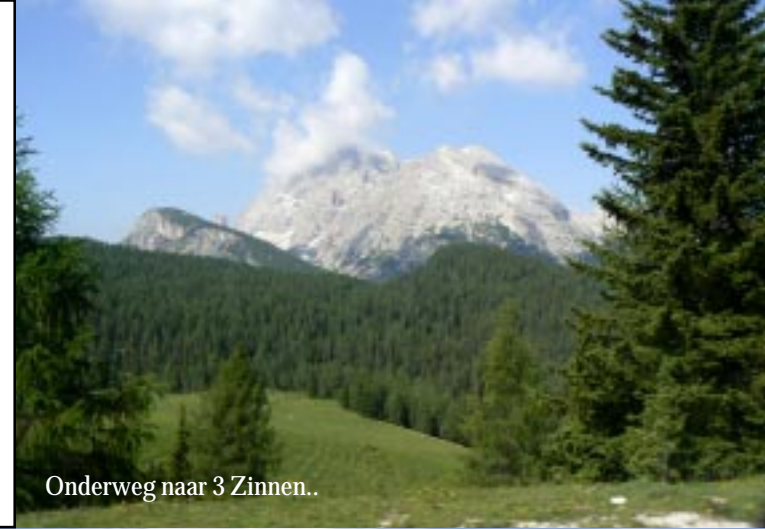
Onderweg naar 3 Zinnen..

20-06-2012. Misurina - Drei Zinnen v.v. Om 9.26 nemen we de bus (€4,50 p.p) naar de Auronzo Hütte, dat 12 km ver op de berg ligt. We passeren enkele uitspanningen, een meertje en de tolpoort. Deze rit geeft steeds spectaculairdere uitzichten op de bergen. Ze zien er veel mooier uit wanneer men ruwweg op gelijke hoogte zit in vergelijking met het zicht van beneden. Wat van onder als zandvlakten eruit ziet, zijn puinhellingen met grote keien, wanden zijn niet egaal, maar uitgesleten en vol aparte details.