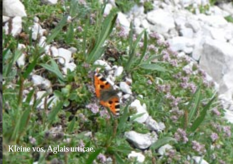
Kleine vos, Aglais urticae .

Op de kam is een filmploeg voor de Italiaanse tv bezig. Ze zijn een 7-delige serie aan het maken. Iedereen wordt dan ook gemaand op deze plek door te lopen. Boven ons staan enkele acteurs in soldatenuniform en een ezel (11.15). Tijdens de rest van de wandeling zullen ook steeds helikopters gangs de steile wanden van de Drei Zinnen vliegen. Voor de luchtopnames?