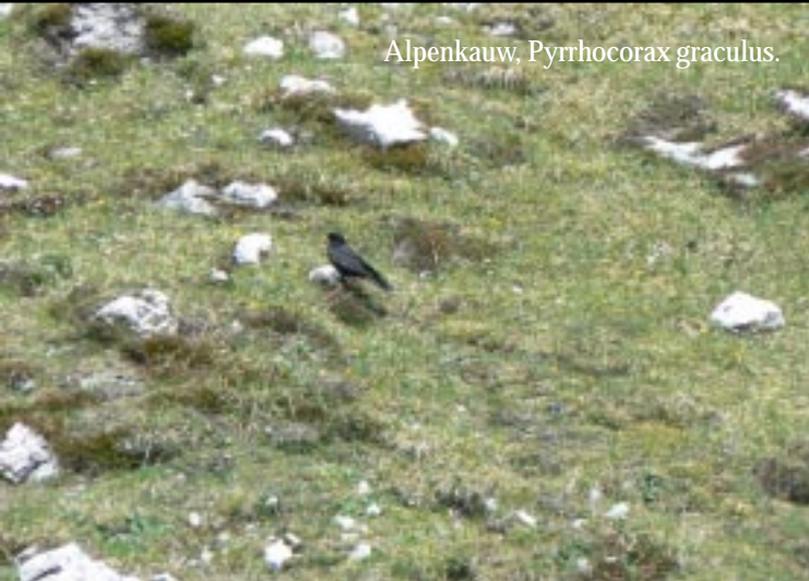
Alpenkauw, Pyrrhonorax graculus .