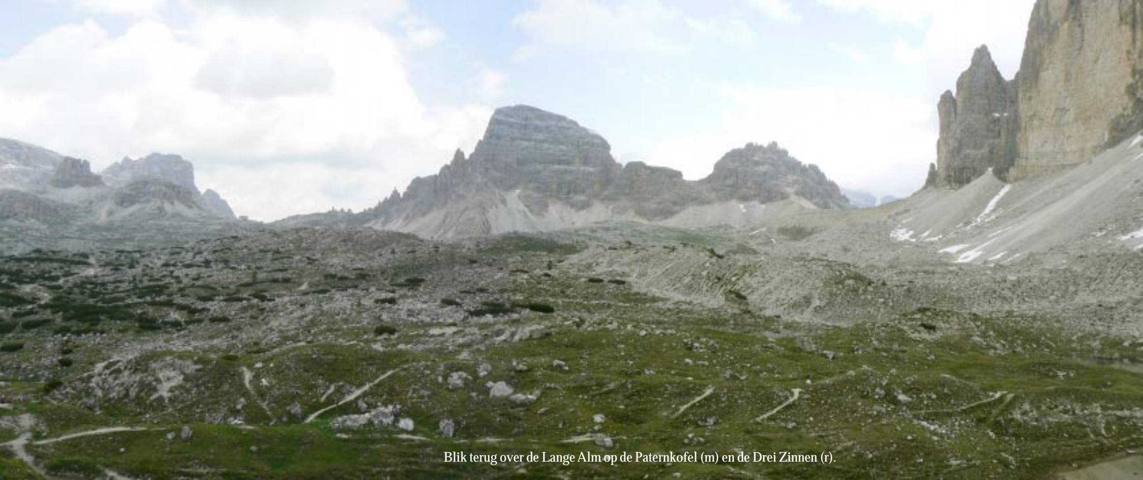
Blik terug over de Lange Alm op de Paternkofel (m) en de Drei Zinnen (r).