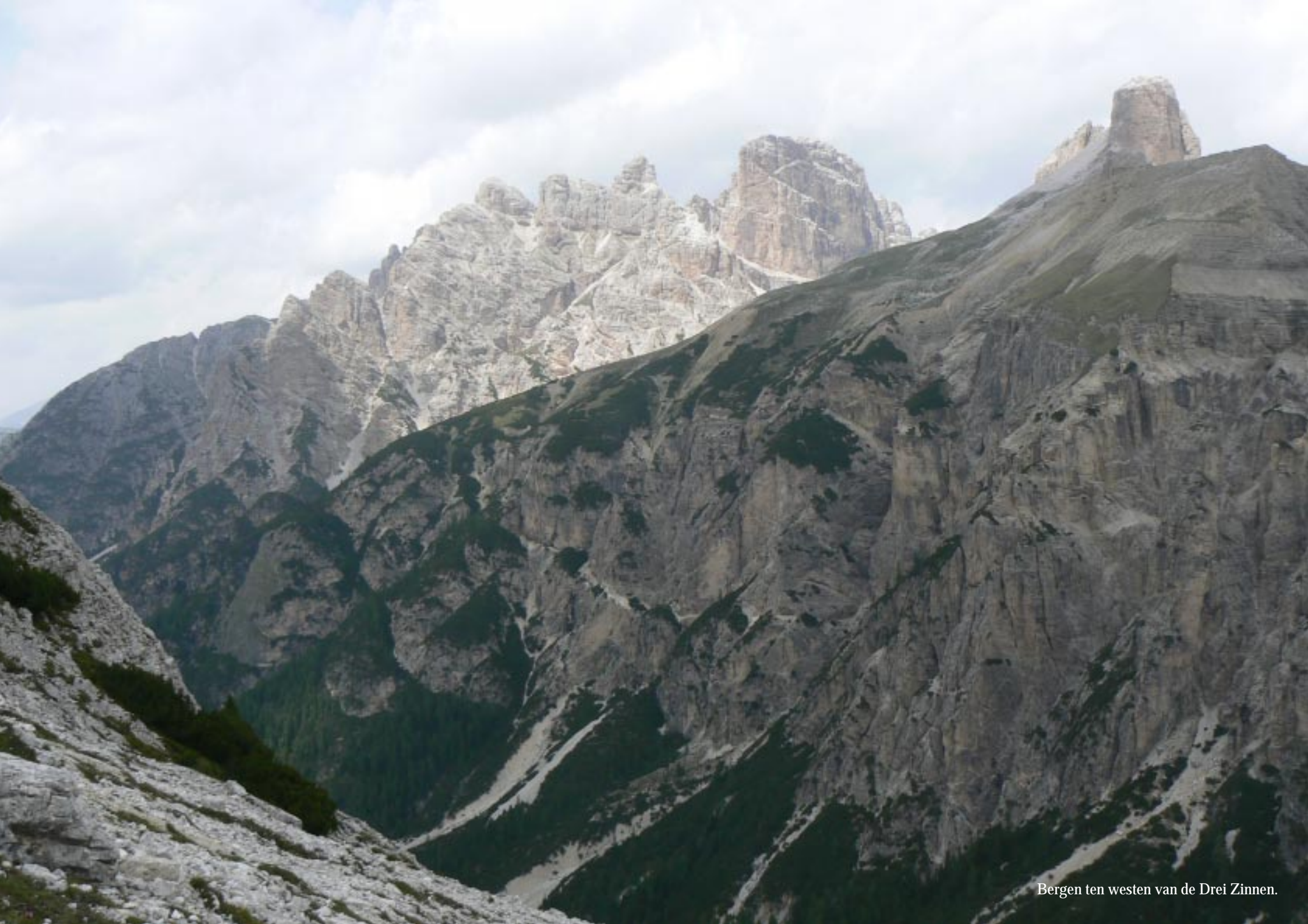
Bergen ten westen van de Drei Zinnen.