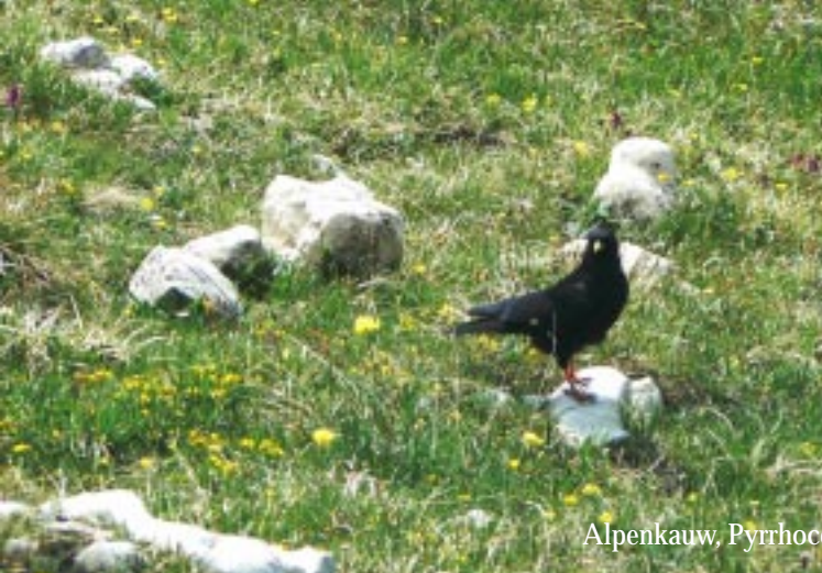
Alpenkauw, Pyrrhocorax graculus .