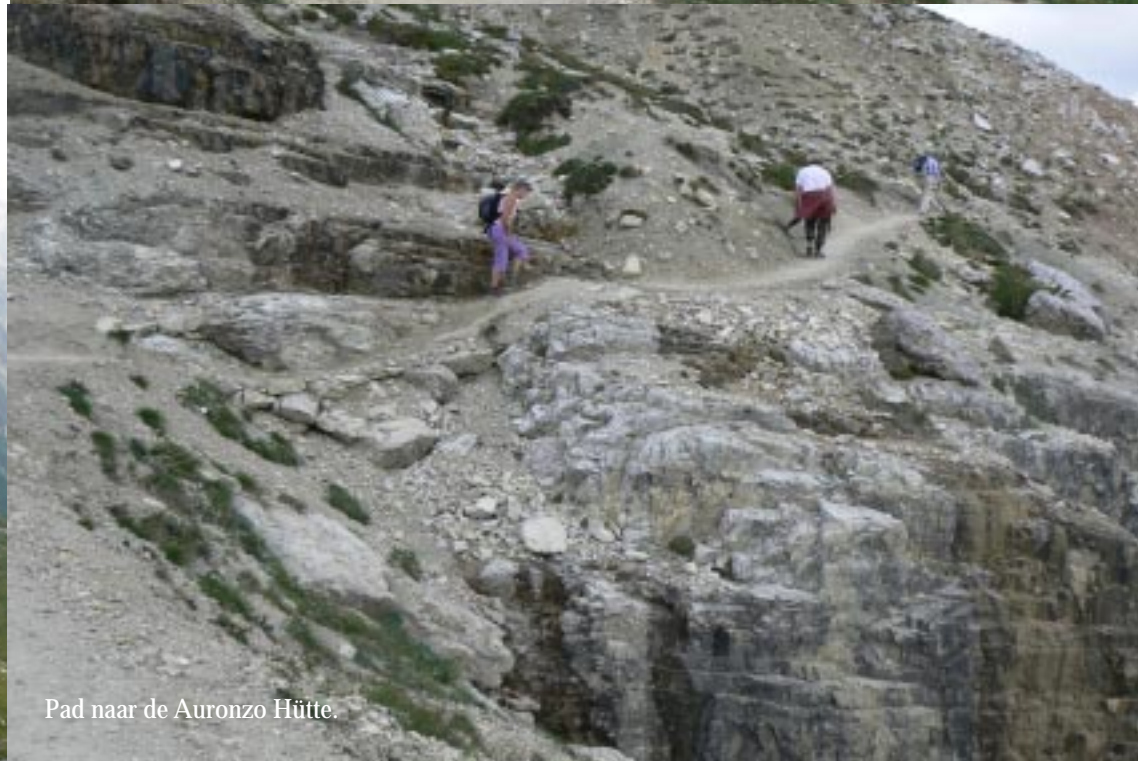
Pad naar de Auronzo Hütte.