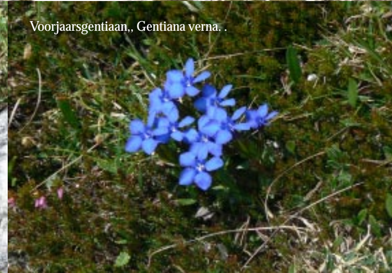
Voorjaarsgentiaan, Gentiana verna .