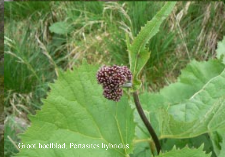
Groot hoeftblad, Petasites hybridus .