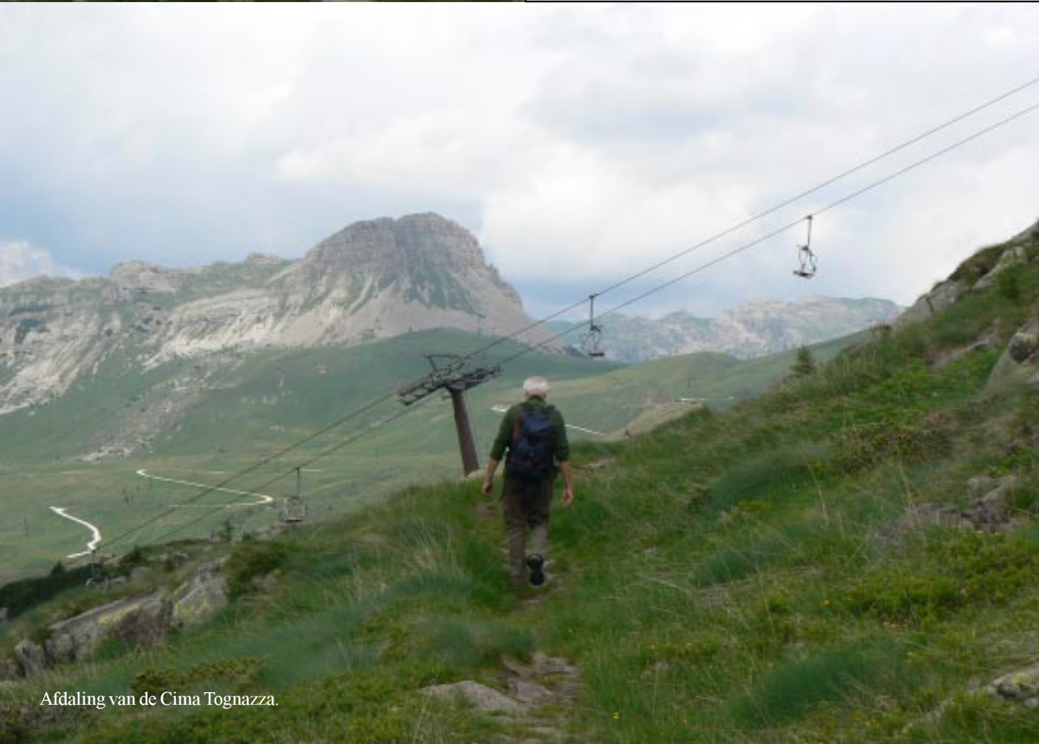
Afdaling van de Cima Tognazza.