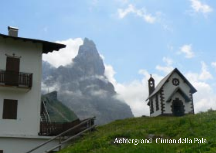
Achtergrond: Cimon della Pala.