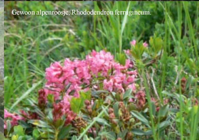
Gewoon alpenroosje, Rhododendron ferrugineum .