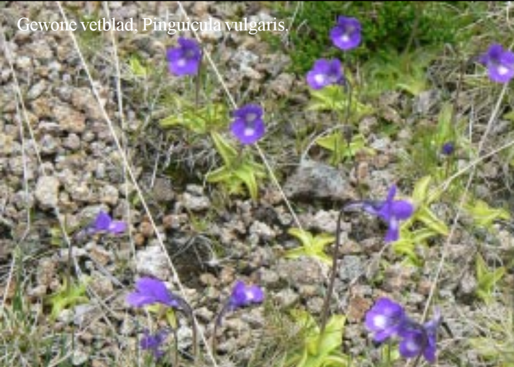
Gewone vetblad, Pinguicula vulgaris .