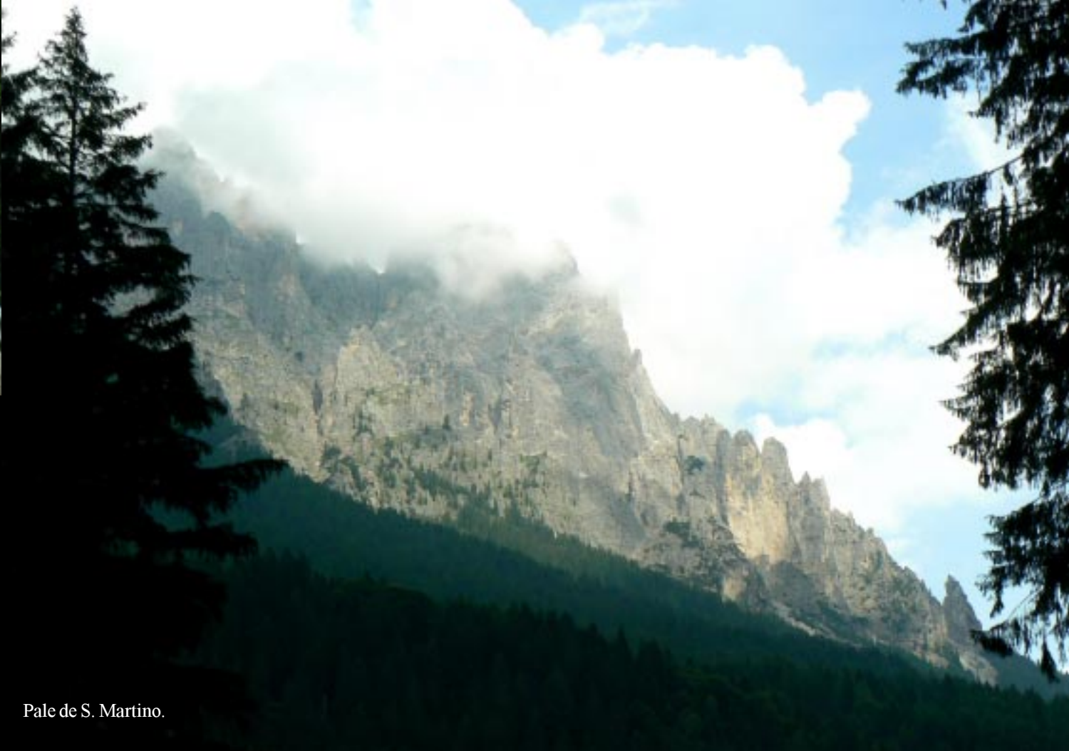
Pale de S. Martino.

Bocht na bocht dalen we vervolgens af. Links hoog boven ons de Pale de S. Martino een lange rij hoge toppen. Siror 16.00 op 770 m! We tanken voor •40 à •1,48/l. De pasjes worden niet geaccepteerd en we hebben niet meer cash. We gaan de stad zelf in en hebben problemen bij de UniCredit Banca. Ik ga bij de Post pinnen en we wachten tot er iemand anders ook succesvol gepind heeft bij die UniCredit Banca. Hij kreeg pas bij de 3e poging geld, dus zal het wel OK zijn.