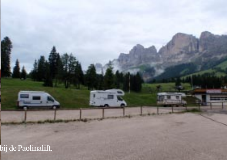
Parking bij de Paolinalift.