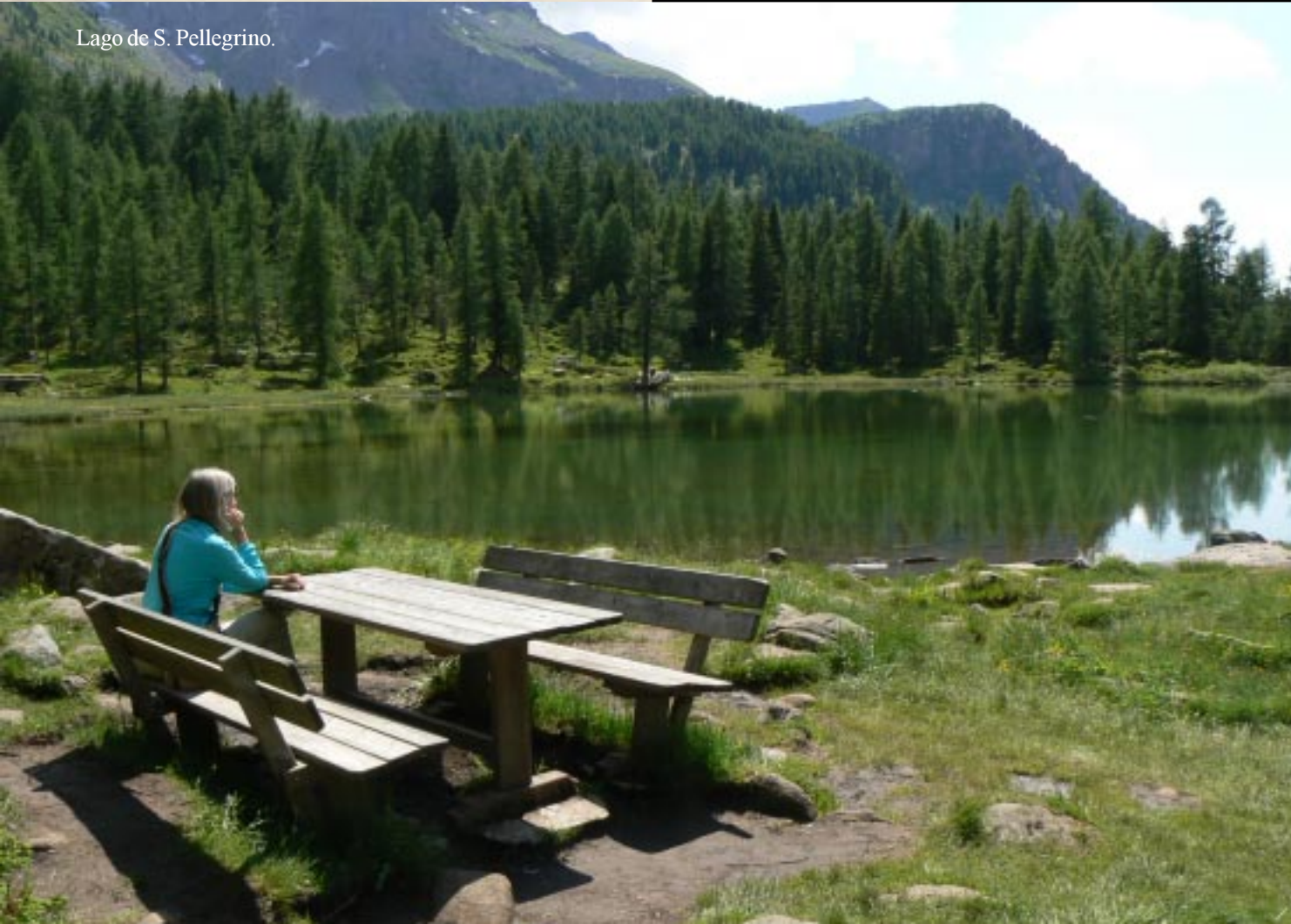
Lago de S. Pellegrino.