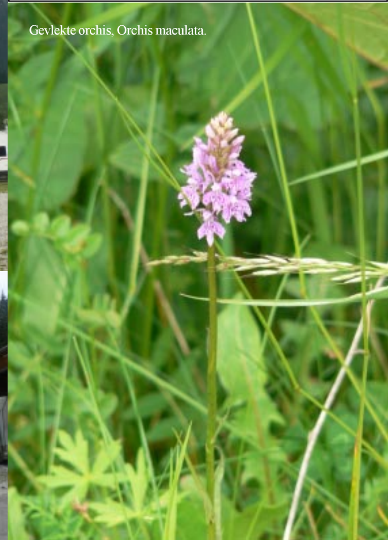
Gevlekte orchis, Orchis maculata .

15.05 zijn we na vele scherpe haarspeldbochten S. Martino di Castrozza net door en komen bij de camperparking. We zetten ZippII onder aan de weg en kijken op de camperparking rond. Voor de •12 een prima overnachtingsplaats bij een heel aardig stadje.