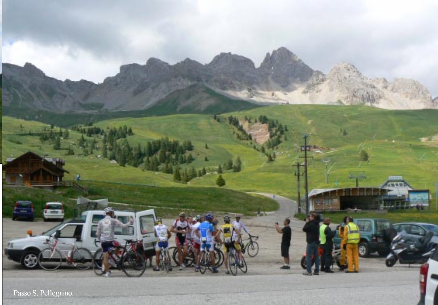
Passo S. Pellegrino.

We lopen naar de afzink van de pas om al vast de bergen in het oosten te zien.