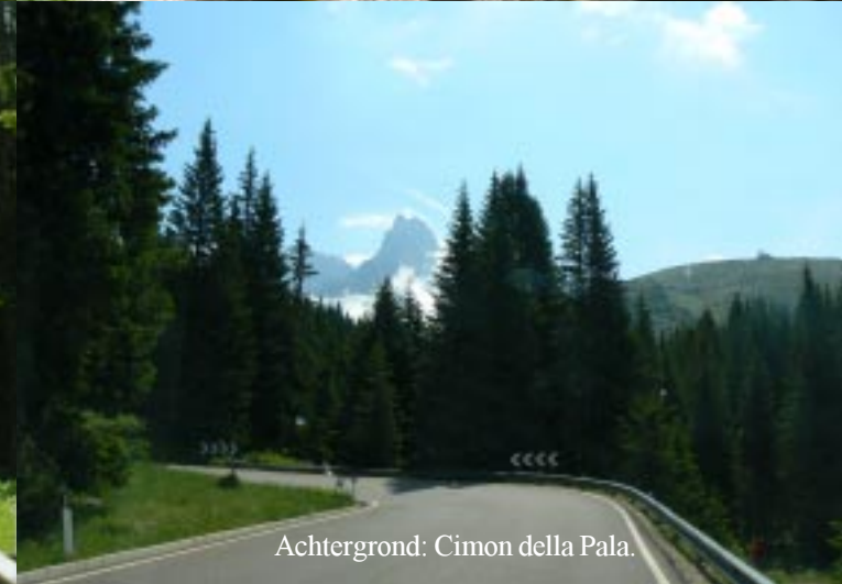
Achtergrond: Cimon della Pala.