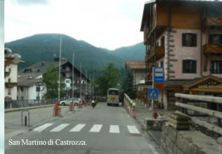
San Martino di Castrozza.