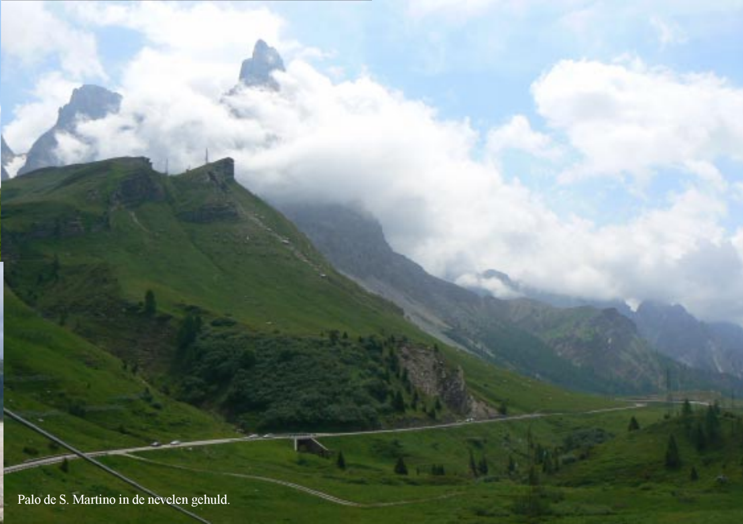
Palo de S. Martino in de nevelen gehuld.