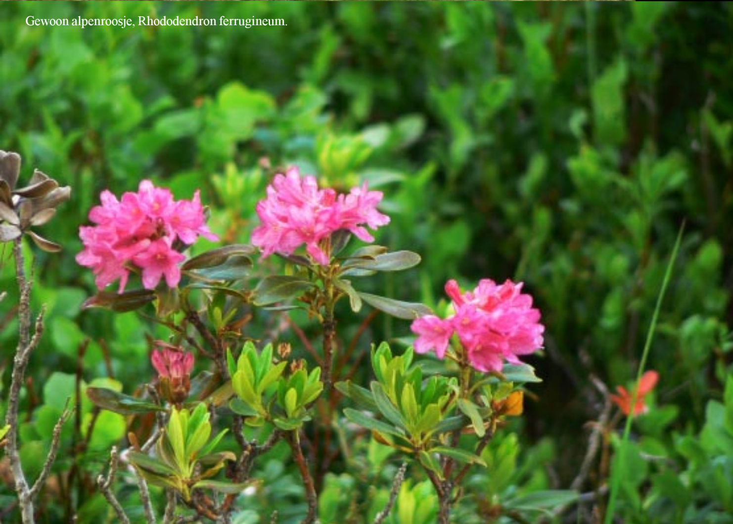
Gewoon alpenroosje, Rhododendron ferrugineum .

Langs de weg boven het meer staat een soort half hunnebed. Een echte of een moderne variant. Er is niets aan info te vinden.