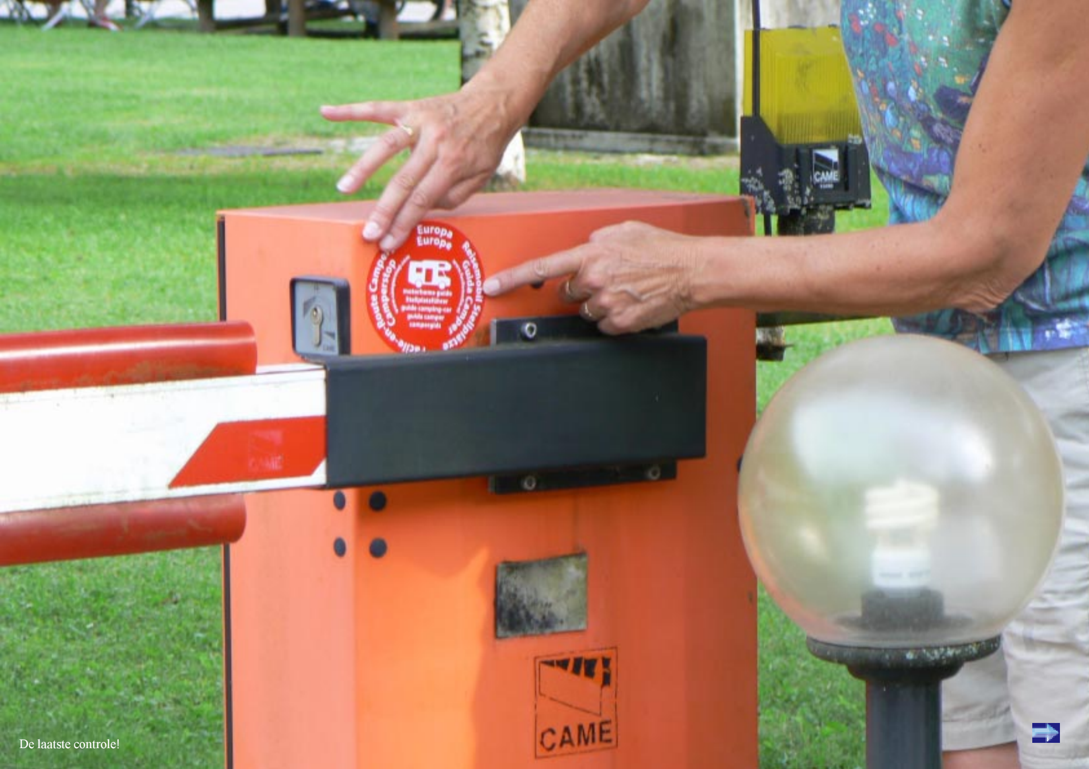
De laatste controle!