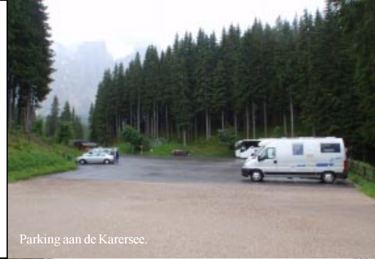
Parking aan de Karersee.

Onderweg foto's proberen te maken van de Karersee. Het is druk daar, zodat we niet stoppen.