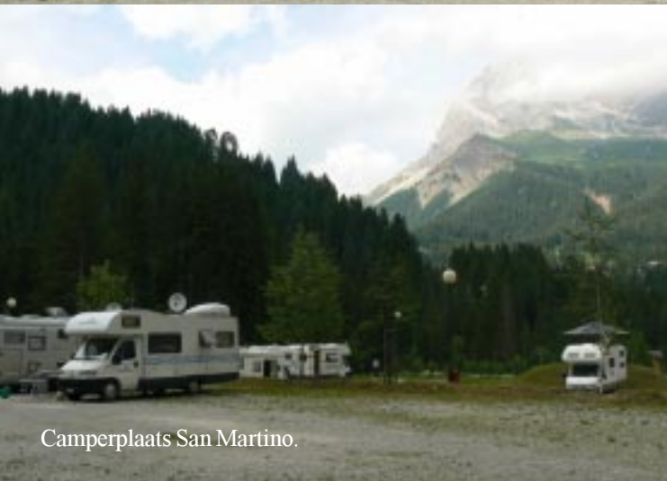
Camperplaats San Martino.