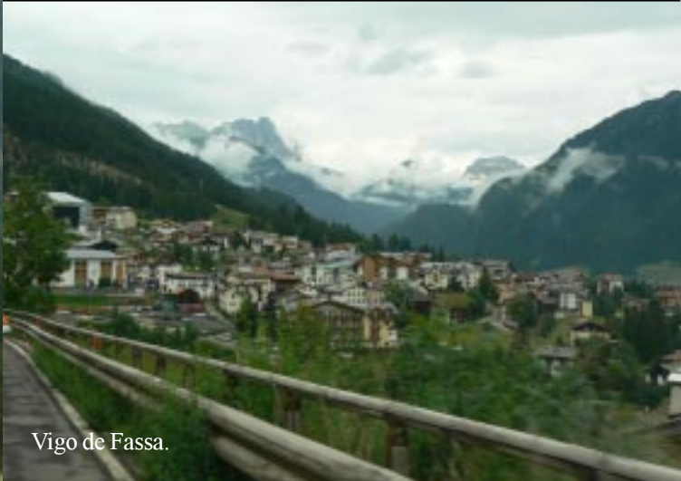
Vigo de Fassa.

We bekijken iets voor de pas de parkeerplaats bij de Paolina stoeltjeslift. Dat ziet er goed uit. Helaas is de overdekte stoeltjeslift niet in bedrijf. 11.10 verder. Vigo de Fassa 11.30. 5' later afslag in de richting van Moena.