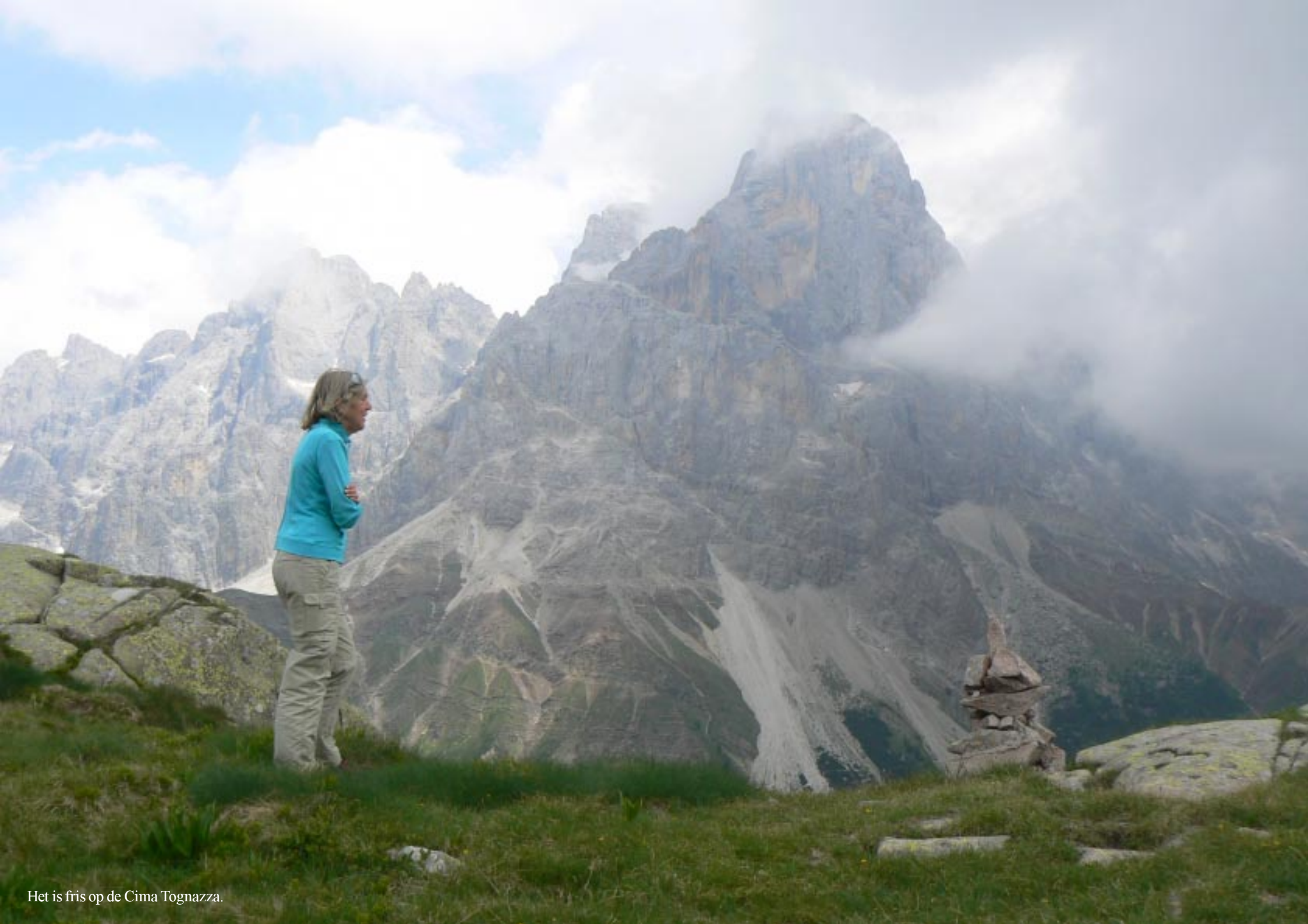
Het is fris op de Cima Tognazza.