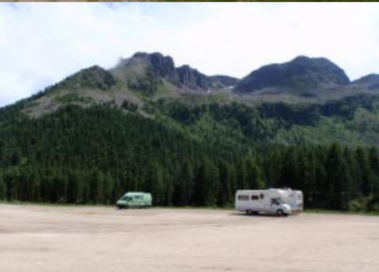
Passo S. Pellegrino.