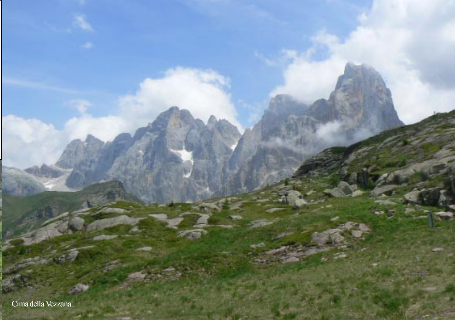
Cima della Vezzana..

Opmerkelijk is de donkerrode graniet, waaruit deze berg bestaat, geen dolomiet dus. Verder staan er hier niet zo heel veel bloemen.