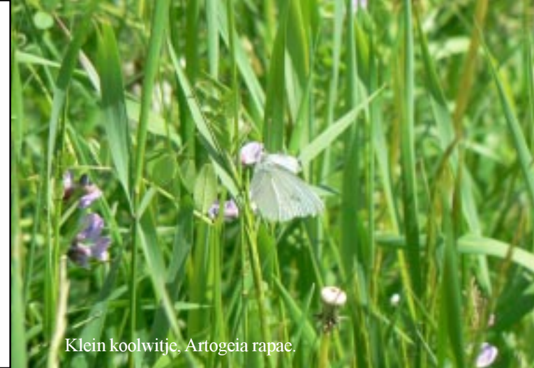
Klein koolwitje, Artogeia rapae .

We kuieren in een lekker zonnetje om het kleine meertje heen. Er staan hier opmerkelijk weinig soorten bloemen.