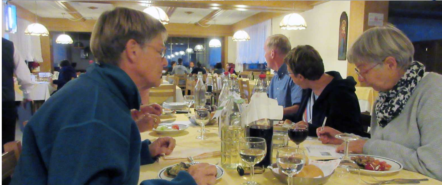
Deze pagina: Diner in hotel Sella Ronda.