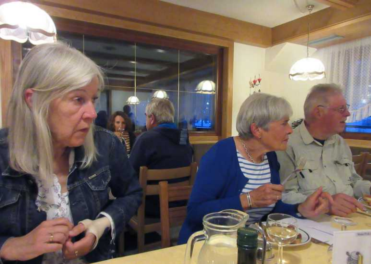
Om half acht is iedereen present bij het diner.