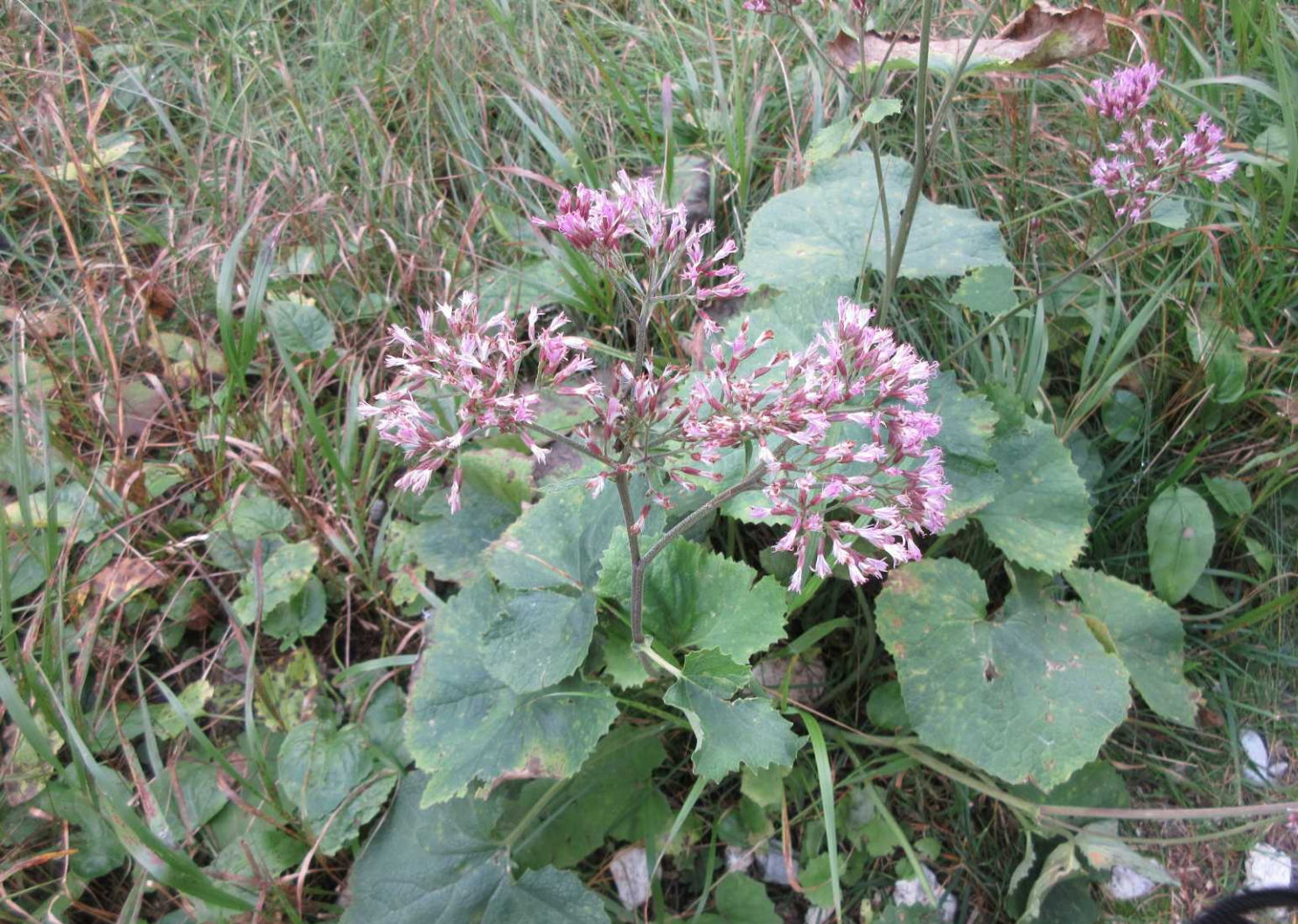
LB: Kale klierstijl, adenostyles alpina . LO, MO: Station Pian Pecei.