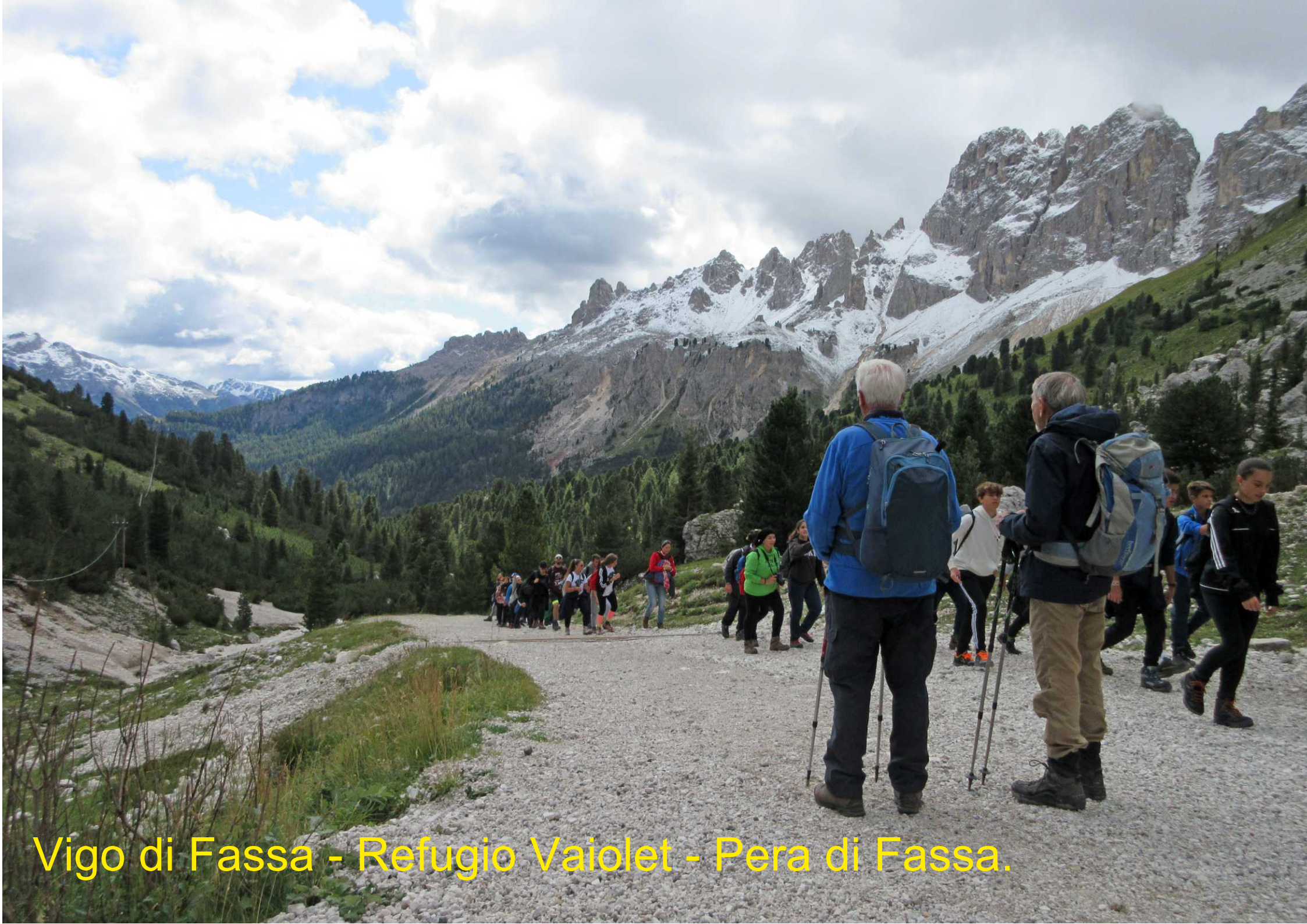
Vigo di Fassa - Refugio Vaiiolet - Pera di Fassa.