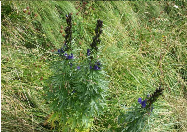
LB: Lago di Fedaia (links) Marmoladagruppe. RB: Blik op Rifugio Viel Dal Pan. MM: Sass Ciapel en Lago Fedaia. RM: Duizendblad, Achillea millefolium . LO: Groot streepzaad, Crepis biennis . RO: Blauwe monnikskap, Aconitum napellus .