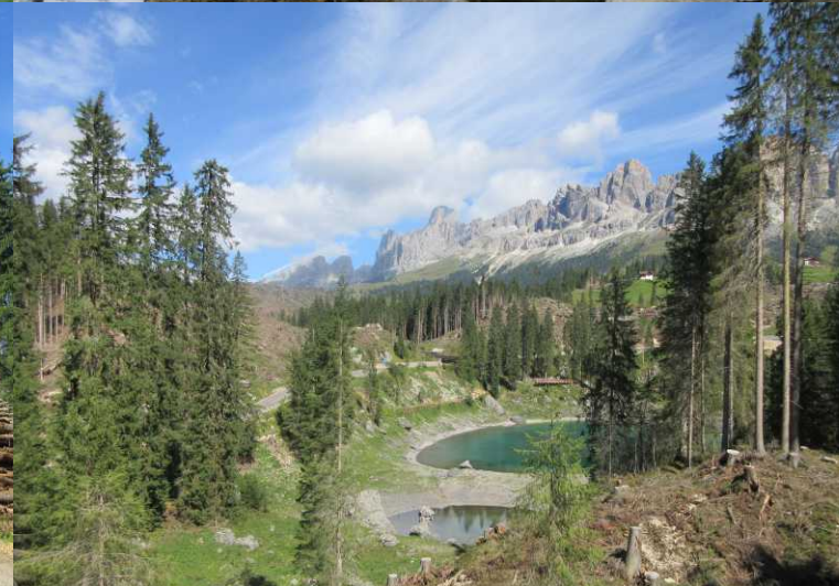
LB, RB, RM: Een mini-Lourdesgrotje. MO, RO: Opnieuw zijn grote percelen kaal.