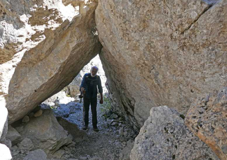
Deze pagina: Labyrinth.