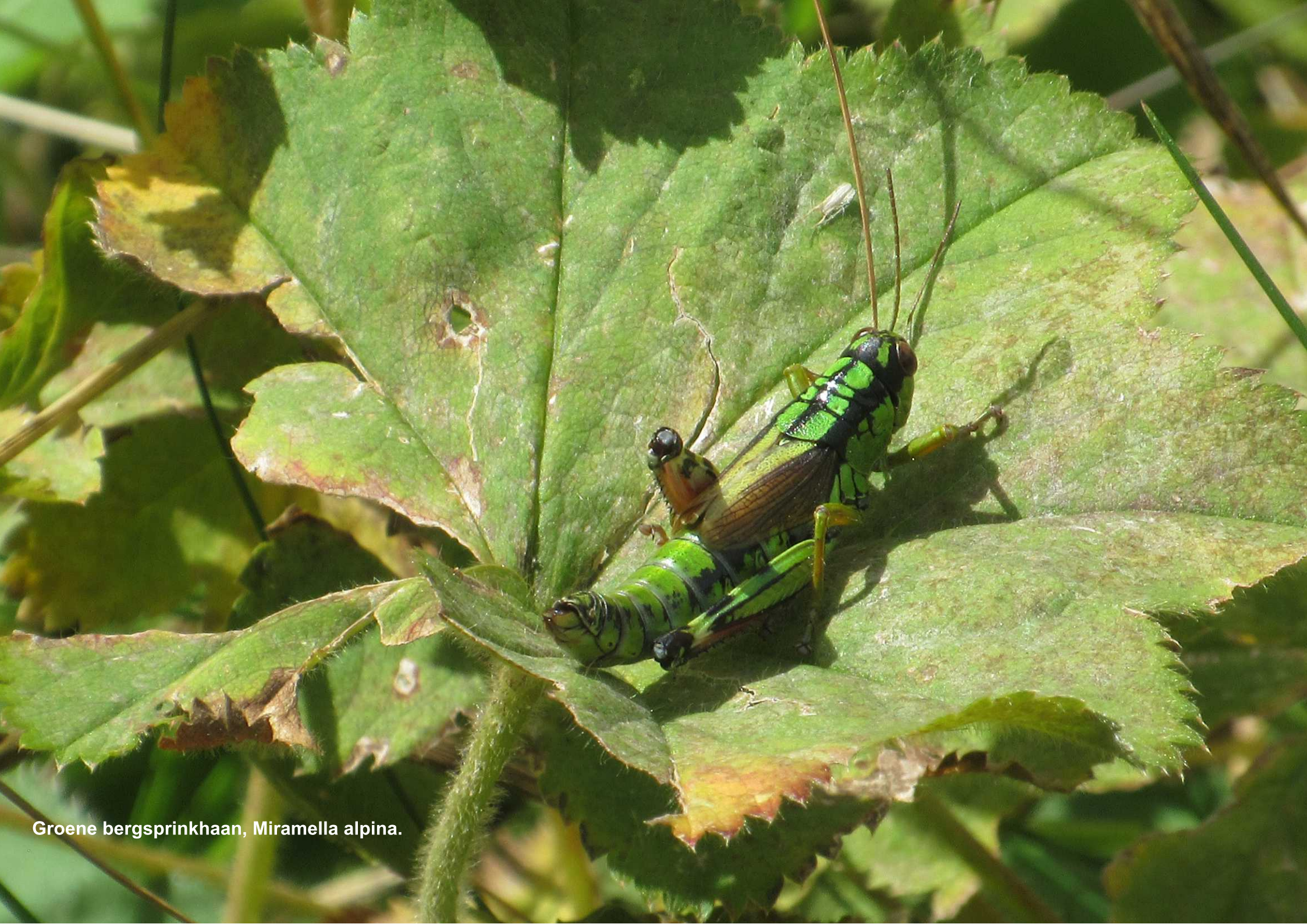
Groene bergsprinkhaan, Miramella alpina .