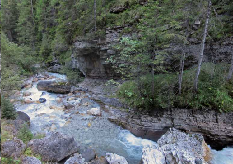
LB, RB, MM: De Duron. O: Campitello di Fassa.

Hoe dichter we bij het dorp komen deste wilder de Duron is. Het verval is er ook groter. Tegen half vijf zijn we terug bij het hotel en gaan van de werverdiende rust genieten.