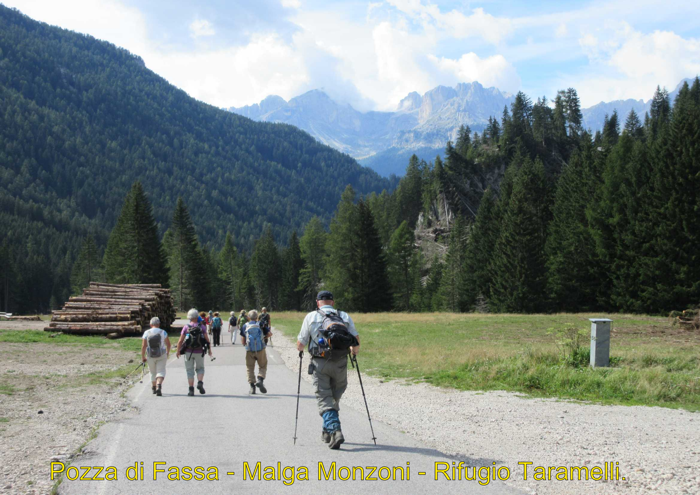
Pozza di Fassa - Malga Monzoni - Rifugio Taramelli.