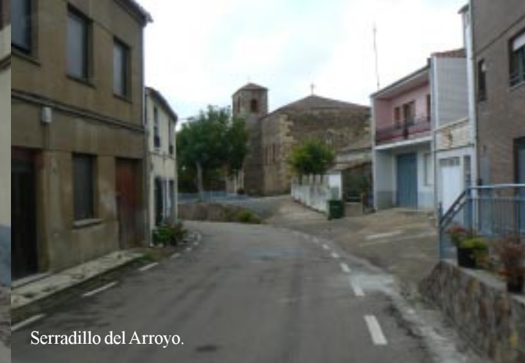
Serradillo del Arroyo.