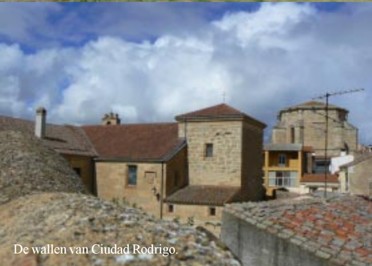
De wallen van Ciudad Rodrigo.