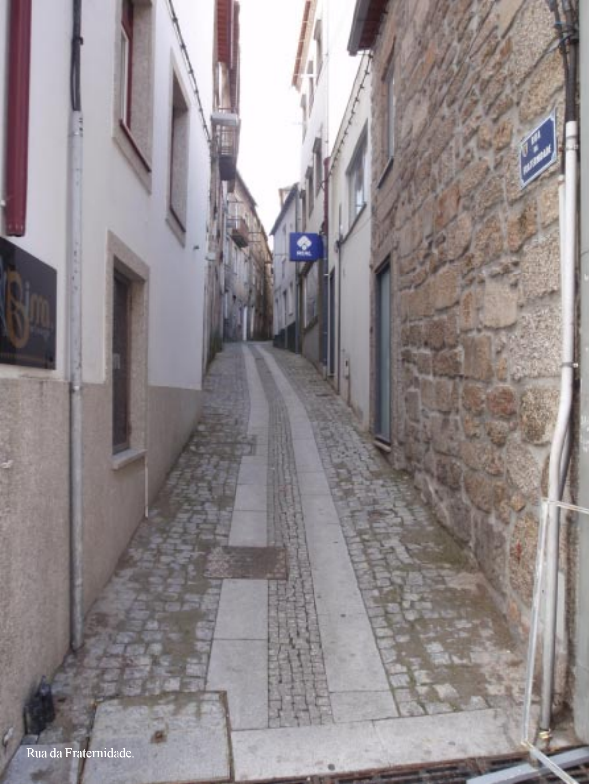
Rua da Fraternidade.