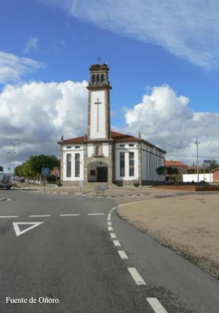
Fuente de Oñoro.