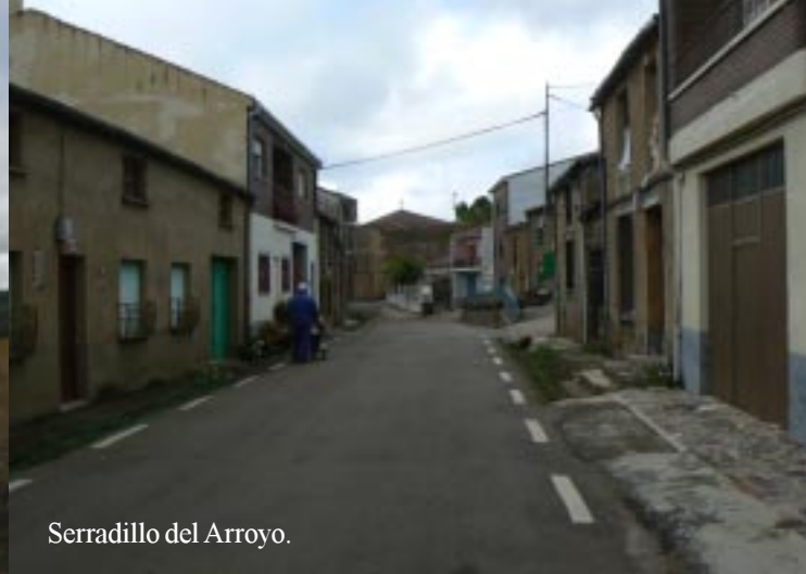
Serradillo del Arroyo.