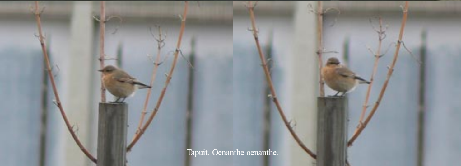
Tapuit, Oenanthe oenanthe.

We komen op de parkeerplaats aan de Rua da Direcção Geral de Viação te staan, vlak bij een sportpark. Het is genoeg voor vandaag.