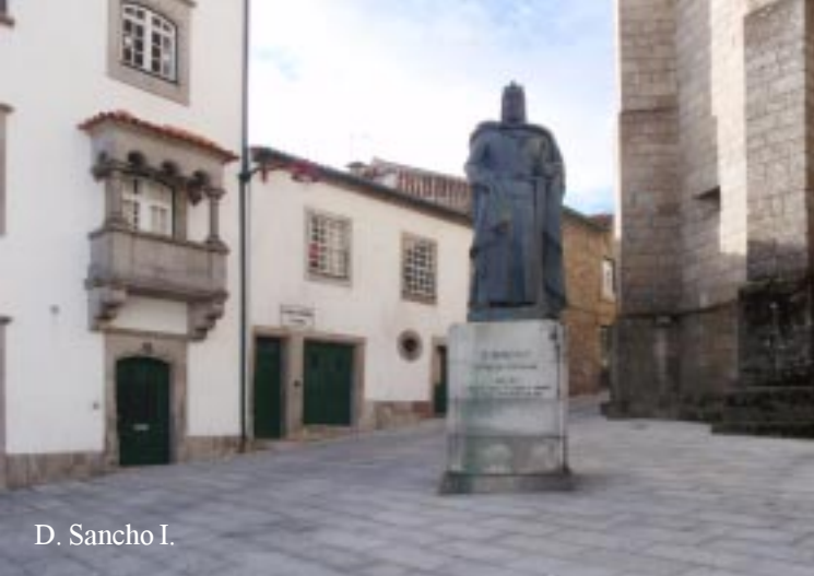
D. Sancho I.