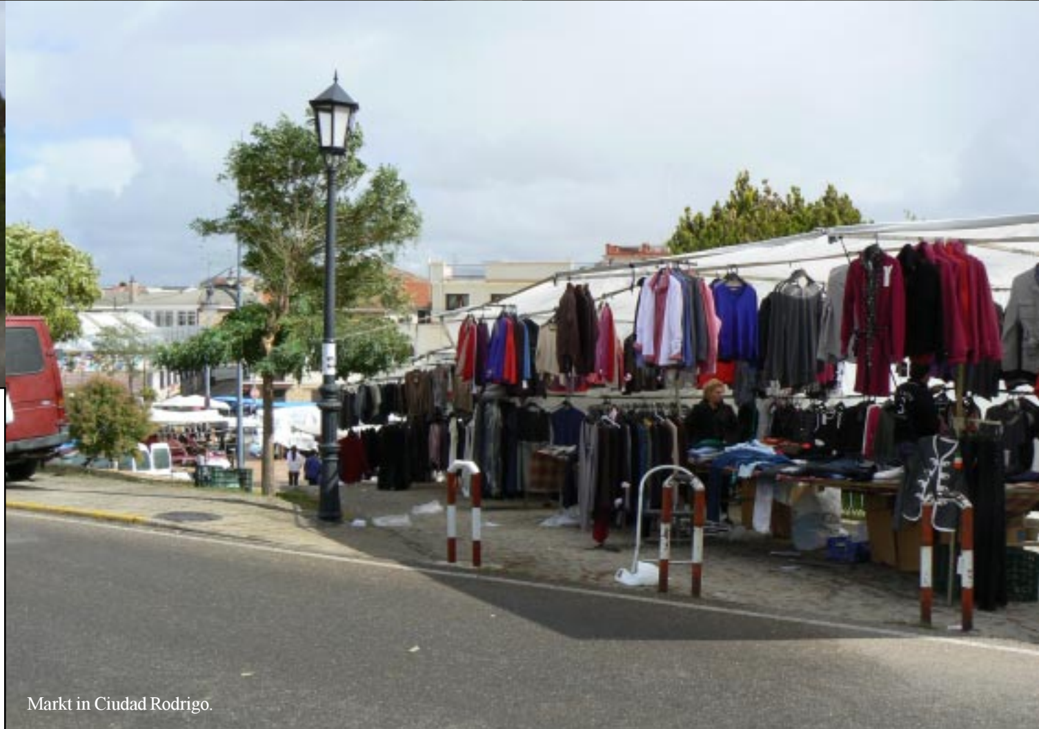
Markt in Ciudad Rodrigo.

In Ciudad Rodrigo zetten we Zippy net achter de markt af (13.25) en beginnen aan de 2,5 km wandeling over de stadsmuur. Het eerste deel is nog niet zo bijzonder, maar dan krijgen we al een goede kijk op het mooie stadje. Dan bekijken we de stad en het centrale plein, doen de gisteren geschreven postkaarten in de bus. Heel aardig. Om 15.25 gaan we door. We tanken weer eens en rijden naar Fuente de Oñoro net voor de grens om er boodschappen te doen.