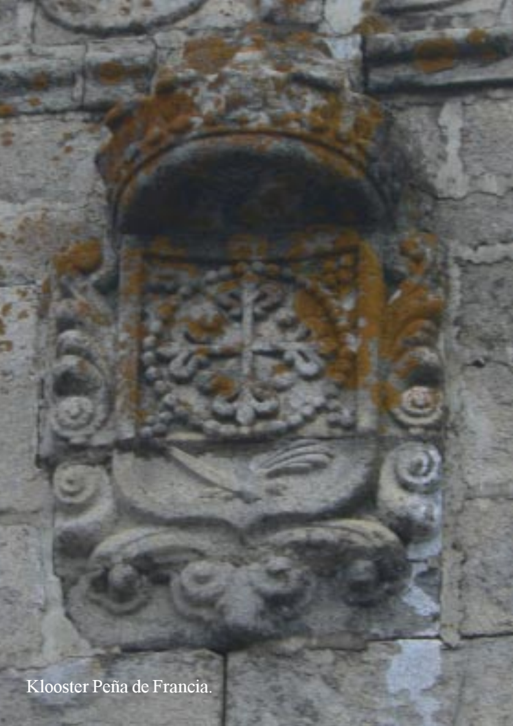
Klooster Peña de Francia.