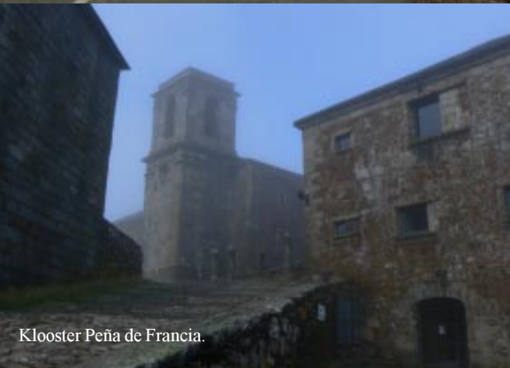
Klooster Peña de Francia.