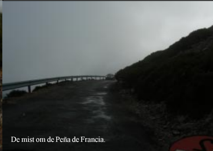
De mist om de Peña de Francia.