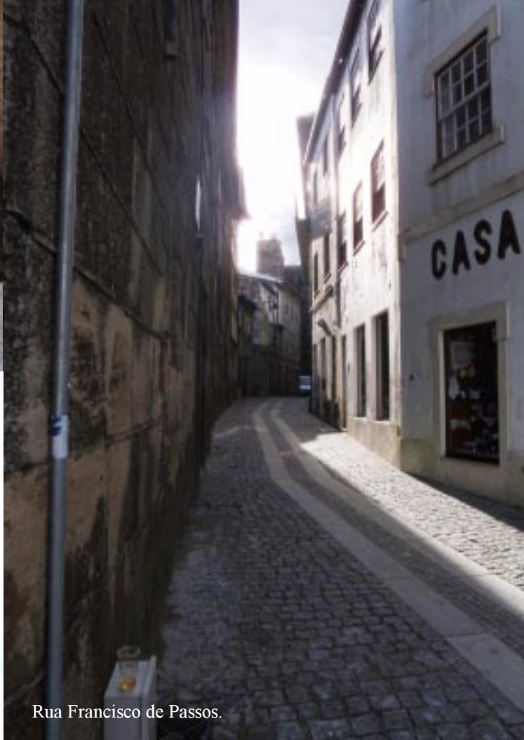
Rua Francisco de Passos.