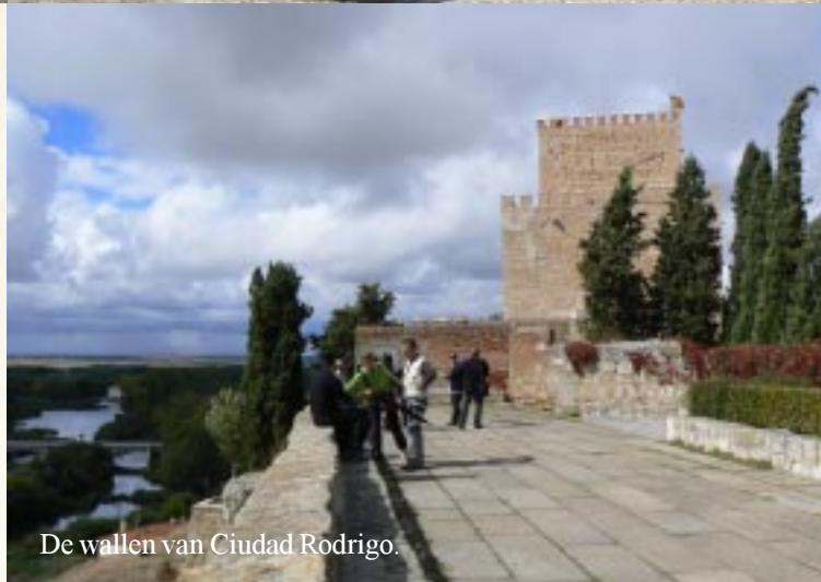
De wallen van Ciudad Rodrigo.