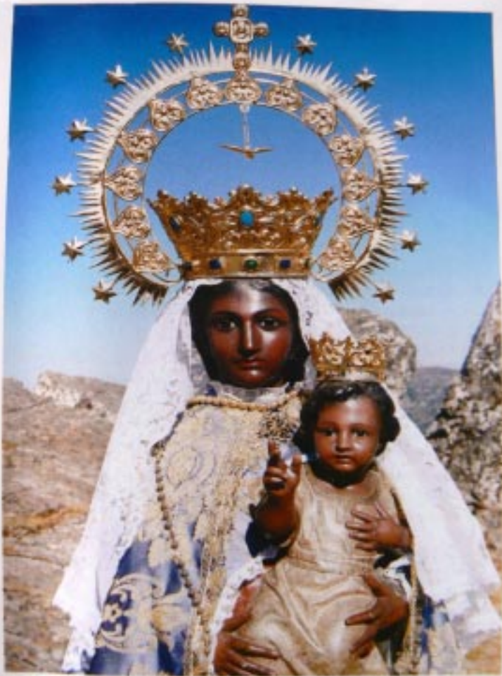
VIRGEN DE LA PEÑA DE FRANCIA