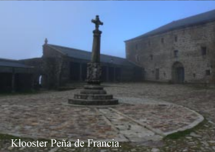
Klooster Peña de Francia.