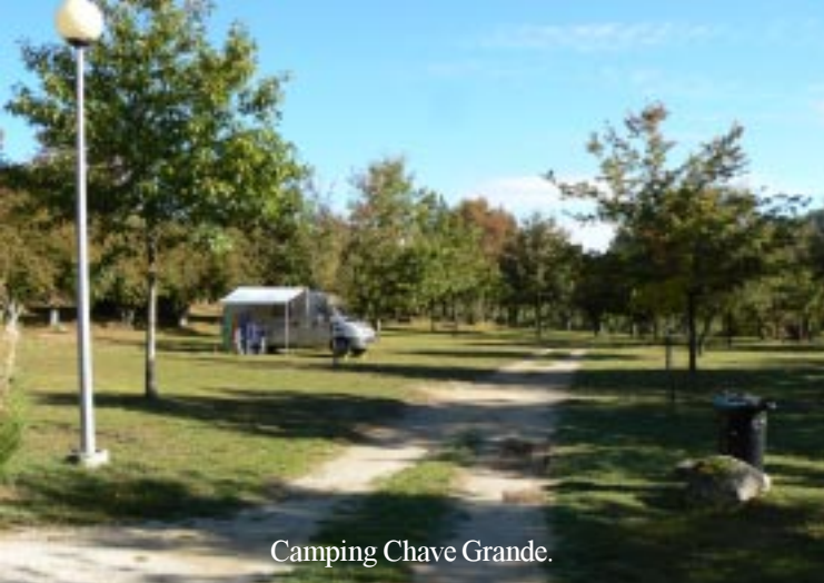
Camping Chave Grande.