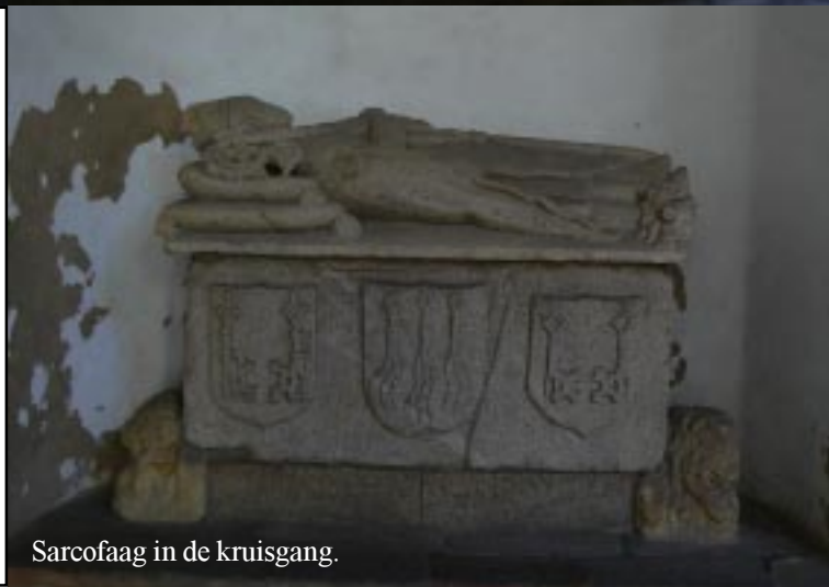
Sarcofaag in de kruisgang.

Sinds de 13e eeuw is er steeds aan de kerk gebouwd en verbouwd, hetgeen allerlei bouwstijlen heeft opgeleverd. Apart zijn de altaren in groene steen, de plafonds met dikke stenen geknoopte touwen als versiering, een relikwiehouder in de vorm van een onderarm en de kruisgang met oude azulejos.