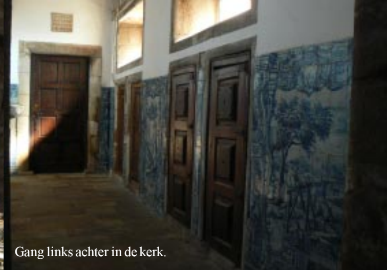
Gang links achter in de kerk.