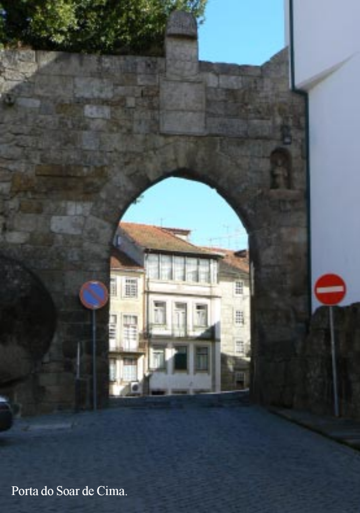
Porta do Soar de Cima.