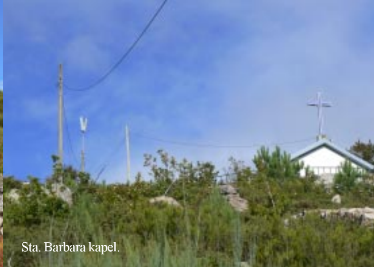
Sta. Barbara kapel.

We krijgen gezelschap van een enthousiast jong hondje, dat continu tussen ons op en neer rent.