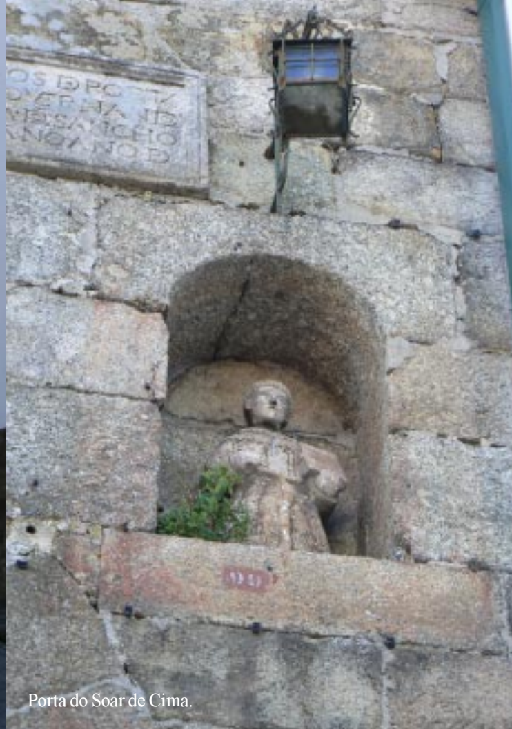
Porta do Soar de Cima.