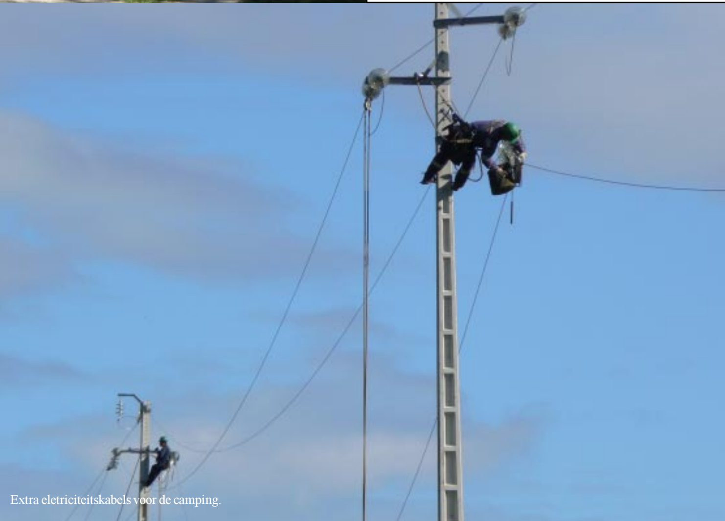
Extra elektriciteitskabels voor de camping.