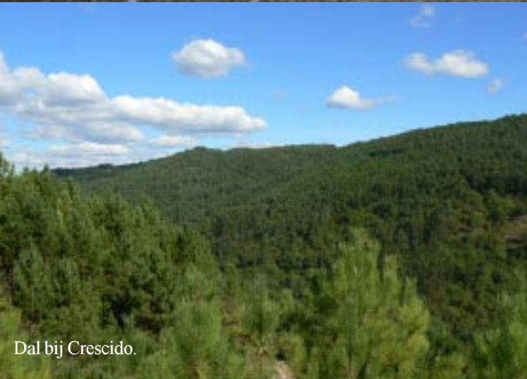
Dal bij Crescido.