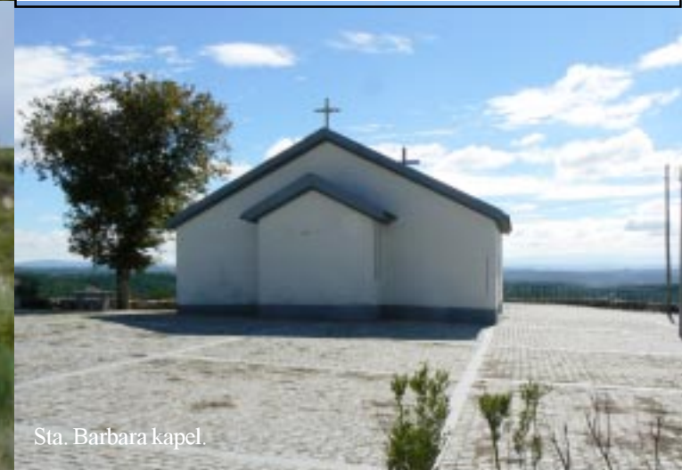
Sta. Barbara kapel.