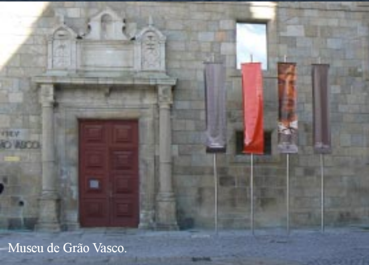
Museu de Grão Vasco.