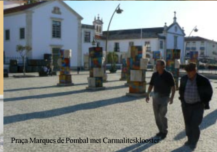
Praça Marques de Pombal met Carmalitesklooster.