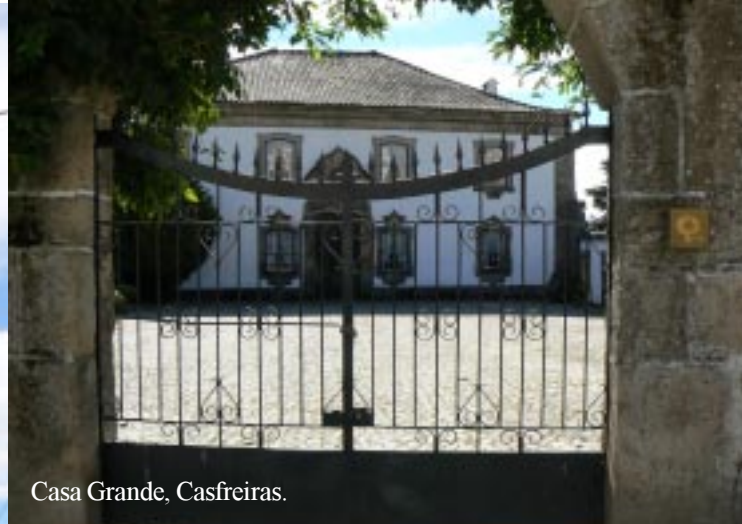
Casa Grande, Casfreiras.