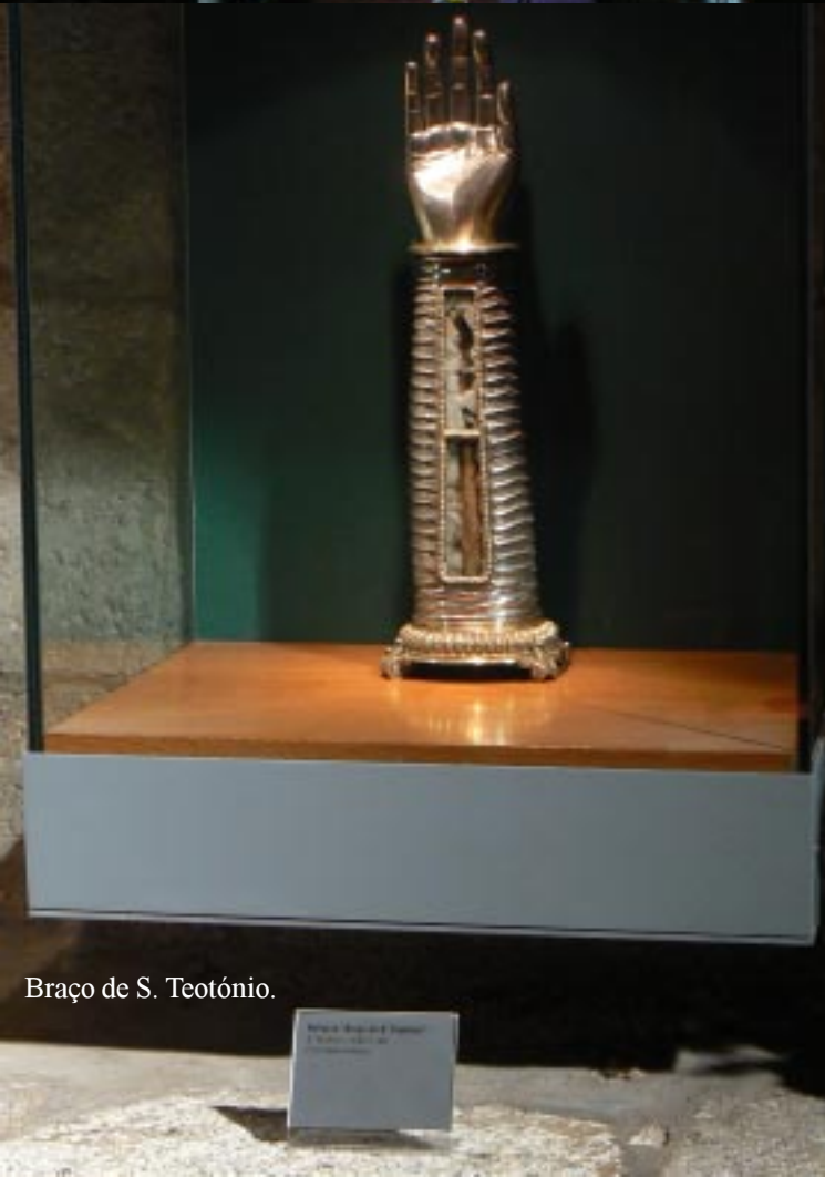
Braço de S. Teotónio.