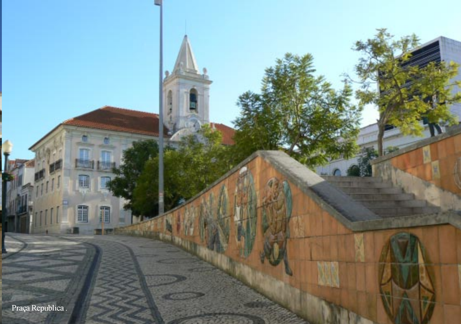
Praça Republica .