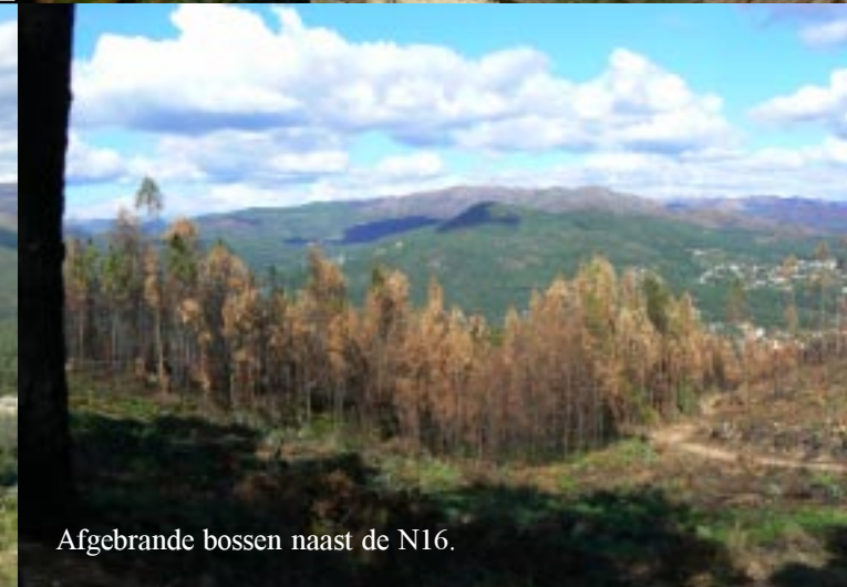
Afgebrande bossen naast de N16.