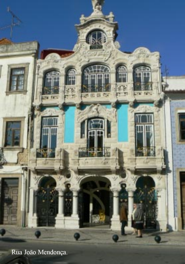
Rua João Mendonça.