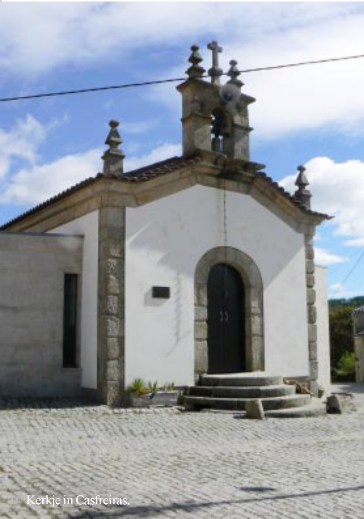
Kerkje in Casfreiras.