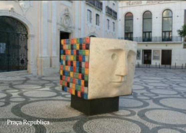
Praça Republica .