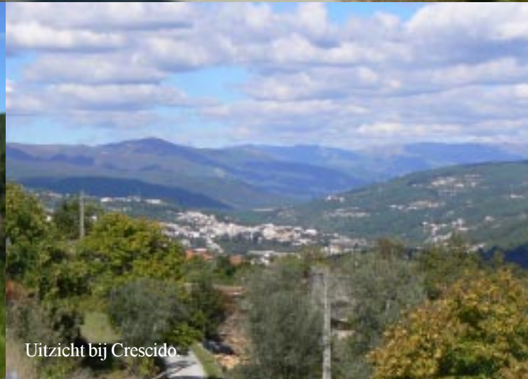
Uitzicht bij Crescido.