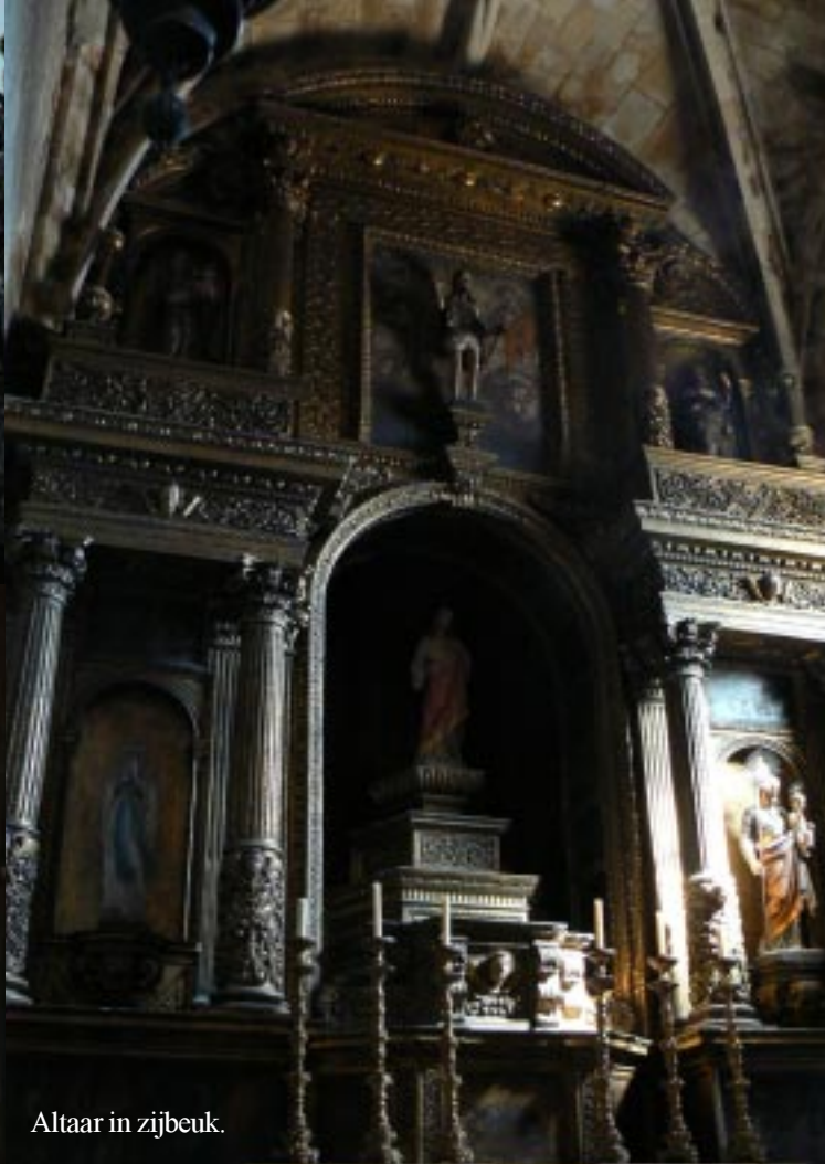
Altaar in zijbeuk.