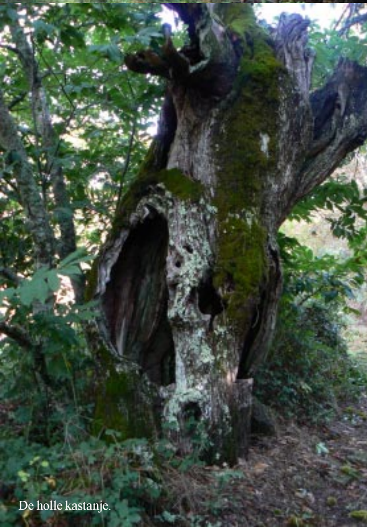
De holle kastanje.