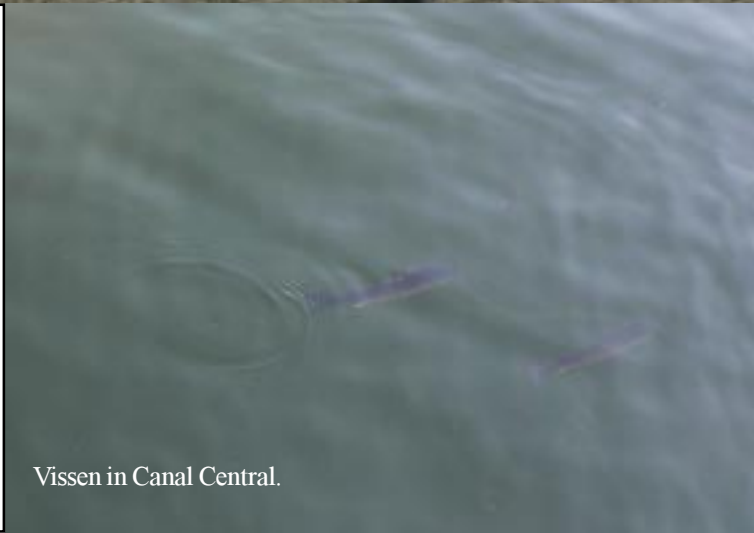
Vissen in Canal Central.

We stappen al snel op om de stad te gaan verkennen. Via twee kanalen komen we al snel in het centrum. Aveiro is een heel kleurrijke stad. Opvallend naast de kanalen, boten en de historische gebouwen zijn de sculpturen, waarin veel gezichten in verwerkt zijn. We komen ze op diverse plaatsen in de stad tegen. Met de kaart van het I-kantoor vinden we onze weg vrij simpel. We pikken twee caches op en moeten een derde laten liggen bij een fontijn.