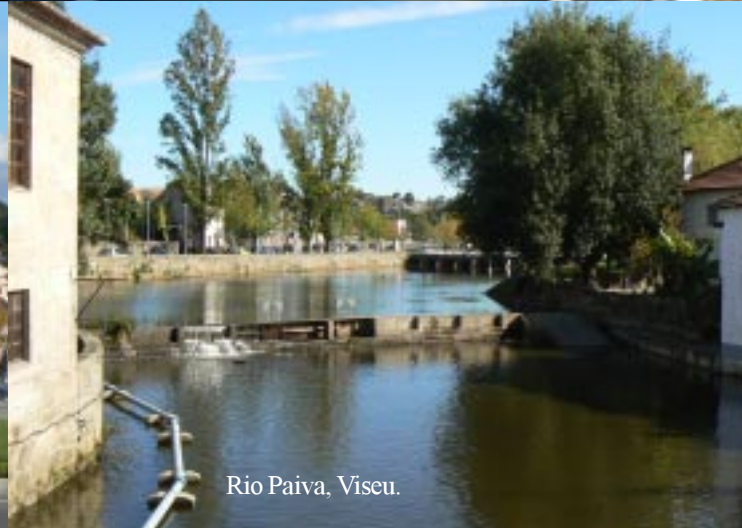
Rio Paiva, Viseu.