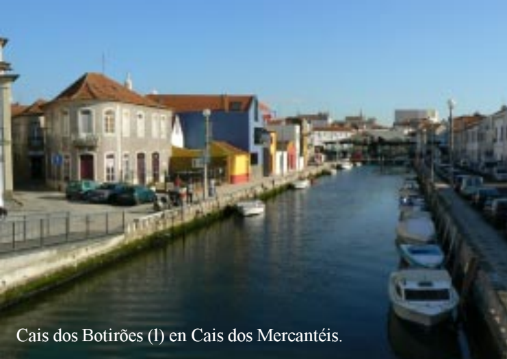
Cais dos Botirões (l) en Cais dos Mercantéis.