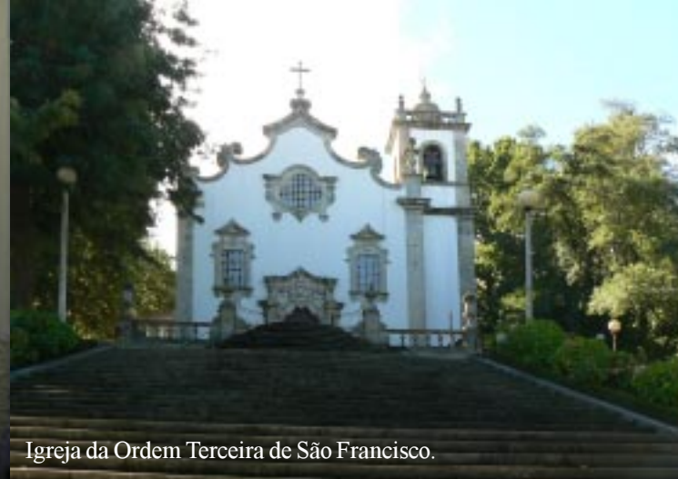
Igreja da Ordem Terceira de São Francisco.

Links aan een groot plein zien we boven aan een trap de azulejos bepleisterde Igreja da Ordem Terceiro de São Francisco. Iemand wijst ons desgevraagd de weg naar de Sé. (Zeg Sèè.)