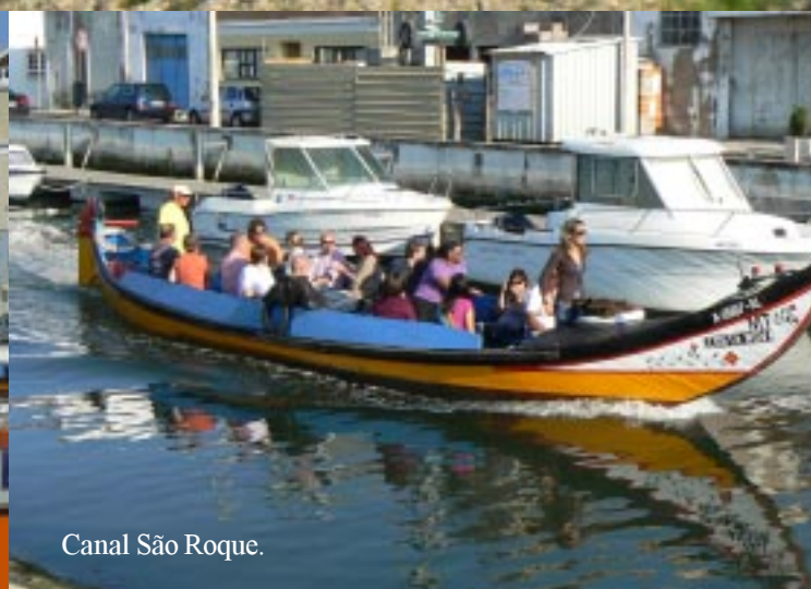
Canal São Roque.