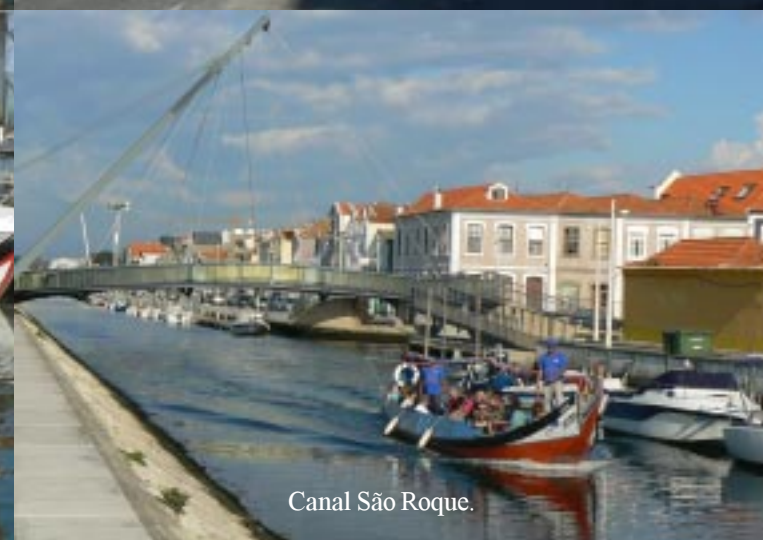
Canal São Roque.