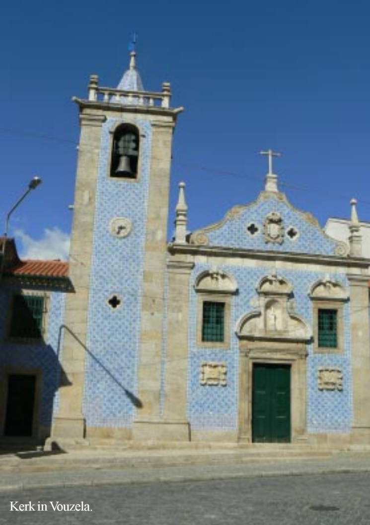
Kerk in Vouzela.

In Vouzela valt naast menig aardig gebouw de blauwe kerk op. Rio Vouga leidt de weg naar de snelweg terug, zodat het laatste stuk beter opschiet. Vlak voor het centrum van Aveiro zien we het felgekleurde Parque Desportivo de Aveiro.