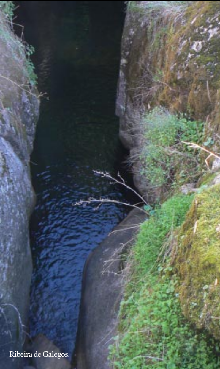
Ribeira de Galegos.