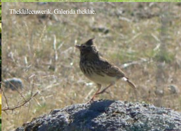
Theklalceuwerik, Galerida theklae.