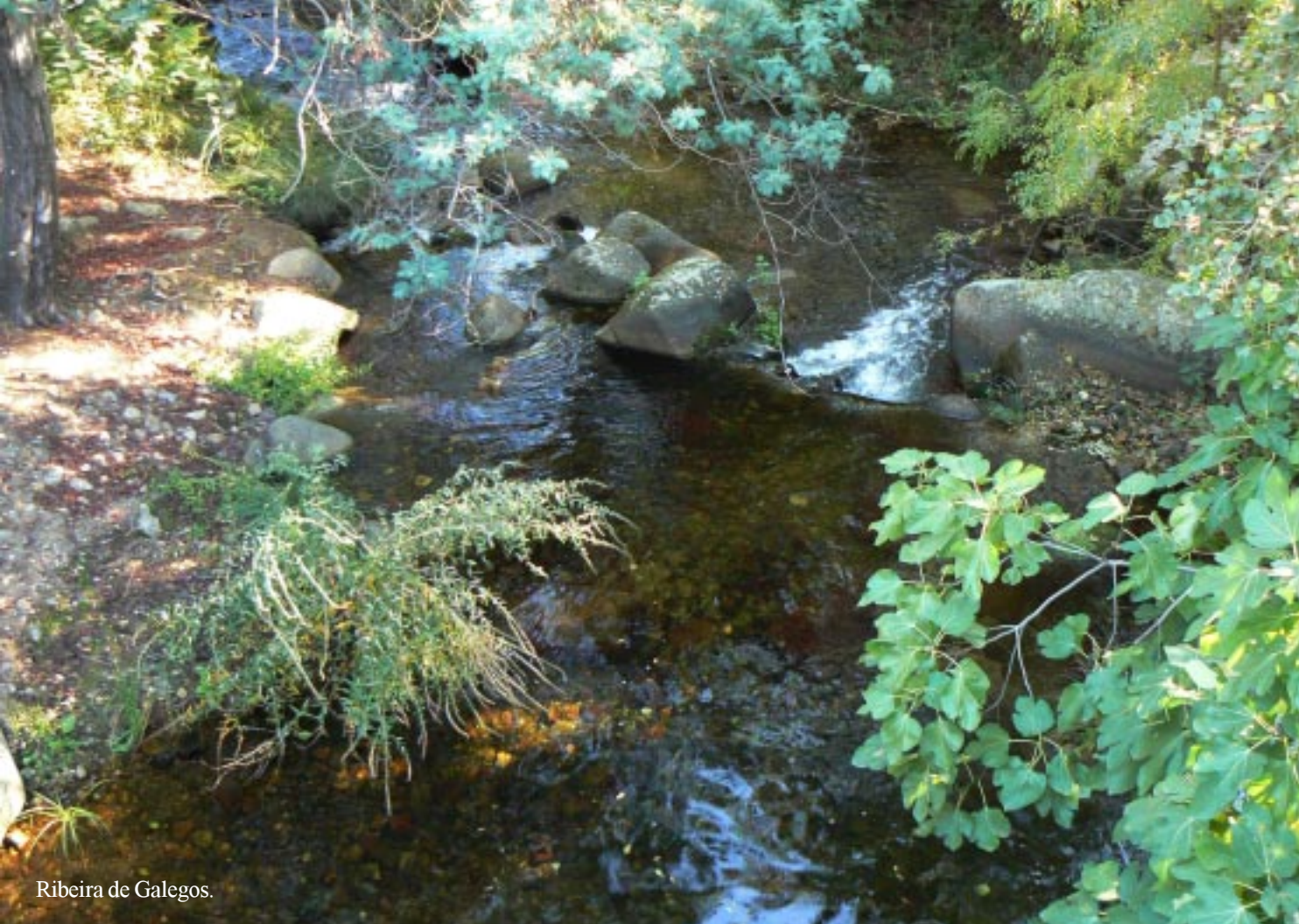
Ribeira de Galegos.