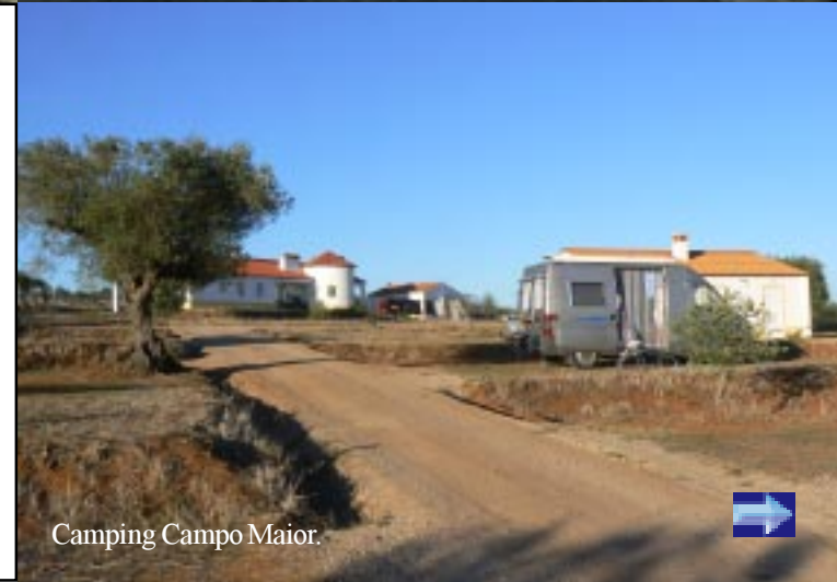
Camping Campo Maior.

Dan komen we via een groot centraal plein op de weg naar de camping dos Anjos een goede kilometer buiten de stad. 16.30 komen we er aan en gaan ons inchecken. Ook deze camping blijkt in Nederlands bezit te zijn. Ze zijn hier afgelopen voorjaar begonnen. Buiten ons is er overigens maar één ander (Nederlands) stel.