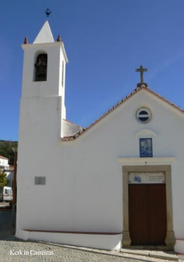
Kerk in Carreiras.