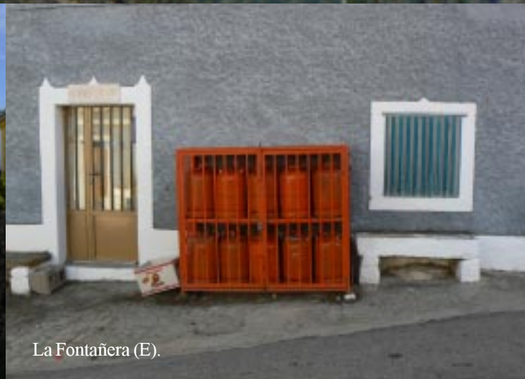
La Fontañera (E).