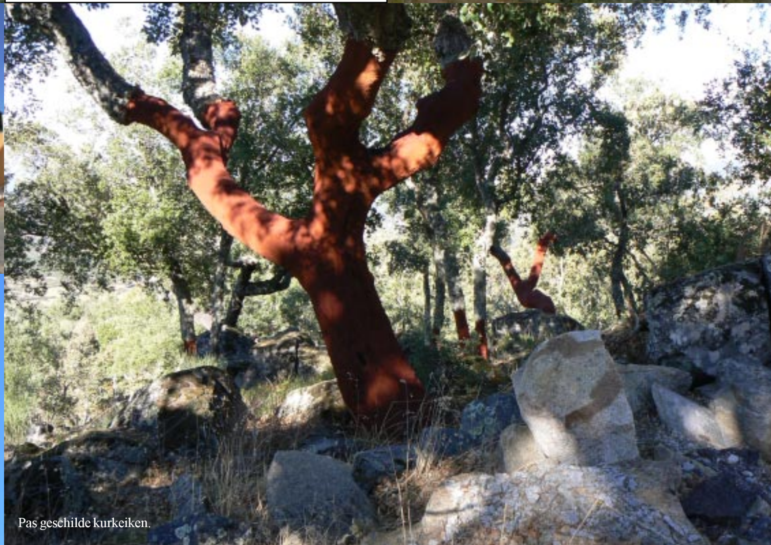
Pas geschilde kurkeiken.