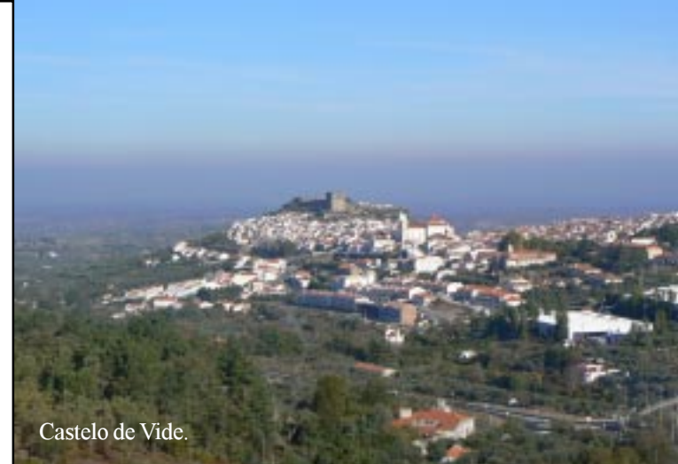
Castelo de Vide.

Om 10.20 beginnen we dan aan de 9,5 km lange wandeling uit het ANWB actief&anders gidsje. Dezelfde wandeling staat overigens ook op een infobord op het pleintje bij de kerk in Carreiras. Wel moeten we nu de oranje-rode tekens volgen in plaats van de wit-groene (volgens de ANWB).