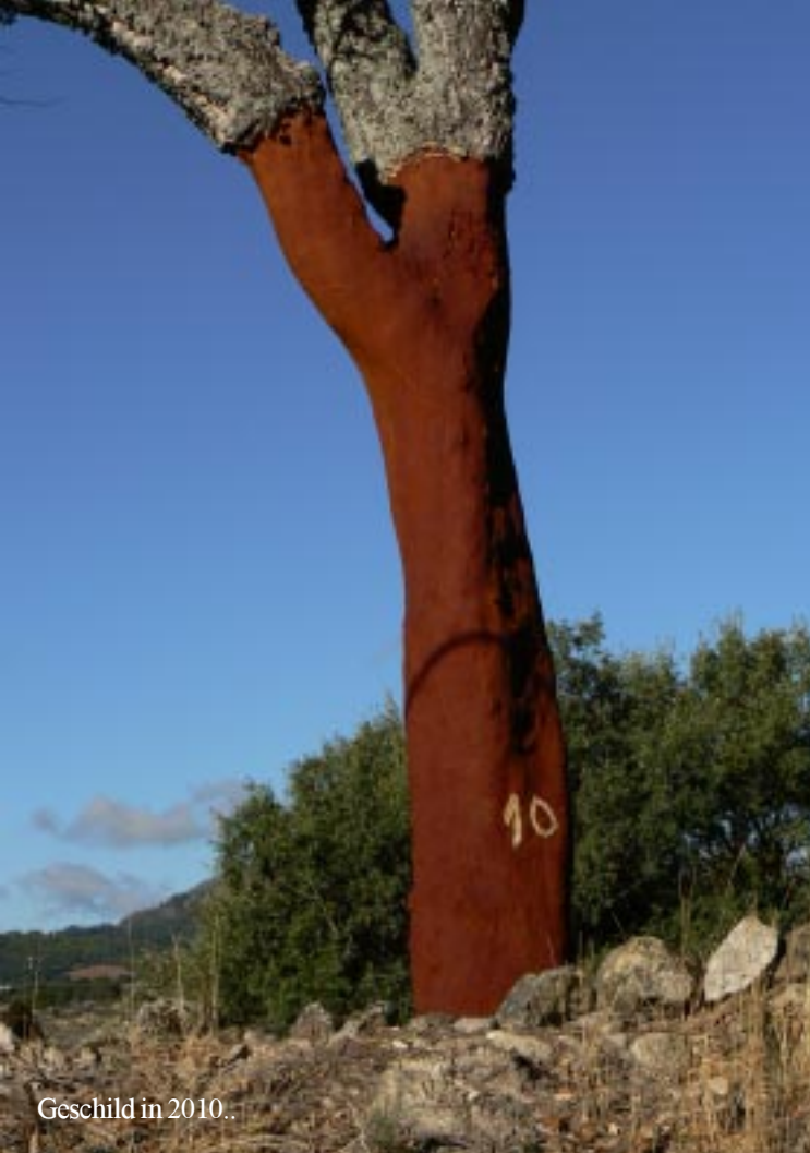
Geschild in 2010..