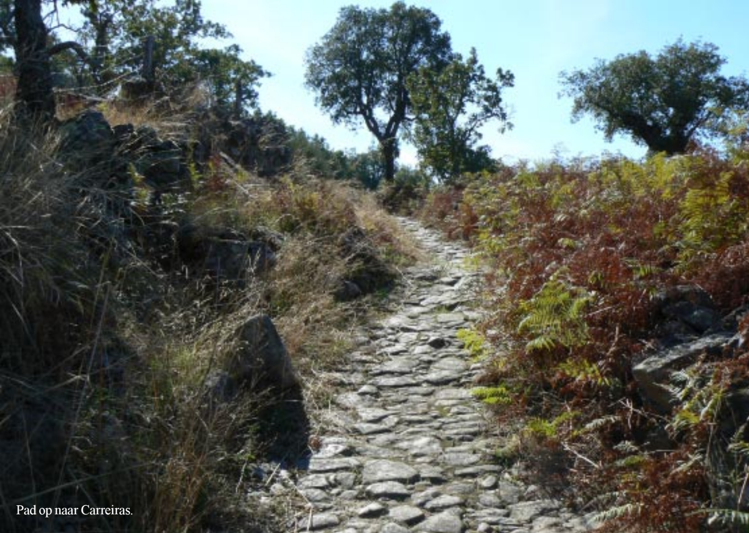
Pad op naar Carreiras.