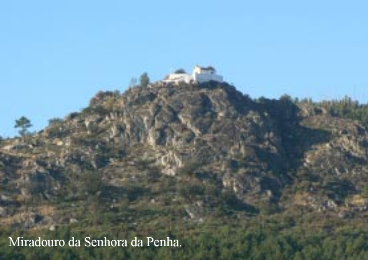
Miradouro da Senhora da Penha.