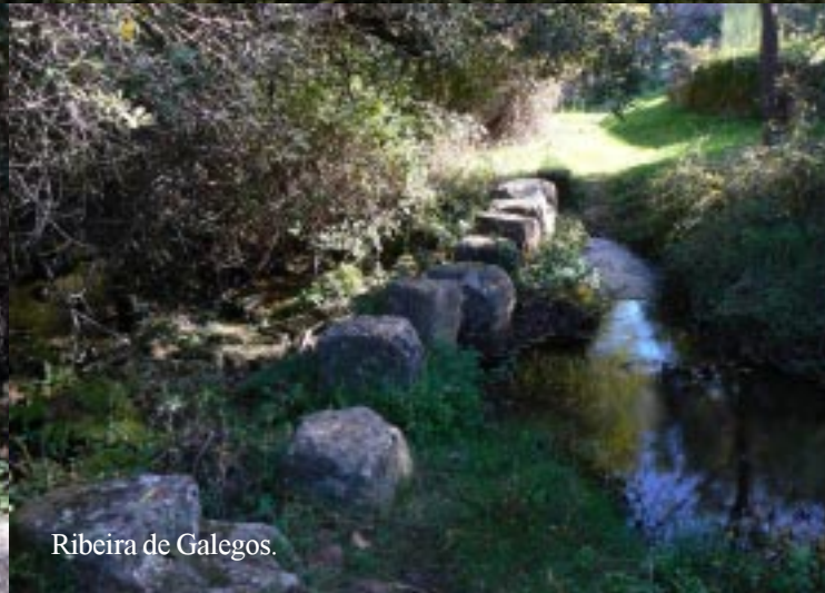
Ribeira de Galegos.