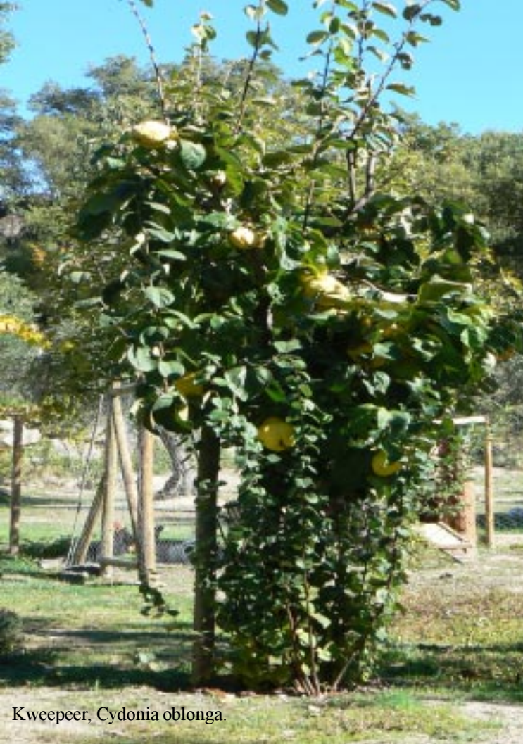
Kweepeer, Cydonia oblonga .