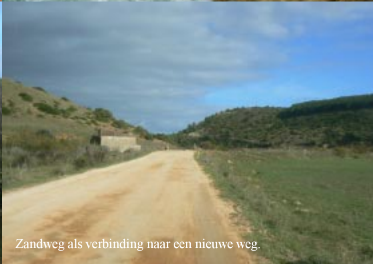
Zandweg als verbinding naar een nieuwe weg.