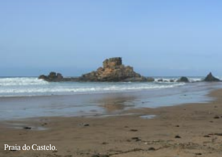
Praia do Castelo.