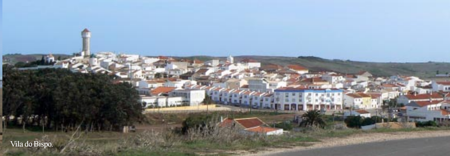
Vila do Bispo.