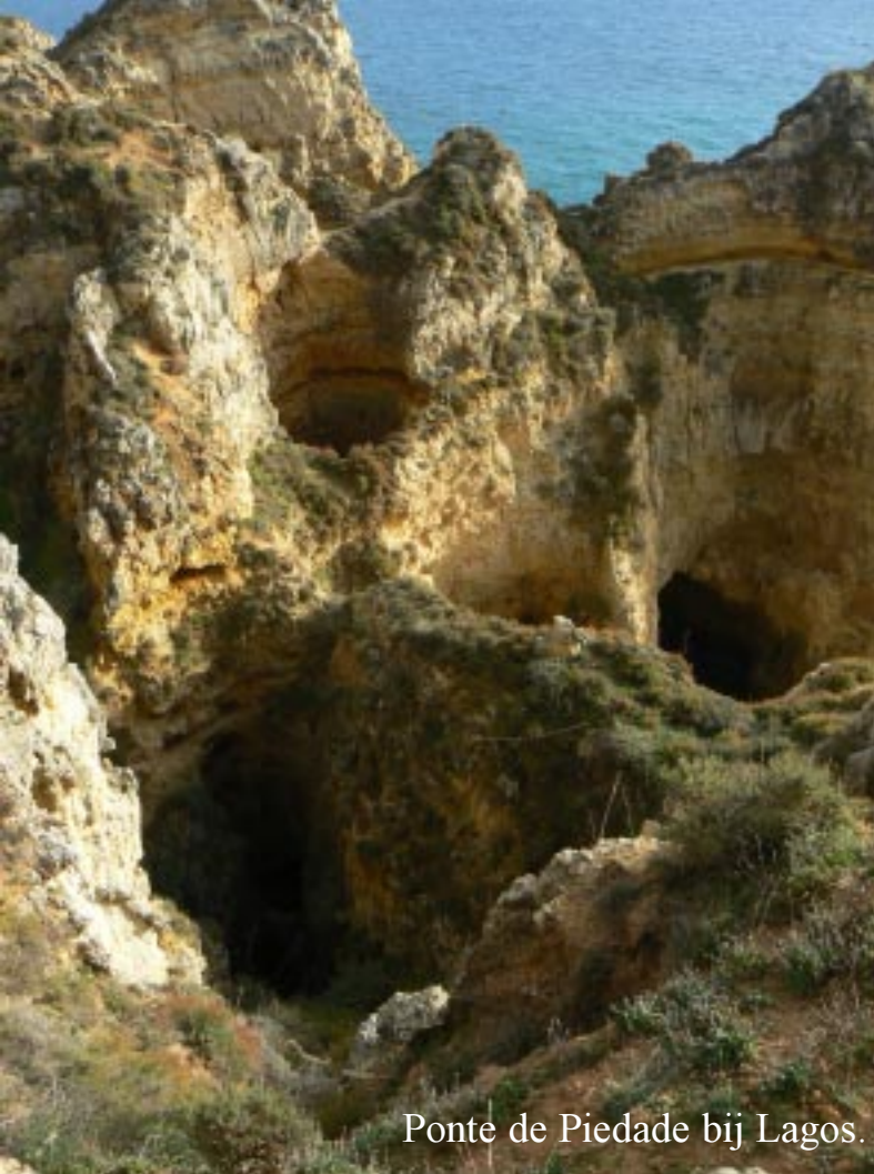
Ponte de Piedade bij Lagos.