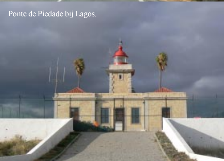
Ponte de Piedade bij Lagos.