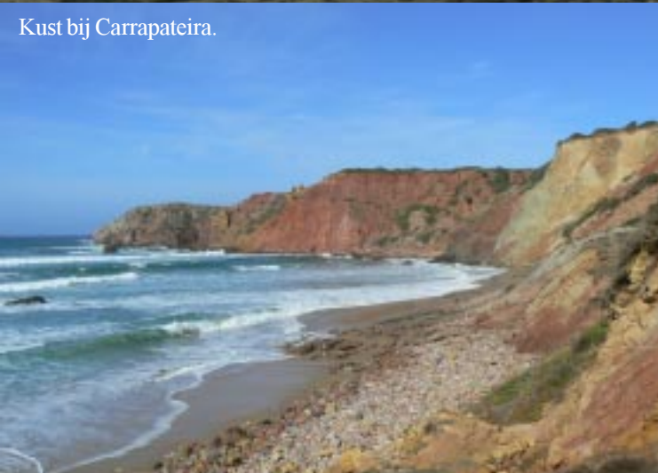
Kust bij Carrapateira.