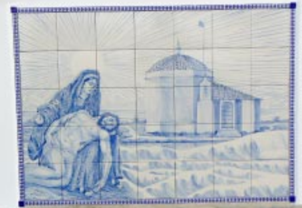
Vroeger stond hier de Capela de Piedade.

De kust helemaal naar Lagos volgen kan niet, want daar liggen de zeer hoge kliffen van Ponte da Piedade tussen. Daar gaan we wel heen. 15.30 -15.55. Schitterende verticale gaten zijn hier uit de rotsen gesleten en dat levert uiteraard heel wat bekijks op. (Wij waren hier vorig jaar ook al zien we als we er weer zijn.) Dan rijden we Lagos in, zetten Zippy daar op dezelfde plek neer als vorig jaar. (16.30) Alhoewel, wat is hetzelfde? Het veldje van zand en stenen is intussen netjes geasfalteerd en een betaalde parking geworden.