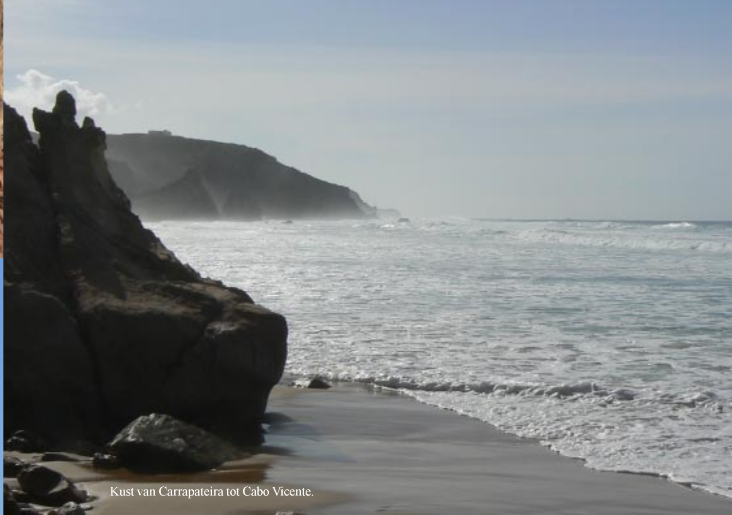
Kust van Carrapateira tot Cabo Vicente.