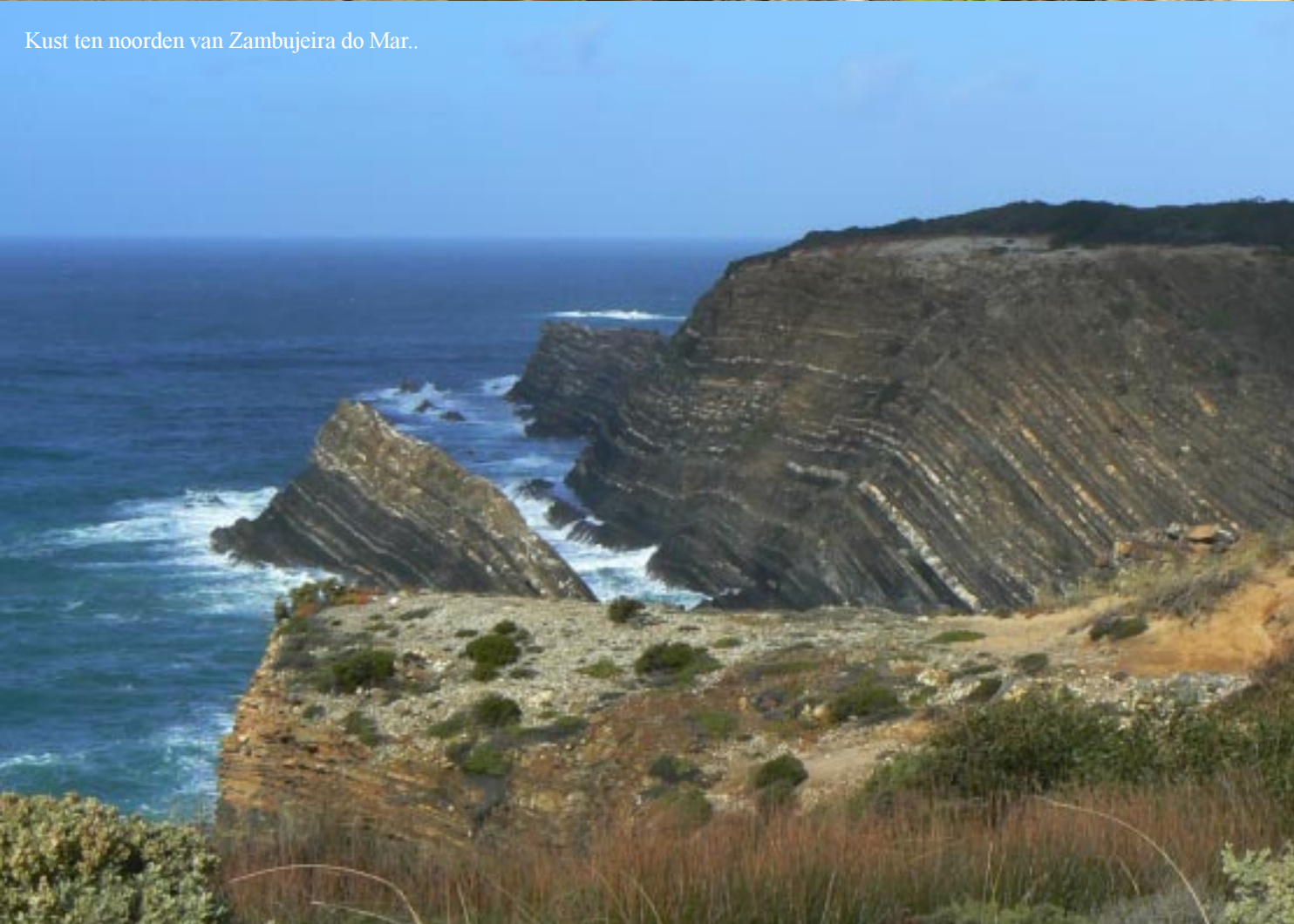
Kust ten noorden van Zambujeira do Mar..

Uiteraard zien we massa's van die Zuid-Afrikaanse vetplanten, maar ook veel Engels gras, een lage soort jeneverbes, gele distels en die krokusachtige bloemen zonder blad. Op een rotseiland in zee zien we echter enkele ooievaarsnesten. Leeg maar toch, die verwacht je daar niet. Op enkele plaatsen moeten we terug naar de weg, omdat de directe doorgang langs zee onmogelijk is. Bij alle paden naar zee terug staan infoborden over de natuur hier. Zo bijvoorbeeld ook een bord over de effecten van de temperatuur van het zeewater op de voedselvoorziening. Het water langs de Portugese Atlantische kust is dus heel koud!