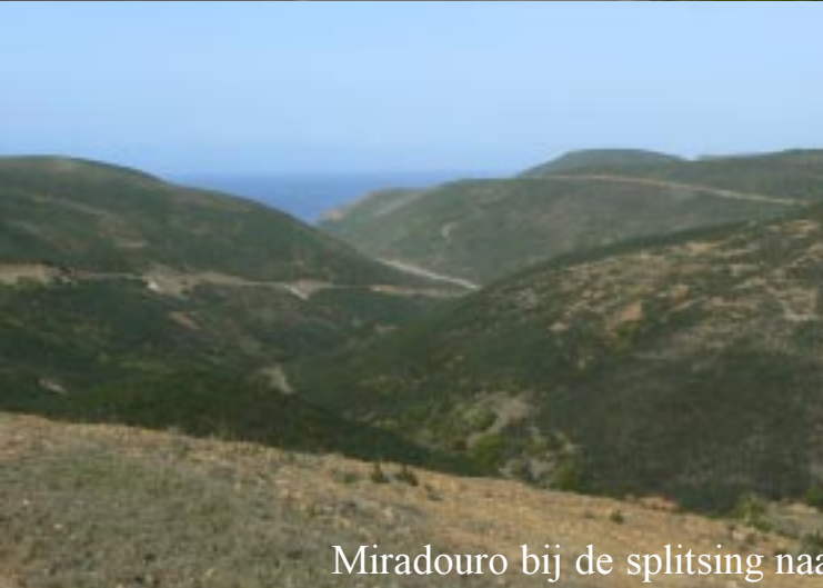
Miradouro bij de splitsing naar Pr. do Castelo en Pr. da Cordoama.

Ten westen van Vila do Bispo zoeken we de Praia da Corfdoama en do Castelo op. Onderweg daarheen kijken we even bij een weids uitzicht over dalen (13.35)