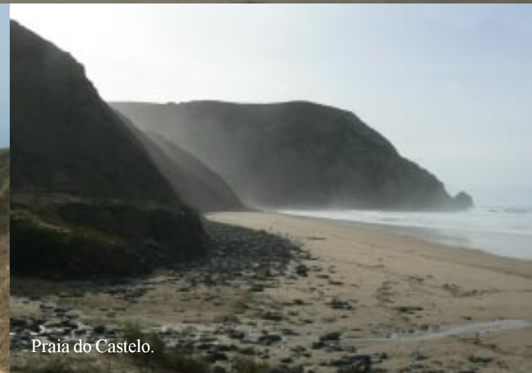
Praia do Castelo.