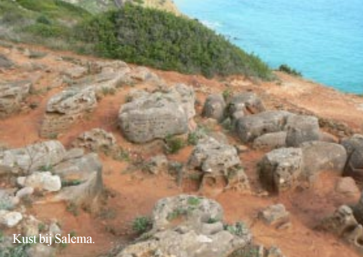
Kust bij Salema.