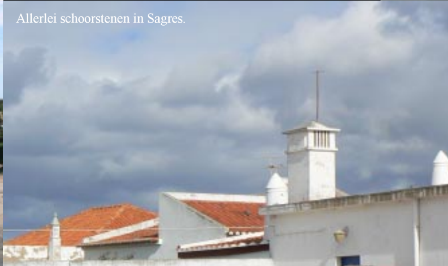
Allerlei schoorstenen in Sagres.