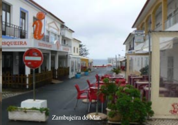
Zambujeira do Mar.