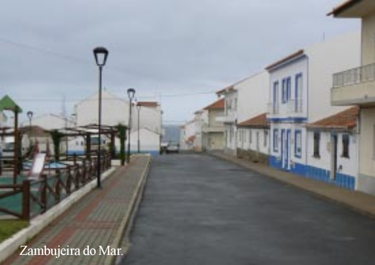
Zambujeira do Mar.