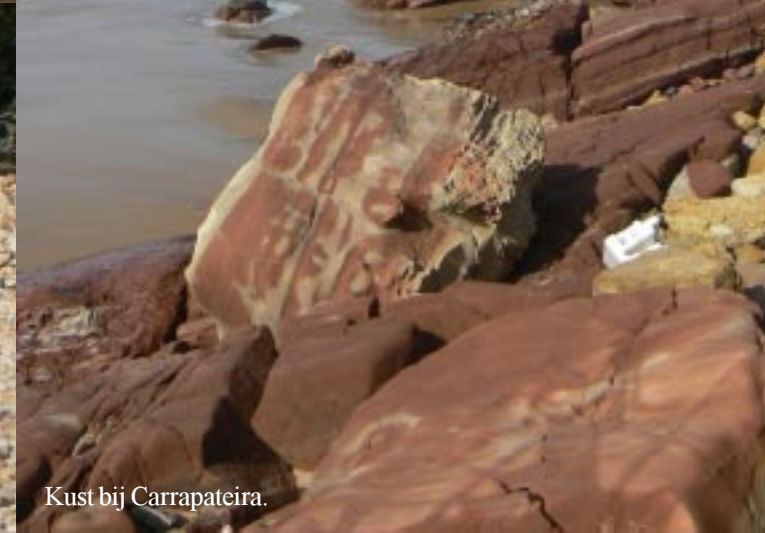
Kust bij Carrapateira.