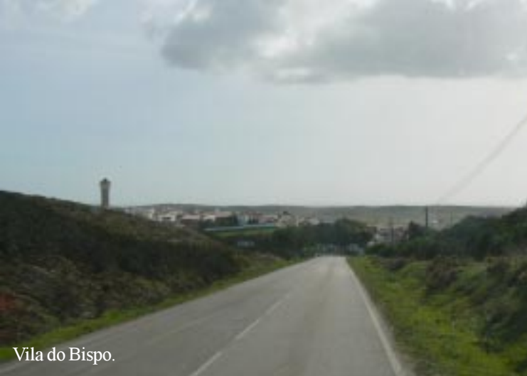
Vila do Bispo.