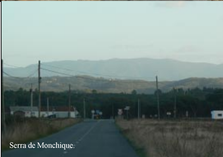
Serra de Monchique.

Om 16.15 rijden we dan in zuidelijke richting naar Aljezur en de Serra de Monchique, die daar achter ligt. In Aljezur (16.45) komen we dus net voor de schemering binnen en gebruiken die tijd om een rondgang door dit ietwat sleetse (oude?) stadje te maken. Het ligt zeer steil tegen de heuvel op, zodat het weer flink klimmen is. Maar dat wordt beloofd met mooie zichten op de oude èn de nieuwe stad aan de oostzijde en mooie dalen en heuvels aan de westkant.