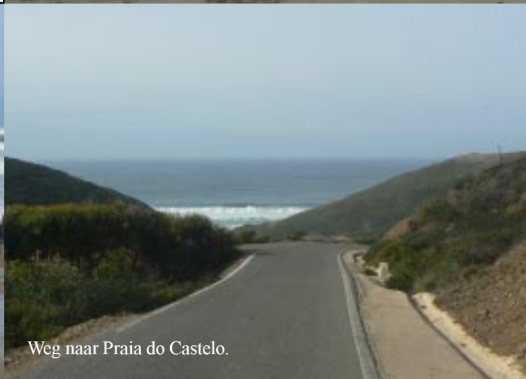
Weg naar Praia do Castelo.