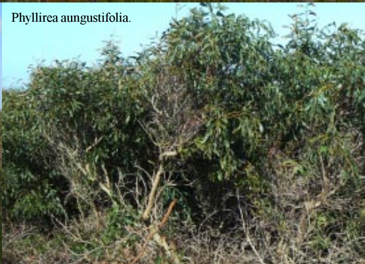
Phyllirea angustifolia .