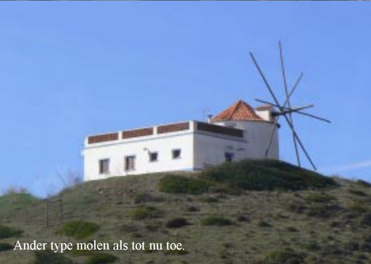
Ander type molen als tot nu toe.