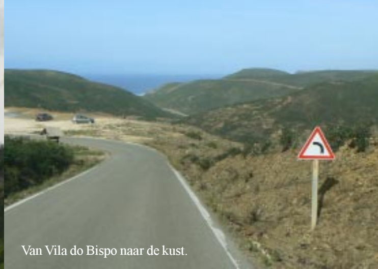
Van Vila do Bispo naar de kust.

Ten westen van Vila do Bispo zoeken we de Praia da Corfdoama en do Castelo op. Onderweg daarheen kijken we even bij een weids uitzicht over dalen (13.35)