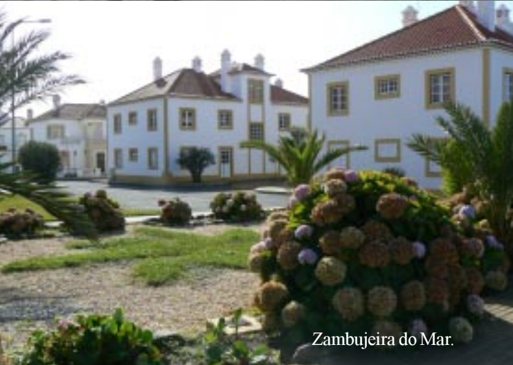
Zambujeira do Mar.

Na 4458 km in totaal vertrekken we na de wandeling om 12.20. Eerst naar het grotere plaatsje Teotónio om boodschappen te doen. We nemen een Duitser mee terug naar zijn auto 6 km verderop. Hij heeft 10 l diesel bij zich in waterflessen. Woont trouwens al 12 jaar hier aan de kust. 's Winters is het wel stil en eenzaam. Net voor onze afslag naar Azenha do Mar bereiken we zijn auto. Na de lunch in Azenha (13.40- 14.10) op een uitzichtterras, wandelen we ook hier noordwaarts naar het huis op de rotsen, waar Amalia Rodrigues heeft gewoond. Deze kust lijkt sterk op die we eerder vandaag zagen, maar is nog wilder en ruiger van vorm. Hier zien we de ooievaars op een rotseiland wel!