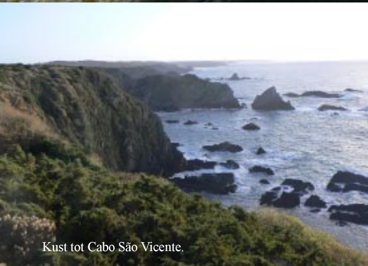
Kust tot Cabo São Vicente.

Om vier uur kijken we nog even in Azanha do Mar naar het piepkleine haventje, dat door twee kleine maar massieve strekdammen enigszins tegen de wilde oceaan beschermd wordt.