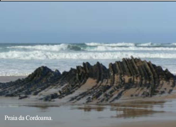
Praia da Cordoama.