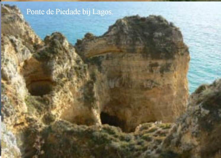
Ponte de Piedade bij Lagos.