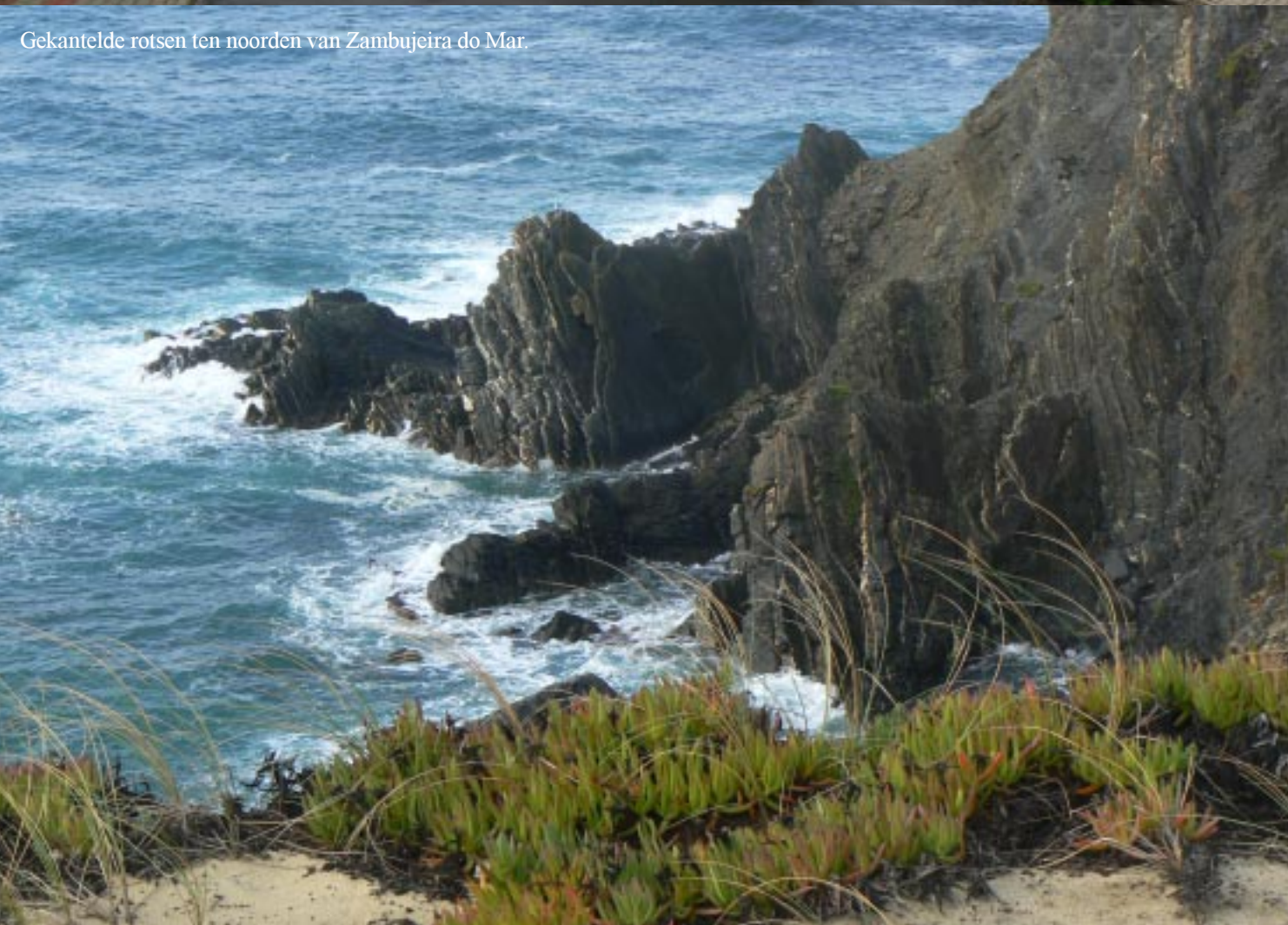
Gekantelde rotsen ten noorden van Zambujeira do Mar.

We wandelen 's morgens pas om half elf. Eerst een eind langs de zwarte kust met vele witte quarzietlijnen noordwaarts. Aparte rotsformaties zijn er, die steeds in een andere richting zijn weggezakt. Wat verder zien we die waterval van gisteren weer, nu heel wat forser door de regen van vannacht. (De lucht klaart overigens weer compleet op.) We zien weer Zwarte roodstaarten en allerlei struiken. Heb enkele foto's van infoborden gemaakt om wat van die planten te kunnen thuisbrengen.