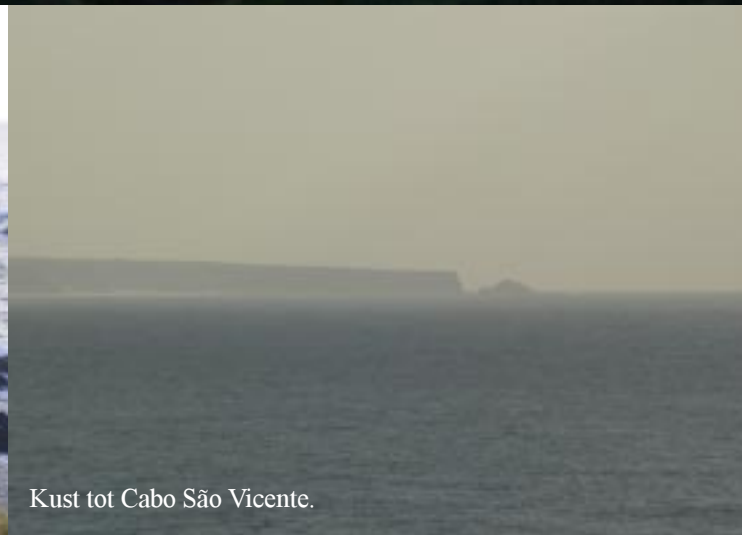
Kust tot Cabo São Vicente.