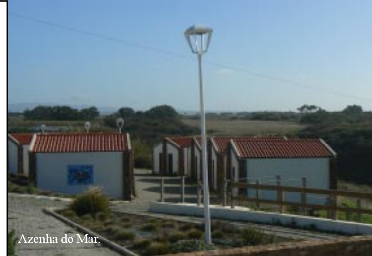
Azenha do Mar.

Na 4458 km in totaal vertrekken we na de wandeling om 12.20. Eerst naar het grotere plaatsje Teotónio om boodschappen te doen. We nemen een Duitser mee terug naar zijn auto 6 km verderop. Hij heeft 10 l diesel bij zich in waterflessen. Woont trouwens al 12 jaar hier aan de kust. 's Winters is het wel stil en eenzaam. Net voor onze afslag naar Azenha do Mar bereiken we zijn auto. Na de lunch in Azenha (13.40- 14.10) op een uitzichtterras, wandelen we ook hier noordwaarts naar het huis op de rotsen, waar Amalia Rodrigues heeft gewoond. Deze kust lijkt sterk op die we eerder vandaag zagen, maar is nog wilder en ruiger van vorm. Hier zien we de ooievaars op een rotseiland wel!