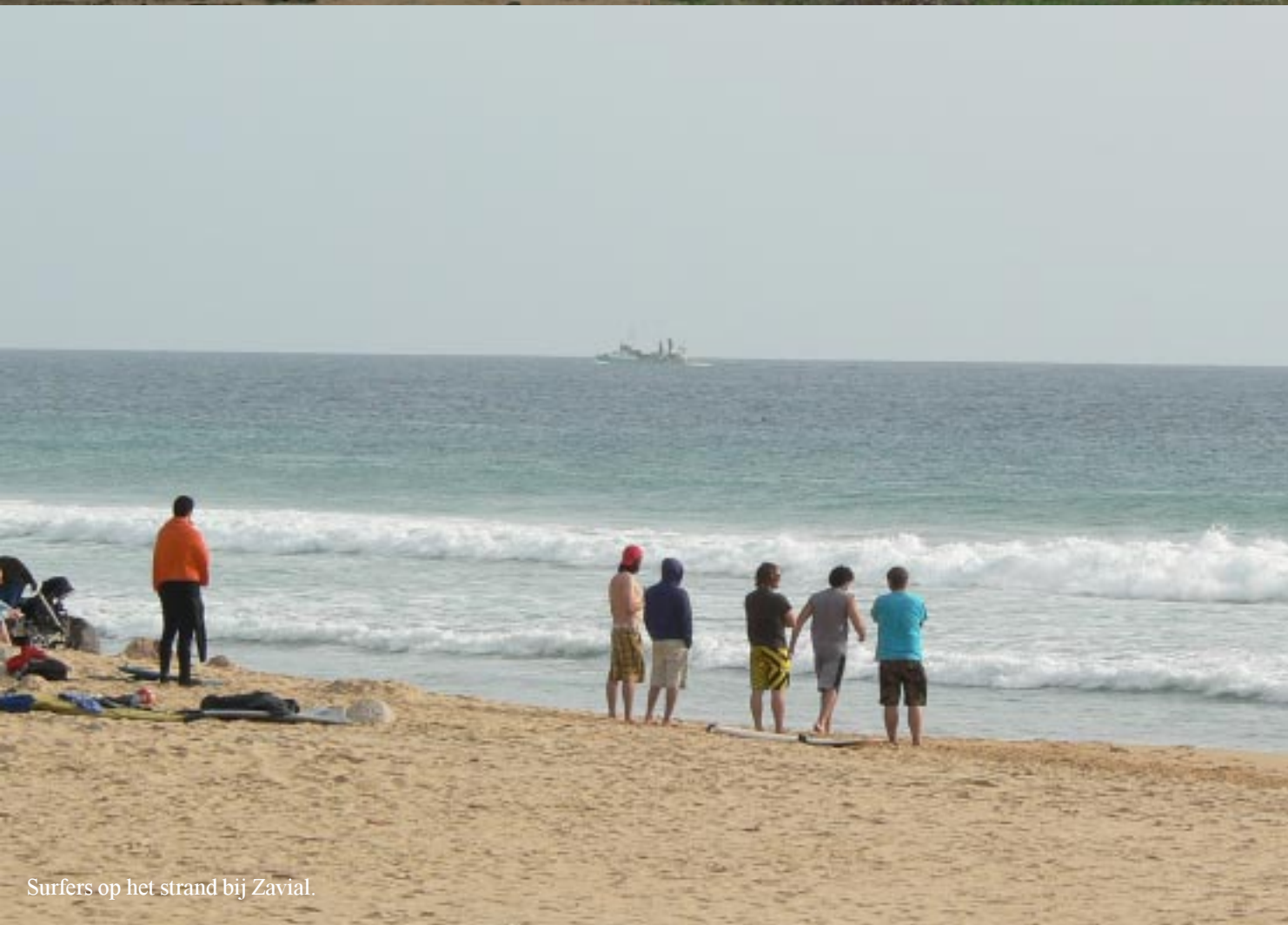
Surfers op het strand bij Zavial.

In Vila do Bispo gaan we bij de LIDL boodschappen doen. (15.20) We rijden naar twee camperplaatsen 6,5 en 7,2 km van Vila do Bispo. Dat blijken de strandjes van Zavial en Ingrina te zijn, waar we vorige winter al eens waren.