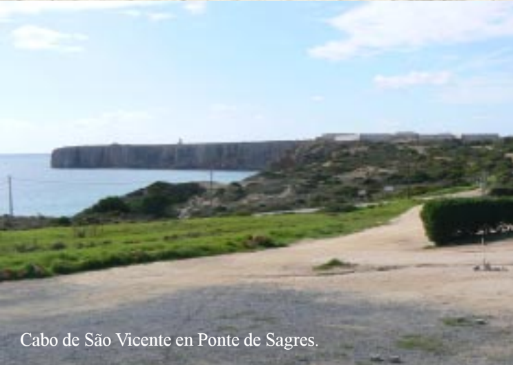
Cabo de São Vicente en Ponte de Sagres.