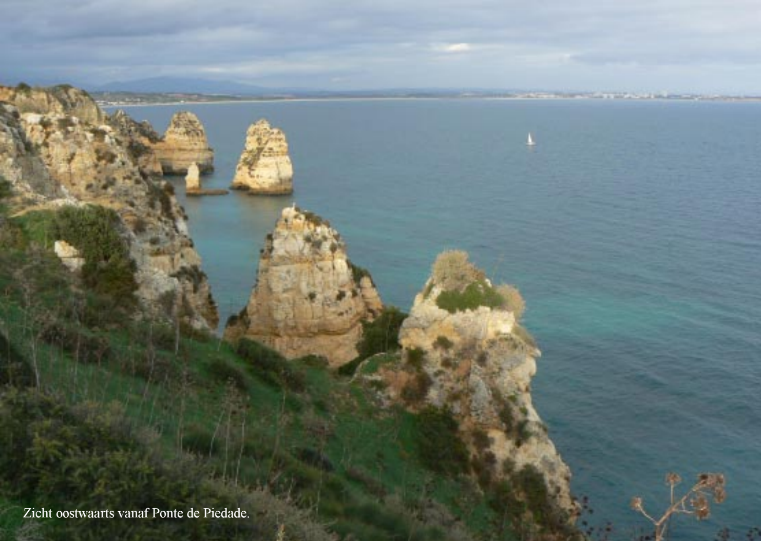
Zicht oostwaarts vanaf Ponte de Piedade.