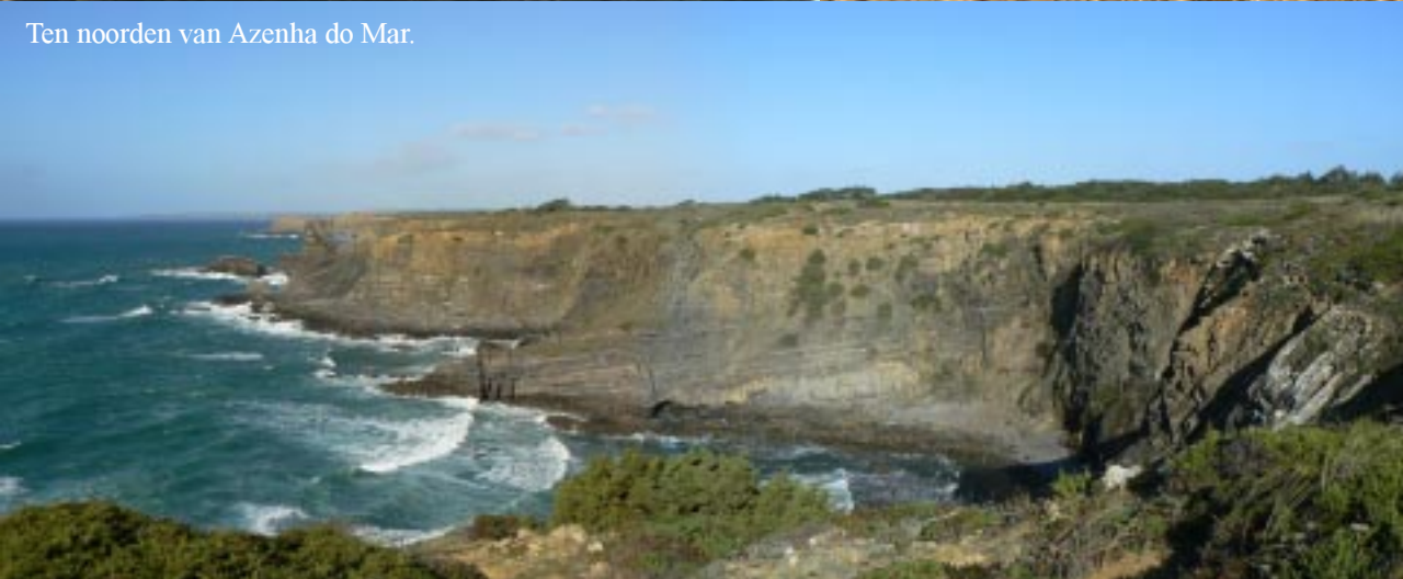
Ten noorden van Azenha do Mar.