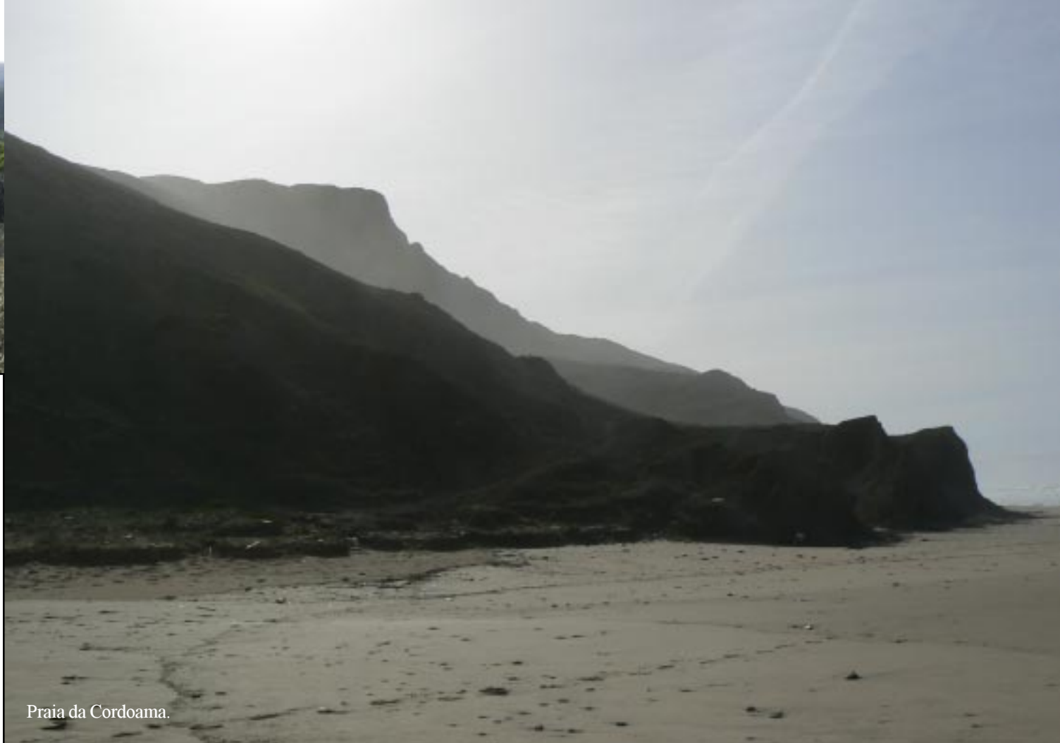
Praia da Cordoama.

Bij beide stranden wordt geadviseerd beneden op het strand uit de buurt van de kliffen te blijven. Steenlawines kunnen tot anderhalve hoogte ver het strand op knikkeren. Borden geven aan waar men nog veilig kan verblijven. De zee is wild hier, golven vernevelen als ze op de rotsen te pletter slaan.