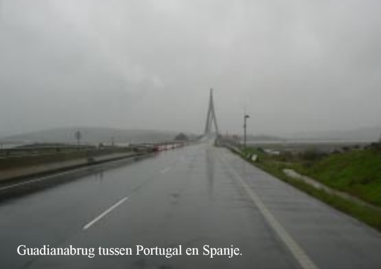
Guadianabrug tussen Portugal en Spanje.