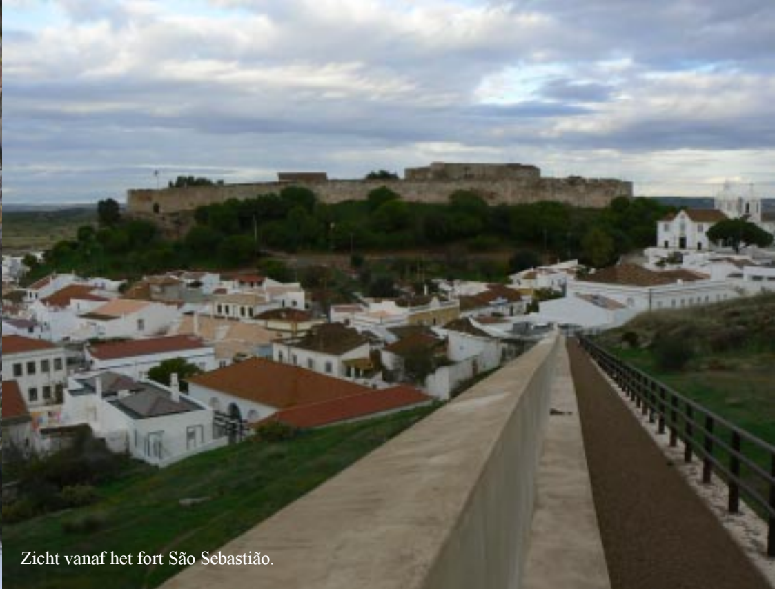
Zicht vanaf het fort São Sebastião.