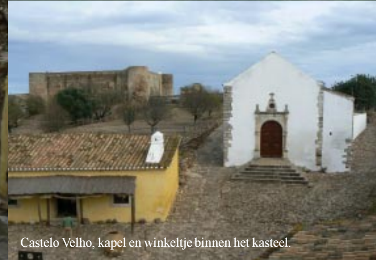
Castelo Velho, kapel en winkeltje binnen het kasteel.