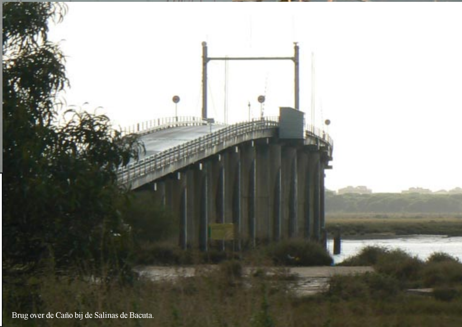
Brug over de Caño bij de Salinas de Bacuta.

Als we genoeg gezien hebben moeten we voor een fikse bui terug sprinten. Die wachten we af en rijden dan over de bolle ophaalbrug (?) verder het schiereiland over. Overal staan bordjes dat dit een natuurpark is. Een prachtige wetland van oude zoutpannen, waar vele vogels zitten. Tegenover het bezoekerscentrum zien we aardig wat flamingo's. Op de terugweg kijken we nog even bij een andere kijkhut. Maar dat levert slechts enkele Bontbekplevieren op. Het tij is nu blijkbaar te laag om vogels te trekken.