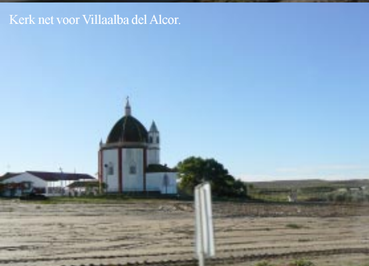
Kerk net voor Villalba del Alcor.