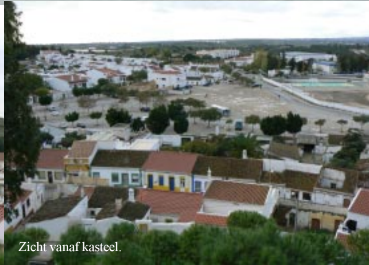
Zicht vanaf kasteel.