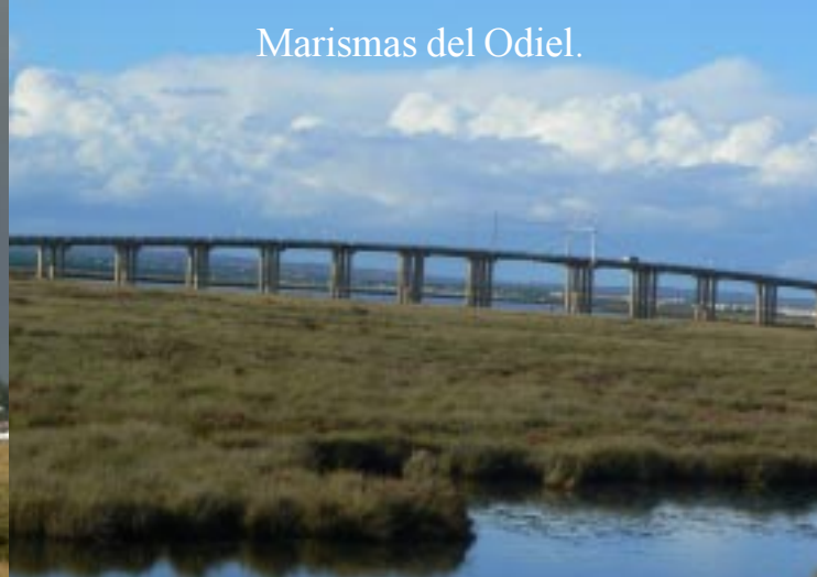
Marismas del Odiel.