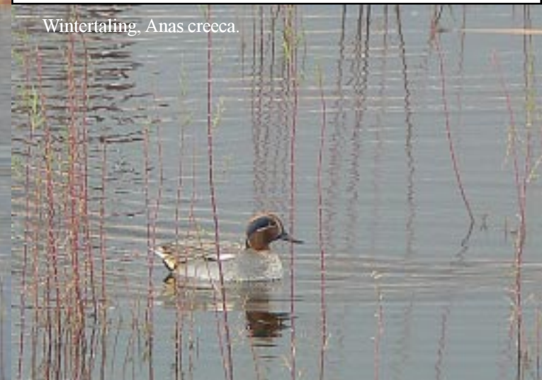
Wintertaling, Anas crecca .