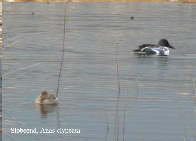
Slobeend, Anas clypeata .