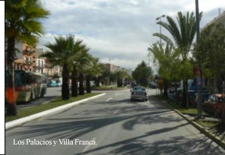
Los Palacios y Villa Franca.

Daar vinden we allerlei vreemde bootbouwsels op het water en het veerpontje, waarmee we naar de overkant kunnen. (13.35) Door vlak en nat gebied naar Los Palacios y Villa Franca (14.05) en door naar Sanlúcar de Barrameda over een nieuwe weg, die de GIO_MIO nog niet kent. Grote katoenvelden en dan uitgestrekte braakliggende grond zien we hier. Af en toe zijn er kleine witte dorpen op de spaarzame heuvels.