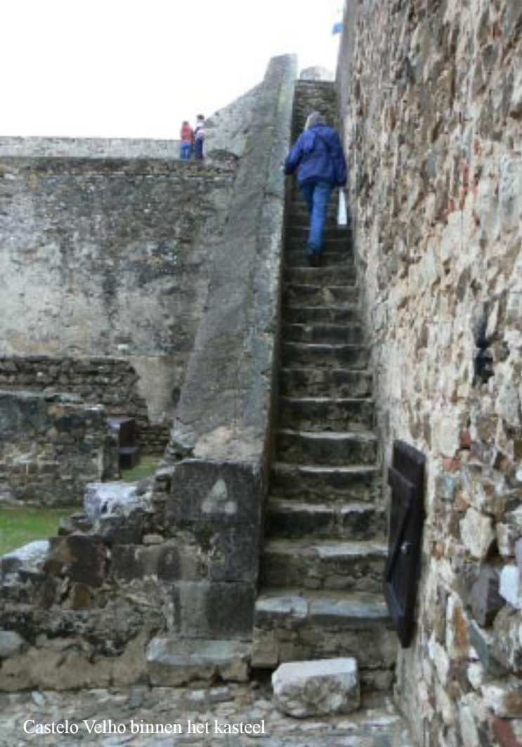
Castelo Velho binnen het kasteel