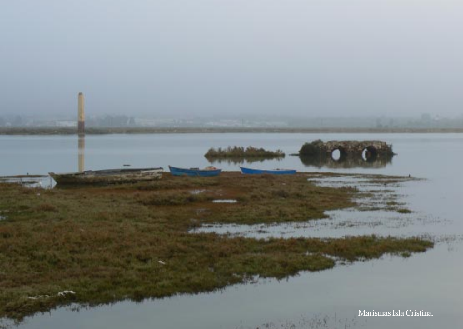
Marismas Isla Cristina.