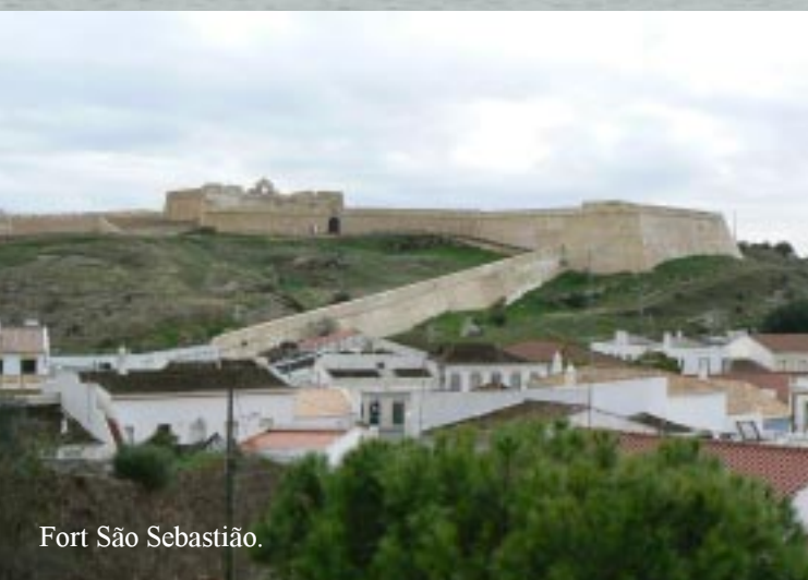
Fort São Sebastião.