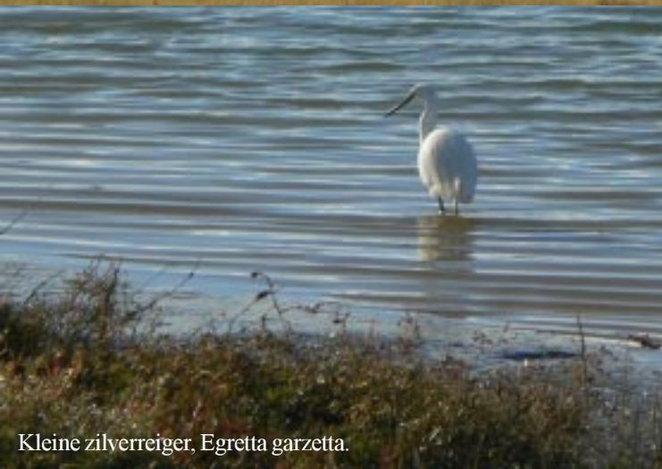
Kleine zilverreiger, Egretta garzetta .