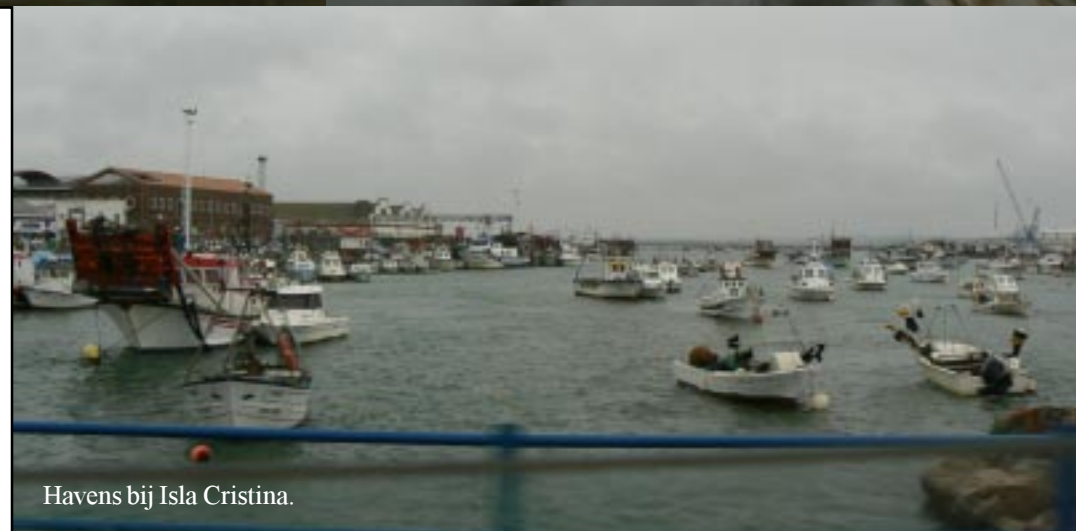
Havens bij Isla Cristina.

Via de snelweg rijden we naar de afslag van Isla Cristina, waar we willen overnachten. De hele tijd zien we moeras en zoutpannen.