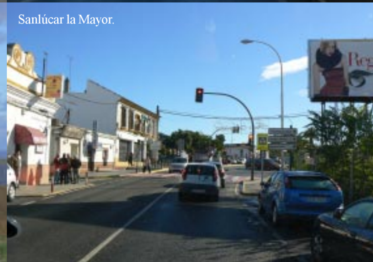
Sanlúcar la Mayor.