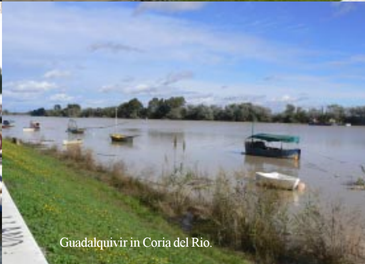
Guadalquivir in Coria del Rio.