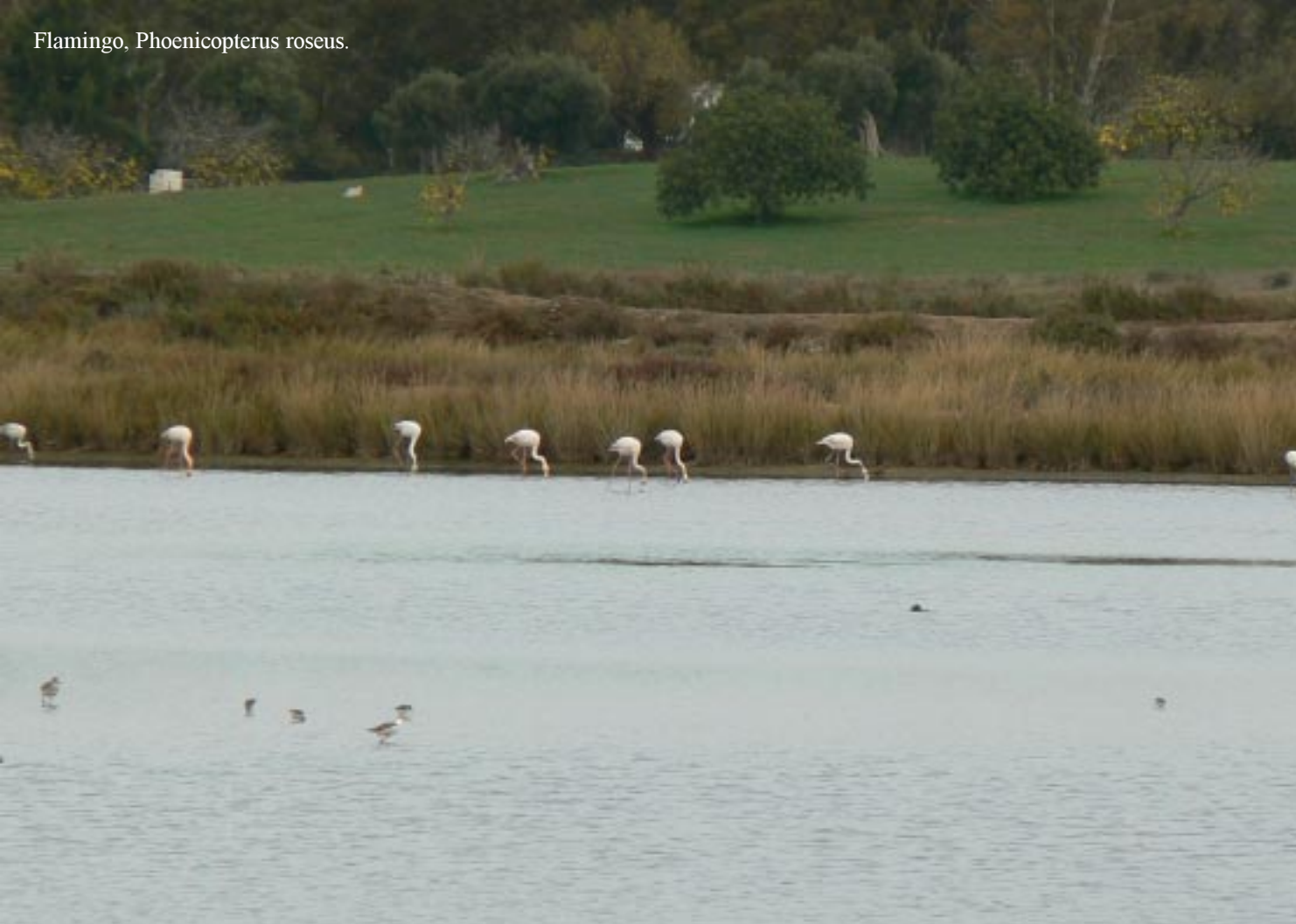
Flamingo, Phoenicopterus roseus .