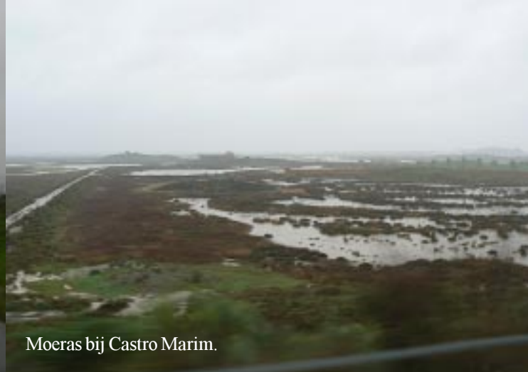
Moeras bij Castro Marim.