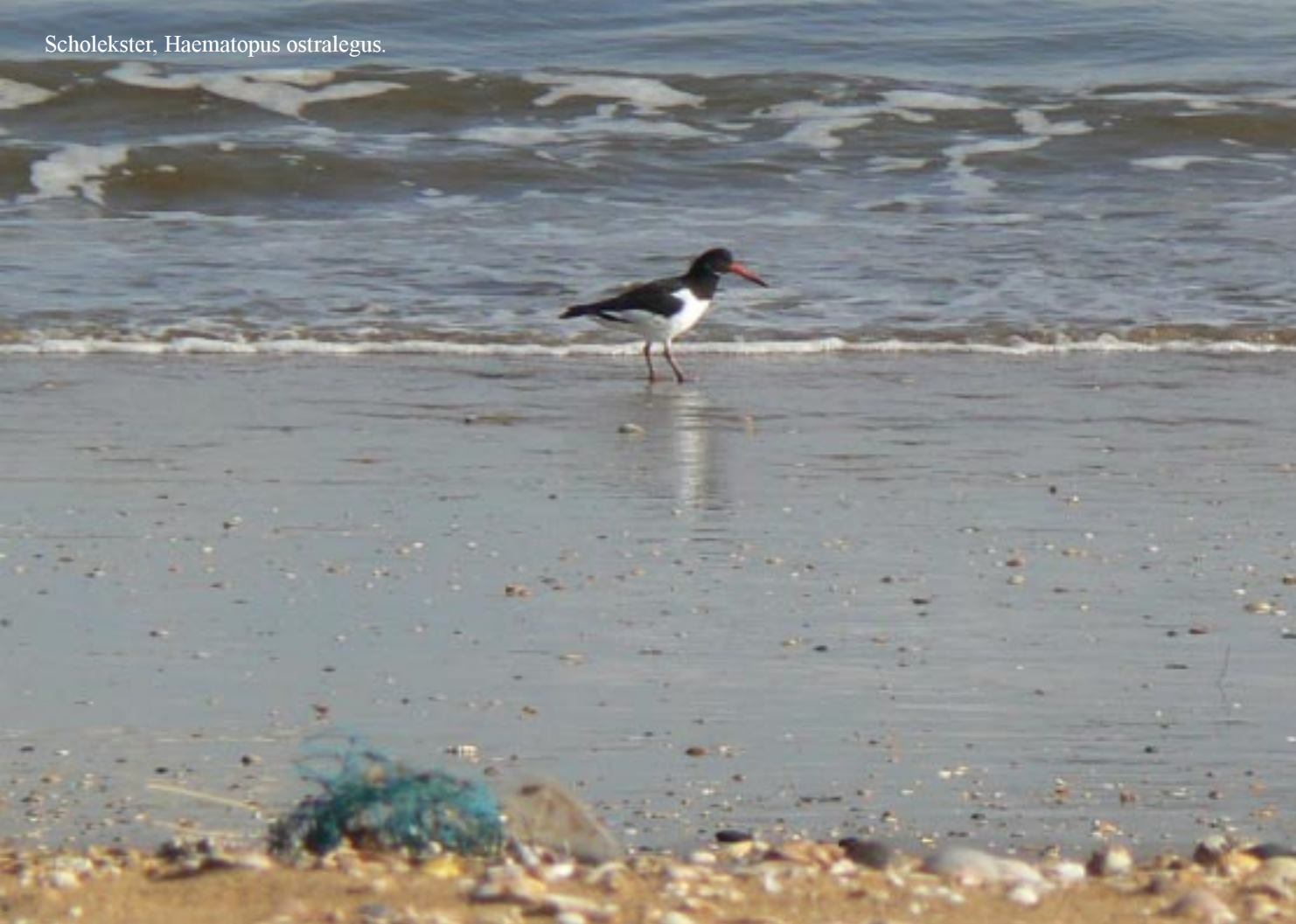
Scholekster, Haematopus ostralegus .