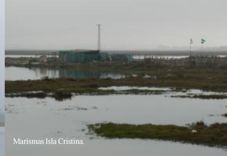
Marismas Isla Cristina.

We rijden weer via Pozo del Camino en komen in Isla Cristina opnieuw langs de Marismas. Dan rijden we over Redondelo en Lepe naar Cartaya, waar we bij de Carrefour enkele boodschappen gaan halen. Daar zitten 2 Chirimoya's bij, een soort anonavrucht, die we nog niet kennen. Om 12.35 rijden we door naar Rompido aan de kust.