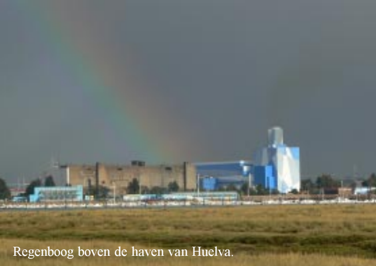
Regenboog boven de haven van Huelva.