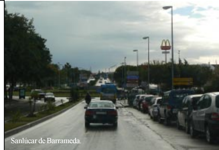
Sanlúcar de Barrameda.

We rijden steeds onder het front tussen bewolking en blauwe lucht, maar hebben geen regen. In het nog natte Sanlúcar kopen we brood en toetjes en bellen Meindert op. We kunnen Zippy met gerust hart bij hen in de straat zetten en dus rijden we door naar Chipiona, waar we 16.30 aankomen.