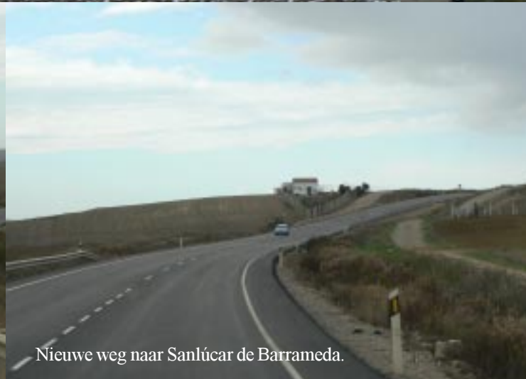
Nieuwe weg naar Sanlúcar de Barrameda.