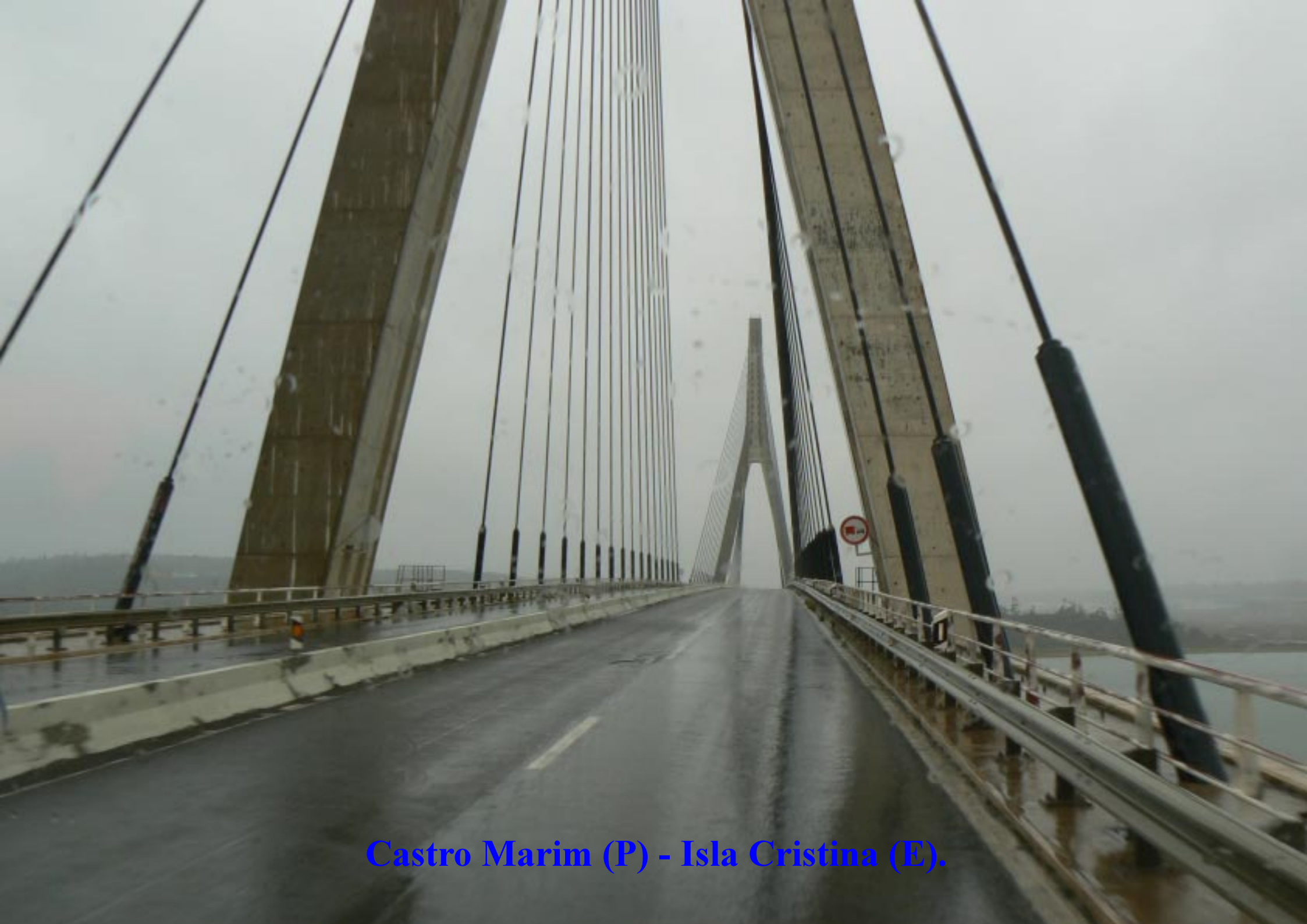
Castro Marim (P) - Isla Cristina (E).