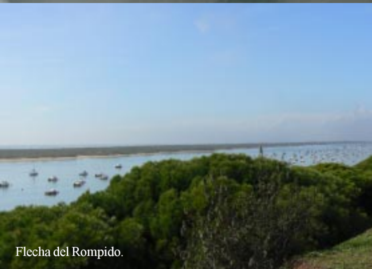
Flecha del Rompido.