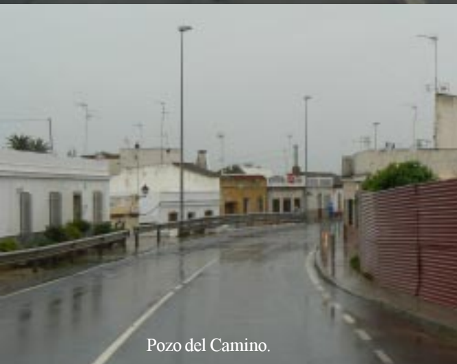
Pozo del Camino.