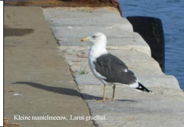
Kleine mantelmeeuw, .Larus graellsii.

Ook Zippy heeft echter last wakker te worden. We lozen de WC in een diepe put, die we met de waterpomptang van de buurman open kunnen trekken. Om 10.10 willen we dan weg. Voor de 2e keer in deze vakantie moet er de wegenwacht (via een telefoontje naar de ANWB) aan te pas komen om hem aan de praat te krijgen: de accu is leeg! Kan een radio de accu in één nacht leeg trekken als hij alleen maar op "all off" staat? We moeten dus nog een behoorlijke tijd op hulp wachten. Al met al zijn we dus pas na twaalf uur op weg.