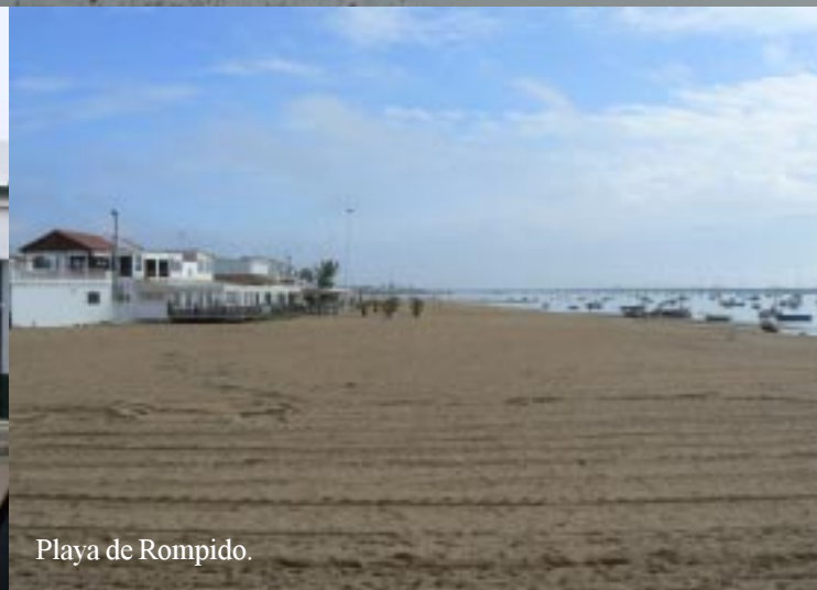
Playa de Rompido.