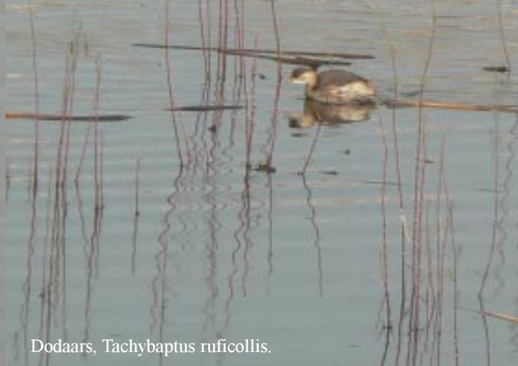
Dodaars, Tachybaptus ruficollis .