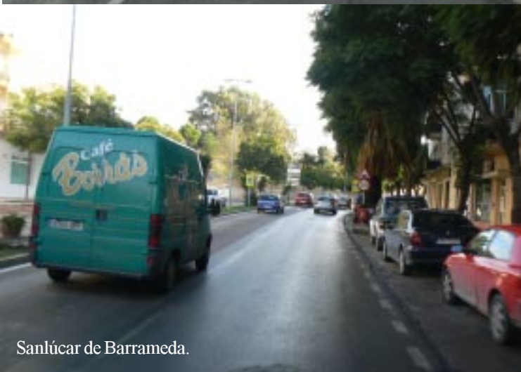
Sanlúcar de Barrameda.