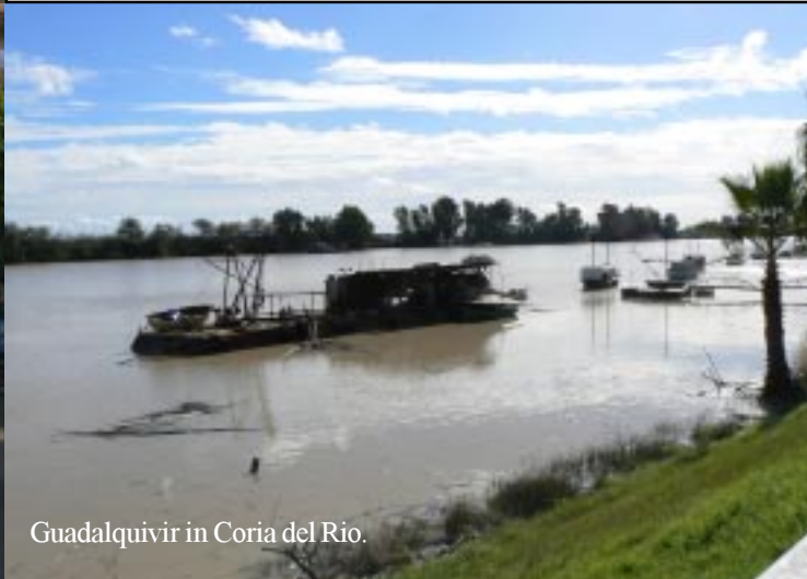
Guadalquivir in Coria del Rio.