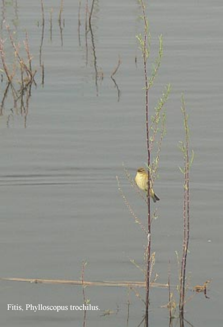
Fitis, Phylloscopus trochilus .