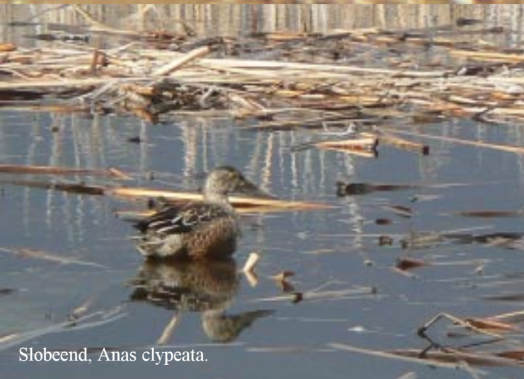
Slobeend, Anas clypeata .

Voor de stad ligt echter een interessanter gebied voor ons: De Marismas del Odiel. Op de oude spaanse kaart staat dat natuurgebied aangegeven en dat er een weg loopt over een lang schiereiland tussen Punta Umbria en Huelva in. Daar vinden we wat later het Centro de Visitantes Marismas del Odiel. Het is 15.10 en het centrum is 's middags pas om 16.00 uur open. We kunnen echter over een boardwalk naar een spottershut lopen. Op de plas daar zien we Slobeenden, Wintertalingen, Dodaars en Fitissen (in de riethalmen boven het water). Leuk.