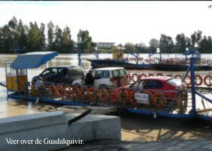
Veer over de Guadalquivir.