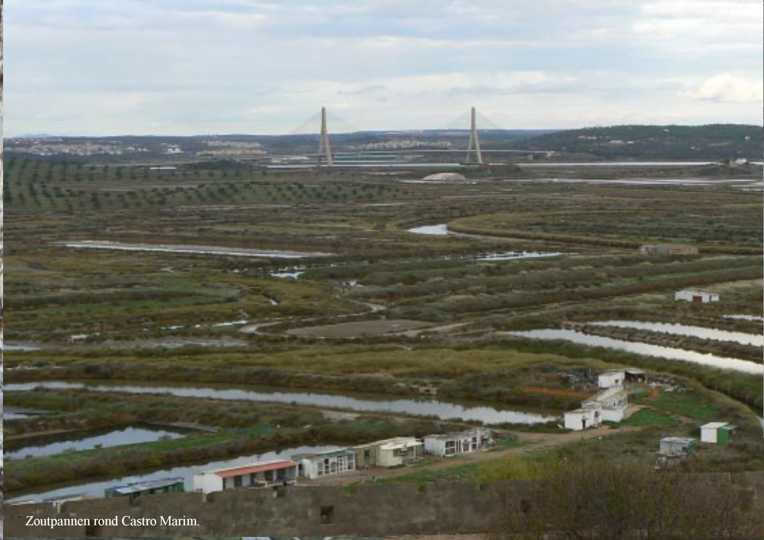
Zoutpannen rond Castro Marim.