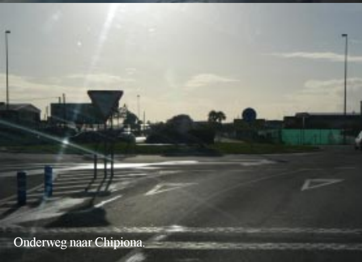
Onderweg naar Chipiona.