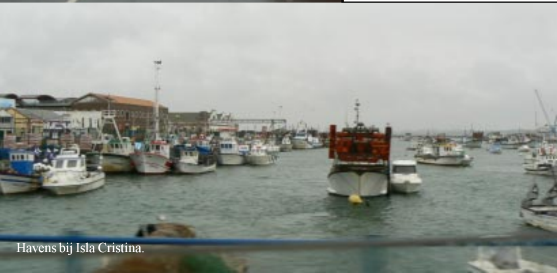
Havens bij Isla Cristina.