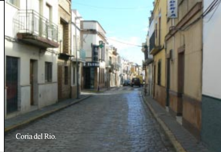
Coria del Rio.

Net na Sanlúcar la Mayor gaan we van de A472 af en gaat het via een omweg over de A473 en A474 naar Bollulos de la Mitación en Coria del Rio. We zijn weer in olijfbomenland. In Coria vinden we na vrij lang zoeken en toch maar vragen de rivier. We lunchen daar eerst maar en wandelen langs de Guadalquivir in de richting van de stad.