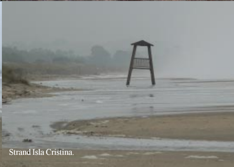
Strand Isla Cristina.