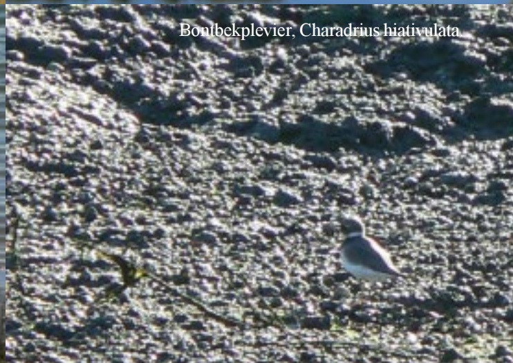
Bontbekplevier, Charadrius hiaticulata