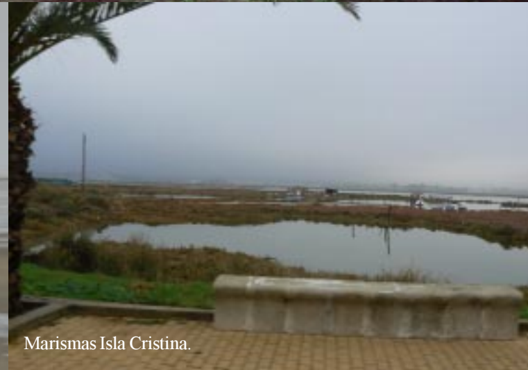
Marismas Isla Cristina.