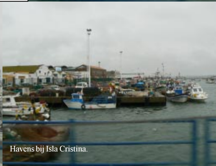
Havens bij Isla Cristina.