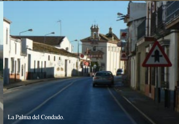
La Palma del Condado.