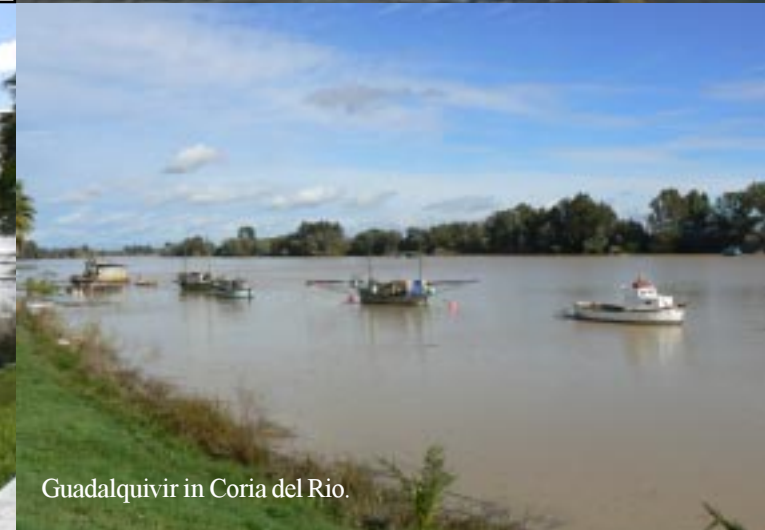
Guadalquivir in Coria del Rio.