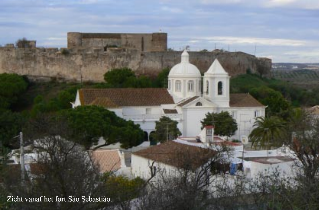
Zicht vanaf het fort São Sebastião.