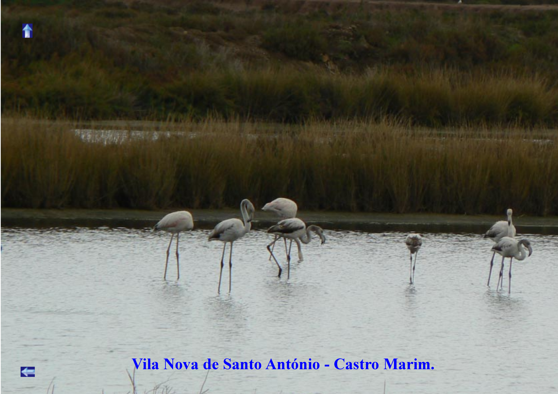
Vila Nova de Santo António - Castro Marim.