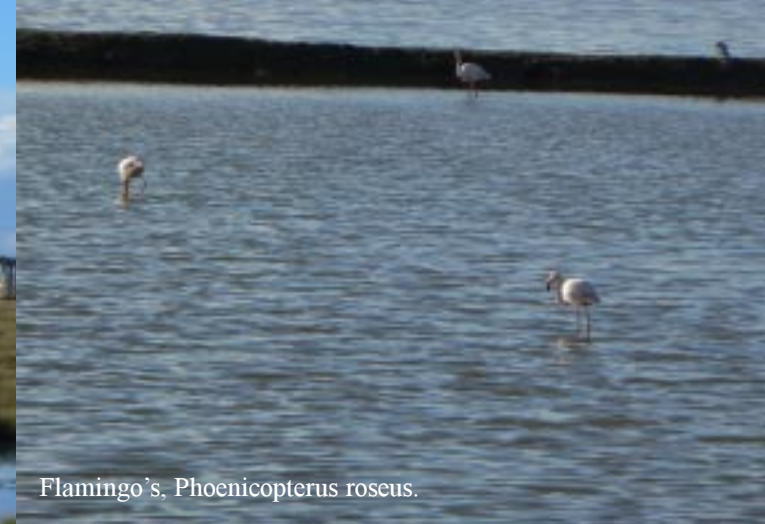
Flamingo's, Phoenicopterus roseus .