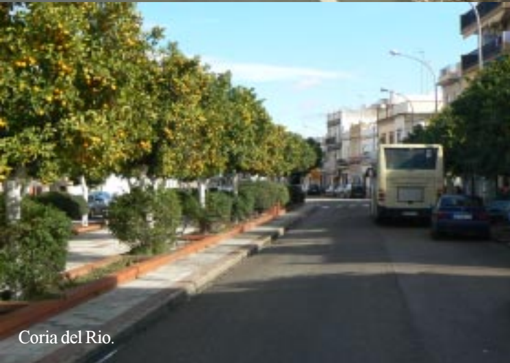
Coria del Rio.