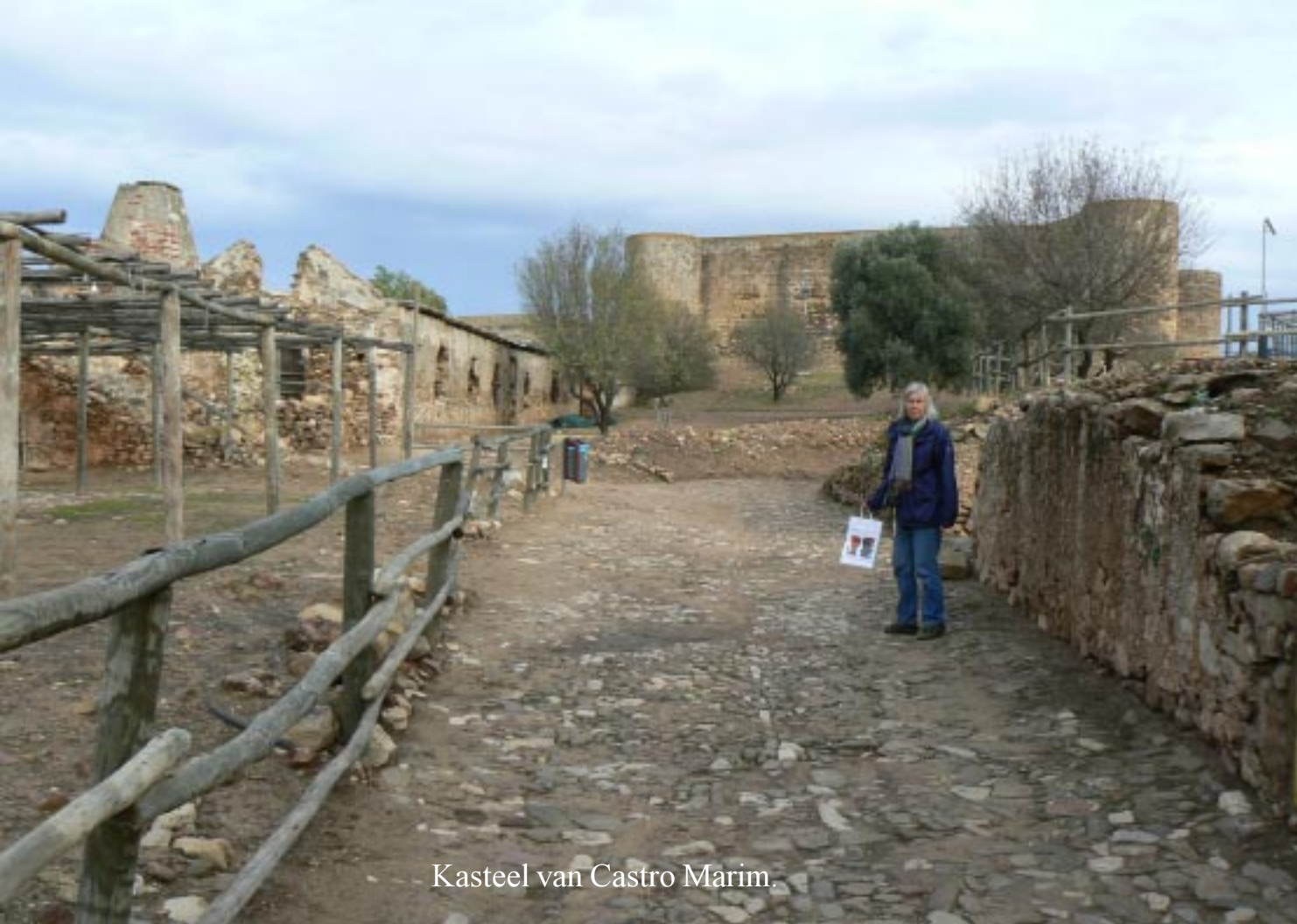
Kasteel van Castro Marim.