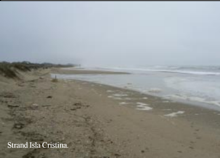
Strand Isla Cristina.