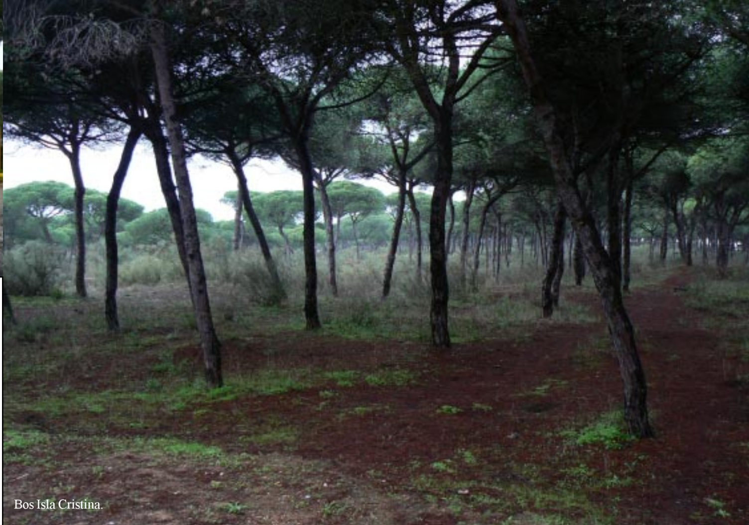
Bos Isla Cristina.

Om half twaalf vertrekken we dan weer met 4963 km al weer achter de rug deze reis.