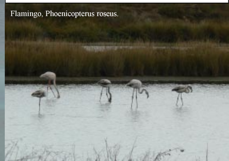
Flamingo, Phoenicopterus roseus .