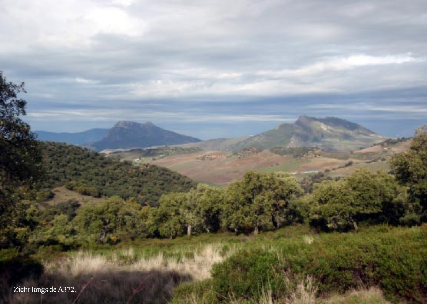
Zicht langs de A372.