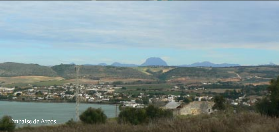
Embalse de Arcos.

Via Jerez en Arcos de la Frontera rijden we naar de Sierra de Margarita. Pas laat op de middag stoppen we in El Bosque om te lunchen 15.40-16.10. Net als Arcos ziet dit dorp er heel aardig uit. We zijn aan de voet van het gebergte angekommen.