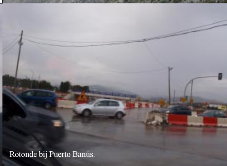
Rotonde bij Puerto Banús.