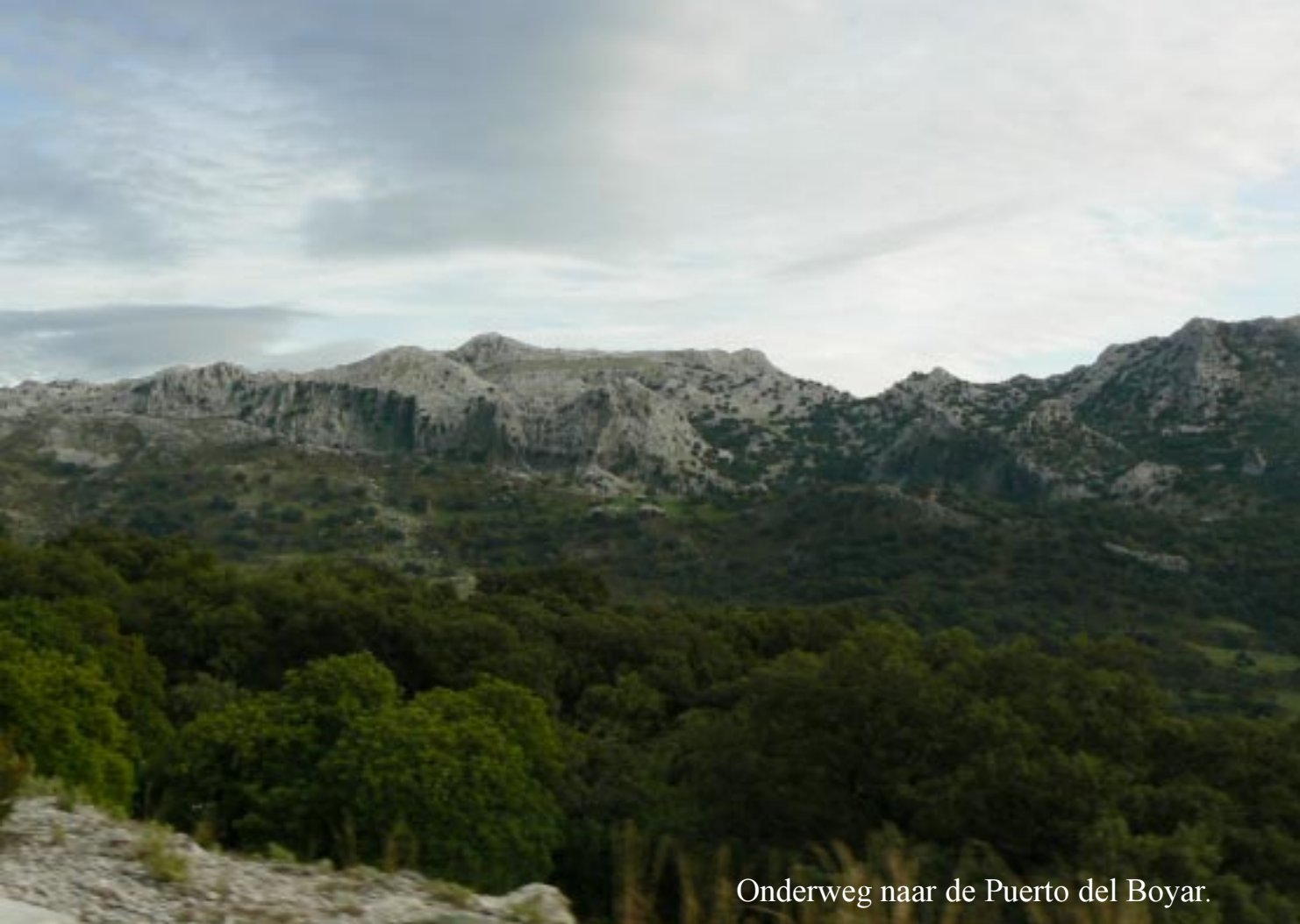
Onderweg naar de Puerto del Boyar.

Verderop stijgen we tot aan 1103 m op de pas Puerto del Boyar (16.45). Steeds met grandiose panorama's opzij en achteruit.