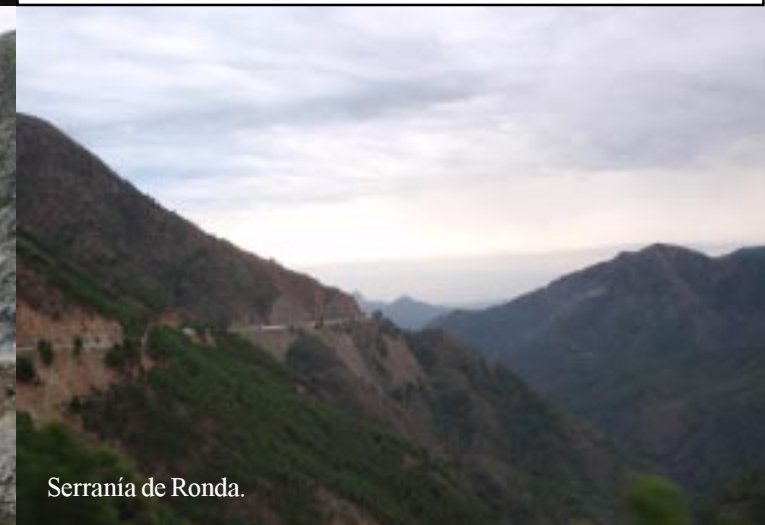
Serranía de Ronda.

We komen er om 17.45 (net voor de duisternis invalt) aan en zetten Zippy op de parking bij de toren. Morgen meer.