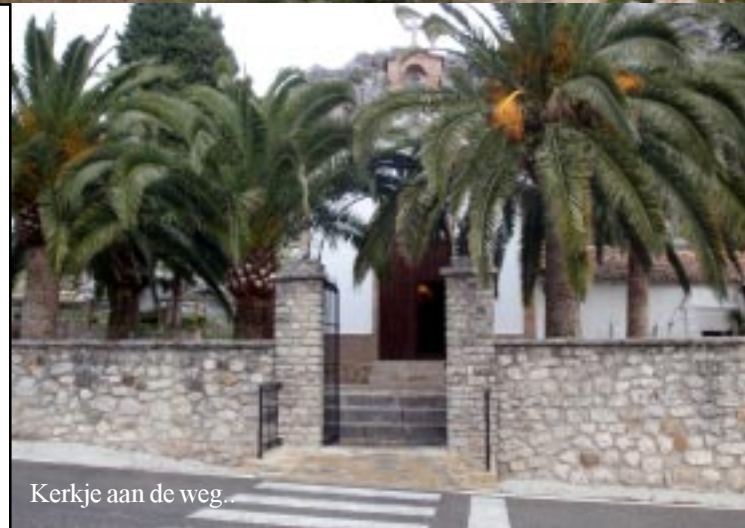
Kerkje aan de weg..

Het regent stevig deze morgen. Ik schrijf nog wat aan het verslag voor we, als de buien overgedreven zijn, Grazelema in wandelen. Zoals we gisteren al zagen een heel aardig bergdorp. Op deze regenachtige zondag zijn er dan ook aardig wat mensen hier heen gekomen. Vele met bussen.