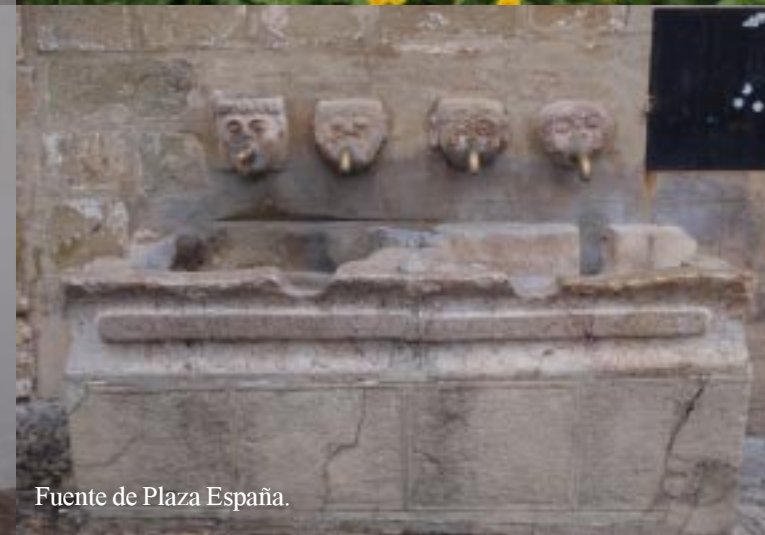
Fuente de Plaza España.