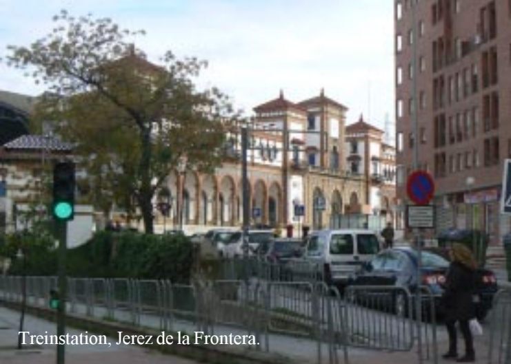
Treinstation, Jerez de la Frontera.