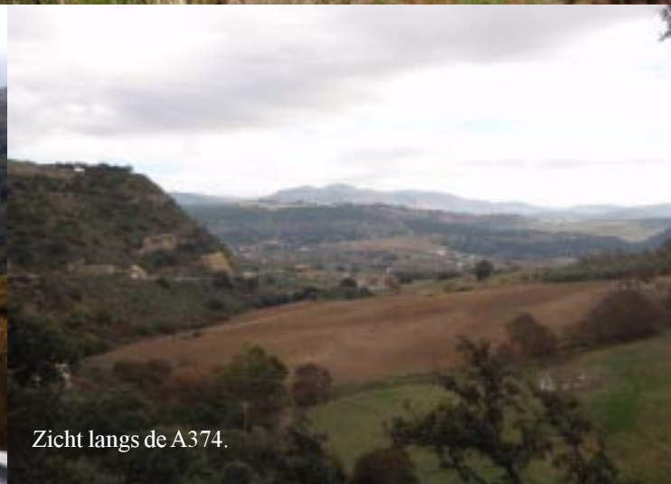
Zicht langs de A374.