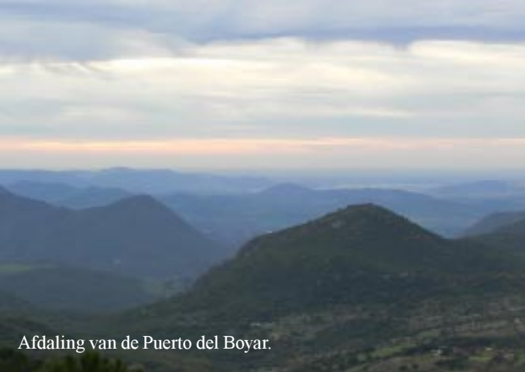
Afdaling van de Puerto del Boyar.