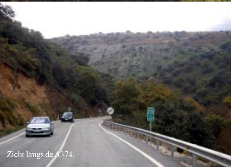
Zicht langs de A374.