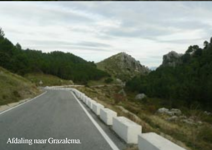
Afdaling naar Grazalema.