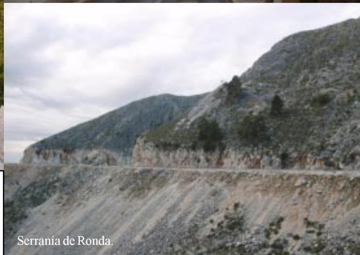
Serranía de Ronda.

Beneden bij Puerto Banús gaat het de A7 op en door naar Puerto Cabopino, dat we nog van de vorige Spanjereis kennen.