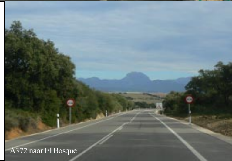
A372 naar El Bosque.

Via Jerez en Arcos de la Frontera rijden we naar de Sierra de Margarita. Pas laat op de middag stoppen we in El Bosque om te lunchen 15.40-16.10. Net als Arcos ziet dit dorp er heel aardig uit. We zijn aan de voet van het gebergte angekommen.