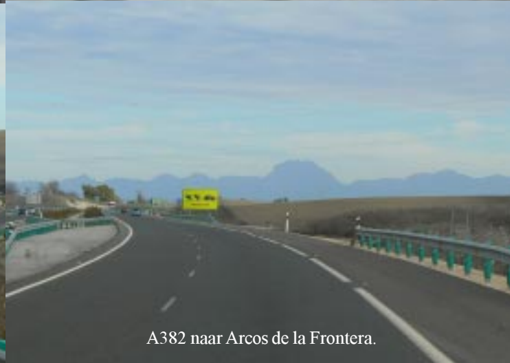
A382 naar Arcos de la Frontera.