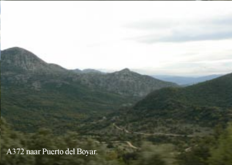
A372 naar Puerto del Boyar.