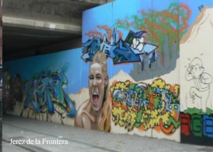
Jerez de la Frontera.

(BRRRM, BRRRRRM), die nieuwe erin gezet. We rekenen •164,20 af en kunnen op pad. Achter ons gaat de garage dicht, ze waren al een kwartier over de zaterdagse sluitingstijd. Net voor Sanlúcar kunnen we water tanken en lozen, tanken dan ook maar diesel, zodat we om 14.15 echt op pad gaan.