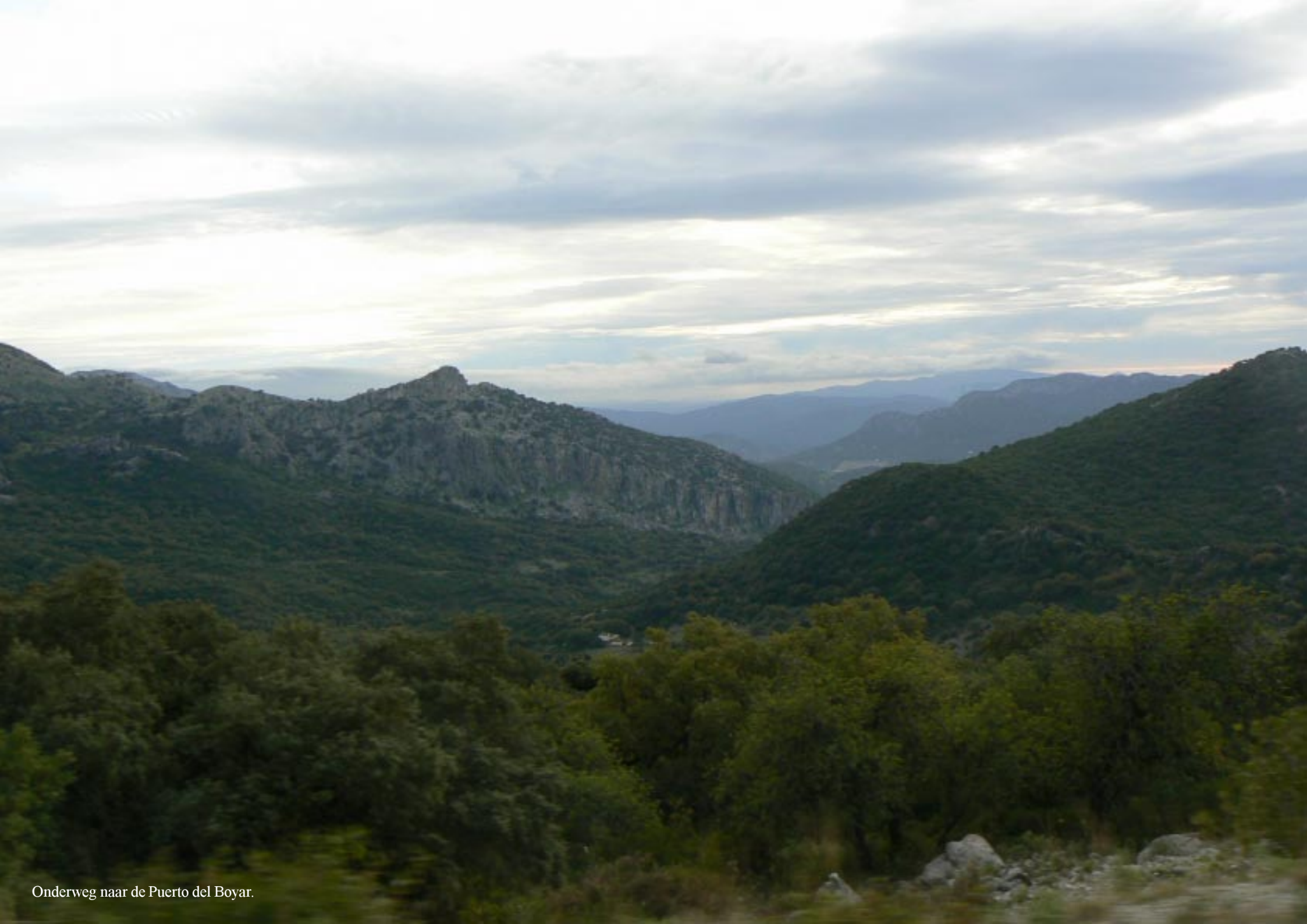
Onderweg naar de Puerto del Boyar.