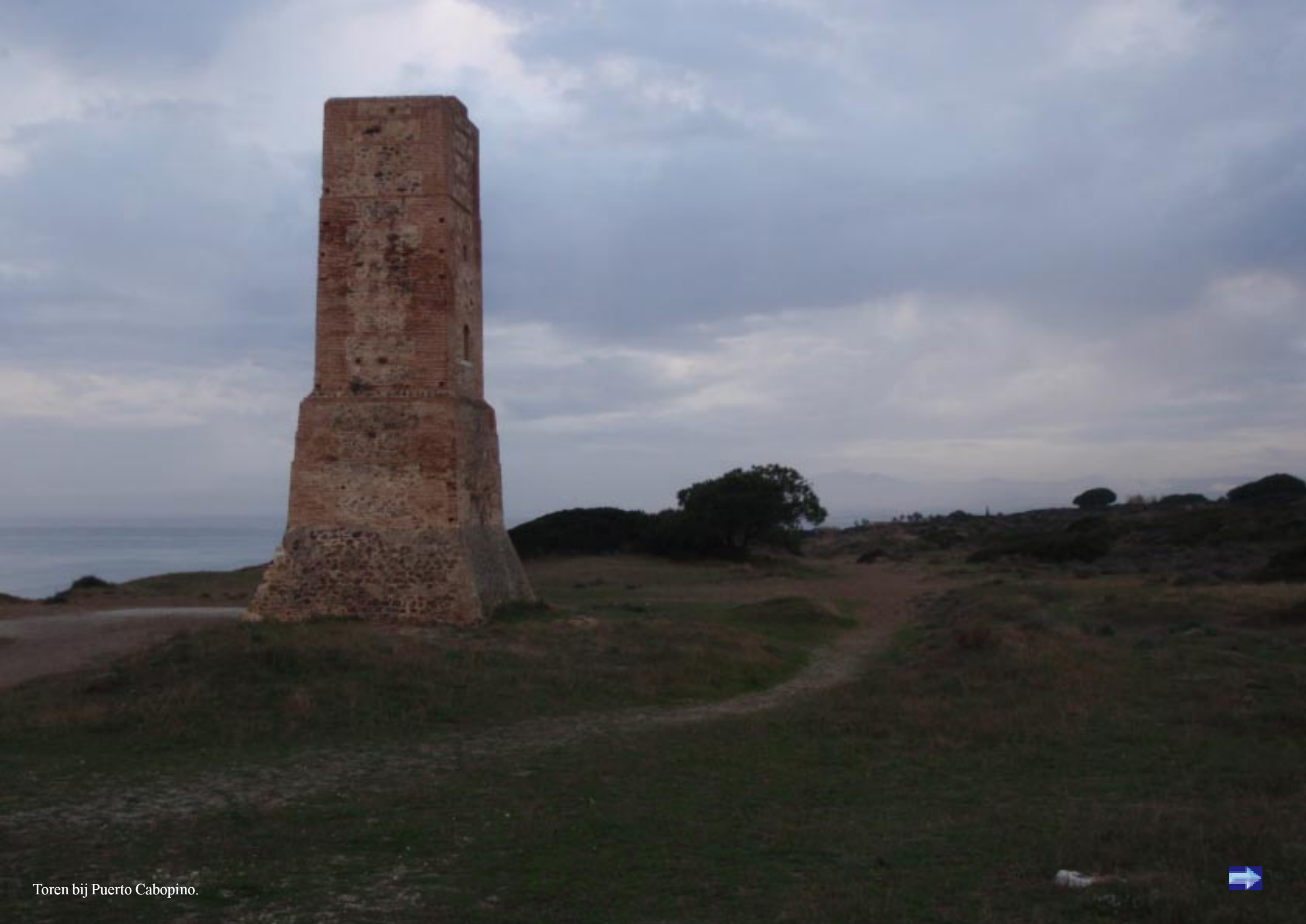
Toren bij Puerto Cabopino.