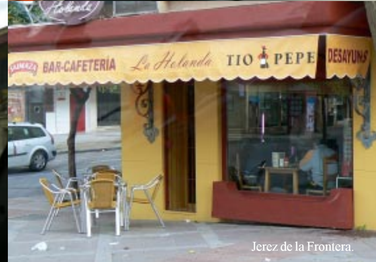
Jerez de la Frontera.