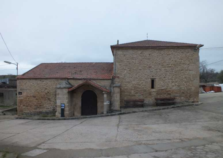
Deze pagina: Aldeadávila de la Ribera.