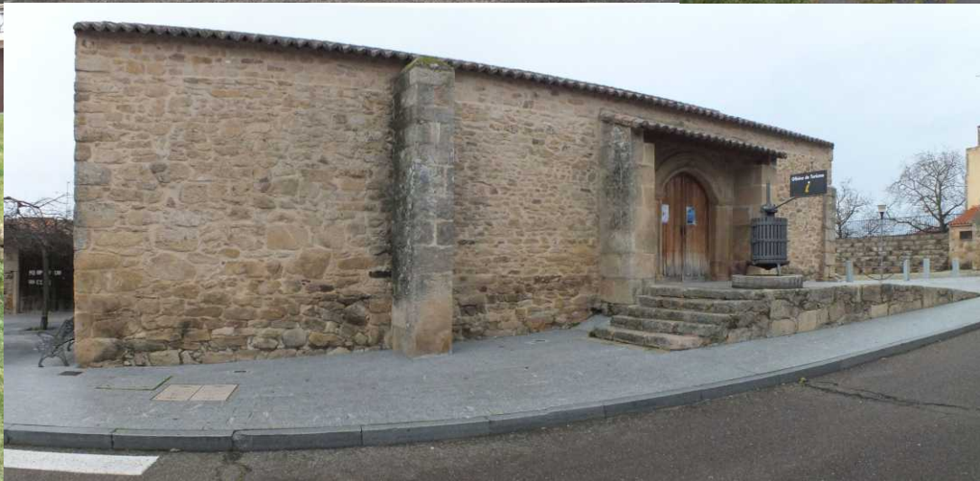
LB: Ermita. RB: Calle Berzal. RM: Beeldengroep, As Arribes del Duero. MO: Het touristenbureau.