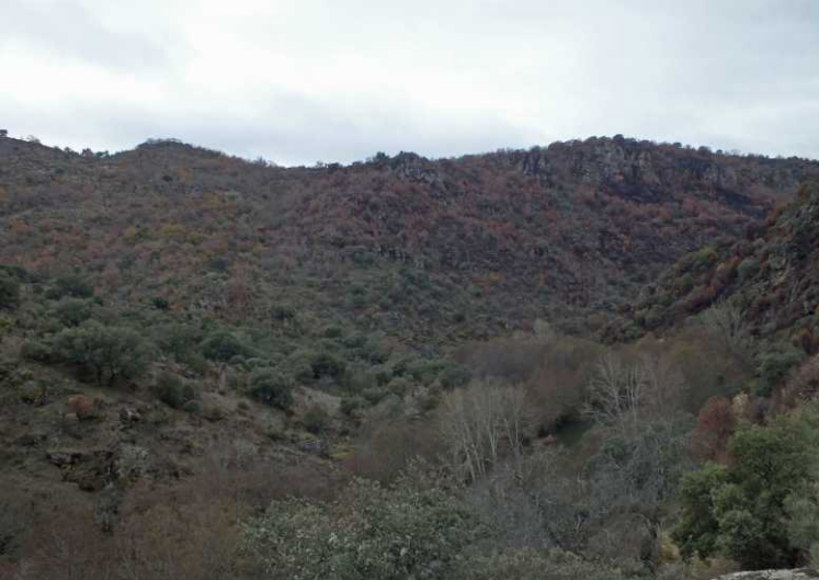
Deze pagina: Het dal van de Río Tormes.