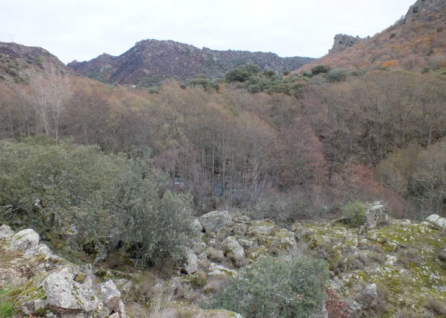
Deze pagina: Rond het dal van de Río Tormes.