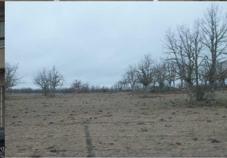
LB: Circus in Zamora. MO: Bermillo de Cayago.