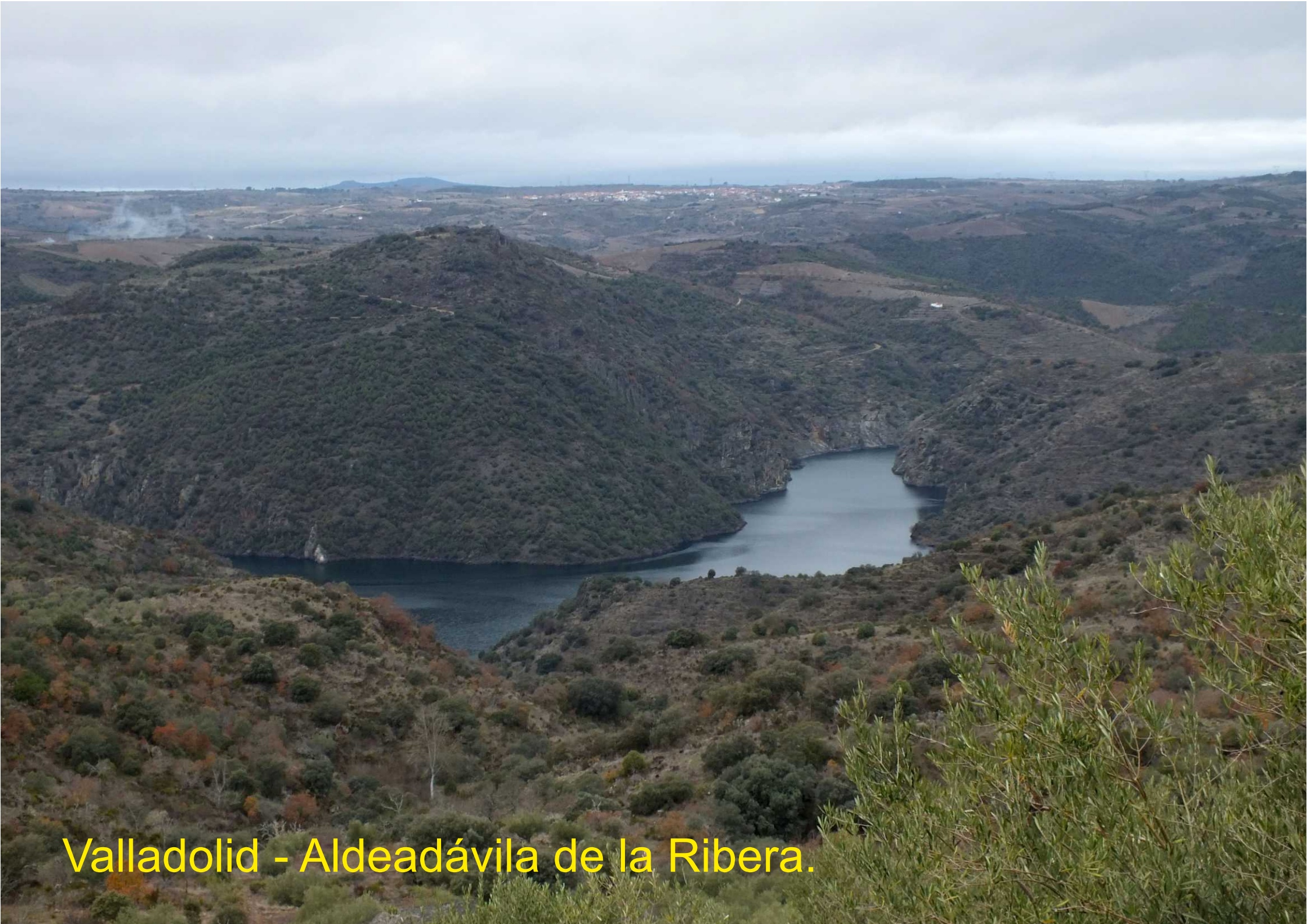
Valladolid - Aldeadávila de la Ribera.