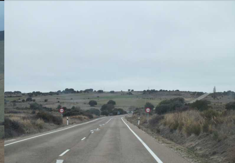
Het gaat de CL527 op en zien we de Arroyo de Perdijon (11:30) in zeer ruig land. Bermillo de Cayago (11:56).