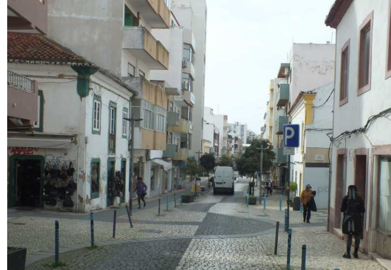
LB: Spoorbrug over de Rio Aráde. RB, M, O: Portimão.

Na de lunch rijden we om 13:53 naar Portimão aan de andere kant van de Aráde. Die grote camperplaats bij de Marina is verdwenen en een stuk braakliggend terrein geworden, dat met betonblokken is geblokkeerd. We kijken even bij die andere tussen de hoge flatgebouwen, maar daar is geen service. Dus rijden we door naar Alvor.