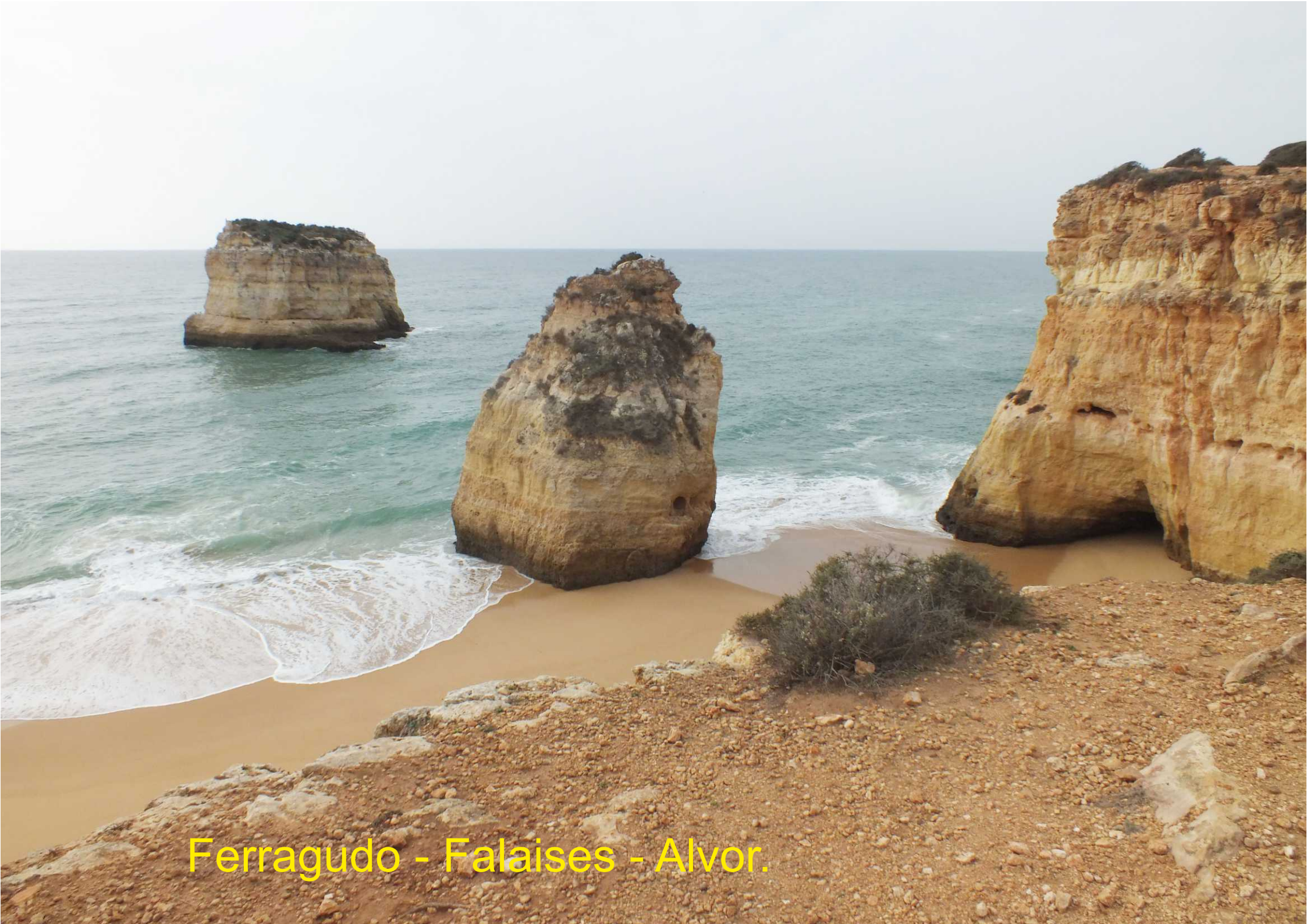
Ferragudo - Falaises - Alvor.