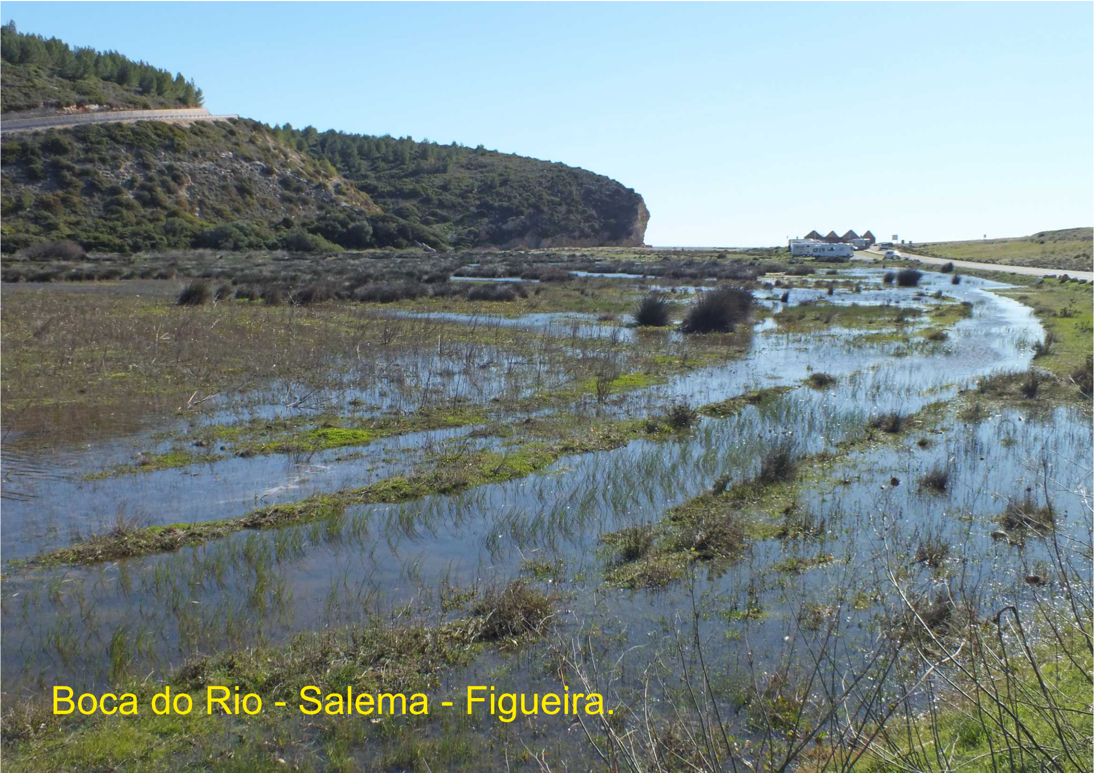
Boca do Rio - Salema - Figueira.