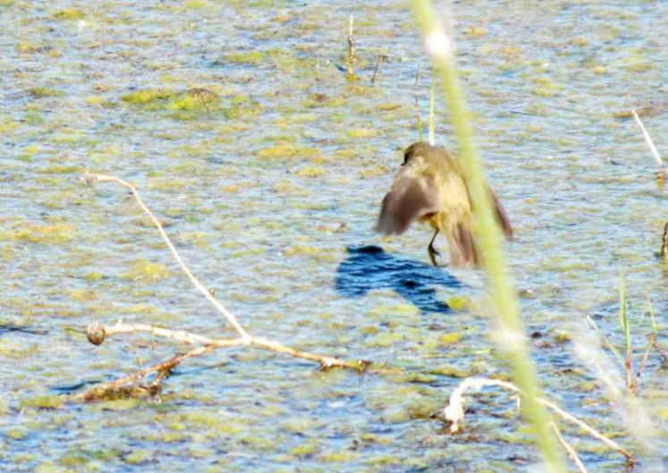
LB, RB: Tjiftjaf, Phylloscopus collybita . LM: Steltkluut, Himantopus himantopus . MM, RM, O: Rotszwaluw, Ptyonoprogne rupetris .