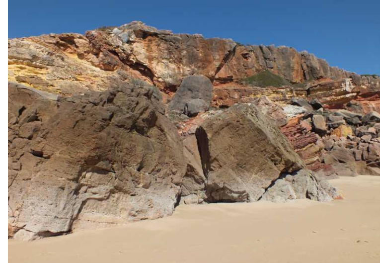
LB, RB, LM: Strand en rotspartijen in Salema. RO, LO: Zeepokken (Orde Cirripedia).