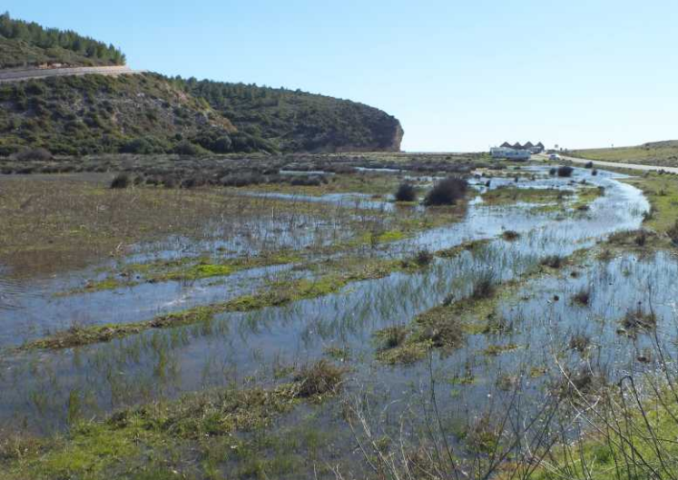
LB, RB: Lagune bij Boca do Rio M, O: Rotszwaluw, Ptyonoprogne rupetris .