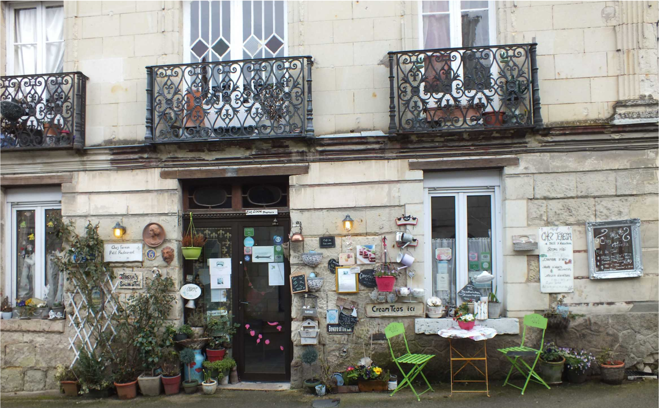
Caprais-de-Blaye - Fontevraud-l'Abbaye.