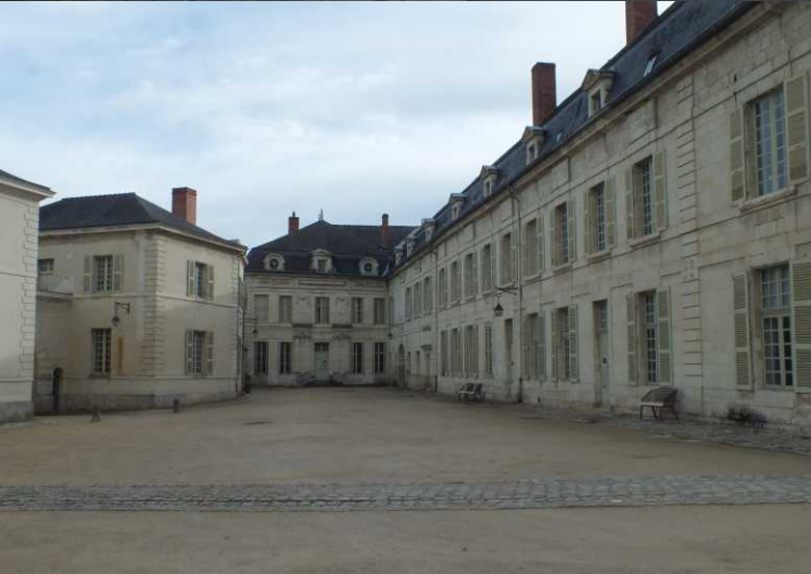
LB: Rue Robert d'Arbrissel. RB: Chapelle Sainte Catherine. LM, MO, LO, RO: Abbaye de Fontevraud.

Fontevraud-l'Abbaye blijkt een klein maar heel sfeerrijk dorp te zijn met vele mooie huizen. Maar het wordt wel gedomineerd door de kolossale gebouwen van de koninklijke abdij. Daar kijken we even op de binnenplaats rond. Een heel apart gebouw.