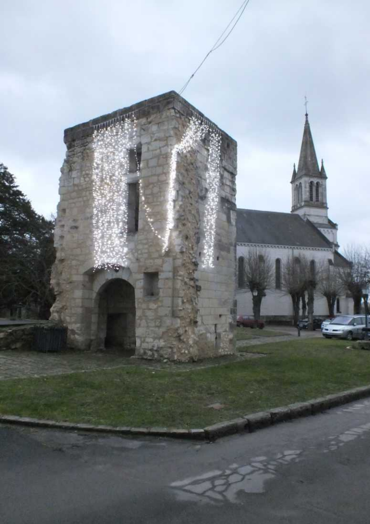
LB: De toren uit de XIVe eeuw en de Saint Blaise. RB, RO: Saint Blaise. LO: Mairie.