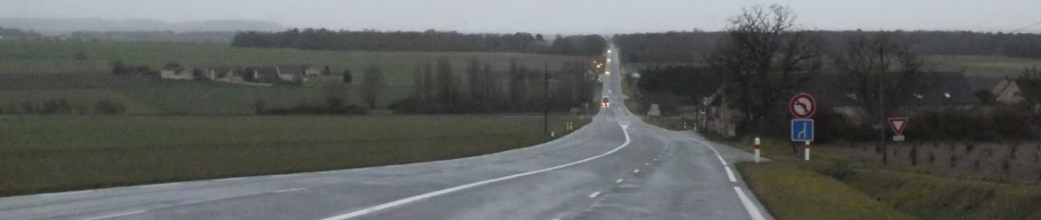
LM: La Celle-St. Avant. RM: Ingrande-s- Vienne. O: Futuroscope, Poitiers.

Om 9:10 starten we de camper in miezerregen en komen 10 minuten later door La Celle-St. Avant. We zien een romaans kerkje in Ingrande-s- Vienne (9:40) en de glazen gebouwen van attractiepark Futuroscope in Poitiers (10:14). We doen er 25 minuten over Poitiers weer uit te komen.