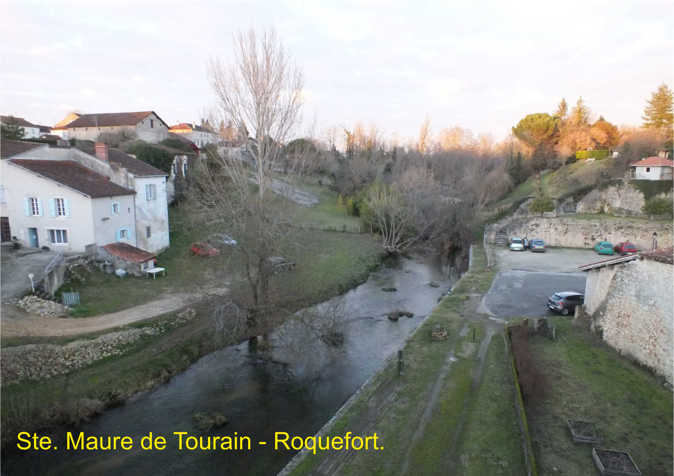
Ste. Maure de Tourain - Roquefort.