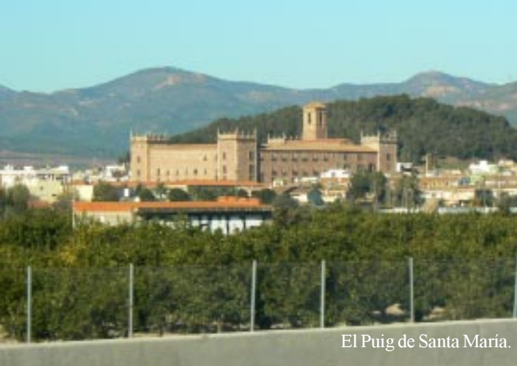
El Puig de Santa Maria.

We gaan Valencia weer uit over de A7 en zien om 12.55 op de hoogte van El Puig links een groot klooster. Verder worden vele heuveltoppen bezet door kastelen en forten. Zoals de 3 kastelen boven Sagunt.