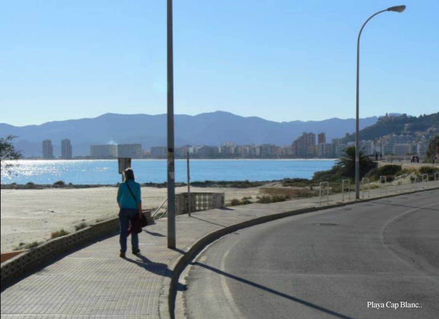
Playa Cap Blanc..

Uiteindelijk dalen we af naar een urbanization in aanbouw, waar we nog even moeten zoeken hoe we weer naar beneden aan het strand kunnen komen. Uiteindelijk na een echt doodlopende straat (dus ook voor voetgangers) komen we op een dalende weg, een nieuwe trap, die een flink stuk afsnijdt en een oude trap van houten balken, die hetzelfde doet en nagenoeg op Playa Cap Blanc eindigt. (14.40)