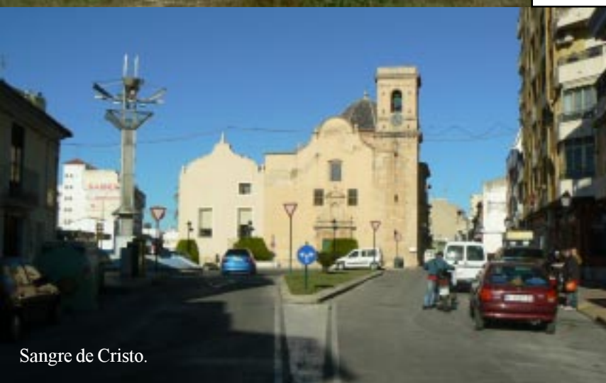
Sangre de Cristo.