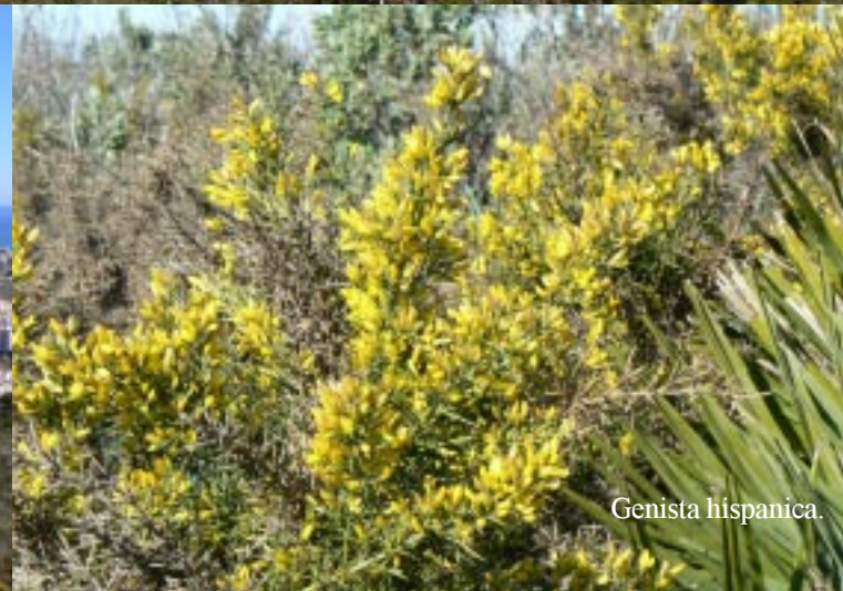
Genista hispanica .