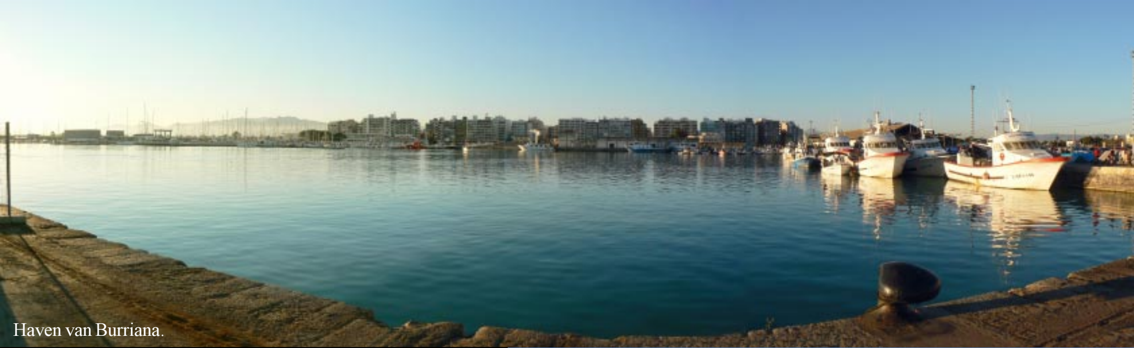
Haven van Burriana.

Aan een grote pier staat het volk. De 3 Koningen zijn daar net aan land gegaan. Ze komen de brave Spaanse kinderen begroeten en uiteraard later cadeautjes brengen. Een populair stel dus.