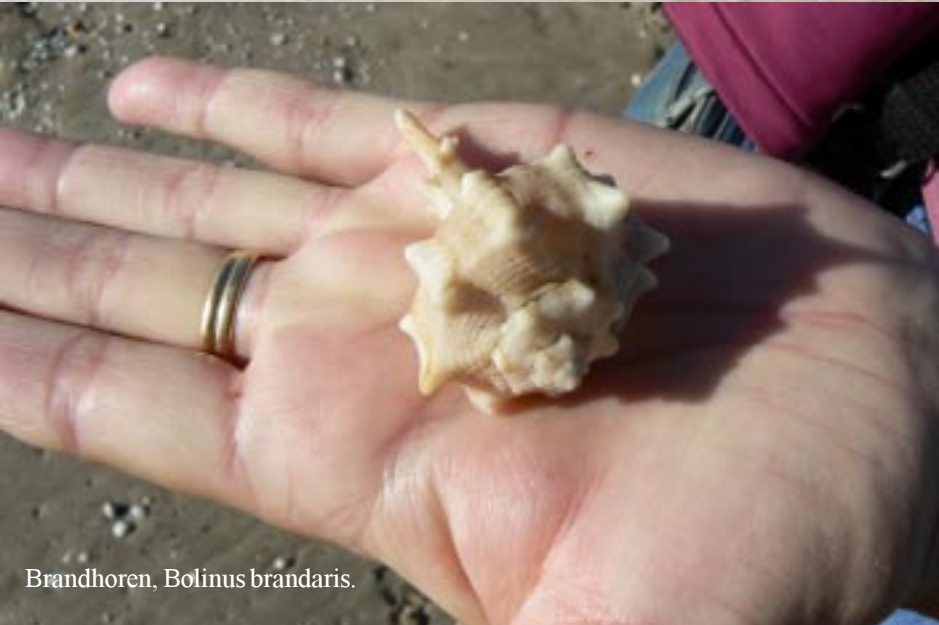
Brandhoren, Bolinus brandaris .