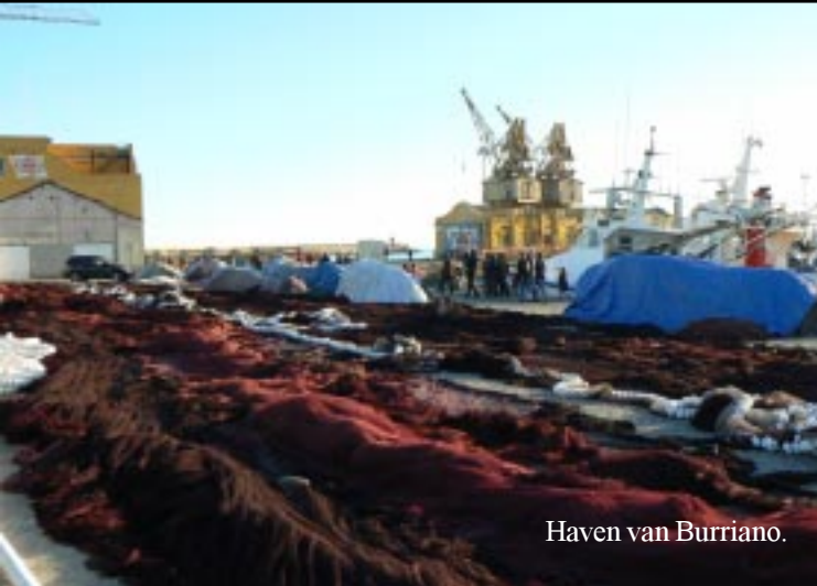
Haven van Burriano.