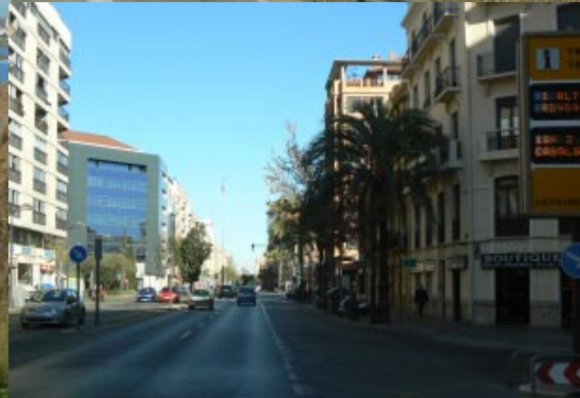
P.N. de L'Albufera.