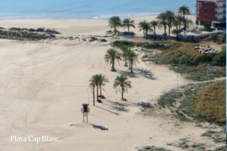
Playa Cap Blanc..

Uiteindelijk dalen we af naar een urbanization in aanbouw, waar we nog even moeten zoeken hoe we weer naar beneden aan het strand kunnen komen. Uiteindelijk na een echt doodlopende straat (dus ook voor voetgangers) komen we op een dalende weg, een nieuwe trap, die een flink stuk afsnijdt en een oude trap van houten balken, die hetzelfde doet en nagenoeg op Playa Cap Blanc eindigt. (14.40)