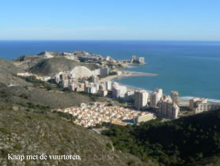
Kaap met de vuurtoren.

Er is dus volop tijd om ook de kuststrook langs de Albufera te bewonderen. Ik zie daar diverse paden/wegen door heen gaan. Onthouden dus.