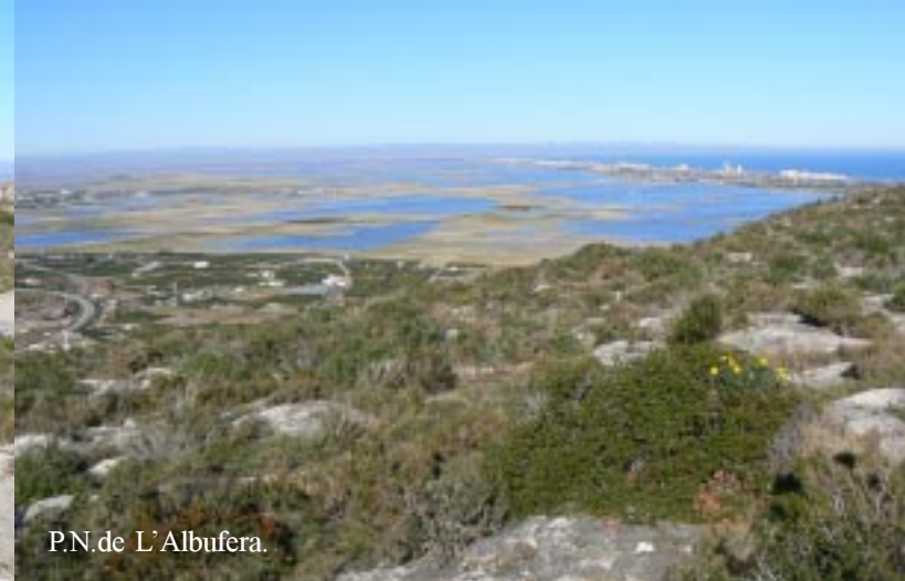
P.N. de L'Albufera.

Steeds met dit heerlijke zicht klimmen we fiks omhoog via een asfaltweg naar de Radar Meteorològico om daar (12.30) opnieuw dat wit-geel gemarkeerde pad (senda ecoturística PR-CV336) te volgen. Deze gaat over de kam tussen diverse heuveltoppen.