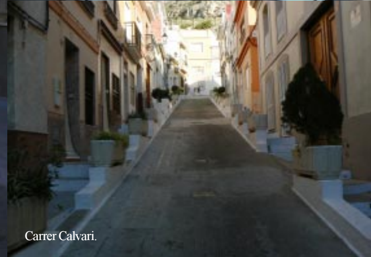
Monte Sant Antoni, Cullera.