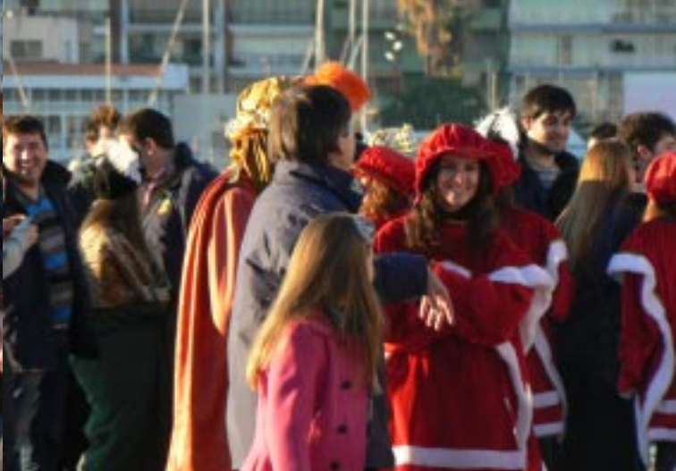
Aankomst van de 3 Koningen.