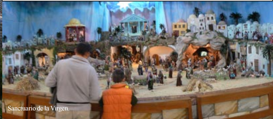
Sanctuario de la Virgen.

Vanaf het uitzichtplateau voor de kerk (met een ingang naar het kasteel, dat we nu laten liggen) is een weids zicht over Cullera, de zee en de bergen verder weg. Een klein tadradwagentje brengt bezoekers omhoog. We gaan de kerk in en kijken eerst naar de kerststal in Spaanse stijl, die achter in de kerk is opgesteld. Zo'n Spaans kersttafereel omvat een heel dorp met vele figuren.