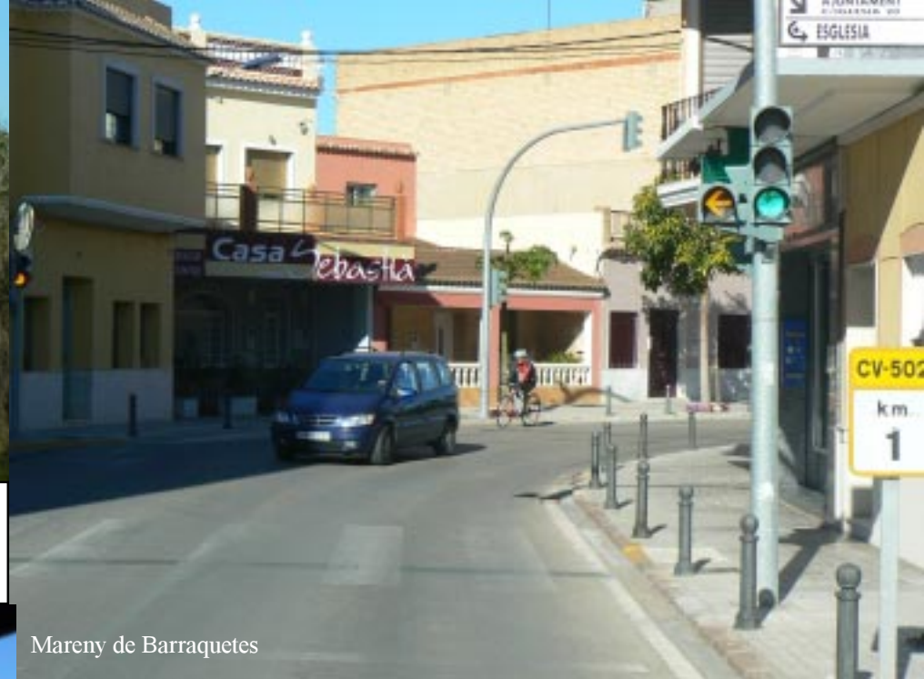
Mareny de Barraquetes

We rijden net voor Sueca rechts een weggetje door het PN de l'Albufera in de richting van de kust. Bij Mareny Blau links langs de kust af: 12.10 Mareny de Barraquetes.