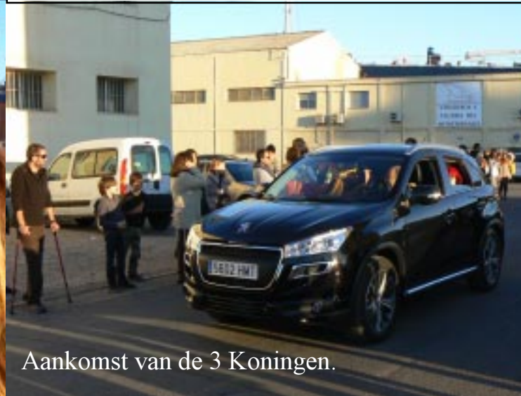
Aankomst van de 3 Koningen.