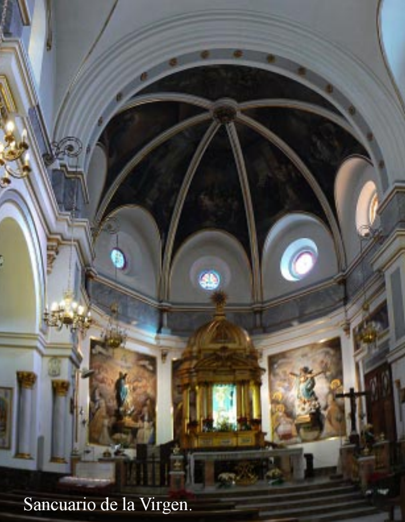
Santuario de la Virgen.