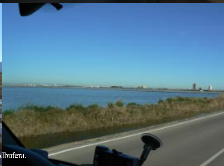
P.N. de L'Albufera.