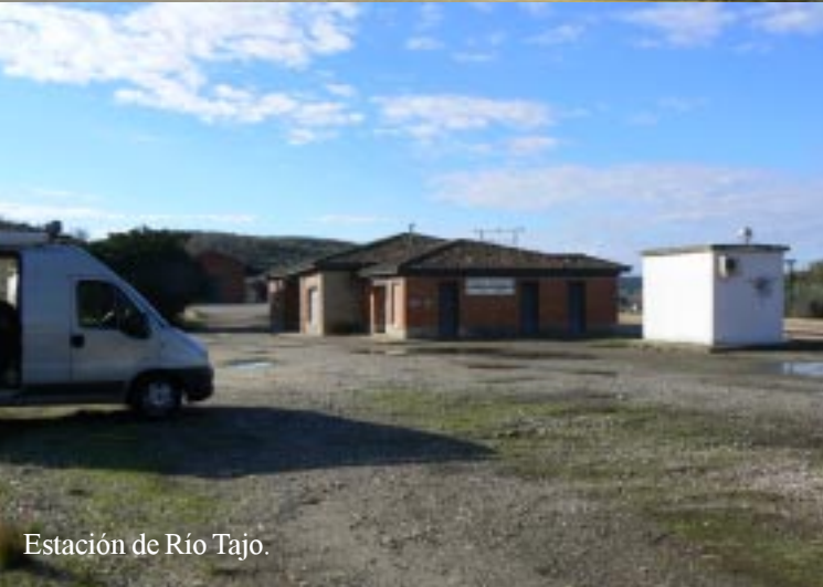
Estación de Río Tajo.