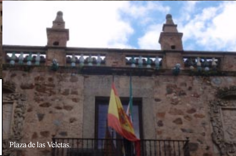
Plaza de las Veletas.