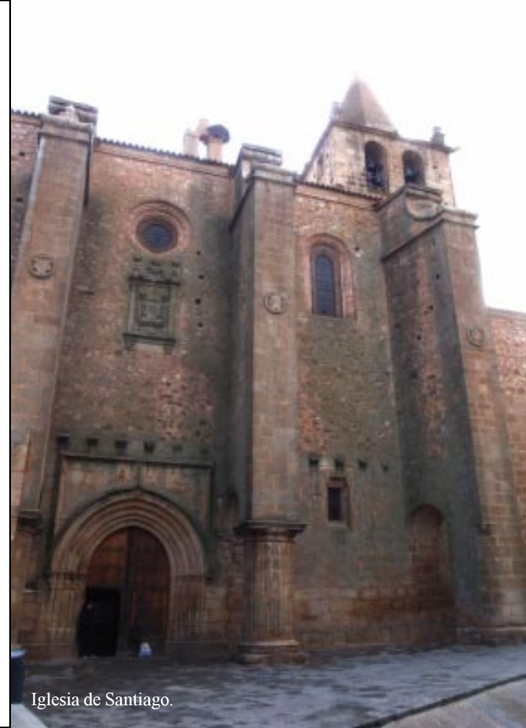
Iglesia de Santiago.

Om 12.45 na de lunch lopen we via de wijk San Blas de binnenstad van Cáceres in. We zoeken eerst het Plaza Mayor op. Daar staat nu een grote tent, waar een tentoonstelling is over de evolutie van de mensachtigen. Daar begint dus onze bezichtiging van het oude Cáceres. Opmerkelijk vind ik dat diverse mensachtigen groter waren dan de moderne Spanjaard! Het andere uiterste vormt de één meter “hoge” Floresmens, die overigens pas in 2004 werd ontdekt. Al met al heel aardig dit eens gezien te hebben. Ons Spaans is niet je dat, anders had ik nog graag wat langer info opgezogen. Zie ook de PDF-folder.