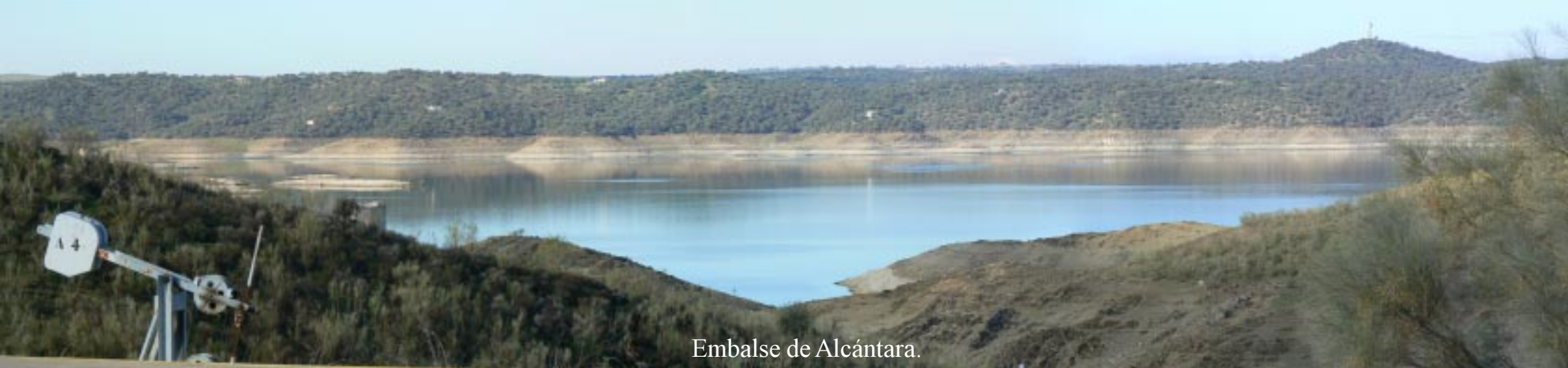
Embalse de Alcántara.