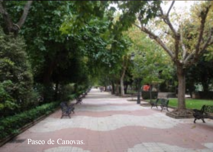
Paseo de Canovas.