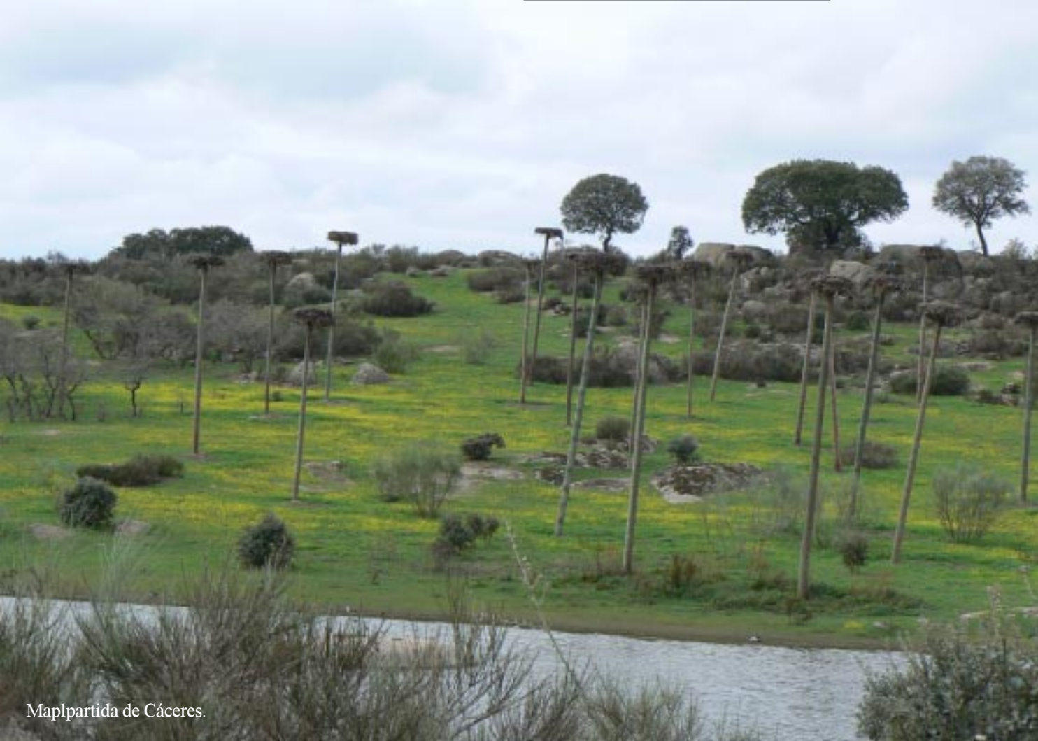
Malpartida de Cáceres.