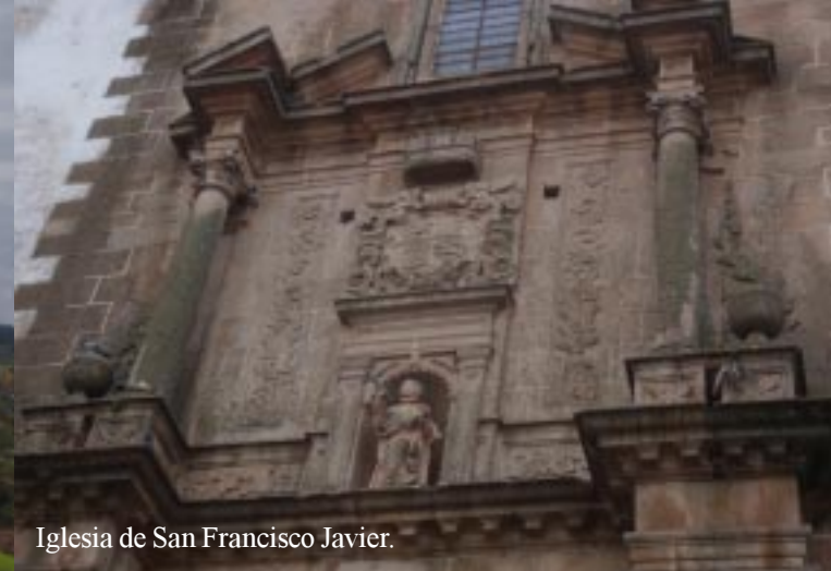
Iglesia de San Francisco Javier.