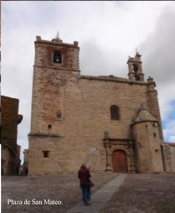
Plaza de San Mateo.

Eerst linksom langs de muren, dan naar het Plaza de San Mateo en Plaza de las Veletas met steeds weer kerken, kloosters en paleizen. Het verbaast ons niet dat Cáceres al in 1985 op de UNESCO Werelderfgoedlijst is gezet.