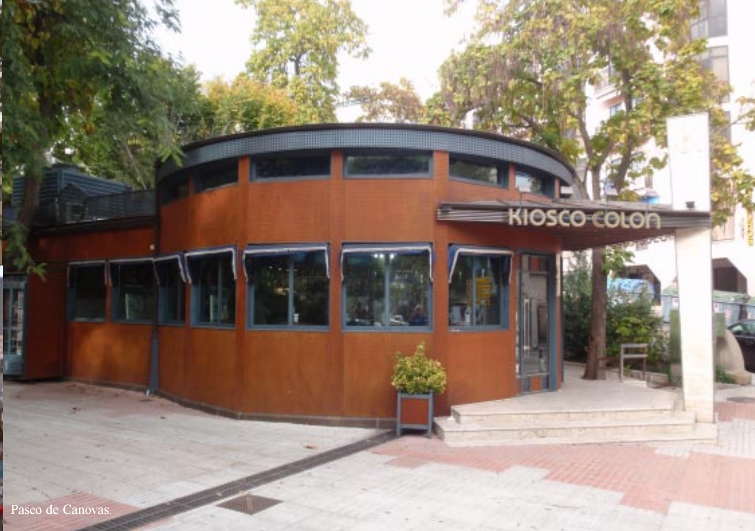
Paseo de Canovas.