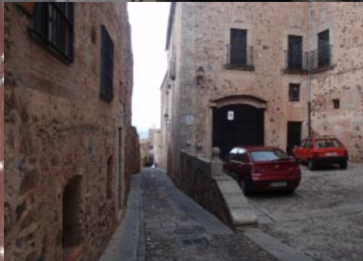
Puerta de Sta. Ana.