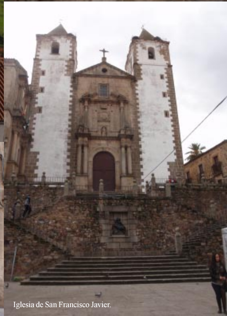
Iglesia de San Francisco Javier.