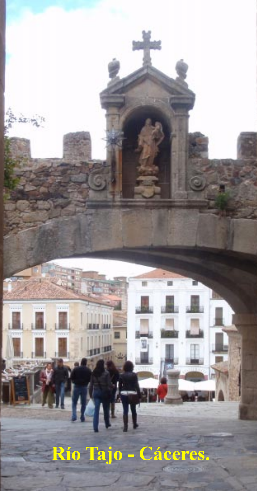
Río Tajo - Cáceres.