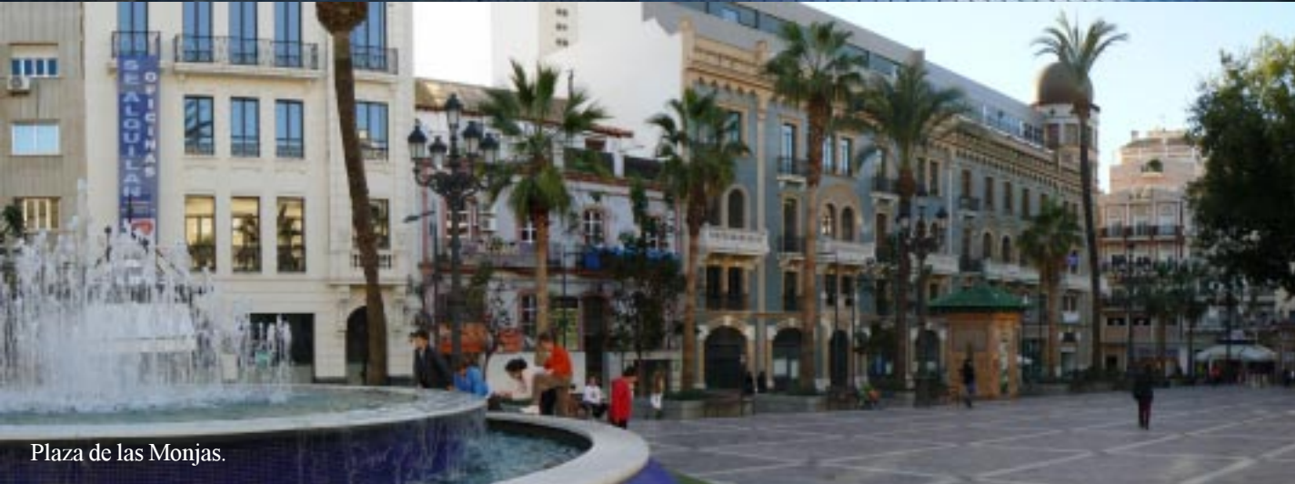
Plaza de las Monjas.

Door een gezellig uitziende stad lopen we langs de Convento de Sta. María de Gracia naar nog een zeer fraai plein: Plaza de las Monjas met een standbeeld van Columbus, een zeer fraai groen gebouw en een I-kiosk, die precies als wij er aan komen open gaat.