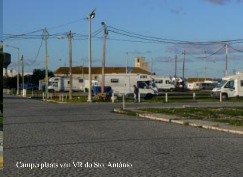
Camperplaats van VR do Sto. António.