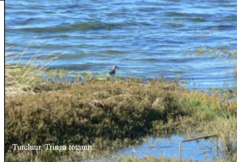
Tureluur, Tringa totanus .

In de buurt van het nieuwe voetbalstadion is dat fietspad opgehouden en rijden we op het trottoir naar een park aan het begin van de Avenida Alemania.