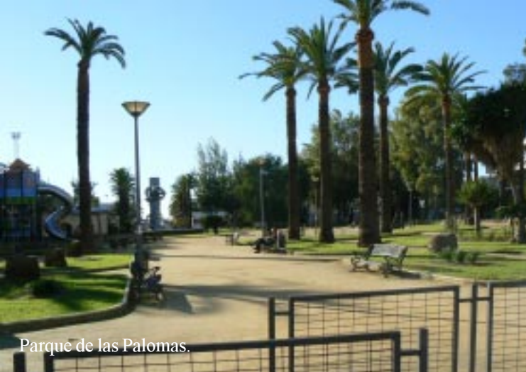
Parque de las Palomas.

Daar binden we de fietsen aan een stevig hek en lopen het centrum in. We passeren het oude treinstation. Het gezochte I-kantoor vinden we echter niet aan de Av. Alemania 12.