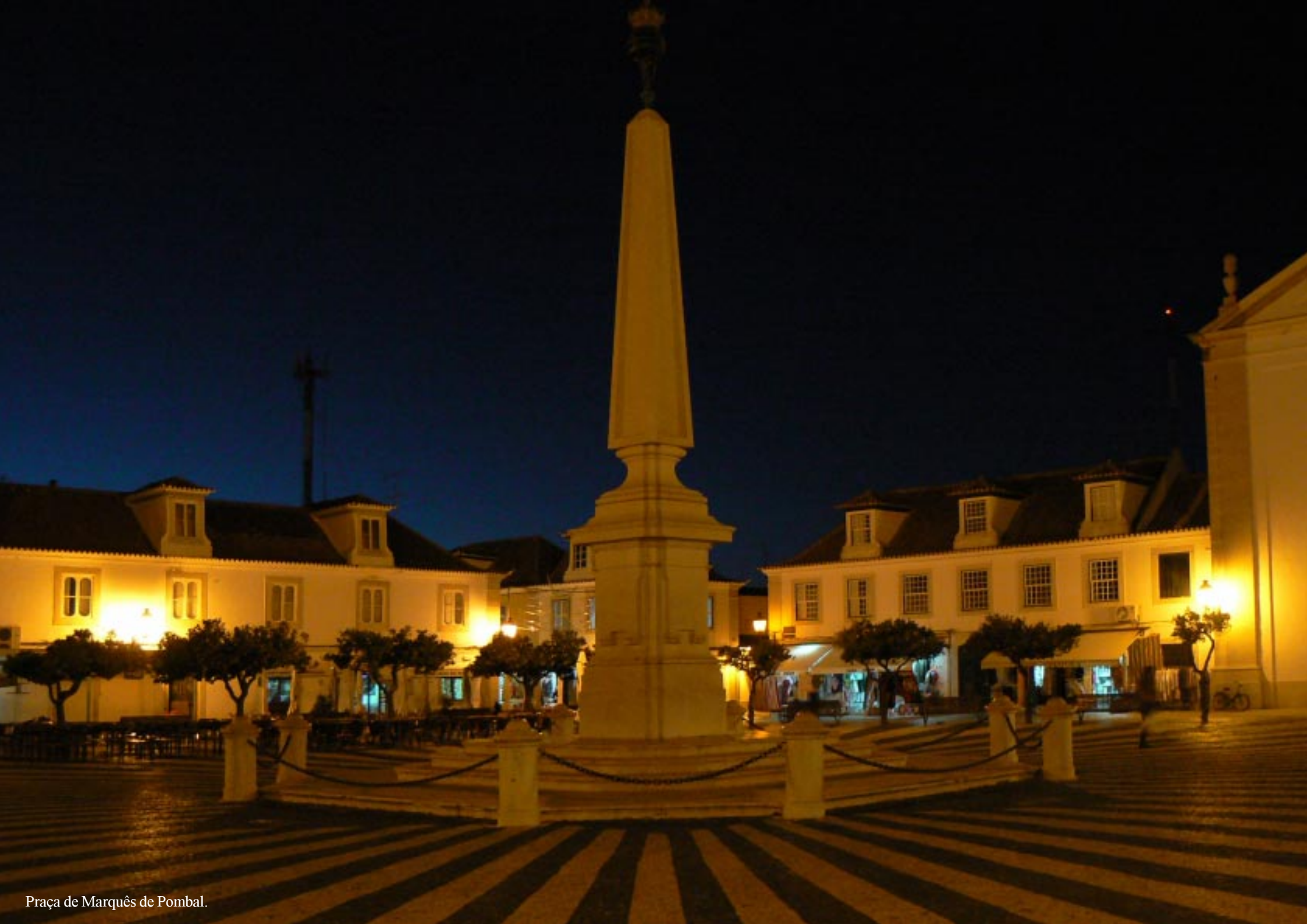
Praça de Marquês de Pombal.