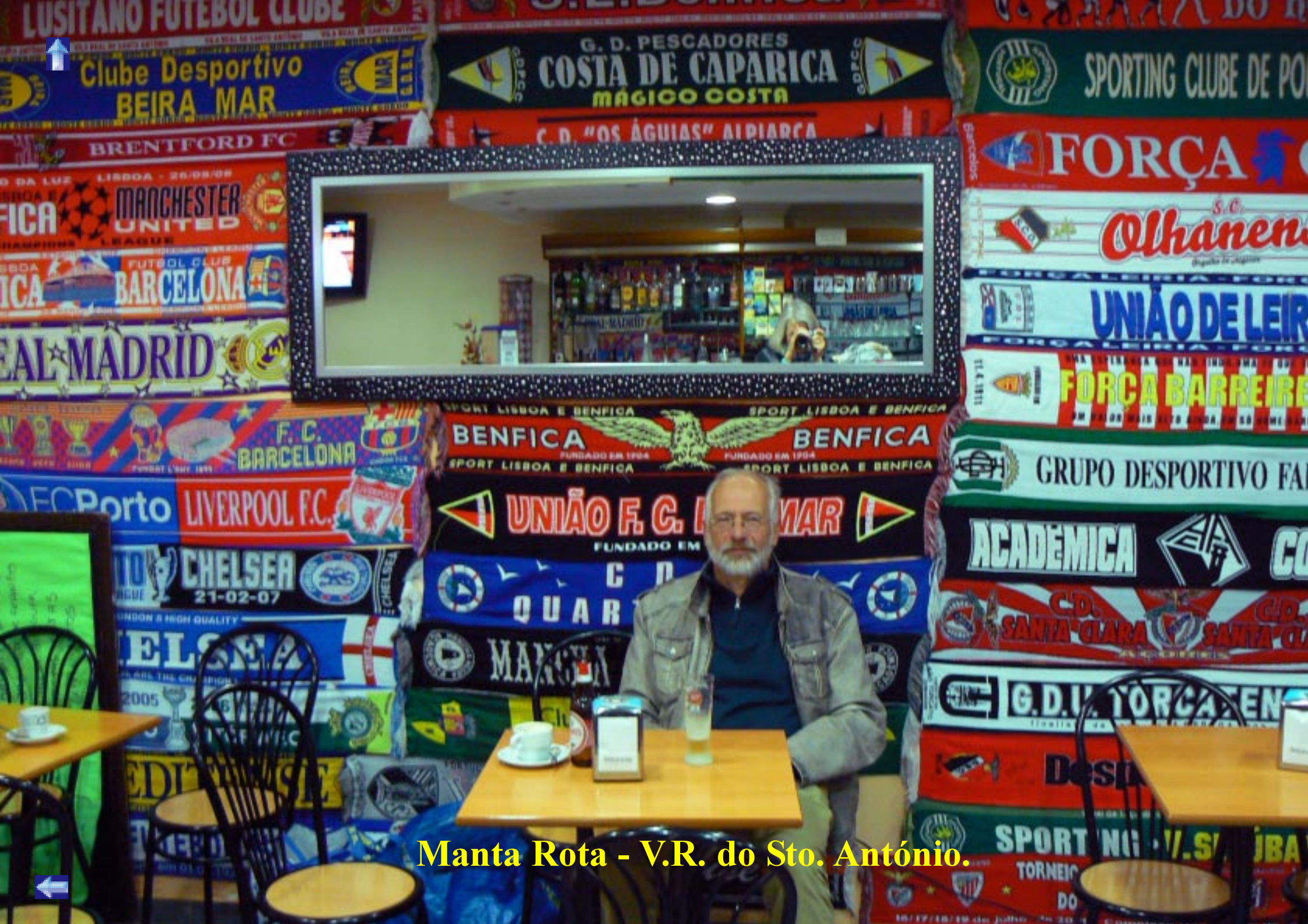
Manta Rota - V.R. do Sto. António.