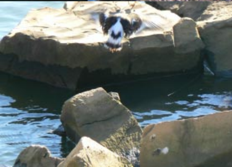
Steenloper, Arenaria interpres .