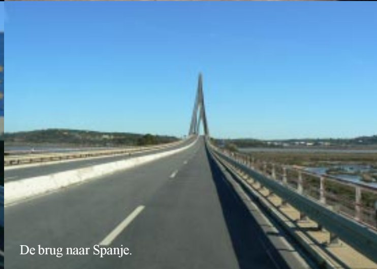
De brug naar Spanje.