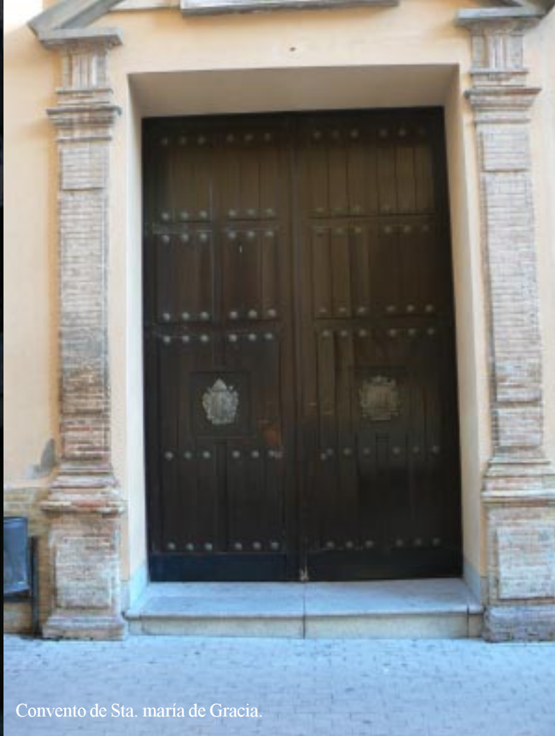
Convento de Sta. maría de Gracia.