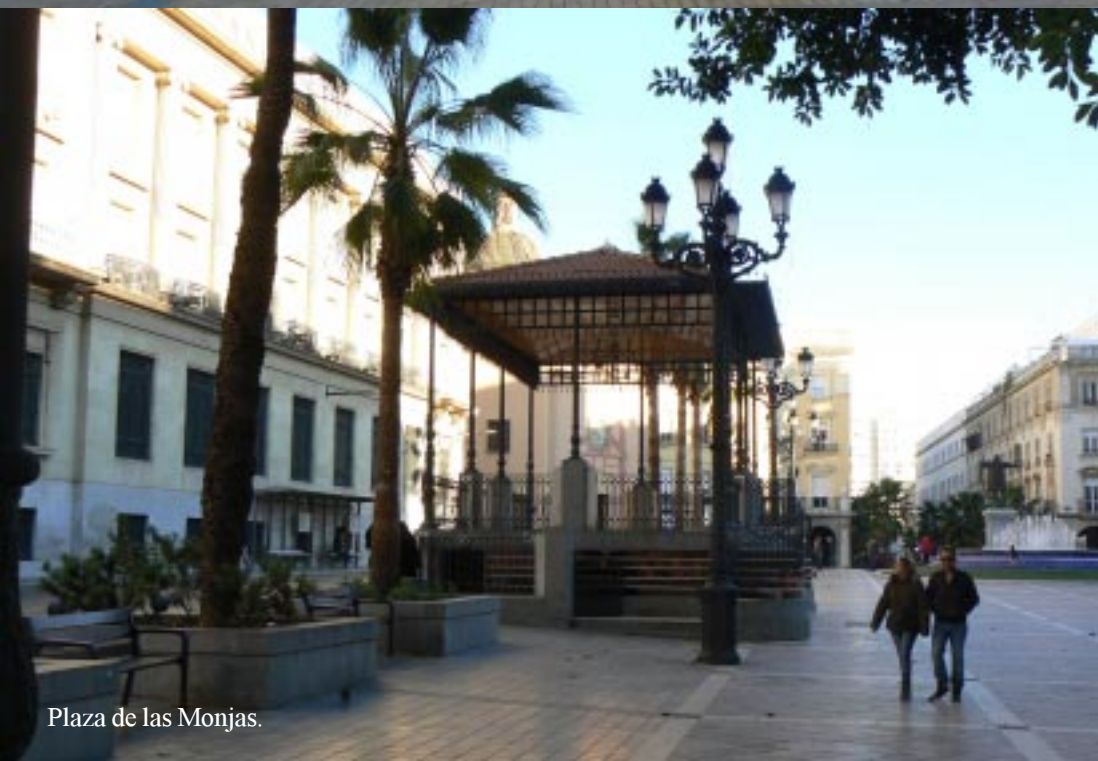
Plaza de las Monjas.