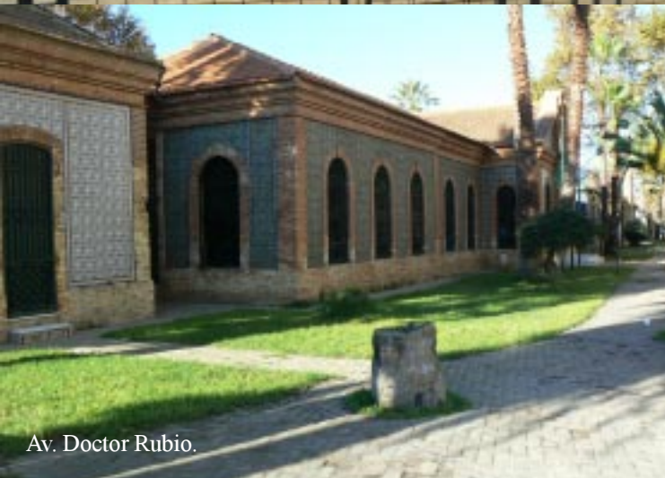
Av. Doctor Rubio.