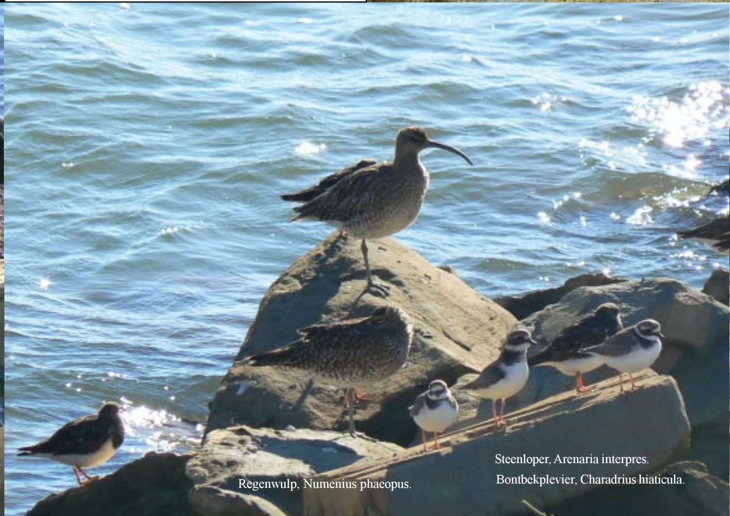
Regenwulp, Numenius phaeopus .