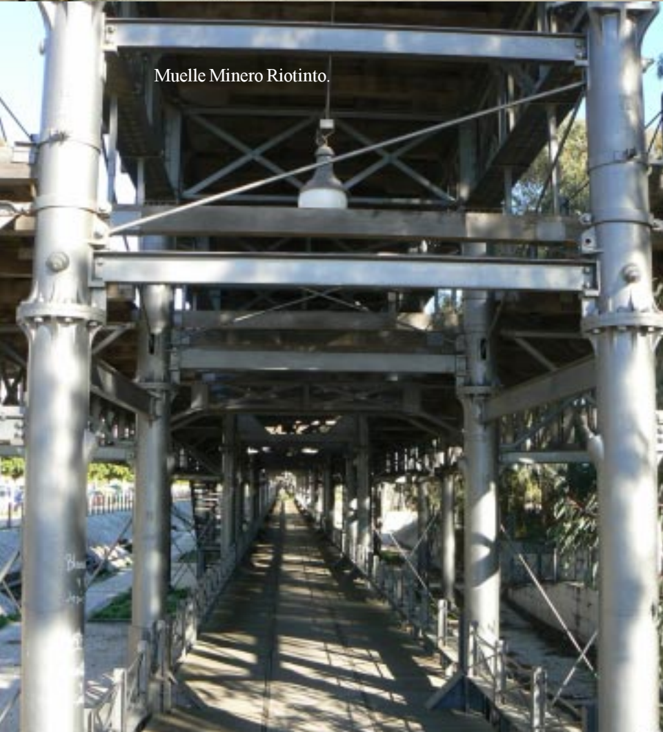
Muelle Minero Riotinto.