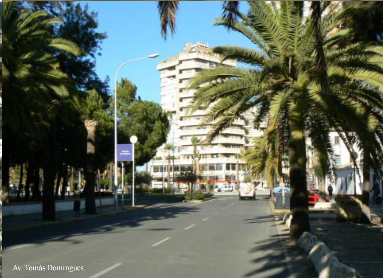
Av. Tomás Domingues.