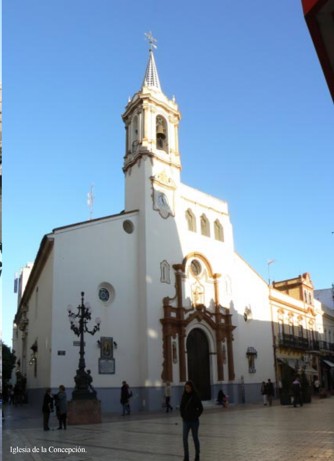
Iglesia de la Concepción.