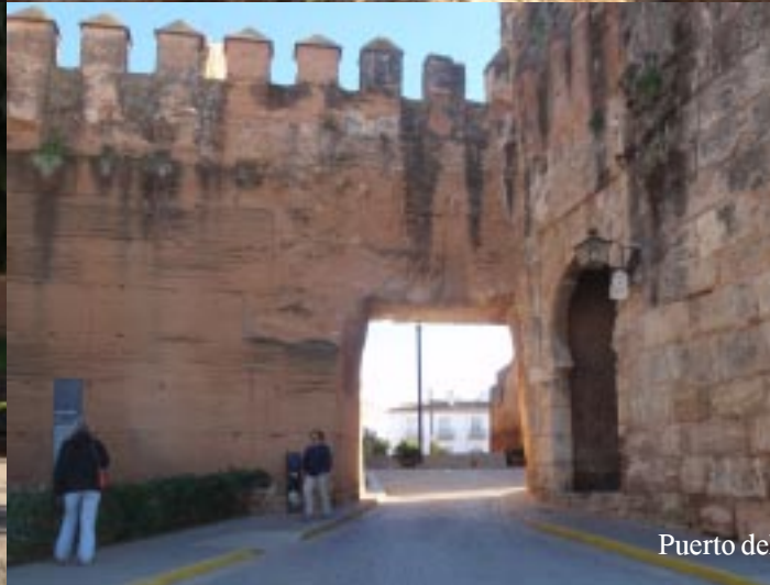
Puerto del Socorro.