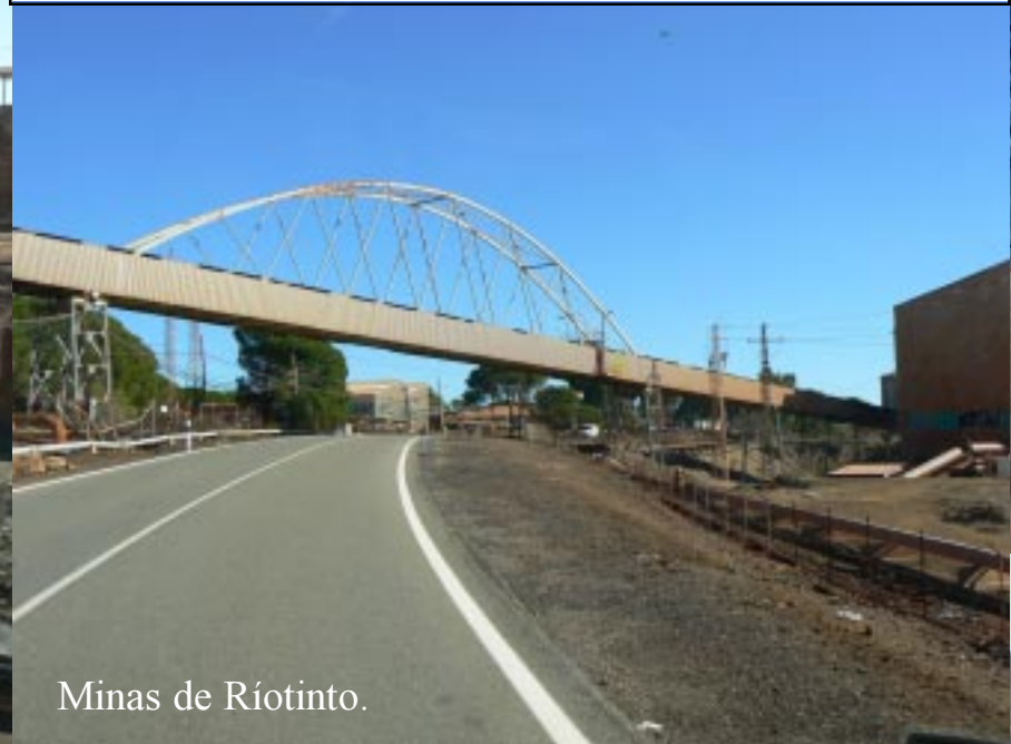
Minas de Riotinto.

We nemen ons de tijd om het een en ander te bekijken. Uiteraard maken we de vergelijking met de Minas de São Domingos (P). Dit is veel grootschaliger. Maar ook hier zijn het de Engelsen geweest, die de exploitatie tot in de moderne tijd getild hebben. In het dorp bekijken we het mijnmuseum, dat op een heel aanschouwelijke manier de diverse perioden van de werkzaamheden laat zien. Uiteraard met vele vondsten uit het verleden. Helaas mogen we binnen geen foto's maken.