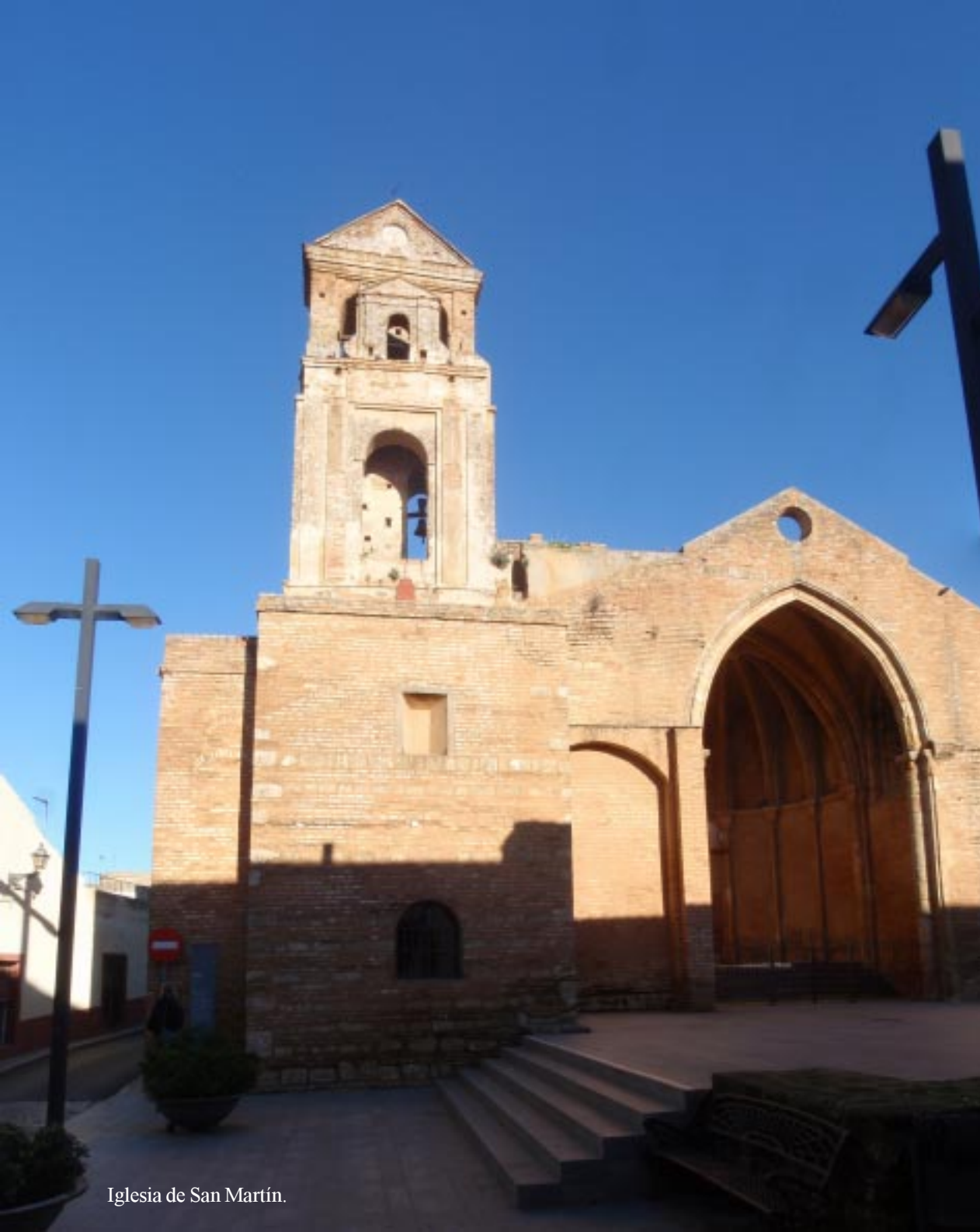
Iglesia de San Martín.