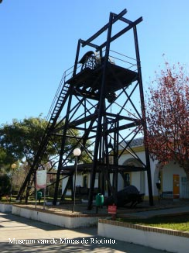
Museum van de Minas de Riotinto.