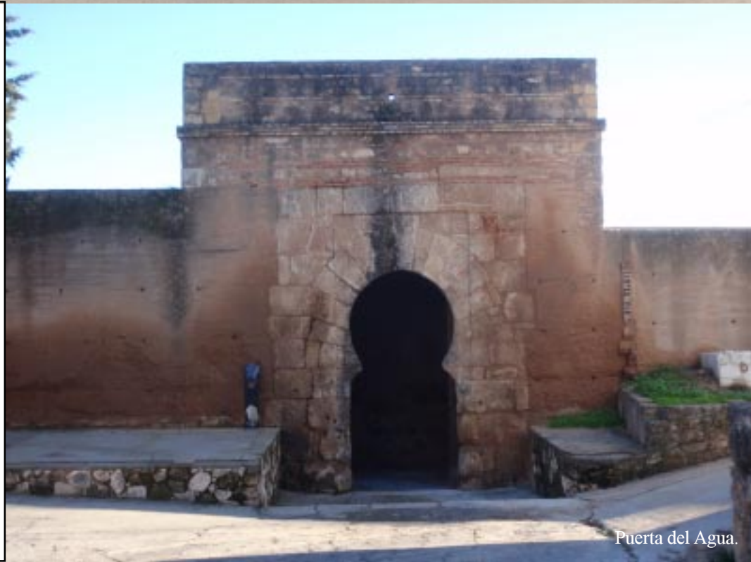
Puerta del Agua.