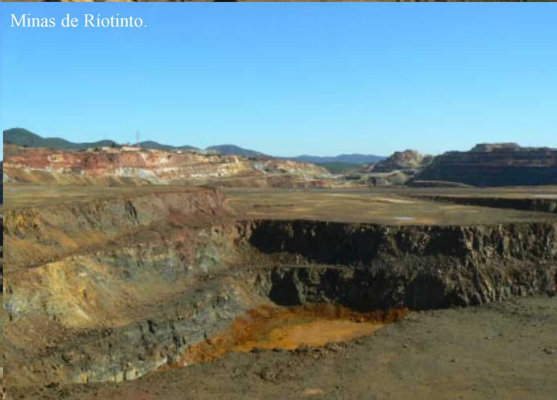
Minas de Ríotinto.