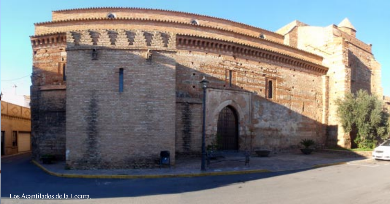
Los Acantilados de la Locura.