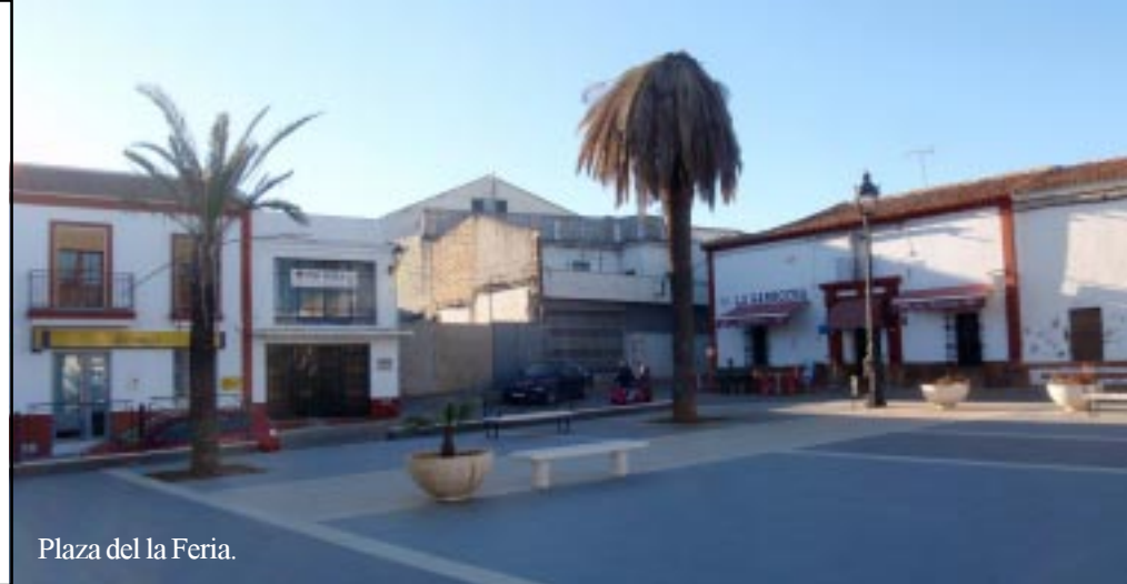
Plaza del la Feria.

We gaan onder de poort door en dan enkele straatjes rechts naar het standbeeld op een plein voor de moorse stichter van de stad Ibn Mahfuz en het Alcázar ofwel Castillo de los Guzmanes, het moorse ford dus.