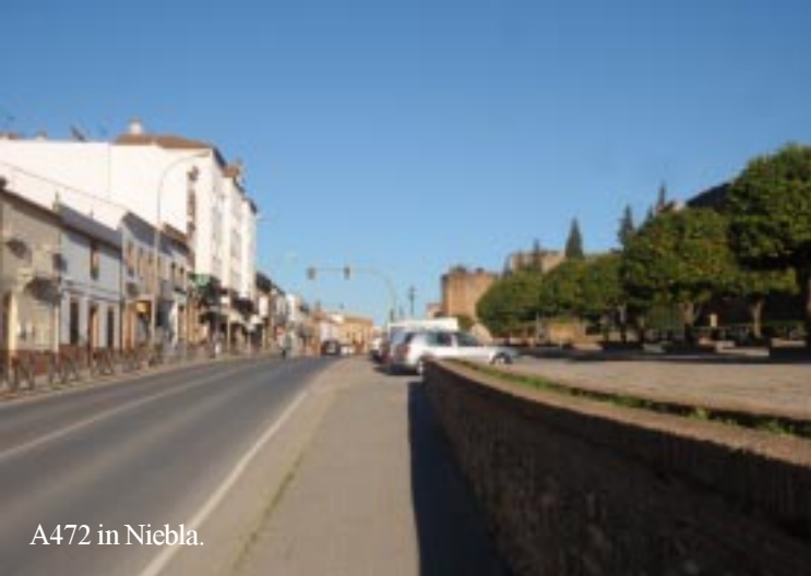
A472 in Niebla.