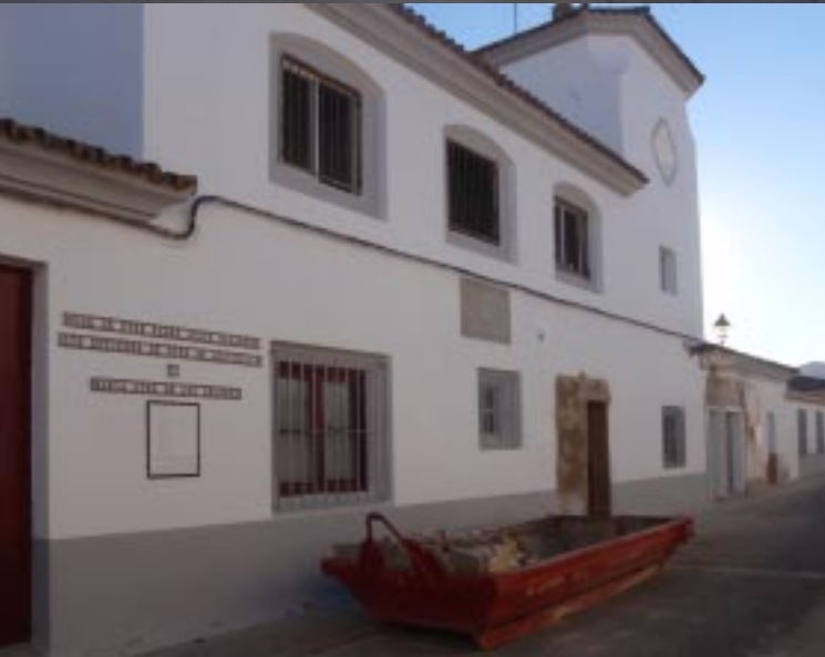
Nog wat verder komt dan de Iglesia de Sta. María de la Granada en aan de andere kant van het stadje: de Puerta del Agua.