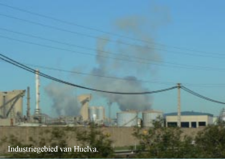
Industriegebied van Huelva.