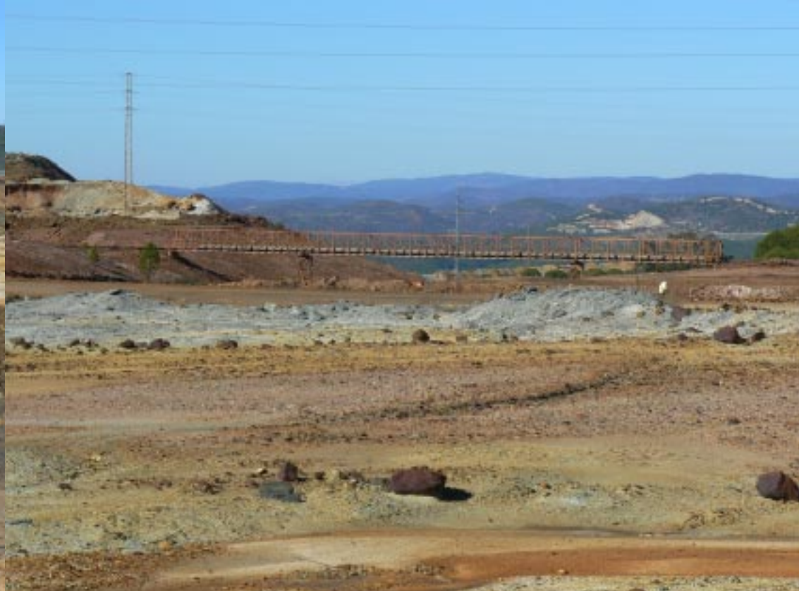
Minas de Ríotinto.