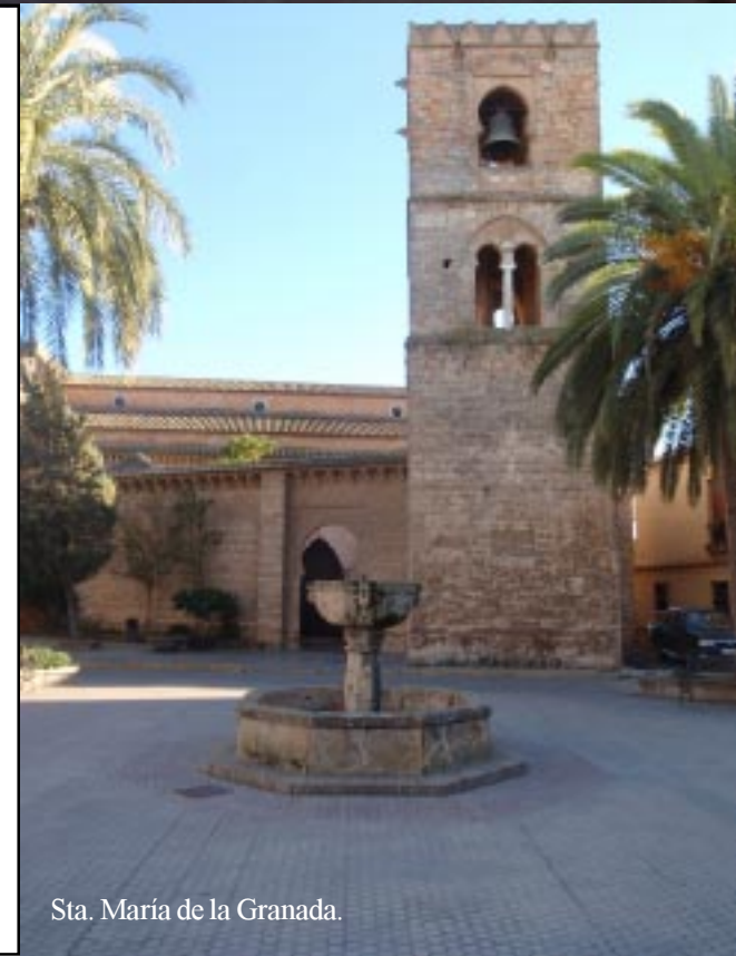
Sta. María de la Granada.

Links is de Iglesia de San Martín, die eigenlijk een ruïne is. Recht door gaat het langs de Calle Real naar o.a. het Hospital de Ntra Sra. de los Ángeles.