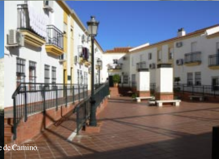
Valverde de Camino.