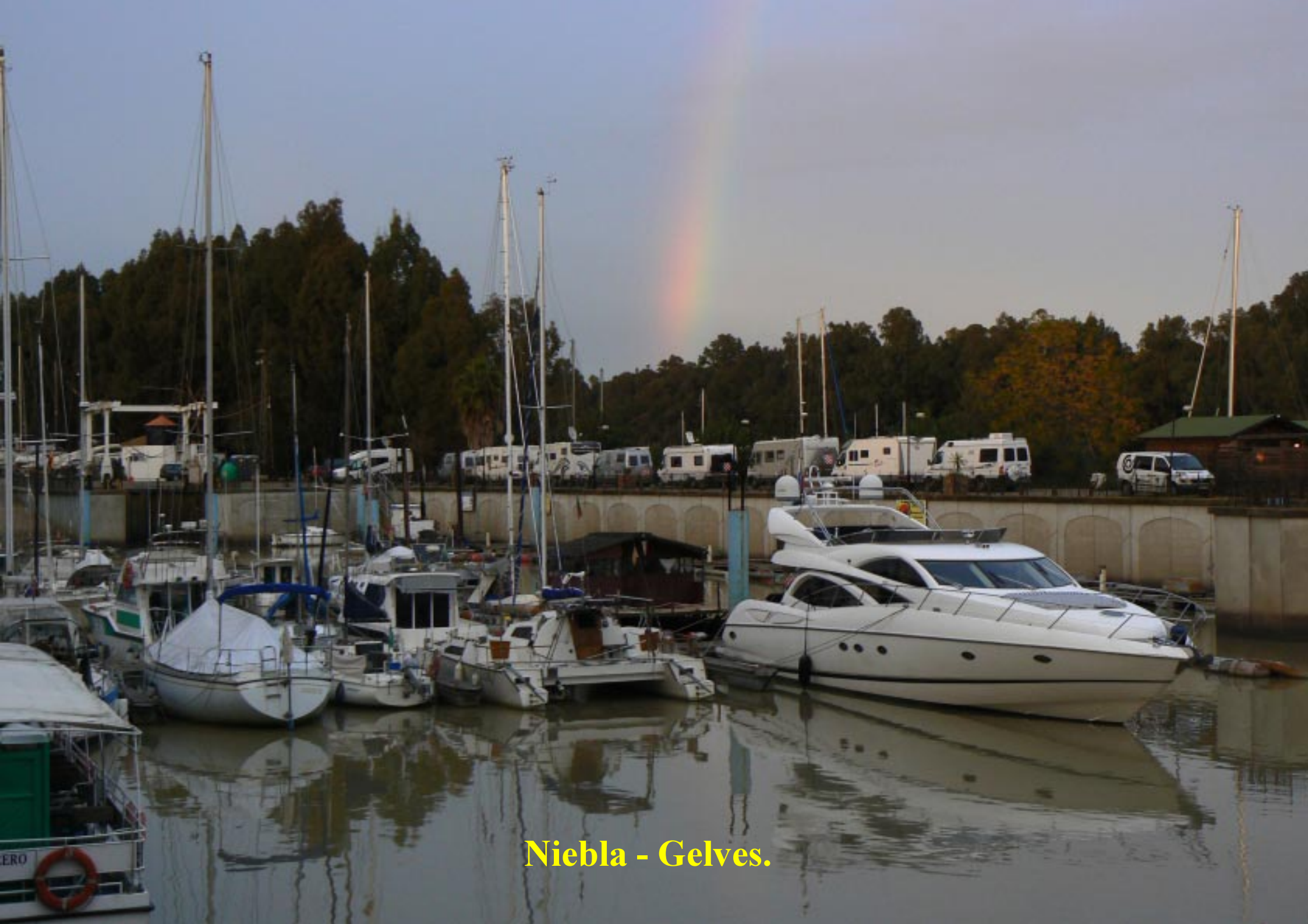
Niebla - Gelves.