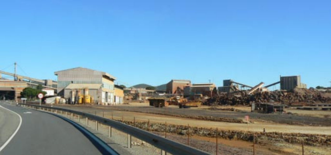
Minas de Ríotinto.

We rijden door naar Minas de Ríotinto en rijden daar langs een compleet opengescheurde aarde. Over een gigantisch gebied is de berg weggehakt op zoek naar ijzer, zilver en koper. Daar was men al mee bezig van voor de Romeinse tijd. De laatste mijnbouw duurde tot 2001!