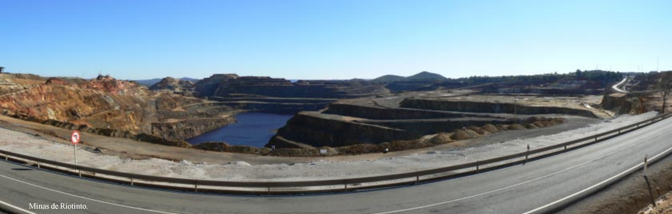
Minas de Riotinto.