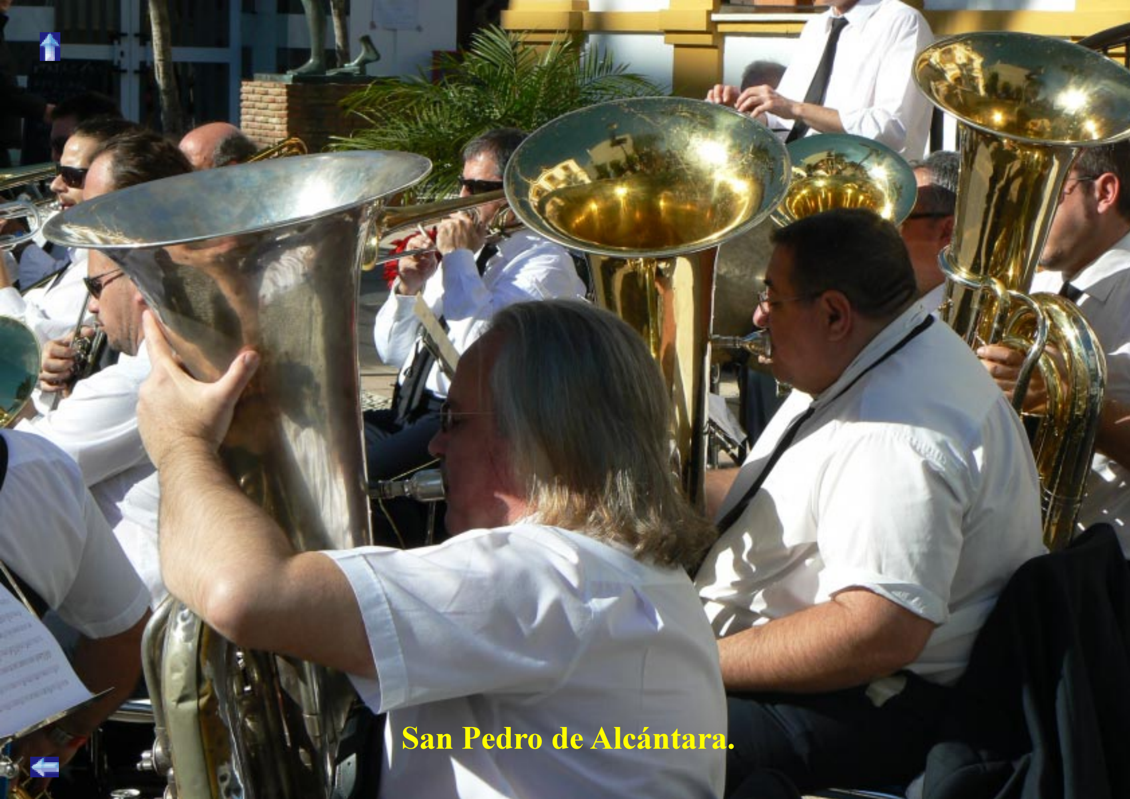
San Pedro de Alcántara.