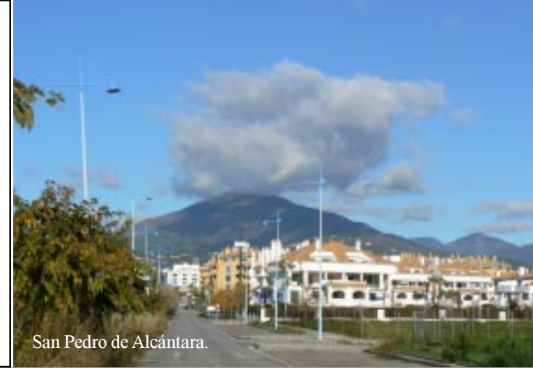
San Pedro de Alcántara.

We blijven vandaag in San Pedro. Om goed elf uur lopen we naar het centrum, dat aan de andere kant van de doorgaande weg ligt, 1,7 km wandelen.