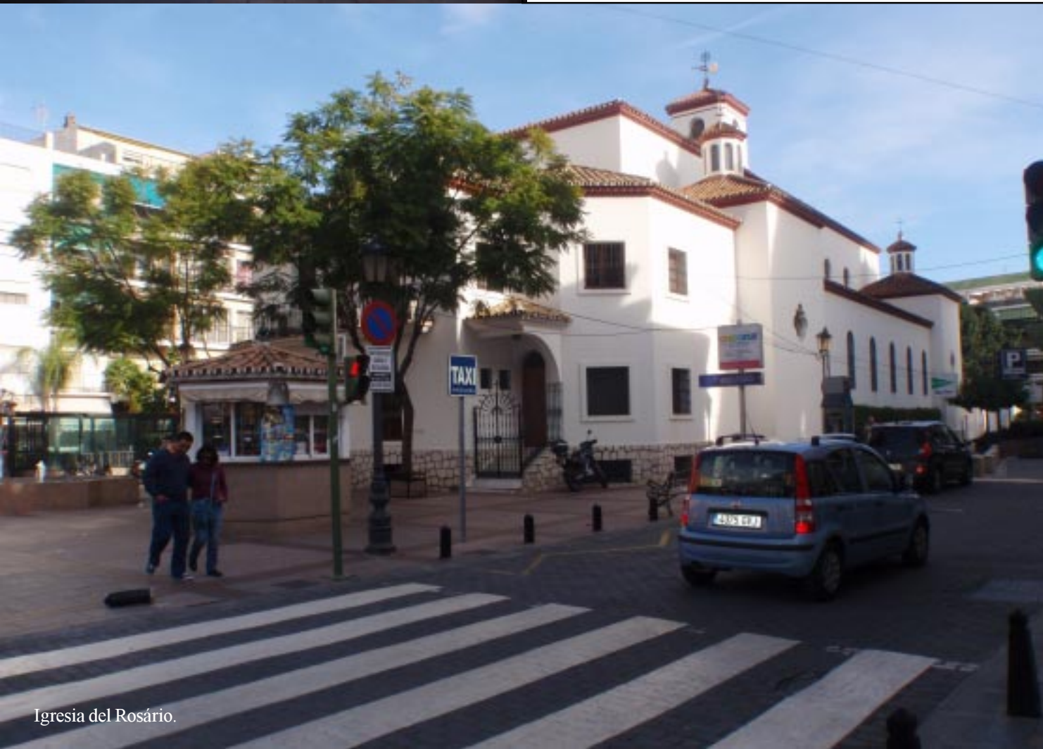
Iglesia del Rosario.