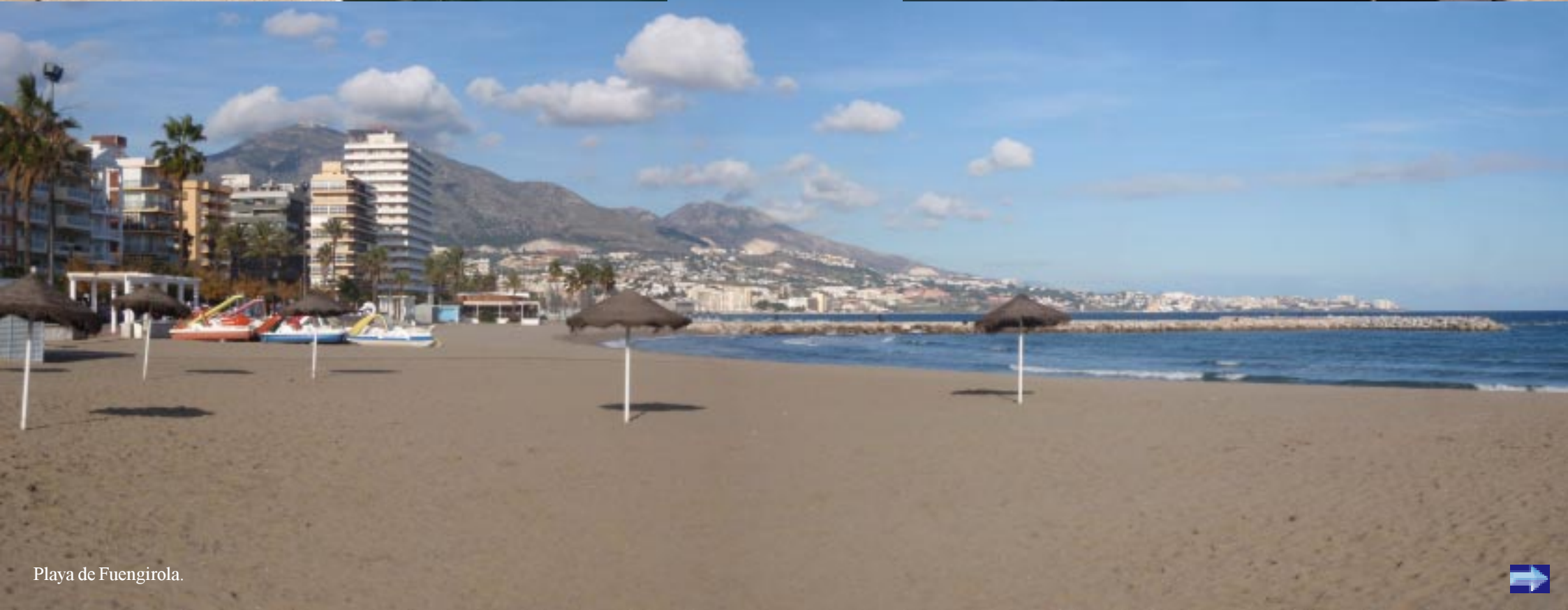
Playa de Fuengirola.