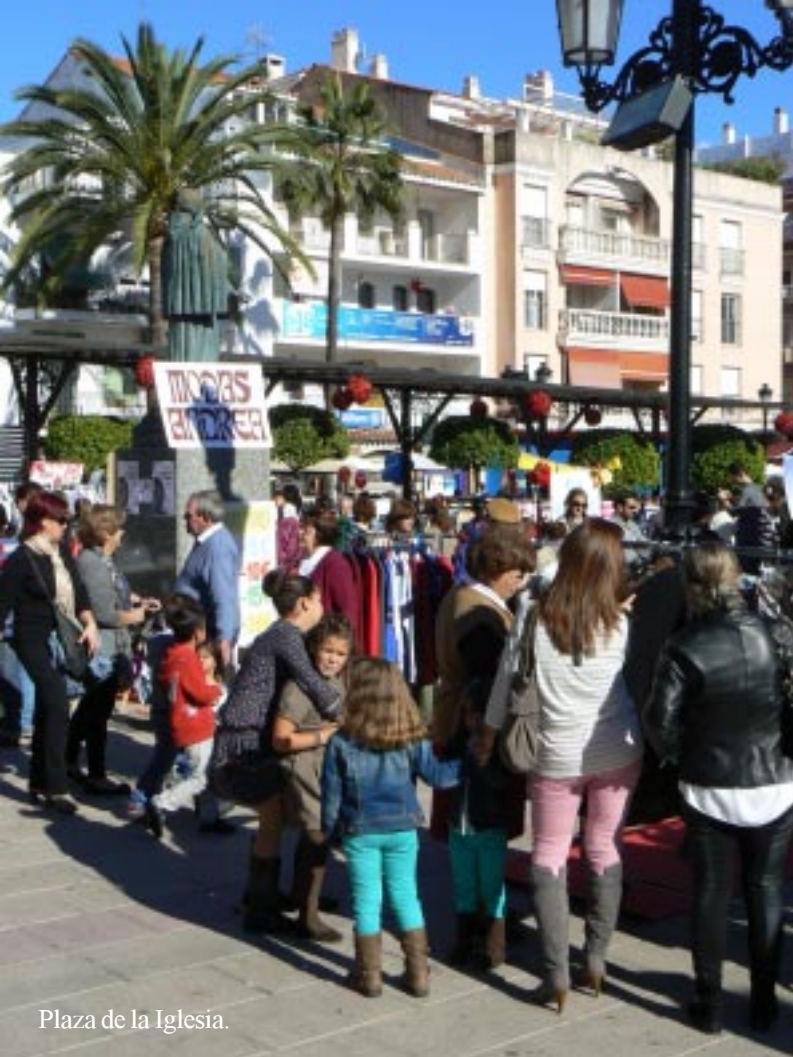
Plaza de la Iglesia.