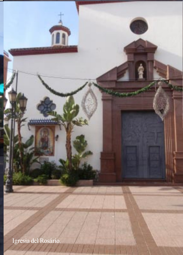
Iglesia del Rosario.