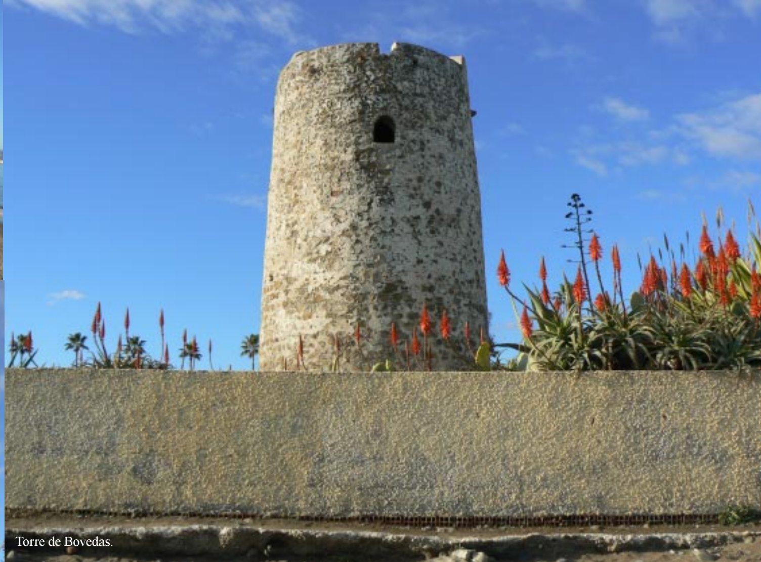
Torre de Bovedas.