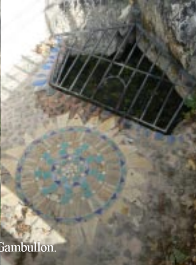
Fuente El Gambullon.

Dan stappen we weer op de fiets en rijden terug naar Salobreña. Vlak bij de camperplaats onder aan de rots, waar de oude stad op ligt, ontdekken we een stevig stromende bron: Fuente El Gambullon.