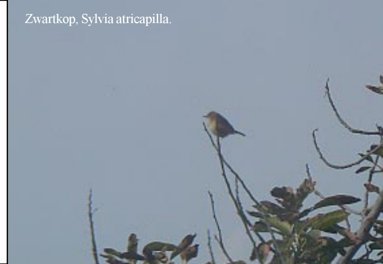
Zwartkop, Sylvia atricapilla .

's Middags na de lunch (13.50) stappen we op de fiets en rijden tussen de tuinen door naar Guardia een van de 2 kleine dorpjes achter de suikerfabriek.