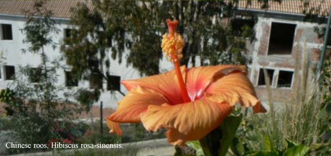
Chinese roos, Hibiscus rosa-sinensis .