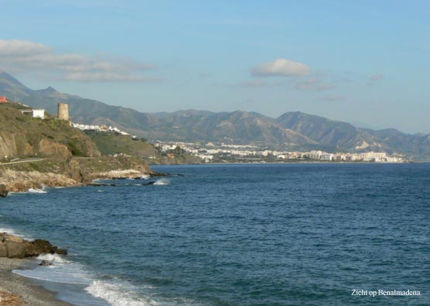
Zicht op Benalmadena.