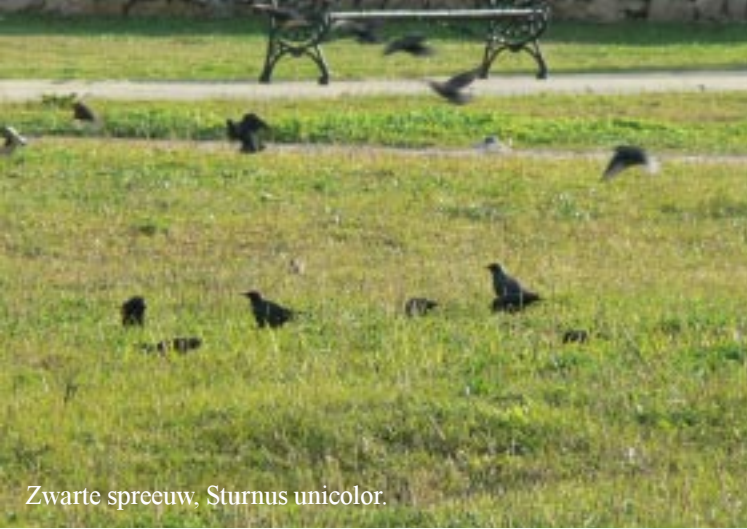
Zwarte spreeuw, Sturnus unicolor .