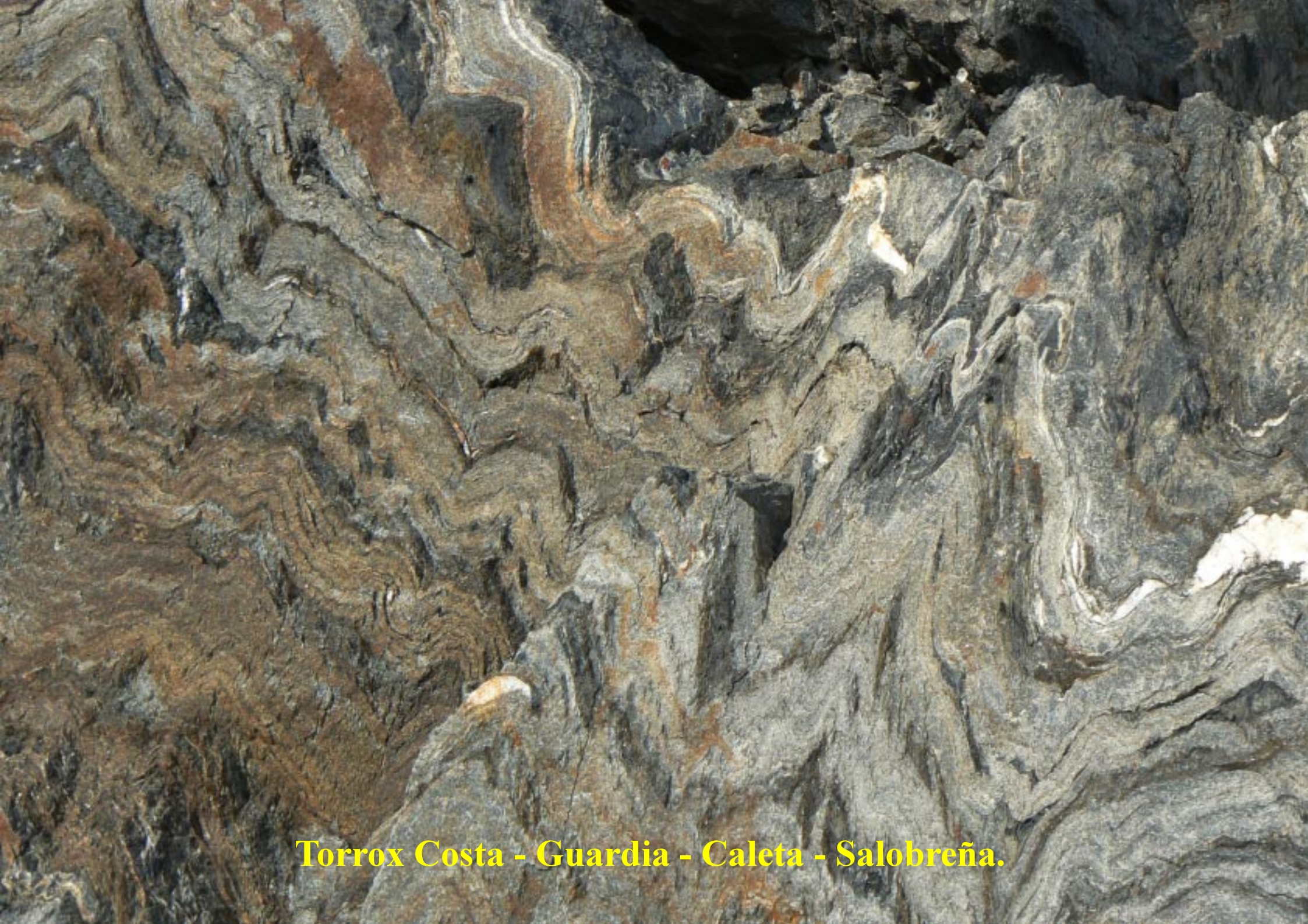
Torrox Costa - Guardia - Caleta - Salobreña.