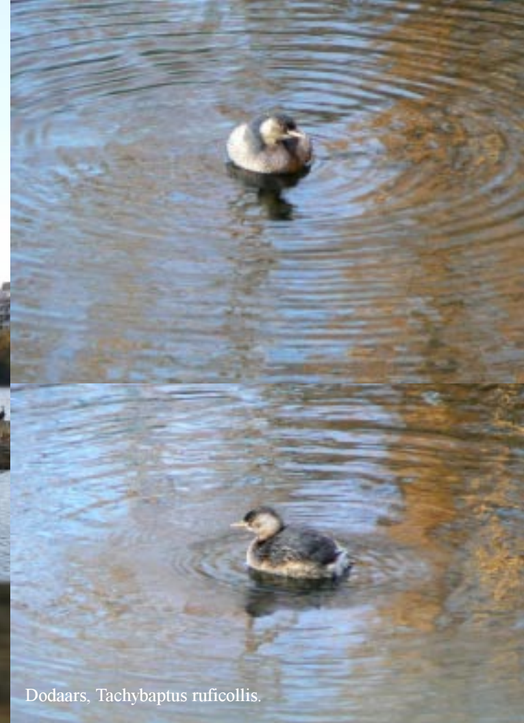
Dodaars, Tachybaptus ruficollis .