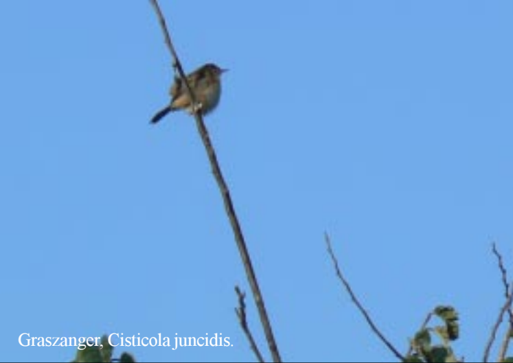
Graszanger, Cisticola juncidis .

12-13-2012. Salobreña - Puerto Motril. ‘s Morgens zit ik buiten op de stoel vogels te spotten. Naast de nodige zangvogels (b.v. Graszangers), zie ik ook een valk.