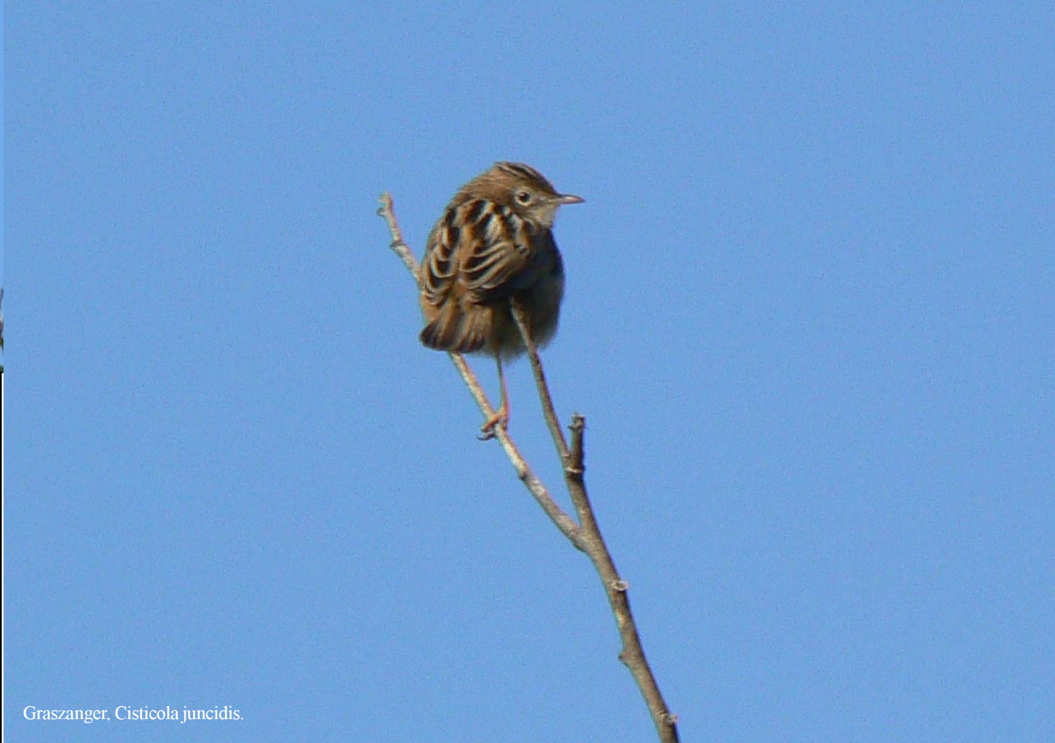
Graszanger, Cisticola juncidis .

12-13-2012. Salobreña - Puerto Motril. ‘s Morgens zit ik buiten op de stoel vogels te spotten. Naast de nodige zangvogels (b.v. Graszangers), zie ik ook een valk.