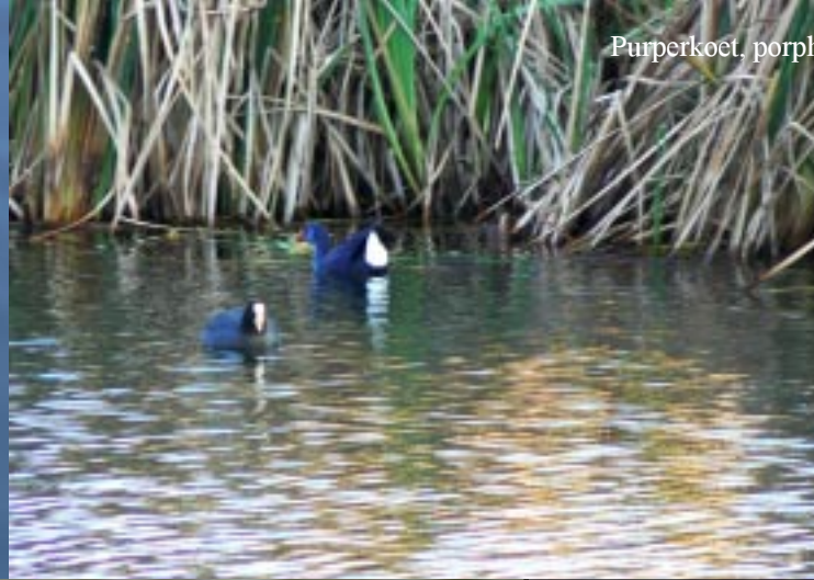
Purperkoet, porphyrio porphyrio .