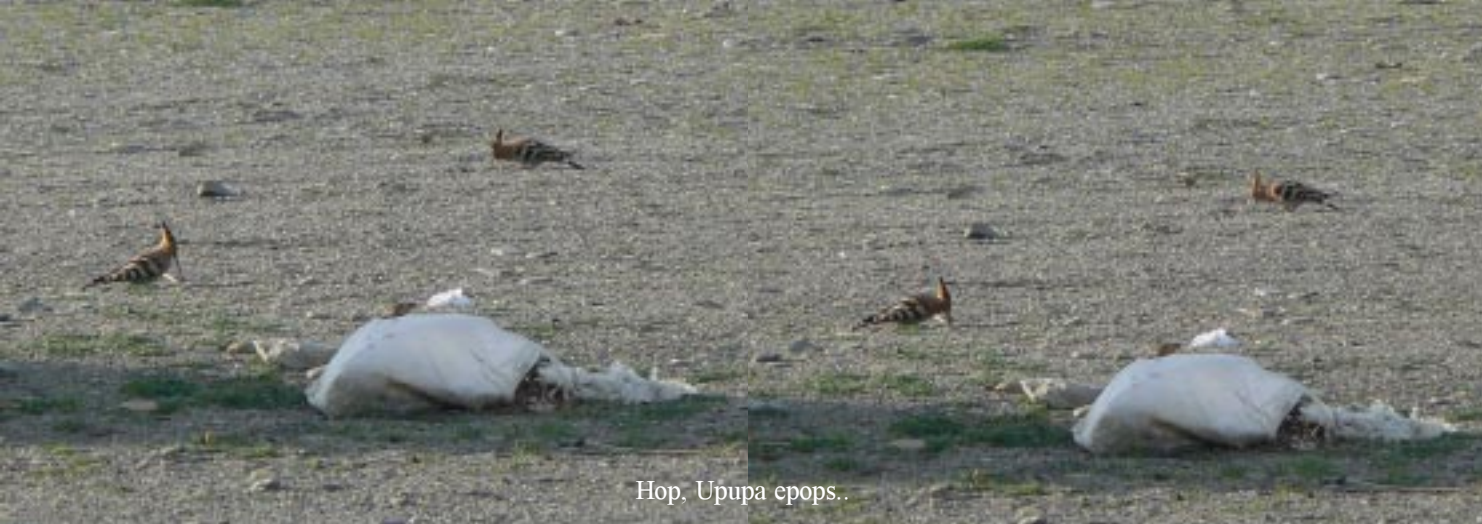
Hop, Upupa epops..

14-12-2012. Puerto Motril - Las Alpujarras - Guardias Viejas. ‘s Morgens zien we 4 Hoppen op het brede kiezelstrand hun ochtendkostje op scharrelen. Na 4441 km rijden we om 10.20 naar de LIDL in Motril 10.35 - 11.00. Dan gaat het verder landinwaarts en bergop. Hier zien we weer aardig wat Mar Plastico.