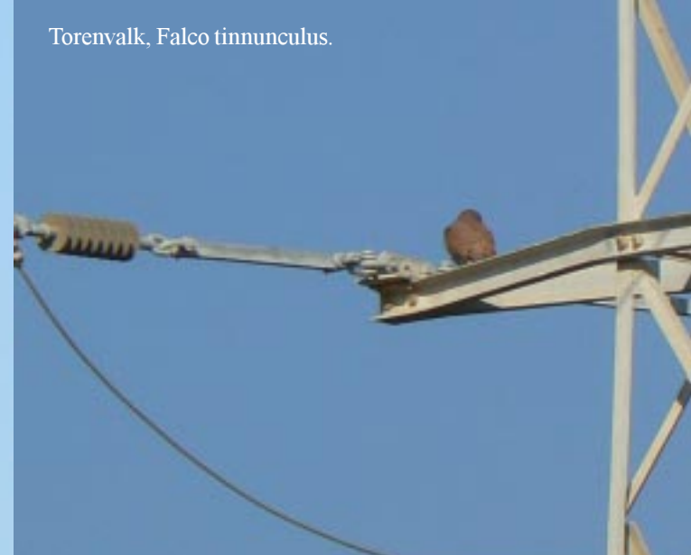
Torenvalk, Falco tinnunculus .