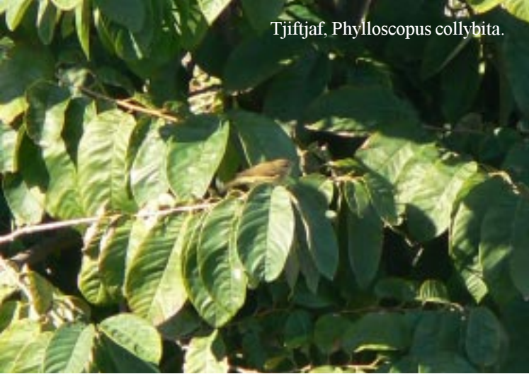
Tjiftjaf, Phylloscopus collybita .