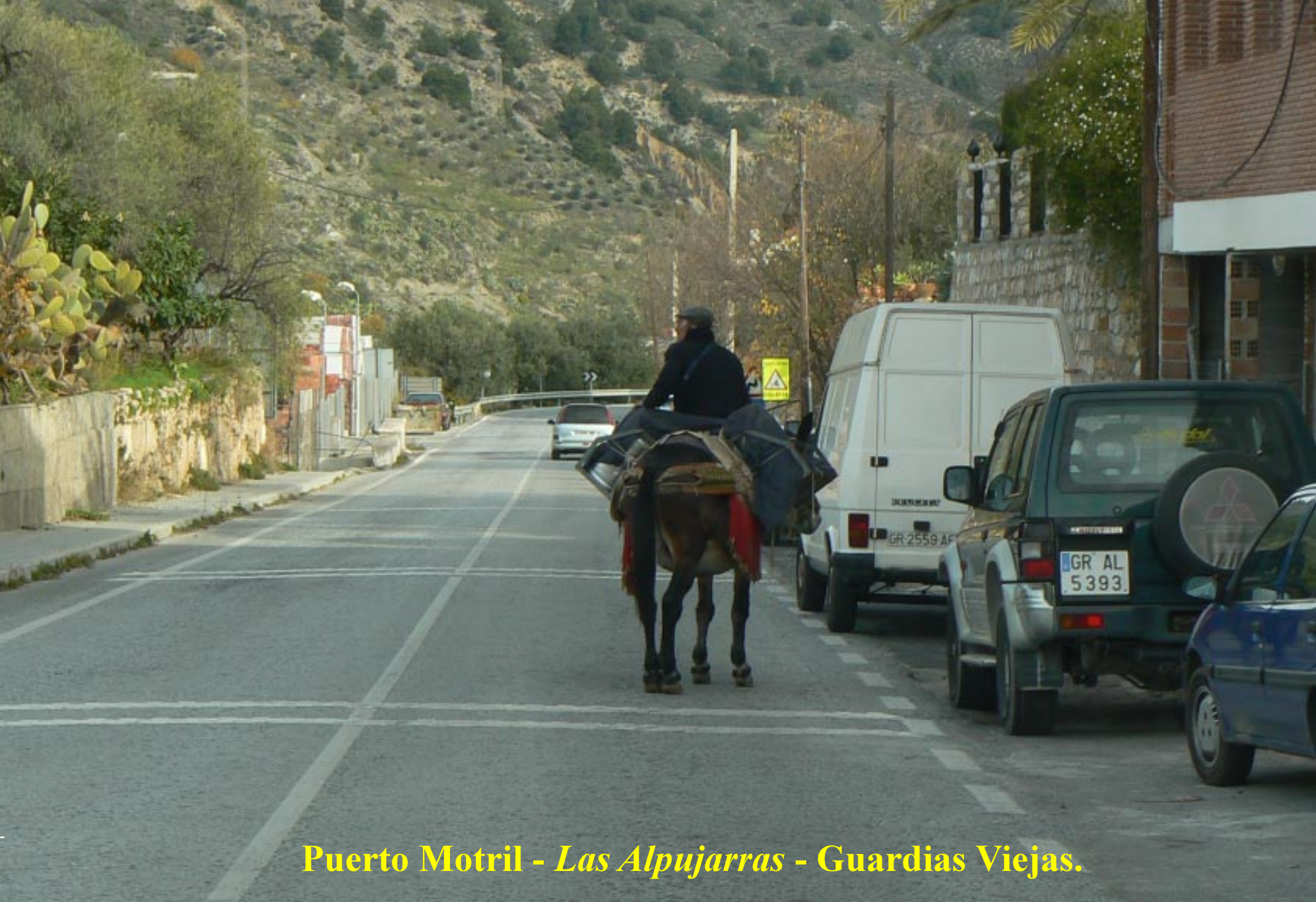
Puerto Motril - Las Alpujarras - Guardias Viejas.