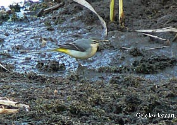
Gele kwikstaart, Motacilla flava .