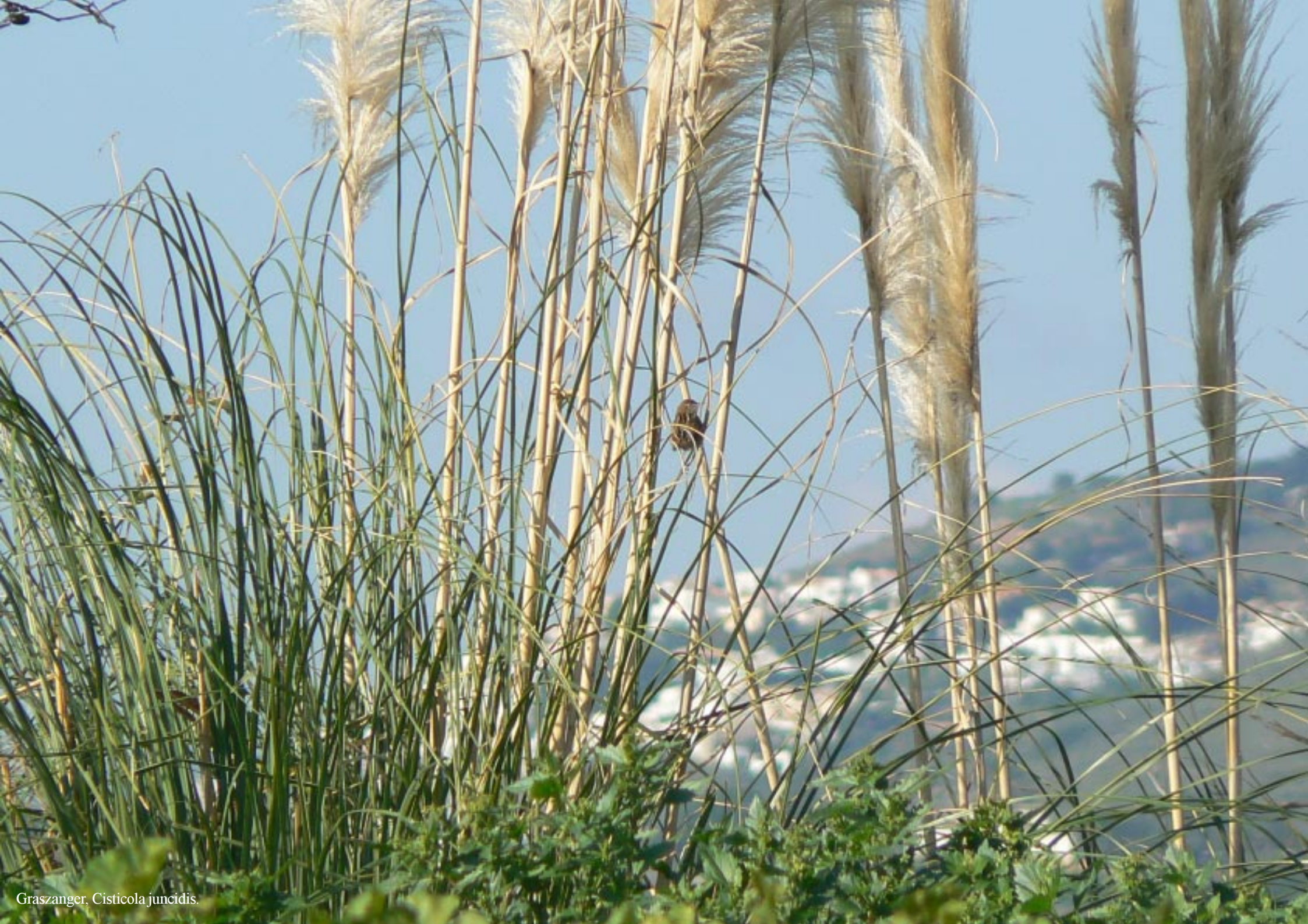
Graszanger, Cisticola juncidis .