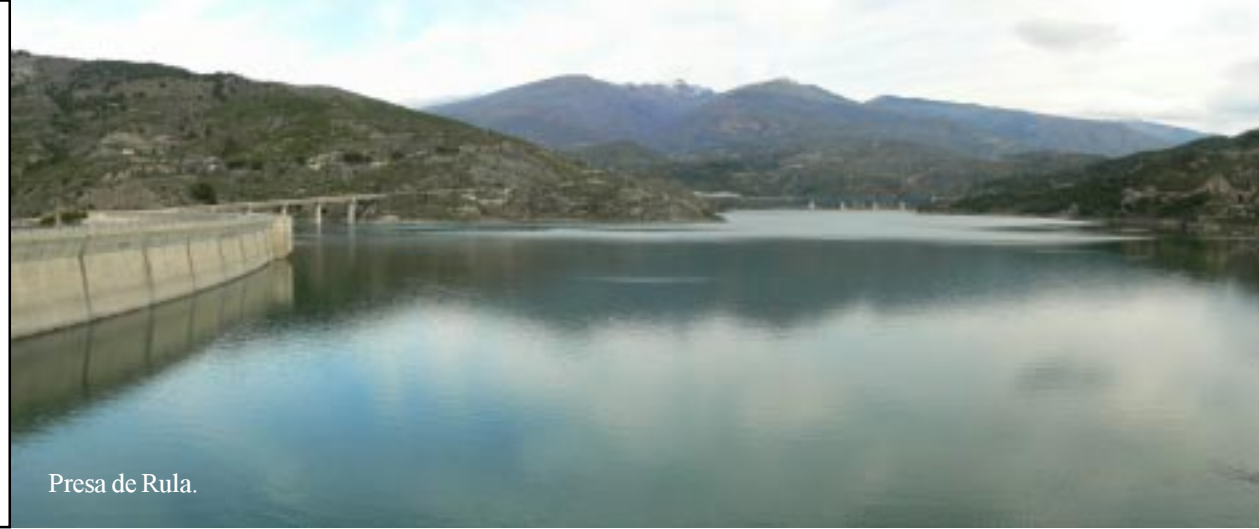
Presa de Rula.

Even later het nieuwe stuw- meer Presa de Rules (11.30). We rijden dan Las Alpujarras in, een middelgebergte tegen de Sierra Nevada aan.