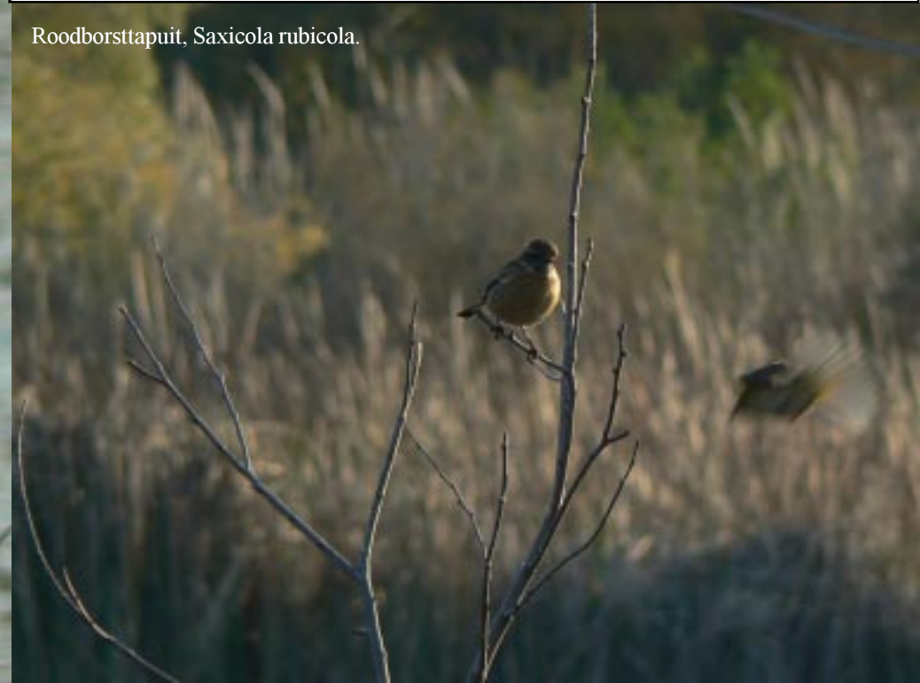
Roodborsttapuit, Saxicola rubicola .

Op ons gemak lopen we van vogelkijkhut naar vogelkijkhut en speuren de plassen af.