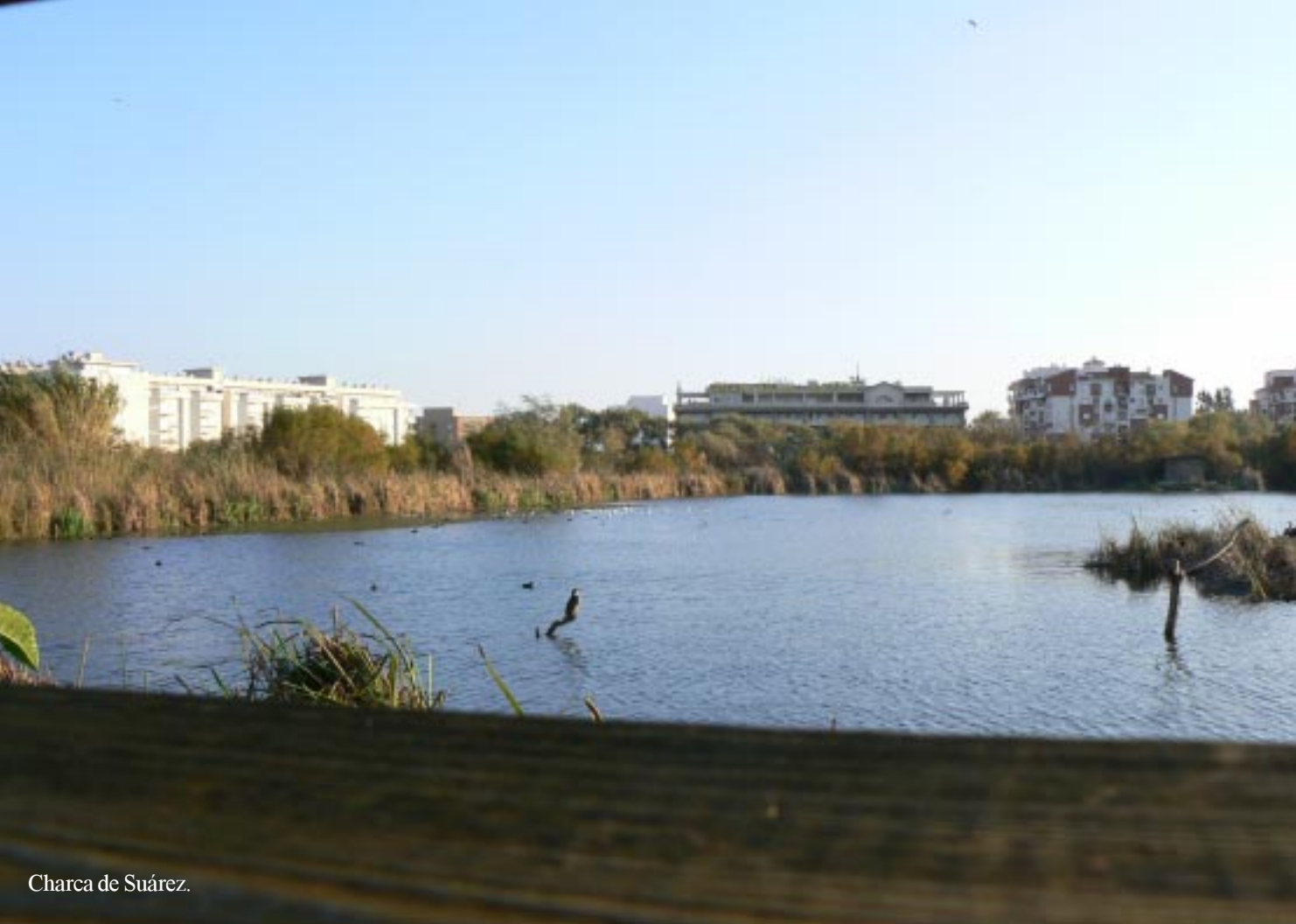
Charca de Suárez.