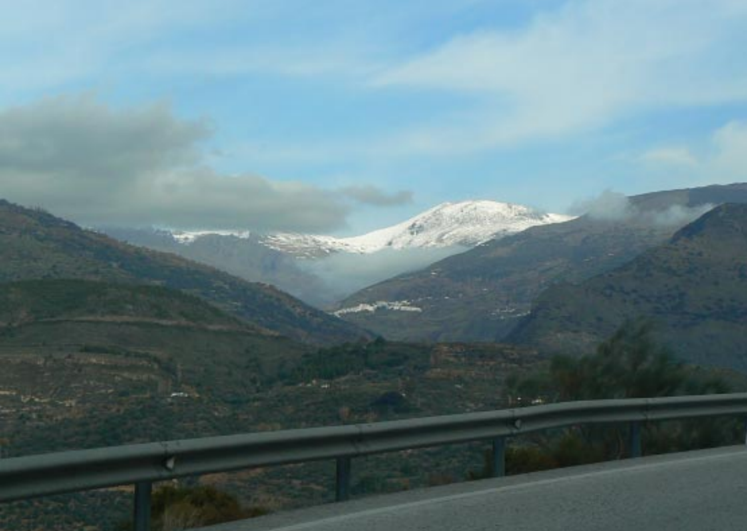
12.10: Torviscón aan de A348. Links zien we enige besneeuwde toppen van de Sierra Nevada.