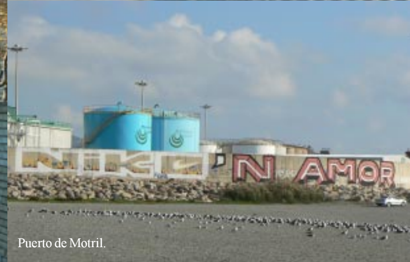
Puerto de Motril.