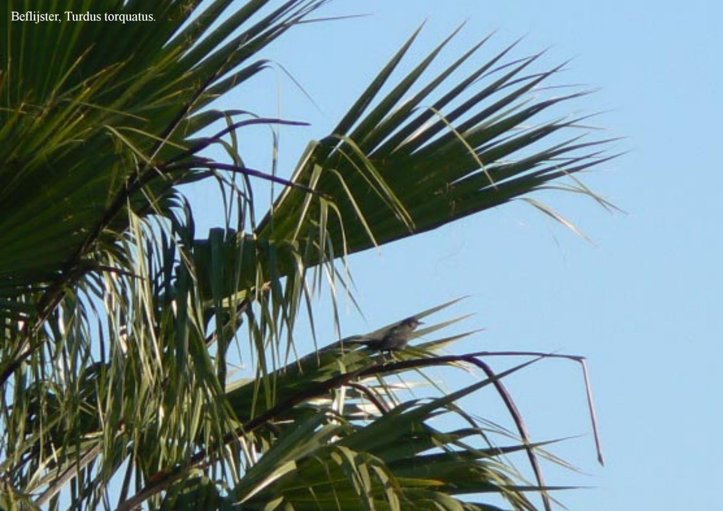
Beflijster, Turdus torquatus .