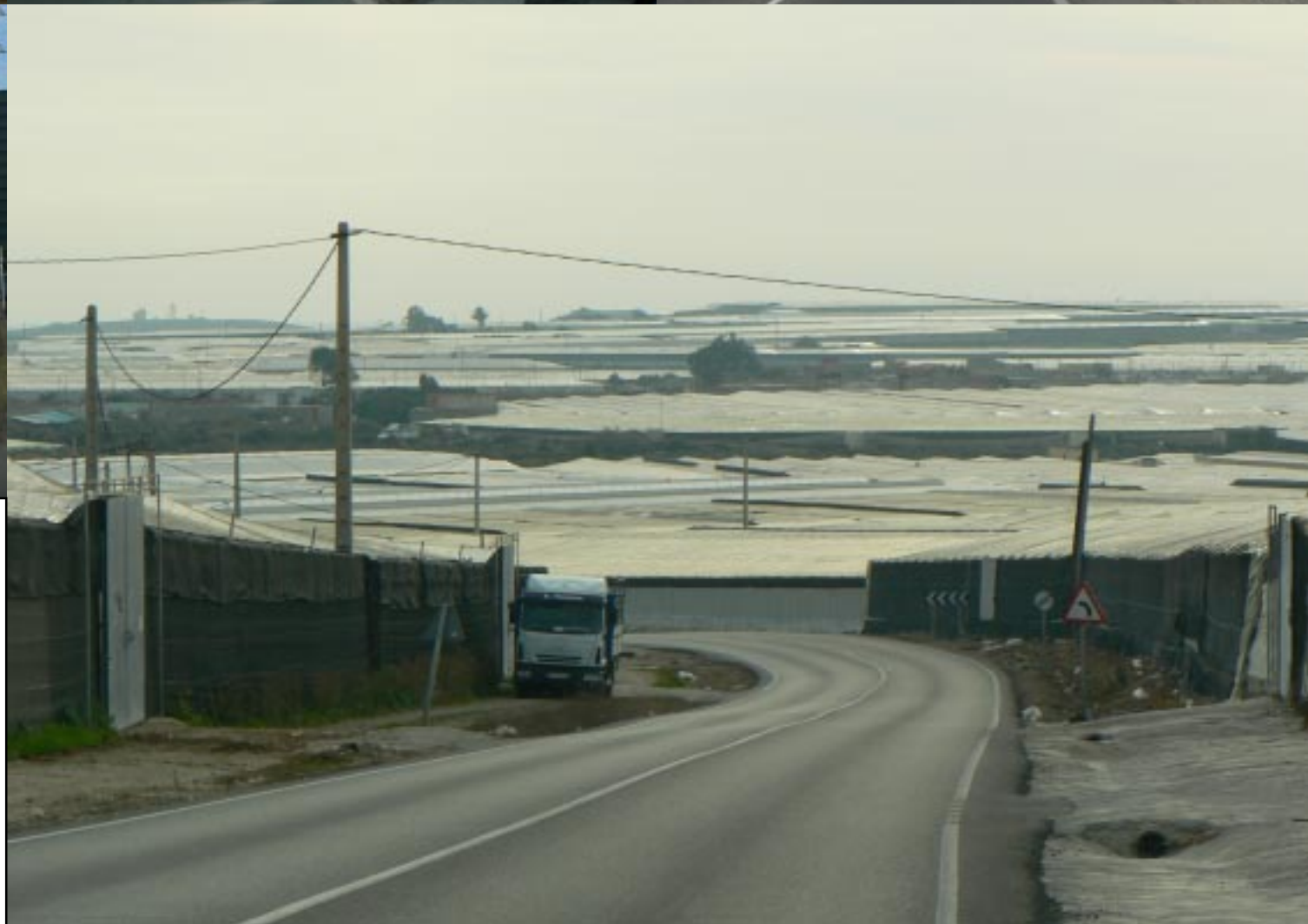
Tijdens de afdaling naar zee kijken we steeds over de plastic kassen uit, een enorme hoeveelheid staan er hier.