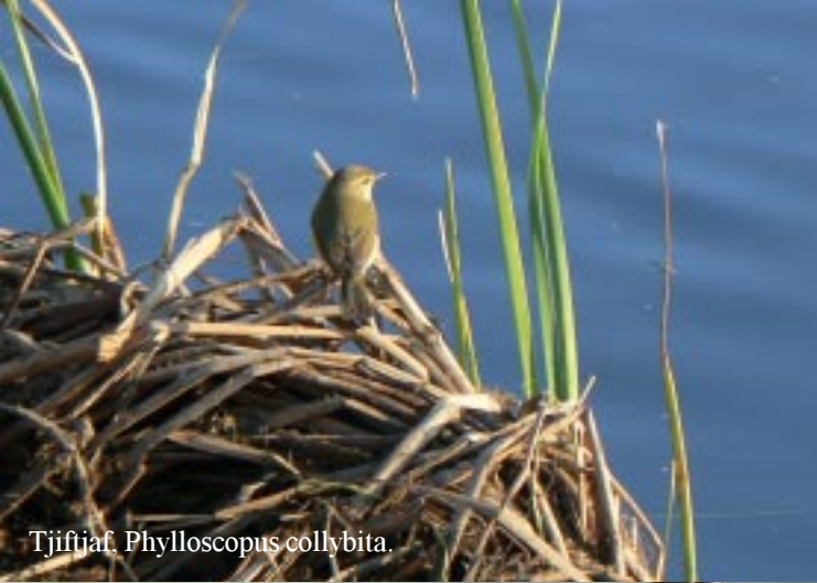
Tjiftjaf, Phylloscopus collybita .