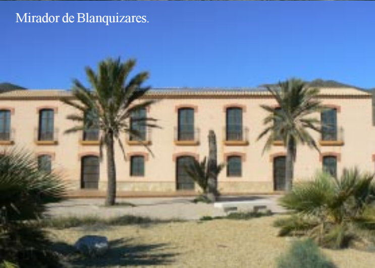
Mirador de Blanquizares.