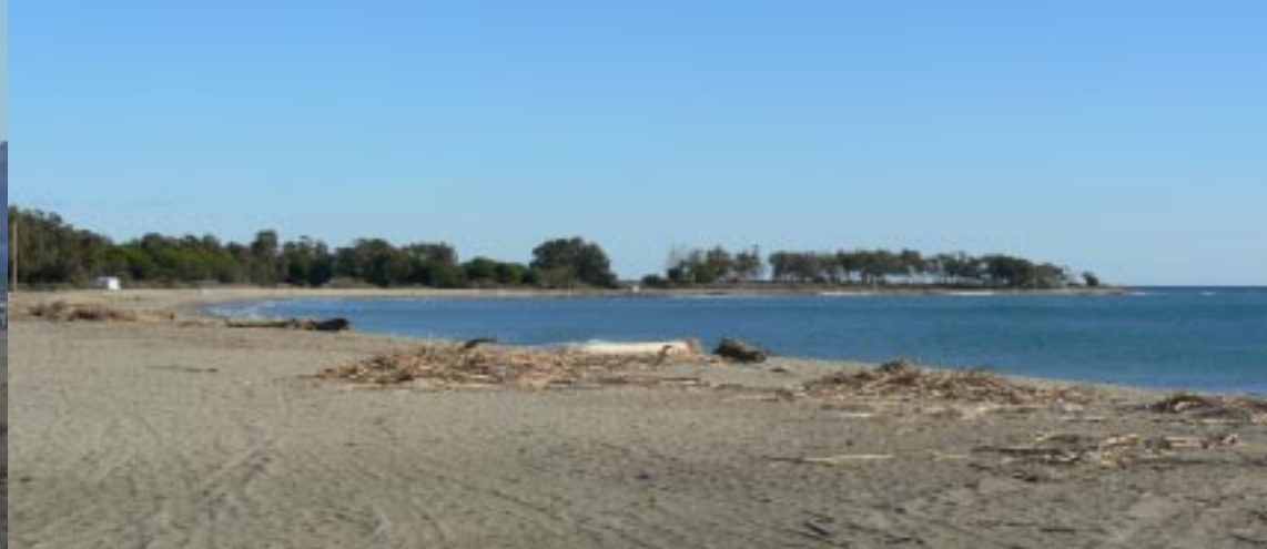
Strand tussen Villaricos en Puerto del Rey.