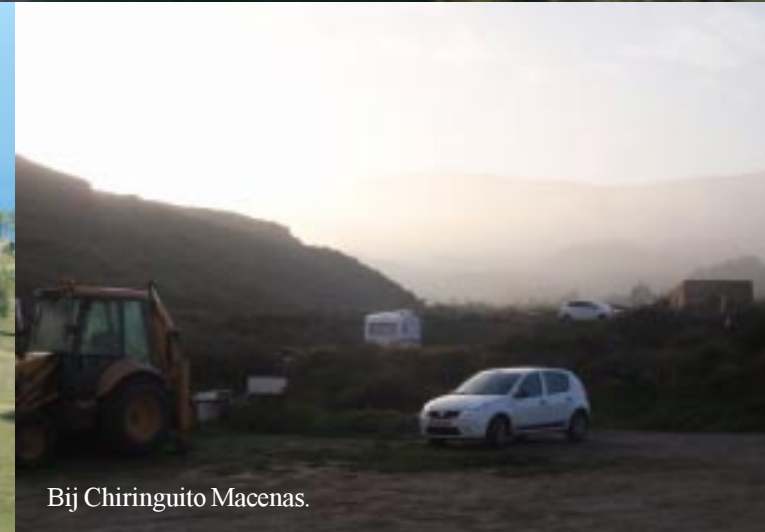
Bij Chiringuito Macenas.