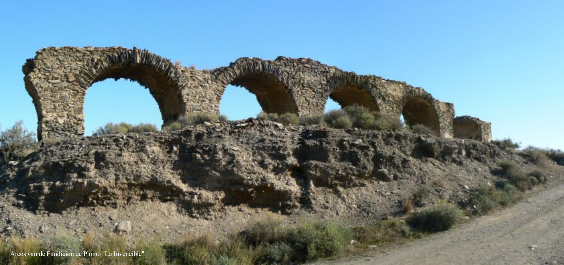
Arcos van de Fundición de Plomo "La Invencible".