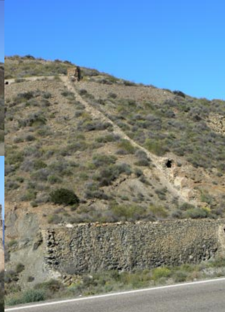
Ruïnes van de Fundición de Plomo "La Invencible".