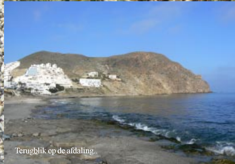
Terugblik op de afdaling..