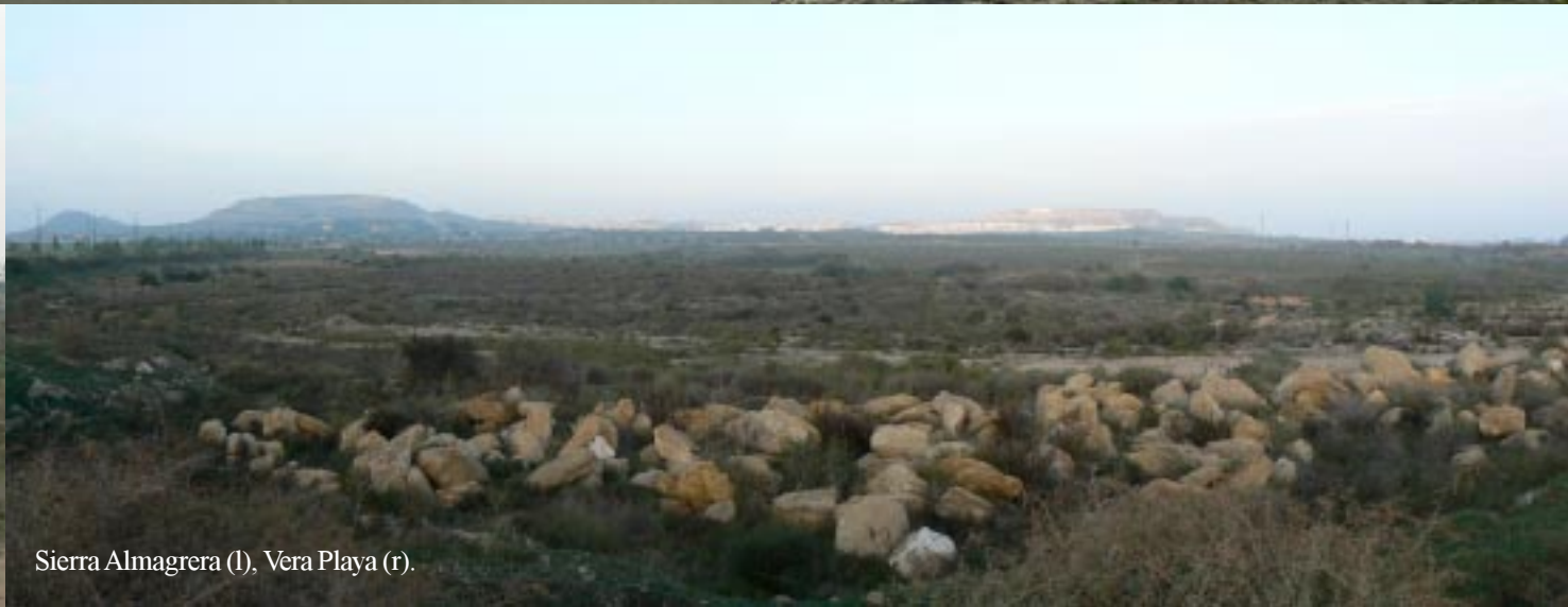
Sierra Almagrera (l), Vera Playa (r).