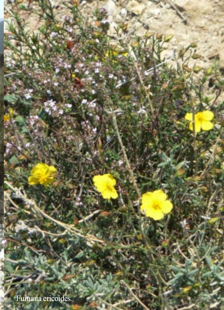
Fumana ericoides .