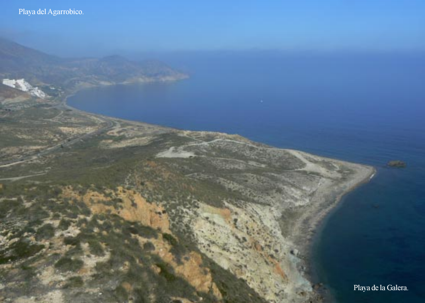
Playa de la Galera.