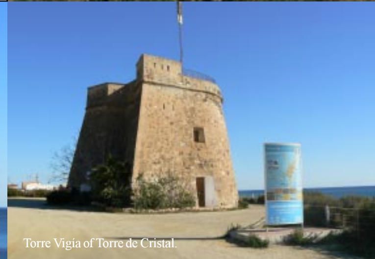
Torre Vigía of Torre de Cristal.