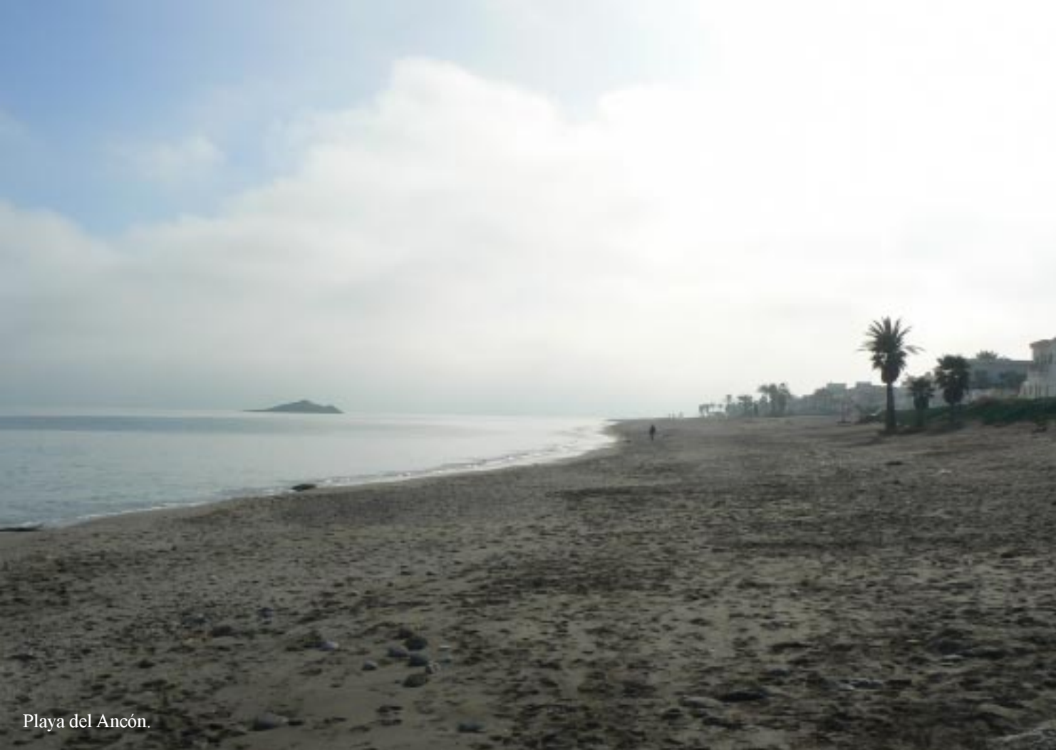
Playa del Ancón.

Nu dalen we de 120 m zeer steil af naar het strand. Gezien de ervaring van zo-even soms zelfs voetje voor voetje. De laatste 10 m hoogteverschil zijn het gemeenste: Vanwege bouwactiviteiten is het pad verdwenen en moeten we zelf het vervolg zoeken. Om 14.30 komen we beneden aan en lopen via het strand en later over de boulevard met vele gezellige terrasjes en winkeltjes naar ons ZippII terug. (15.00). We nemen eerst de late lunch.