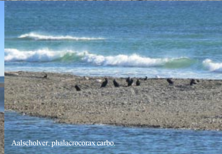
Aalscholver, phalacrocorax carbo.