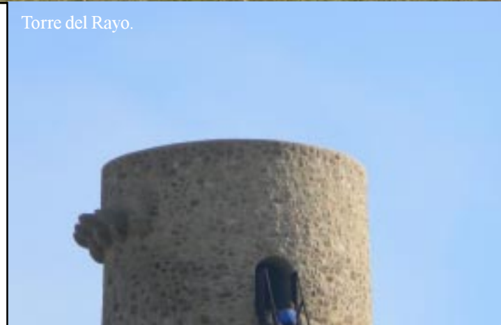
Torre del Rayo.

Om 13 uur begint het pad dan naar de AL5105 af te dalen. Eerst nog langzaam, maar dan steeds steiler. Op dit met vele losse steentjes bezaaide pad is dat wel opletten. Toch glij ik op gegeven moment weg. Maar kan me gelukkig met een hand simpel opvangen met slechts een schaaftondje als resultaat. We steken de weg schuin over en volgen een breed pad in de richting van de toren. Opnieuw gaat het steil bergop. Op gevoel af houden we (terecht) 2x rechts aan en komen zo om 13.35 bij de recent gerestaureerde toren aan.