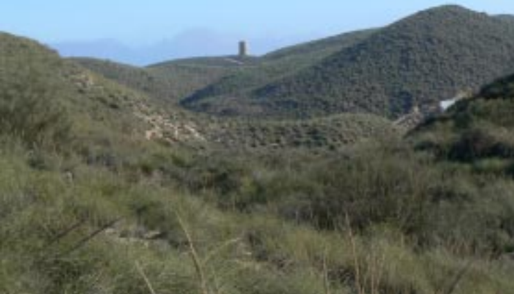
Torre del Rayo.