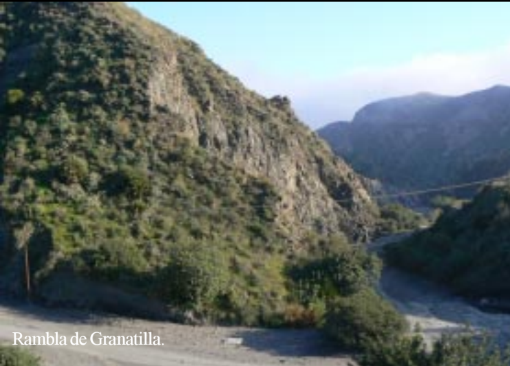
Rambla de Granatilla.