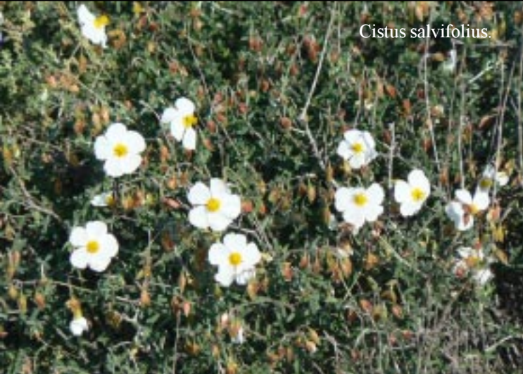
Cistus salvifolius .

We houden op splitsingen van paadjes enkele keren rechts aan en komen inderdaad, zoals de gids meldt, na 20' op een "meseta". Daar nemen we in eerste instantie de verkeerde voortzetting en komen op die "meseta" in een lange bocht naar links terecht. Daar zien we geen pad naar beneden en dus moeten we terug. Dan blijkt dat we bij de opgang van de "meseta" rechts een paadje op hadden moeten gaan. In de verte zien we al snel de Torre del Rayo opduiken en even later rechts een appartementencomplex aan de noorkant van Carboneras.