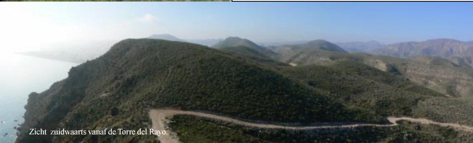
Zicht zuidwaarts vanaf de Torre del Rayo.