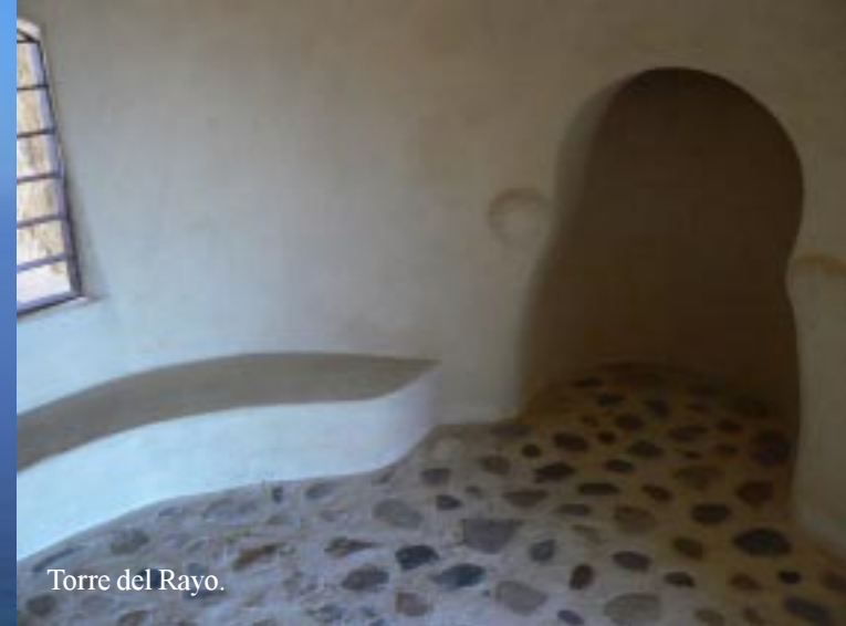
Torre del Rayo.

Ik klim de dikke ijzeren ladder op, die naar de hooggelegen deuropening gaat. In het kleine halletje boven is links nog een korte wenteltrap die naar het uitzichtsplateau voert. Daar heeft men een schitterend en weids zicht over de verre omgeving. Terug beneden pauzeren we tot 13.55. De rotsen hier zijn van daciet, een uitvloeiingsgesteente met zwarte kristallen erin.