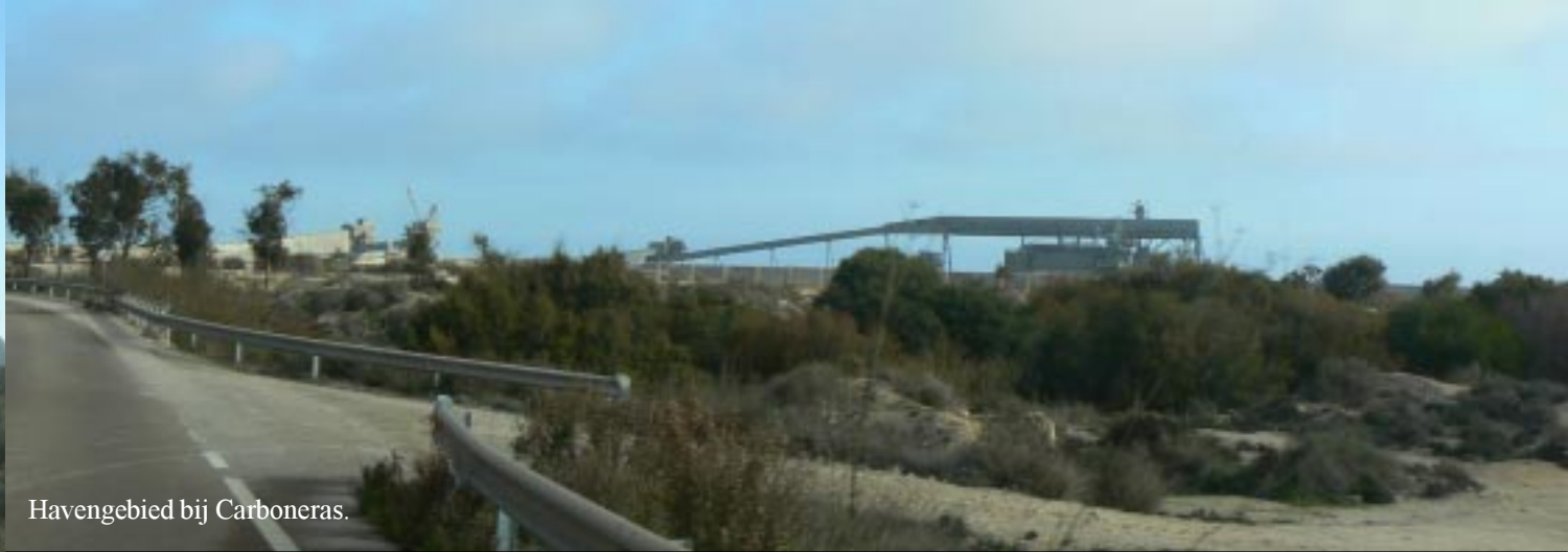
Havengebied bij Carboneras.