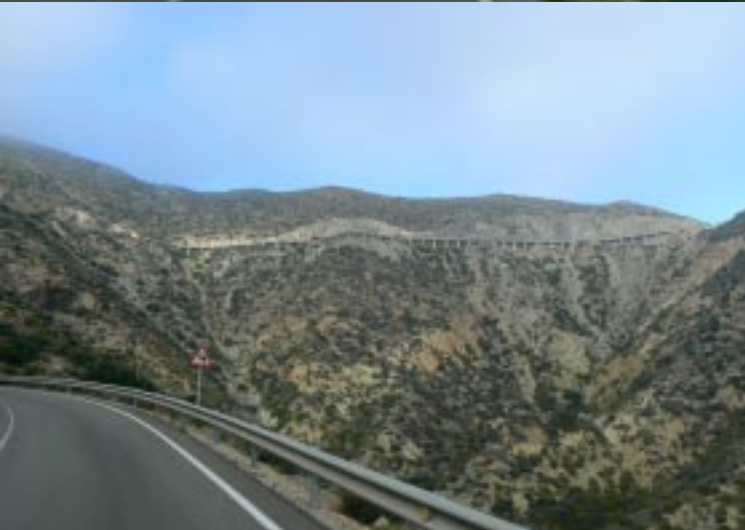
Cerro del Apparar.