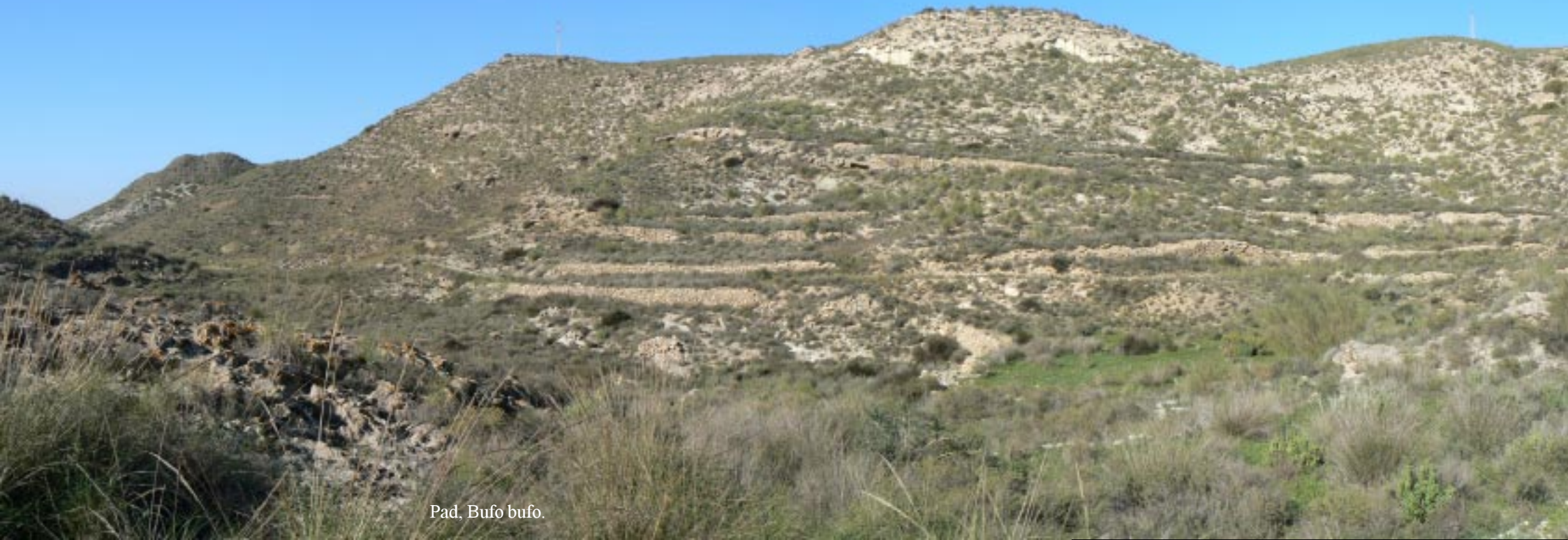
Pad. Bufo bufo.