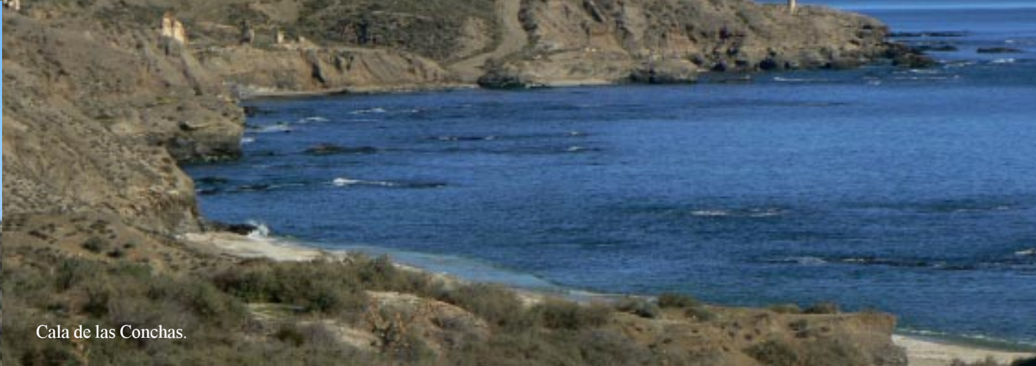
Cala de las Conchas.