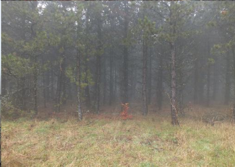
Borden vertellen ons, dat hier in de lente veel orchydeeen te vinden zijn. Twee dikke en heel markante bomen "vertellen" waar de afslag naar het dorp is.