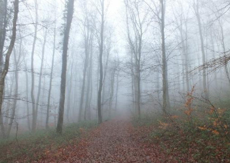
Dan dalen we langs kalkgraslanden (zoals bijvoorbeeld in Z-Limburg) af terug naar het dorp.