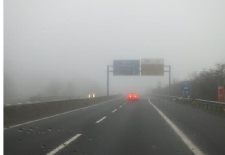
LM, MM: Jouy-de-Moselle

Om 10.40 stoppen we in Arry bij de kerk voor een wandeling (no 162) uit de "500 wandelingen in Frankrijk".