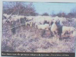
Site Moselle des pelouses calcaires de Lorry - La Côte de Lorry

Toutes ces actions ont été menées par le Conservatoire des Sites Lorrains avec le soutien de : Commune de Lorry - Mardigny - Conseil Général de la Moselle - Conseil Régional de Lorraine Ministère de l'Environnement - Ministère de la Jeunesse et des Sports