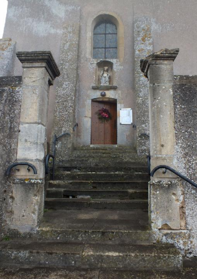
We starten met de heel sobere 13-14-eeuwse kerk St. Arnaud.