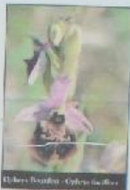
Hibers-Paradis - Ophrys sphegodes

La Côte de Lorry est une des plus vastes pelouses calcaires de Lorraine (73 ha) encore entretenue par pâturage ovin. La gestion de cet espace, propriété communale, a été confiée depuis 1994, au Conservatoire des Sites Lorrains par bail emphytéotique de 99 ans.