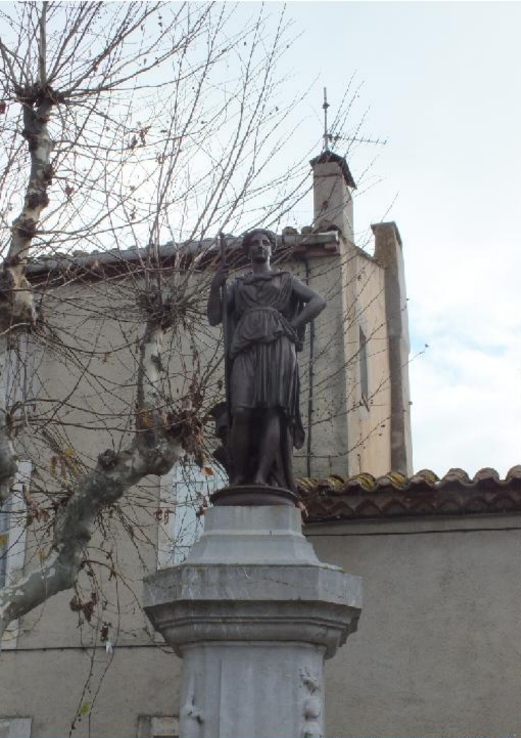
Deze pagina: Bages, en de Étang de Bages et Sigean.