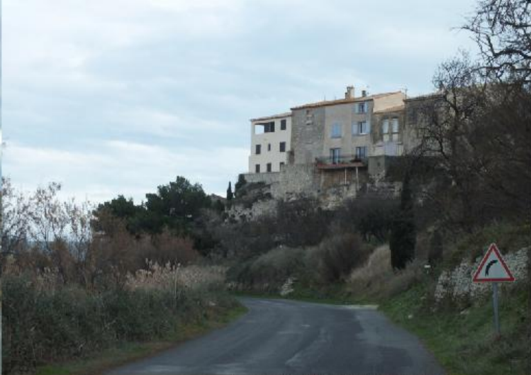
We bezoeken het dorp Bages, dat boven op een klif aan zee is gebouwd 11:55-12:20.