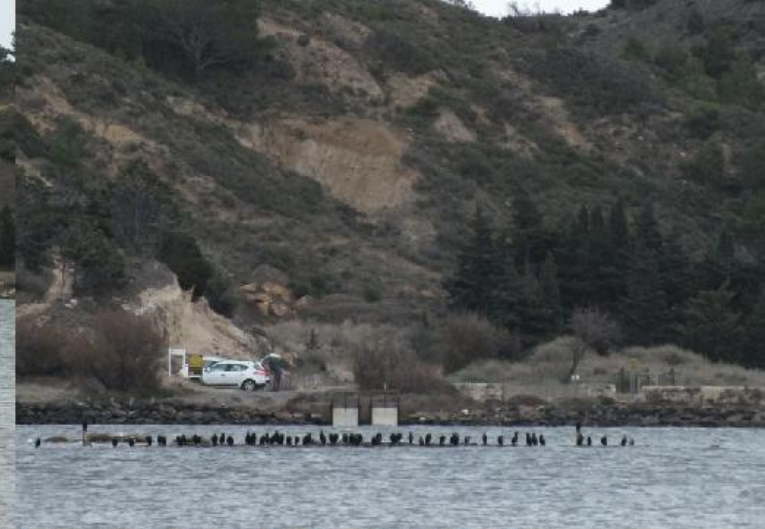
We pauzeren aan het water in Peyrac de Mer (tot 13:22). Bo, M, LBe: Peyrac-de-Mer MBe, RBe: Spreeuw, Stumus vulgaris