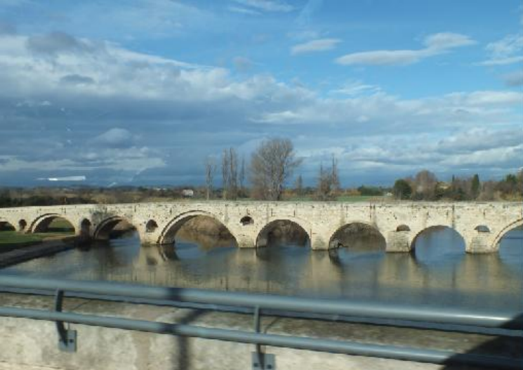
Dan komt het zeer uitgestrekte wijnbouwgebied. We rijden in de richting van Coursan.