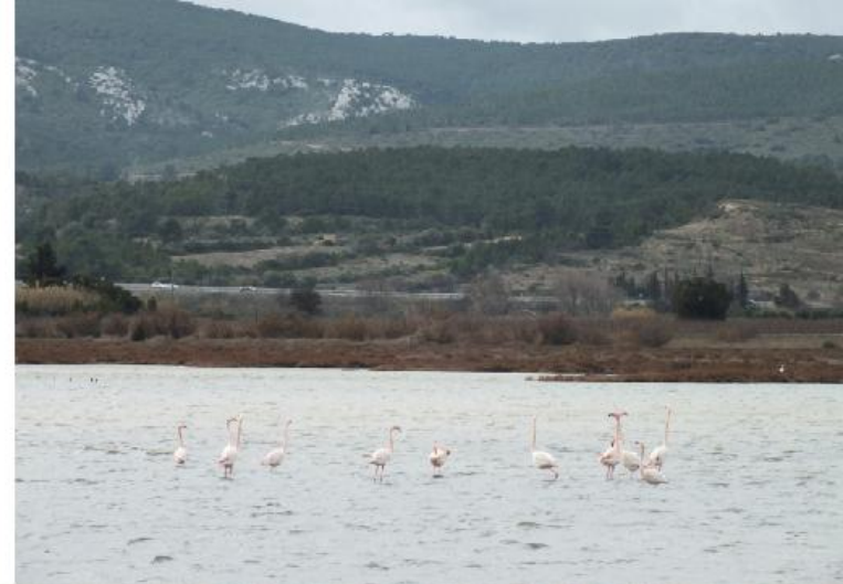
Deze pagina: Flamingo, Phoenicopterus roseus .