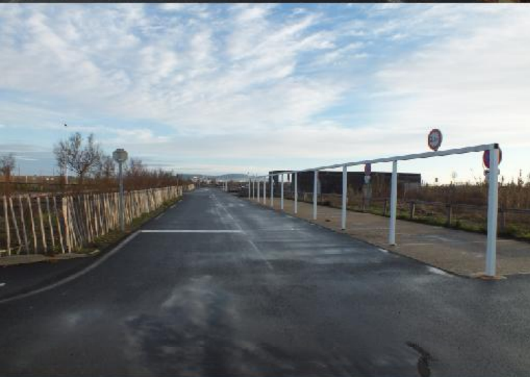
LBo, RBo, LM, MM, LBe: 3 Dignes, Sète.

16-01-02. Sète - Le Boulou. Uiteraard kijken we voor we opstappen, waar we eigenlijk zijn terecht gekomen gisteravond. We staan aan de Middellandse Zee net achter een lage duinenrij. Aanvankelijk is de lucht compleet helder en de temperatuur prima. Met 1166 km op de teller rijden we om 9:42 naar de LIDL voor boodschappen 10:00 - 10:41. Dan plannen we de route voor vandaag.