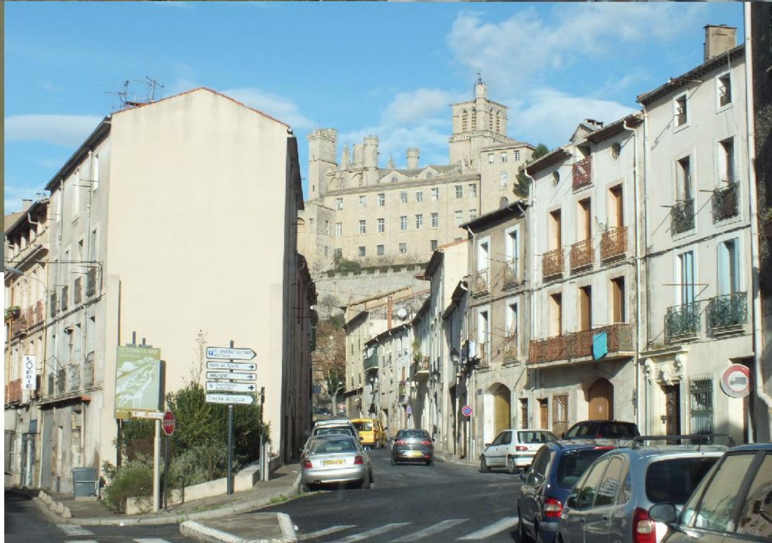
Via een wirwar van huisjes en bedrijven naar Béziers, 11:13. Dat heeft zo te zien een mooi centrum. Boven alles steekt de kathedraal uit.