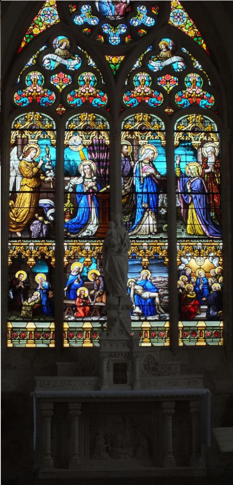
Deze pagina: Église Saint-Hilaire