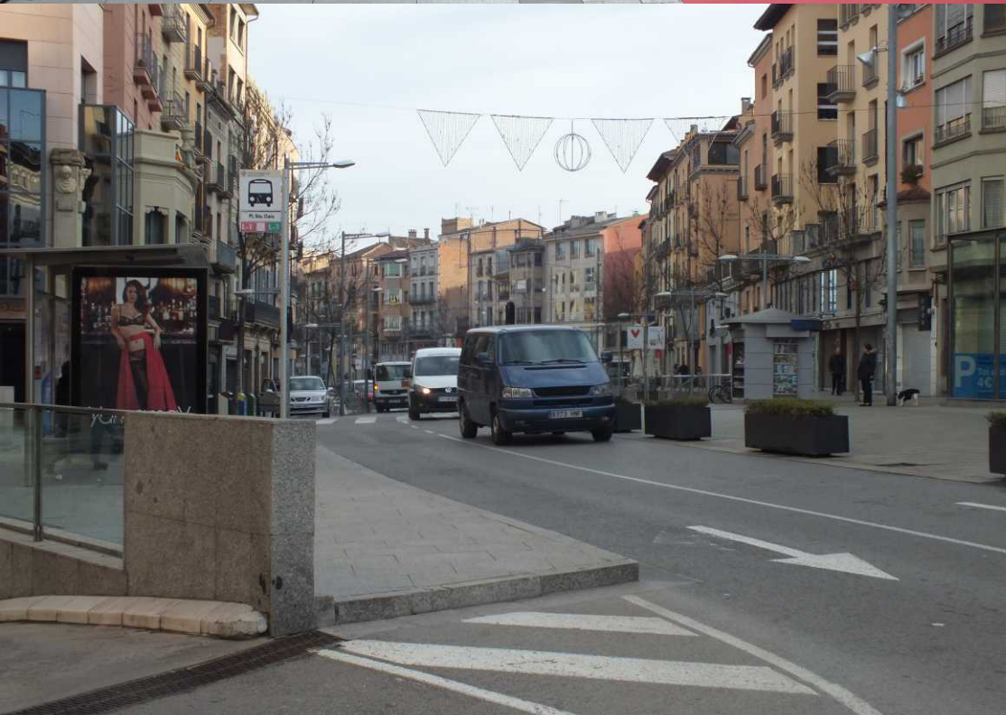
LBo: Calle Manlleu. Be: Carrer Jaume i el Conqueridor.