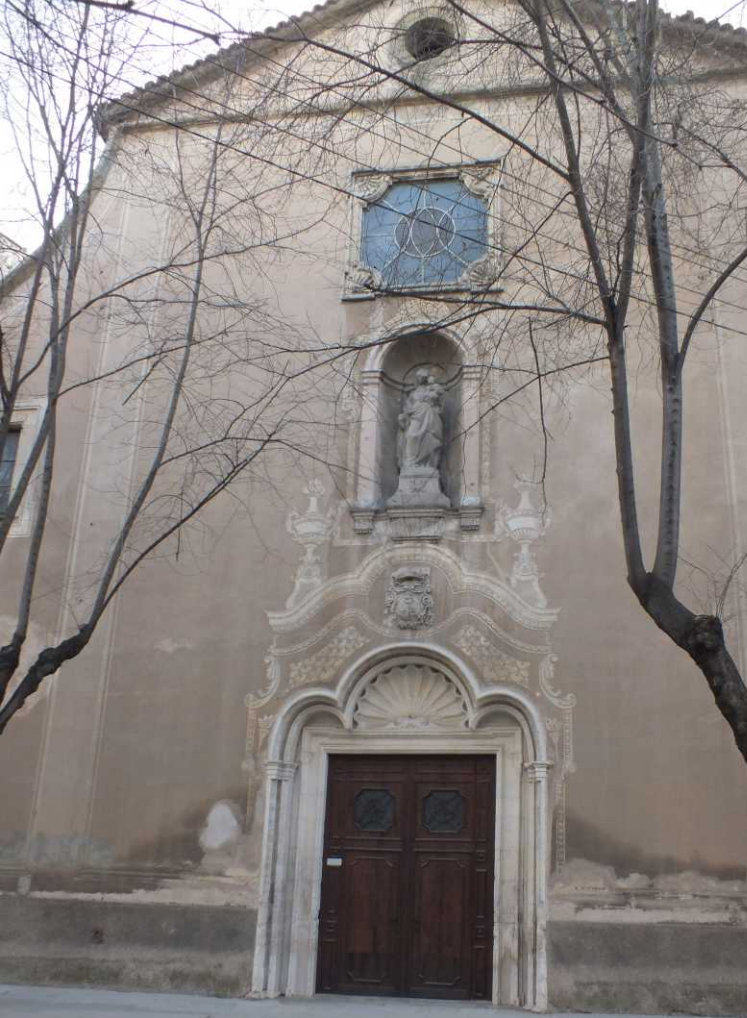
We kijken wat langer bij de kathedraal binnen.