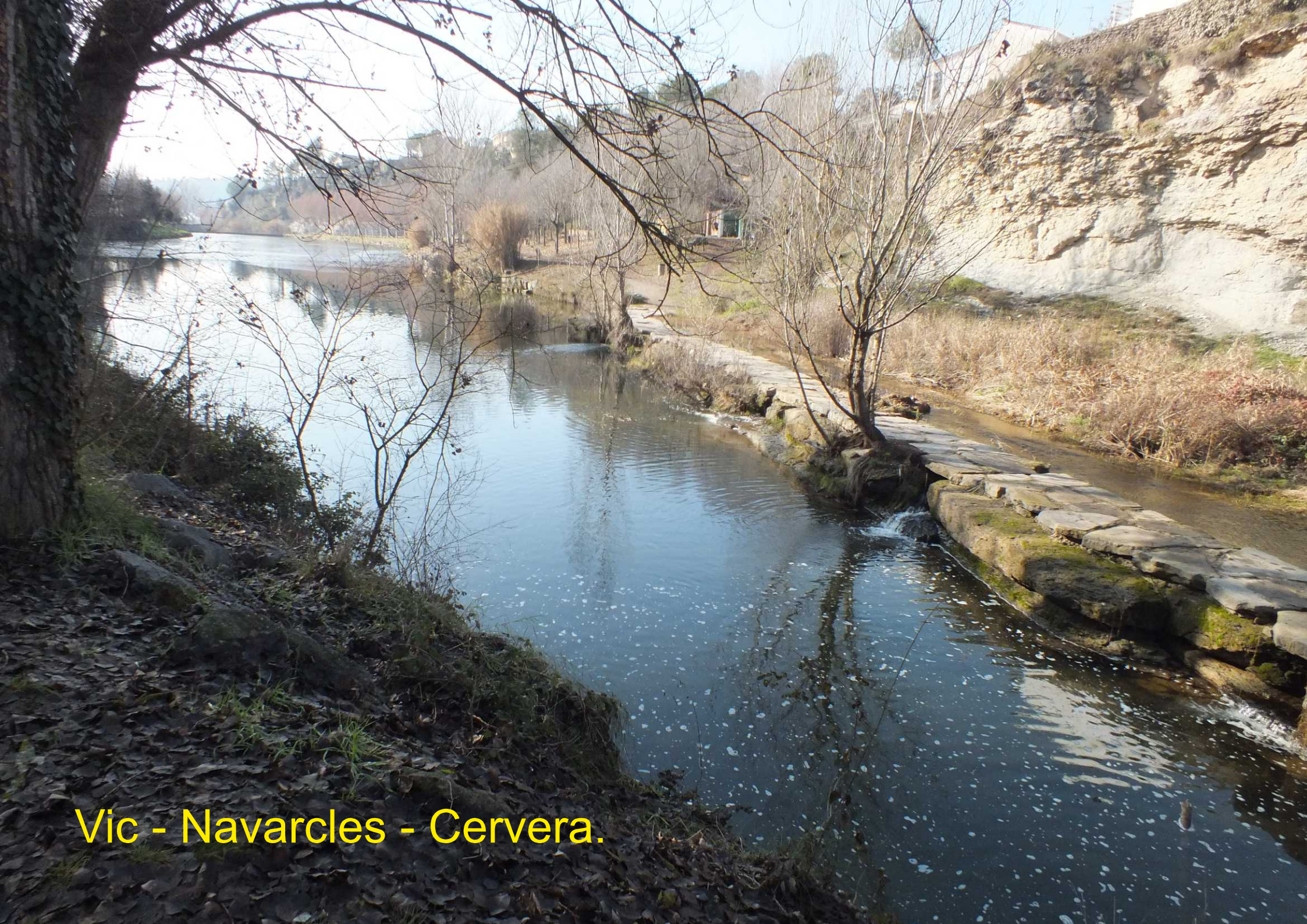
Vic - Navarcles - Cervera.