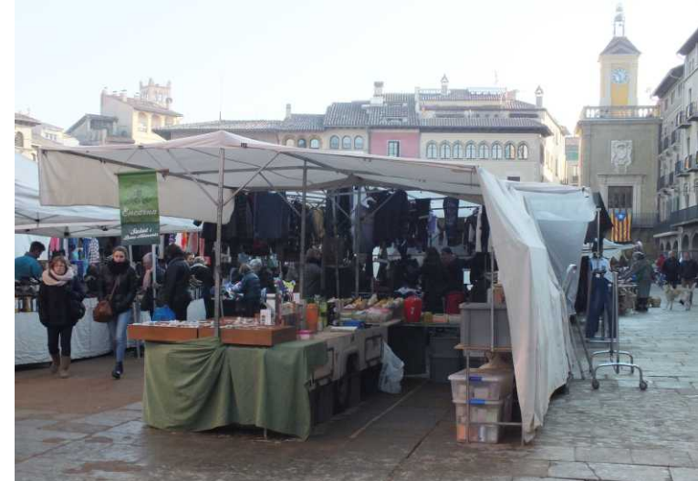
LBo: Camperplaats in Vic. RBo: M, Be: Markt in Vic op Plaza Major.

17-01-03. Vic - Navarcles - Cervera. 's Morgens bezoeken we eerst de markt op Plaza Major. Een minder interessante markt als we hadden verwacht.