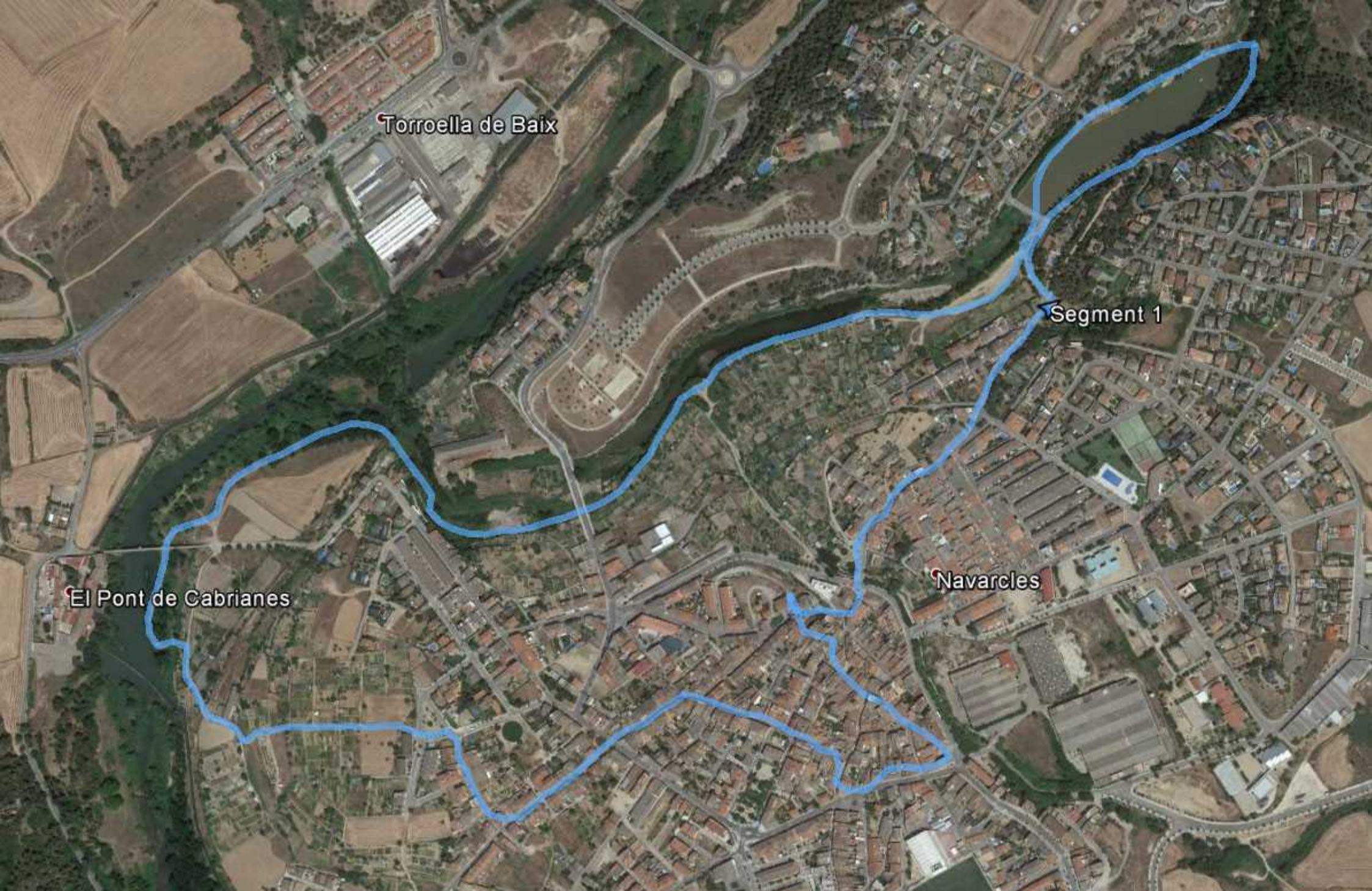
Wandeling bij Navarcles, 4,8 km.