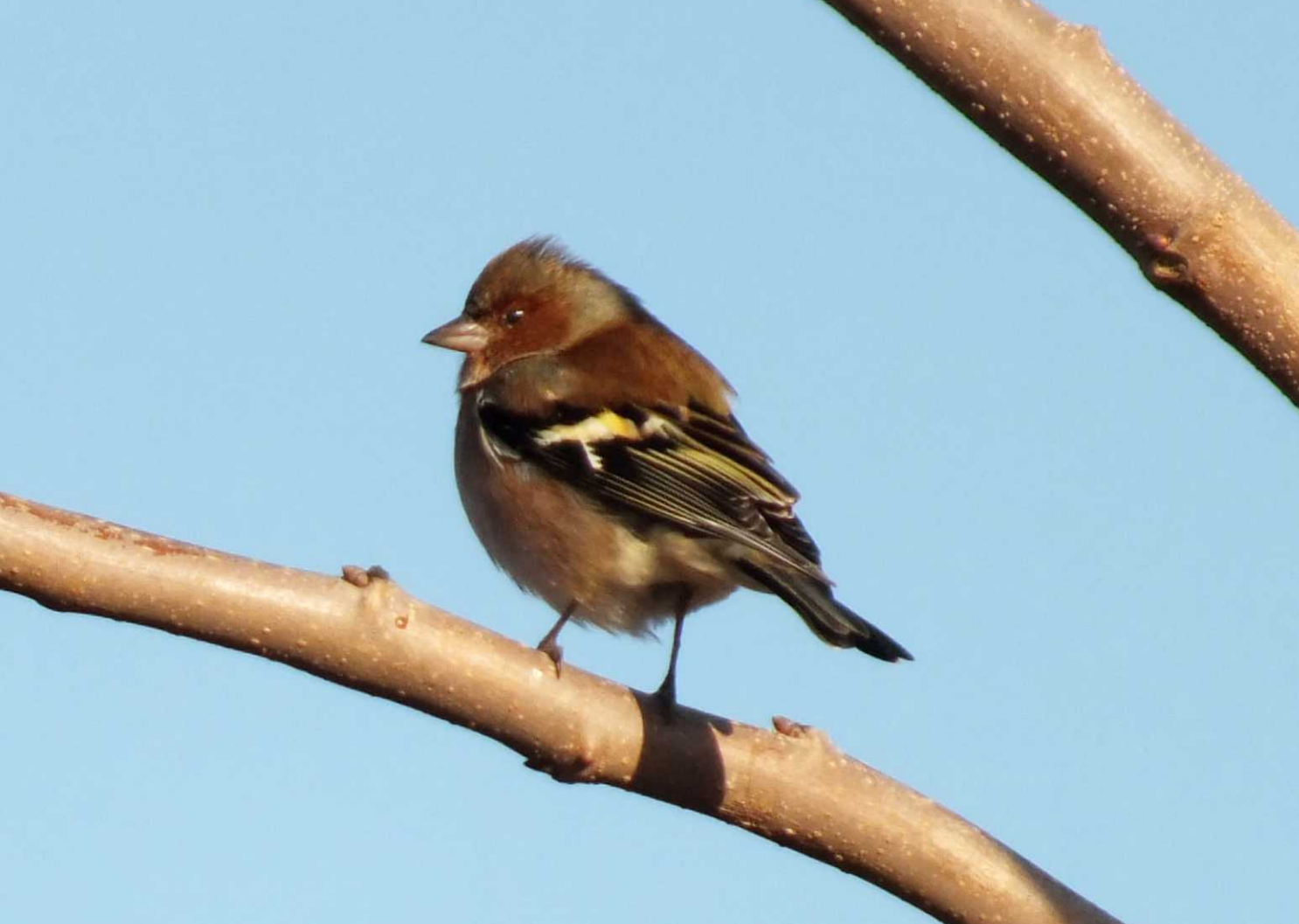
LBo, RM: Vink, Fringilla coelebs . LBe, MBe: Huisvuur, Passer domesticus . RBe: Turkse tortoel, Streptopelia decaocto .