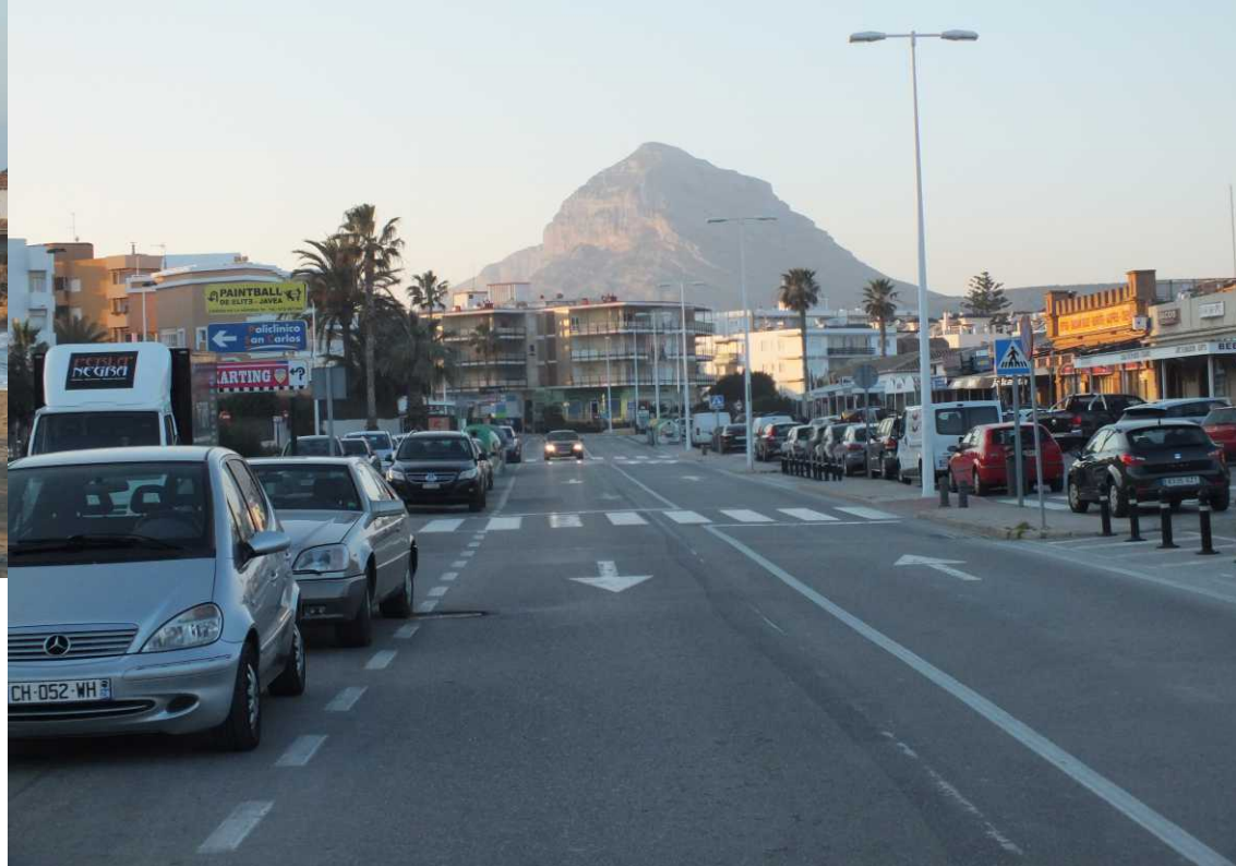
Tegen acht uur lopen we de boulevard weer op en zoeken Pizzeria Lungo Mare op. We krijgen er uitstekende pizza's voorgeschoteld. Het deeg is vrij dun, bijna als het Duitse Flammkuchen, en heel lekker.